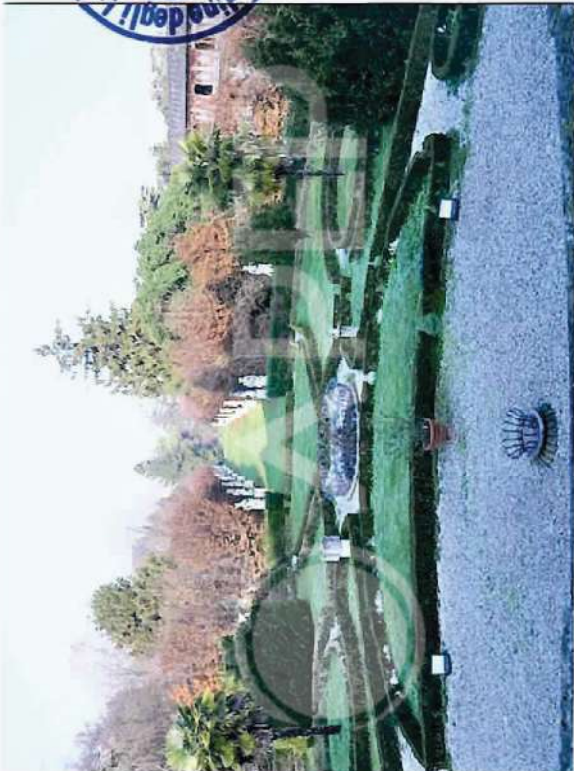
9 – Vista da SudEst Giardino Villa