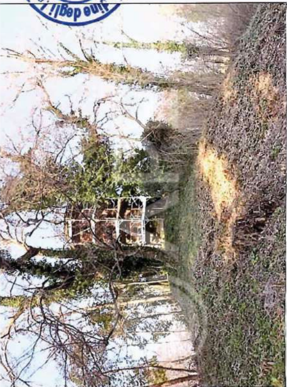
13 – Ex Torre frigo ad Ovest Parco Villa