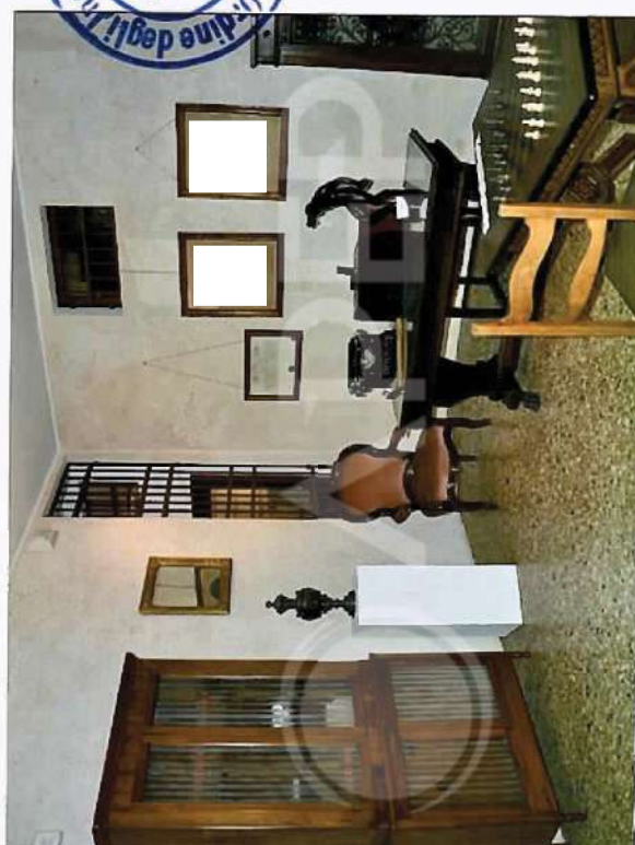
7 – Particolare di Interni Villa: Sala Espositiva NordOvest