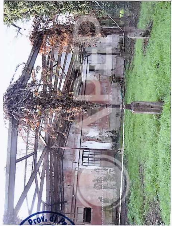
20 – Vista da Nord Edificio Serra