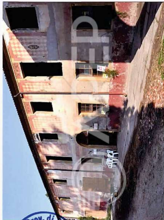
24 – Porzione di Prospetto SudOvest Scuderie lato Pista