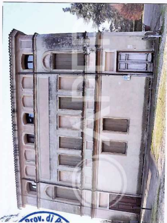
2 – Prospetto NordEst Villa V.S. Breda