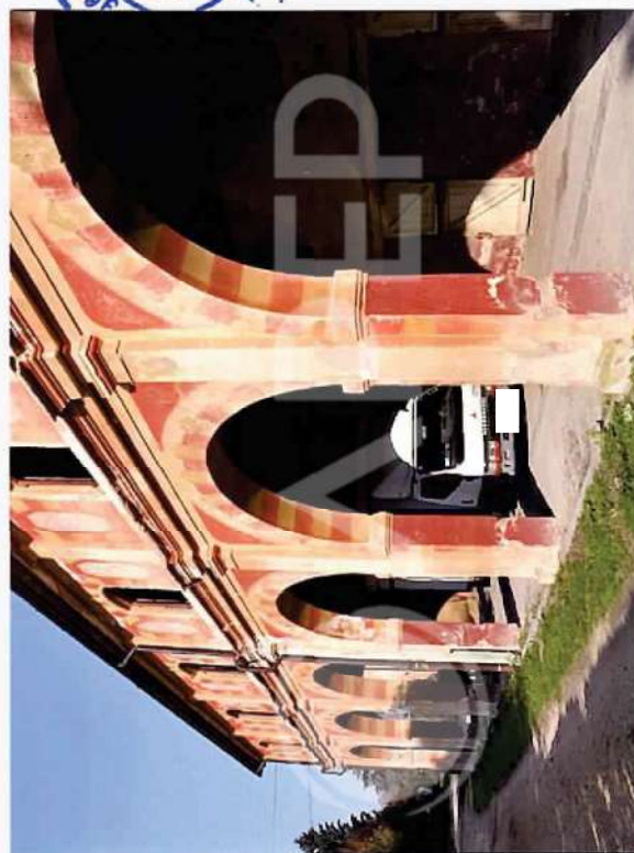
23 – Porzione di Prospetto SudOvest Scuderie lato Giardino