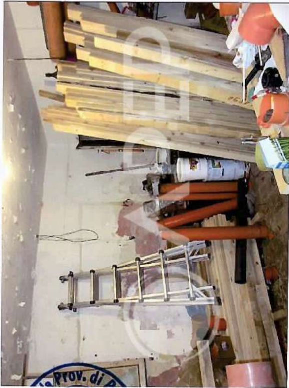
38 – Particolare di Interni Edificio residenziale 1: Stanza P.T.