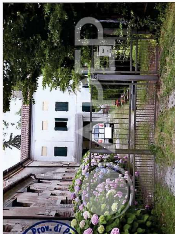
32 – Prospetto Abitazione su angolo retro Scuderie