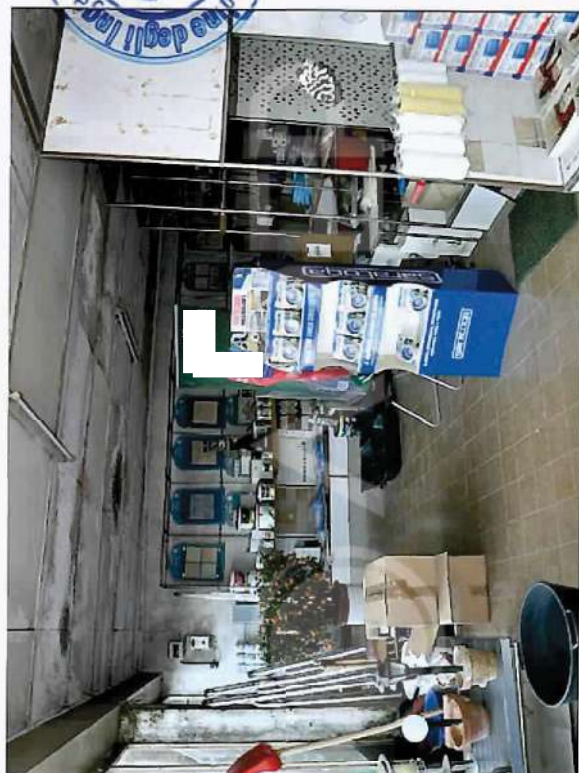
43 – Particolare di Interni Deposito commerciale: Esposizione