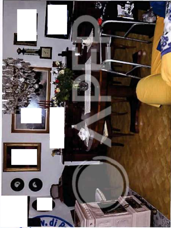
34 – Particolare di Interni Abitazione retro Scuderie: Sala P.T.