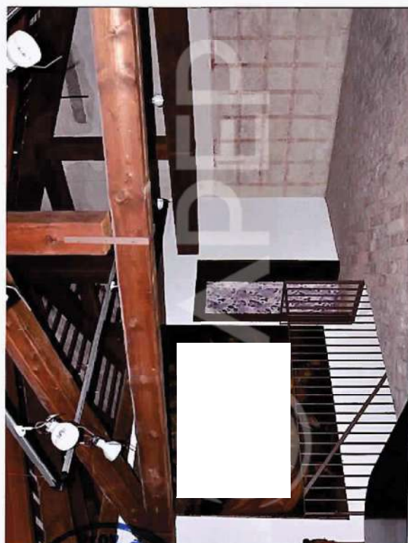
8 – Particolare di Interni Villa: Sala Espositiva Nord P.2°