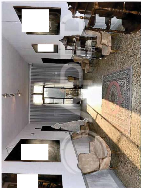
6 – Particolare di Interni Villa: Atrio P.1°