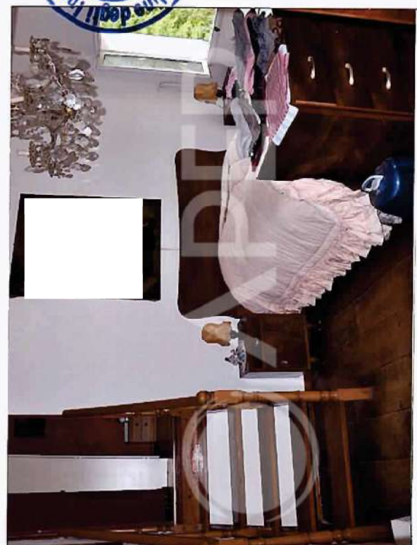
35 – Particolare di Interni Abitazione retro Scuderie: Stanza P.1°