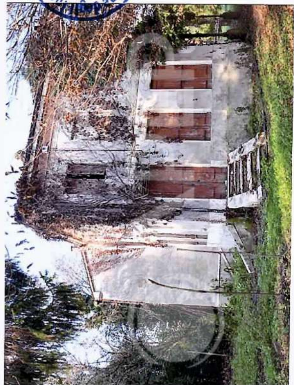
19 – Vista da SudEst Edificio Serra