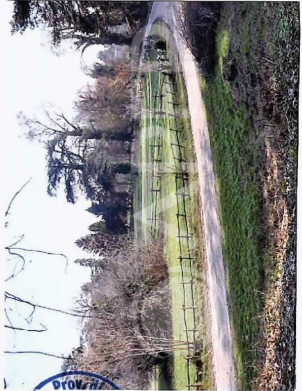
12 – Porzione Parco Ovest Villa con pista cavalli