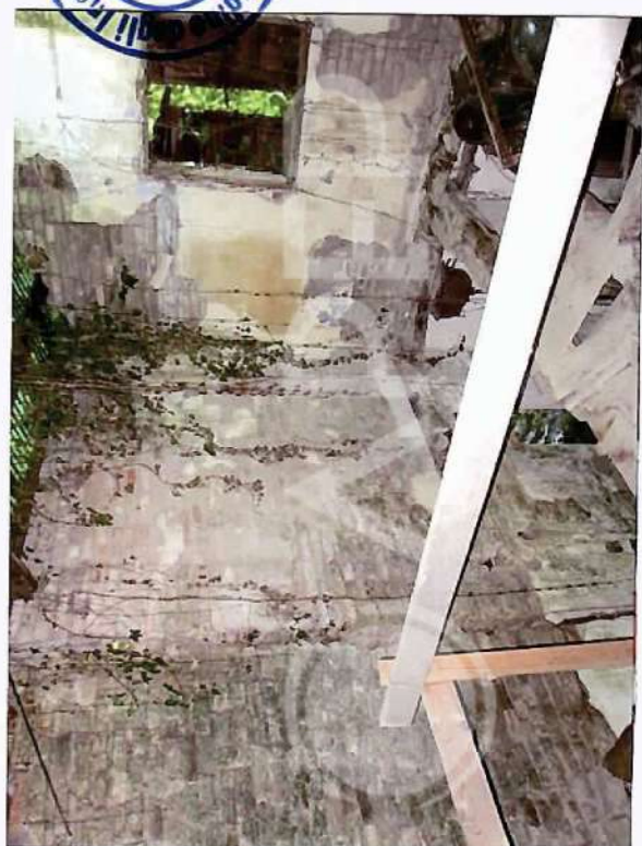
39 – Partic. di Solaio crollato su parte di Edificio residenz. 1