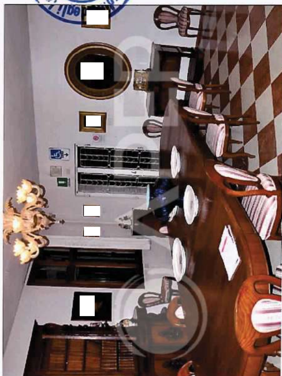
5 – Particolare di Interni Villa: Sala Consultazione Doc. P.T.