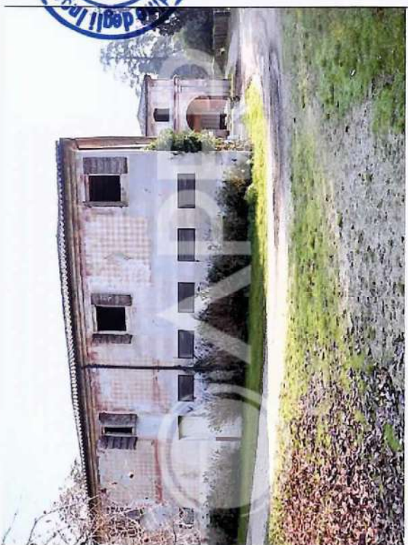
25 – Porzione di Prospetto NordOvest Scuderie lato pista