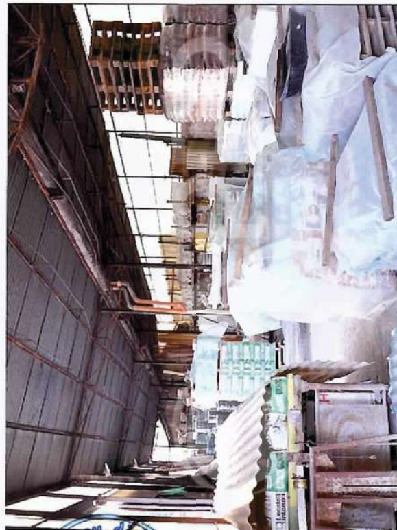
44 – Particolare interni Deposito commerciale: Magazzino