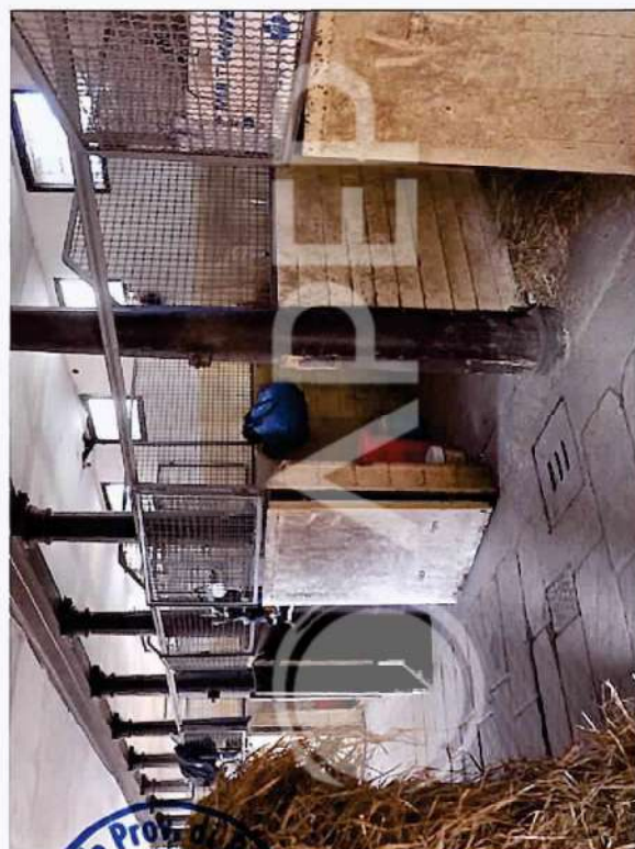
28 – Particolare interni Scuderie SudOvest lato pista