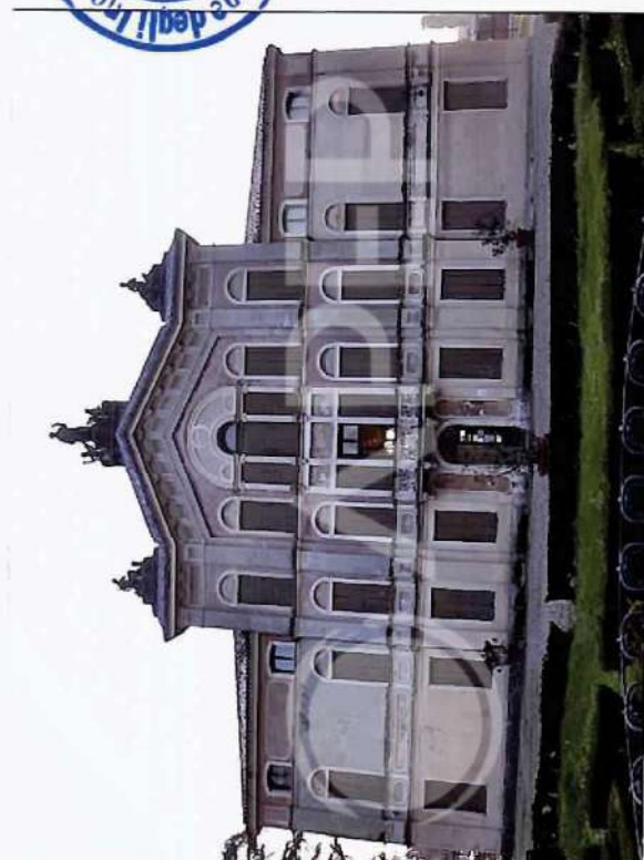
3 – Prospetto NordOvest Villa V.S. Breda