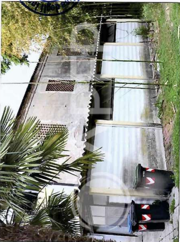
33 – Garage di Abitazione su retro Scuderie