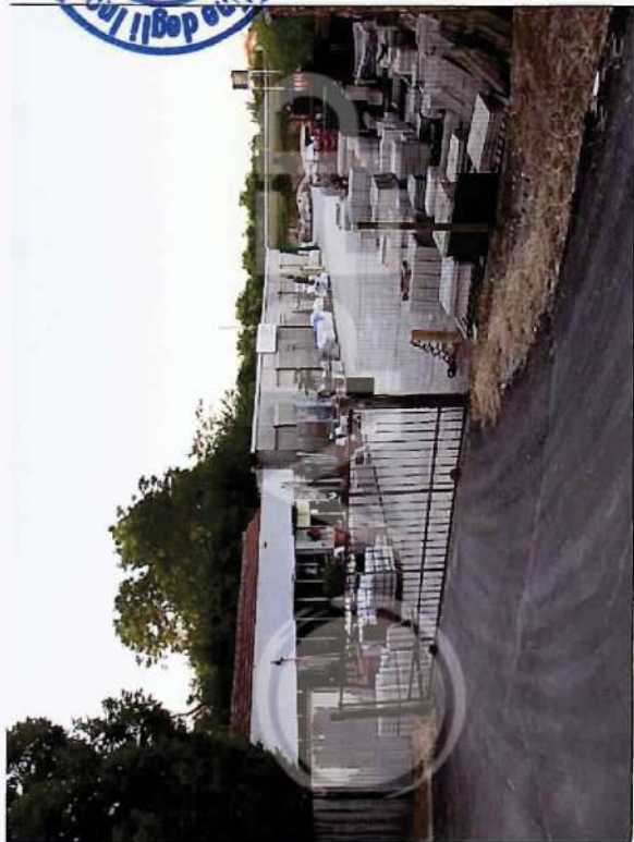
41 – Vista da Sud area Deposito commerciale