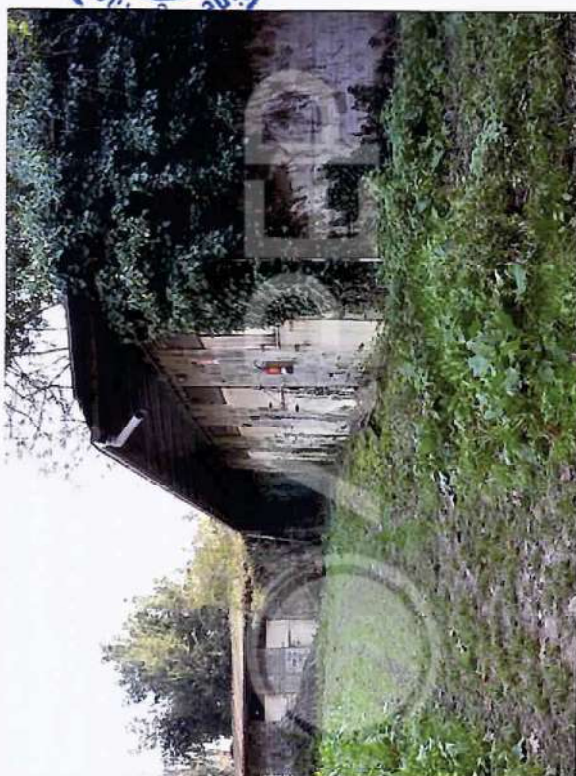
31 – Vista da NordOvest Box Cavalli 2