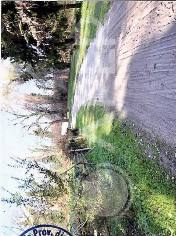
14 – Porz. Parco N.E. con pista cavalli e Fabbr. Partic.NCT 153