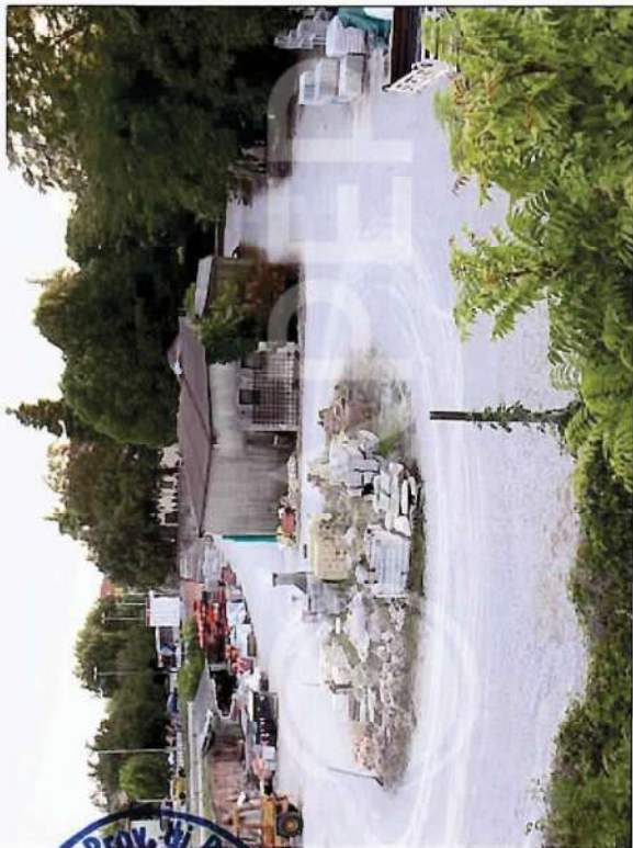
42 – Vista da NordEst area Deposito commerciale