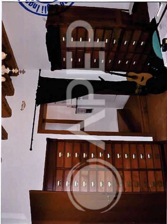
17 – Particolare di interni: Ingresso P.T. Torre