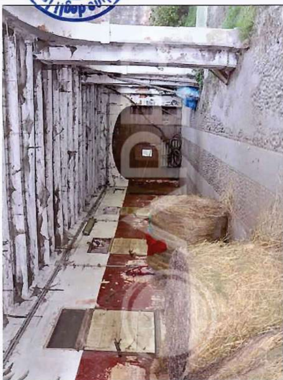
27 – Particolare di Sottoportico NordOvest Scuderie