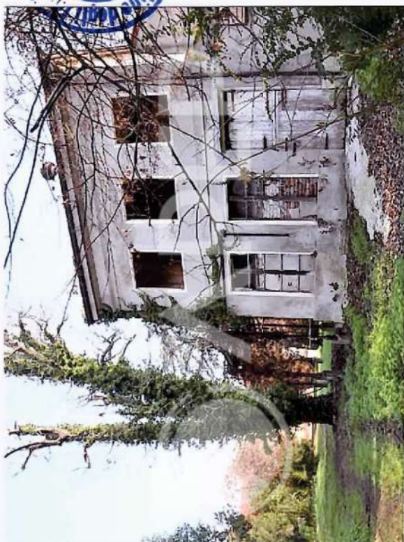
21 – Vista da Ovest Edificio Serra