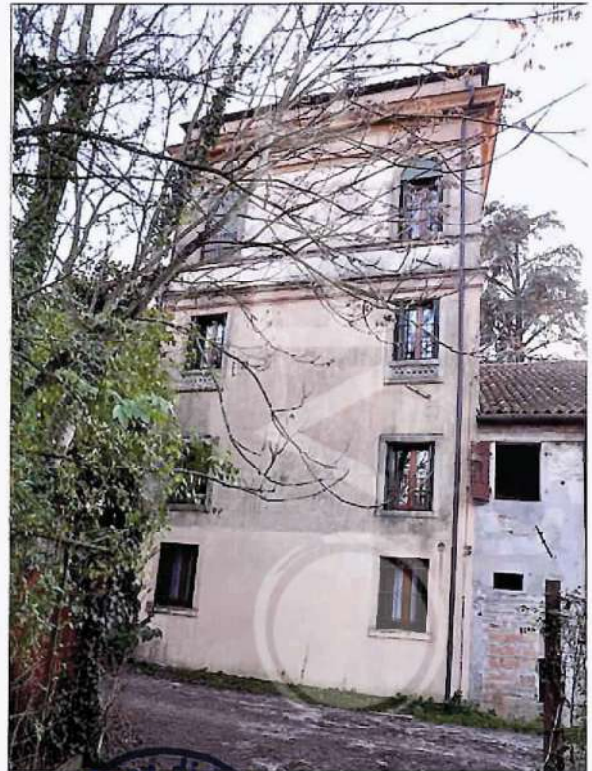
16 – Prospetto NordEst Torre