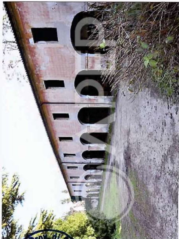
26 – Porzione di Prospetto NordOvest Scuderie lato pista/Box