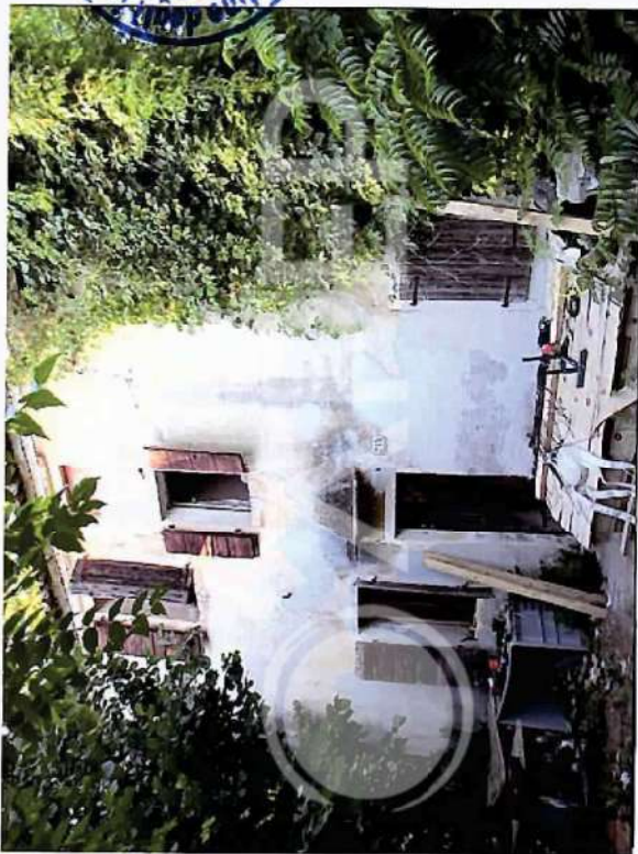
37 – Porzione do Prospetto SudOvest Edificio residenziale 1