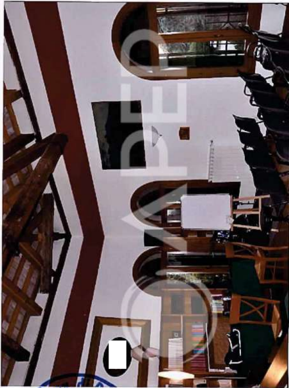
18 – Particolare di interni: Stanza P.3° Torre