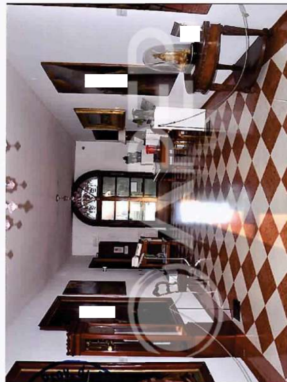
4 – Particolare di Interni: Atrio P.T.

Ordine degli Ingegneri della Prov. di Padova L. VINANTE N. 2598