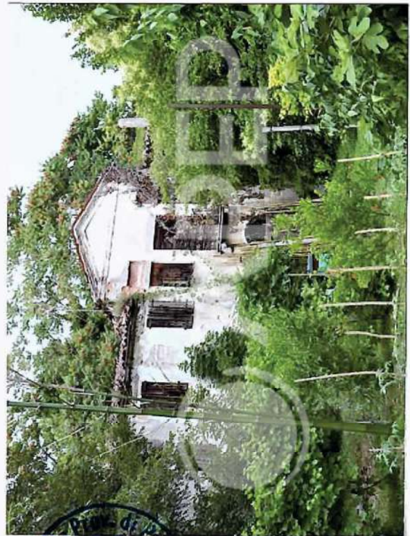
36 – Porzione do Prospetto SudOvest Edificio residenziale I