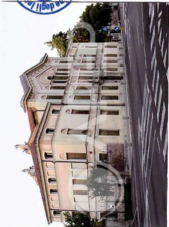
1 – Vista da Sud Villa V.S. Breda