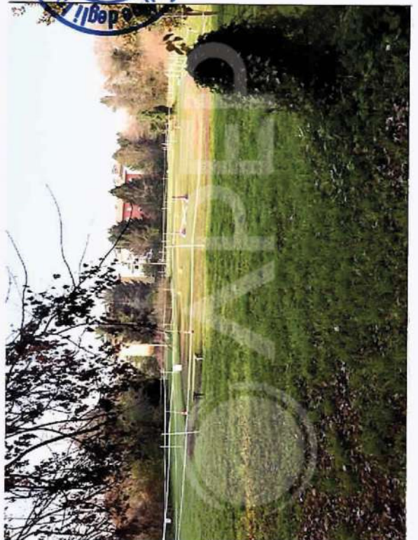
11 – Parco SudOvest Villa (Partic. NCT 264)