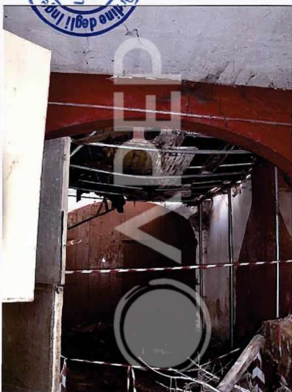
29 – Particolare di Solaio crollato Scuderie NordOvest