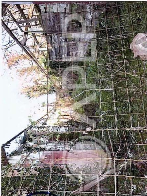
30 – Vista da SudOvest Box Cavalli I