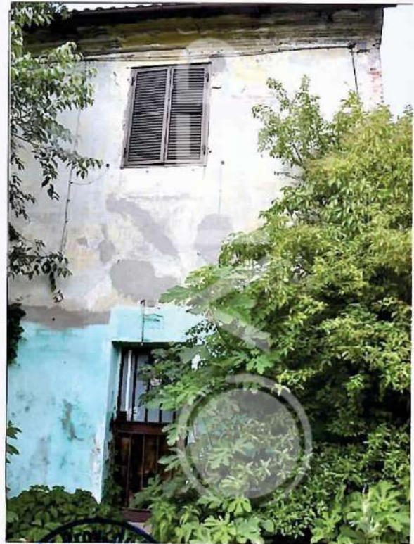
40 – Porzione do Prospetto SudOvest Edificio residenziale 2