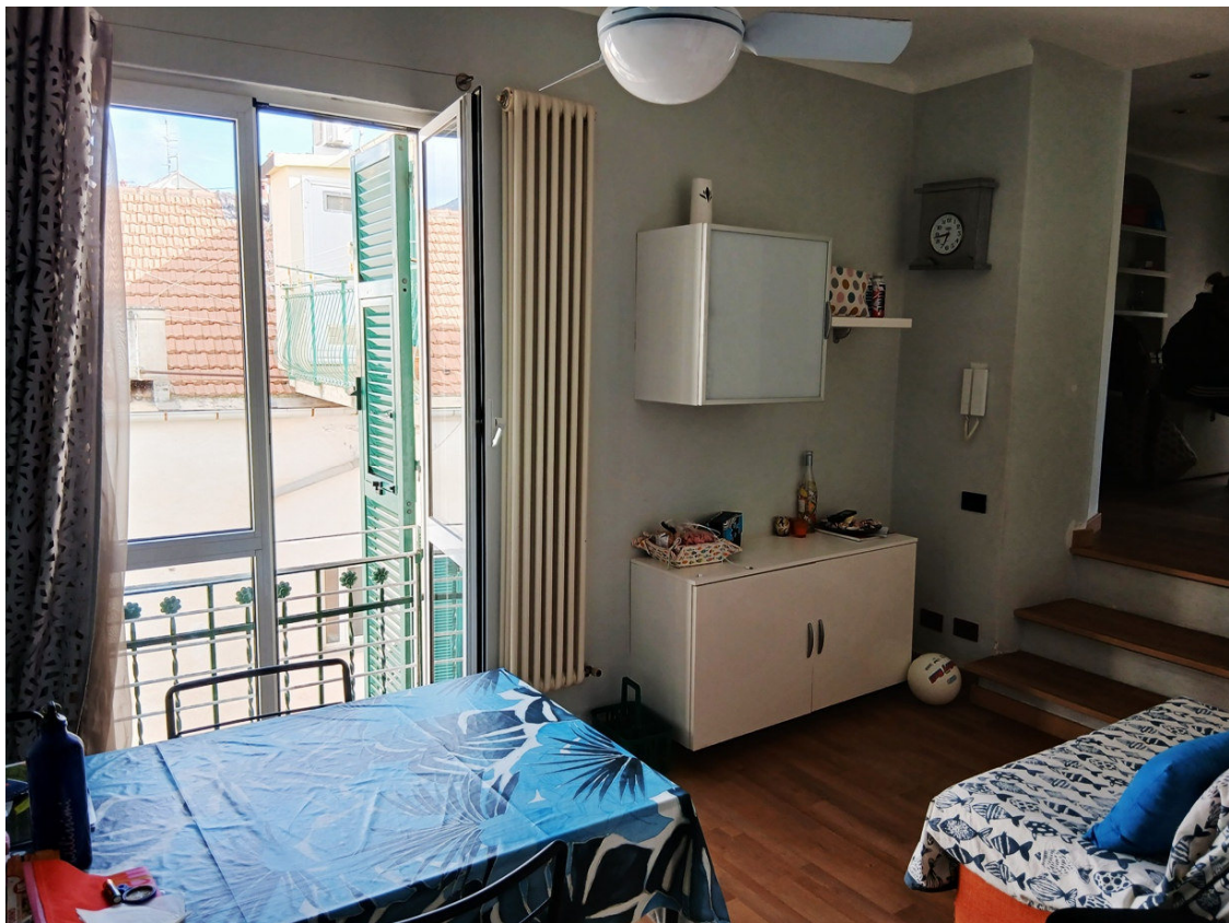
Particolari interni dell'u.i. oggetto di procedura