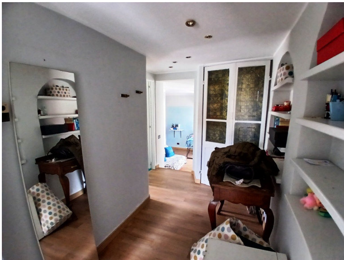
Particolari interni dell'u.i. oggetto di procedura