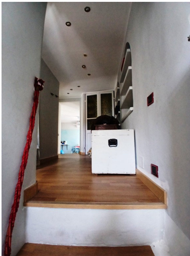
L'ingresso e la scala di accesso dell'u.i. oggetto di procedura