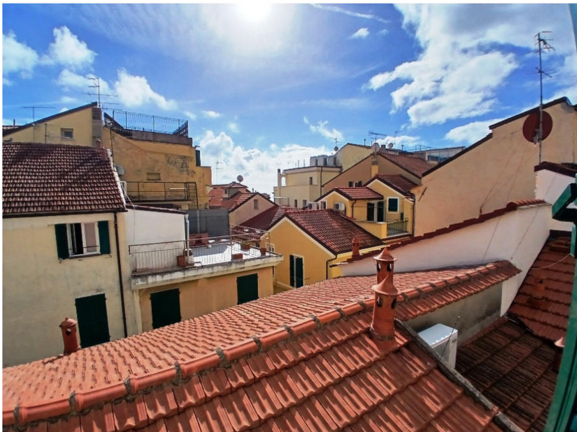
Il fabbricato mapp.315 su Via Vittorio Veneto e l'affaccio dell.u.i. oggetto di procedura sul prospetto sud-ovest