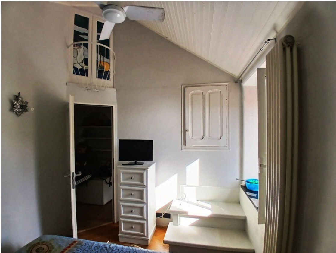
Particolari interni dell'u.i. oggetto di procedura