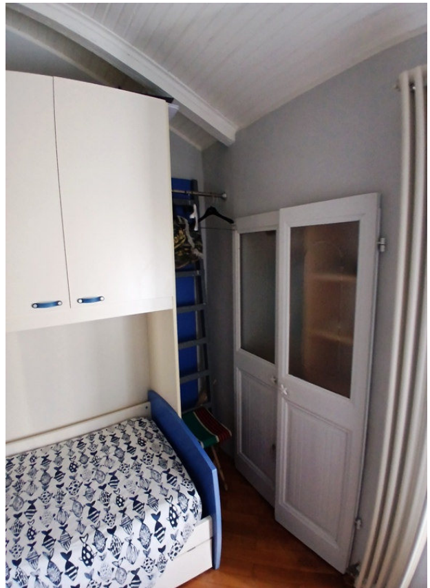
Particolari interni dell'u.i. oggetto di procedura