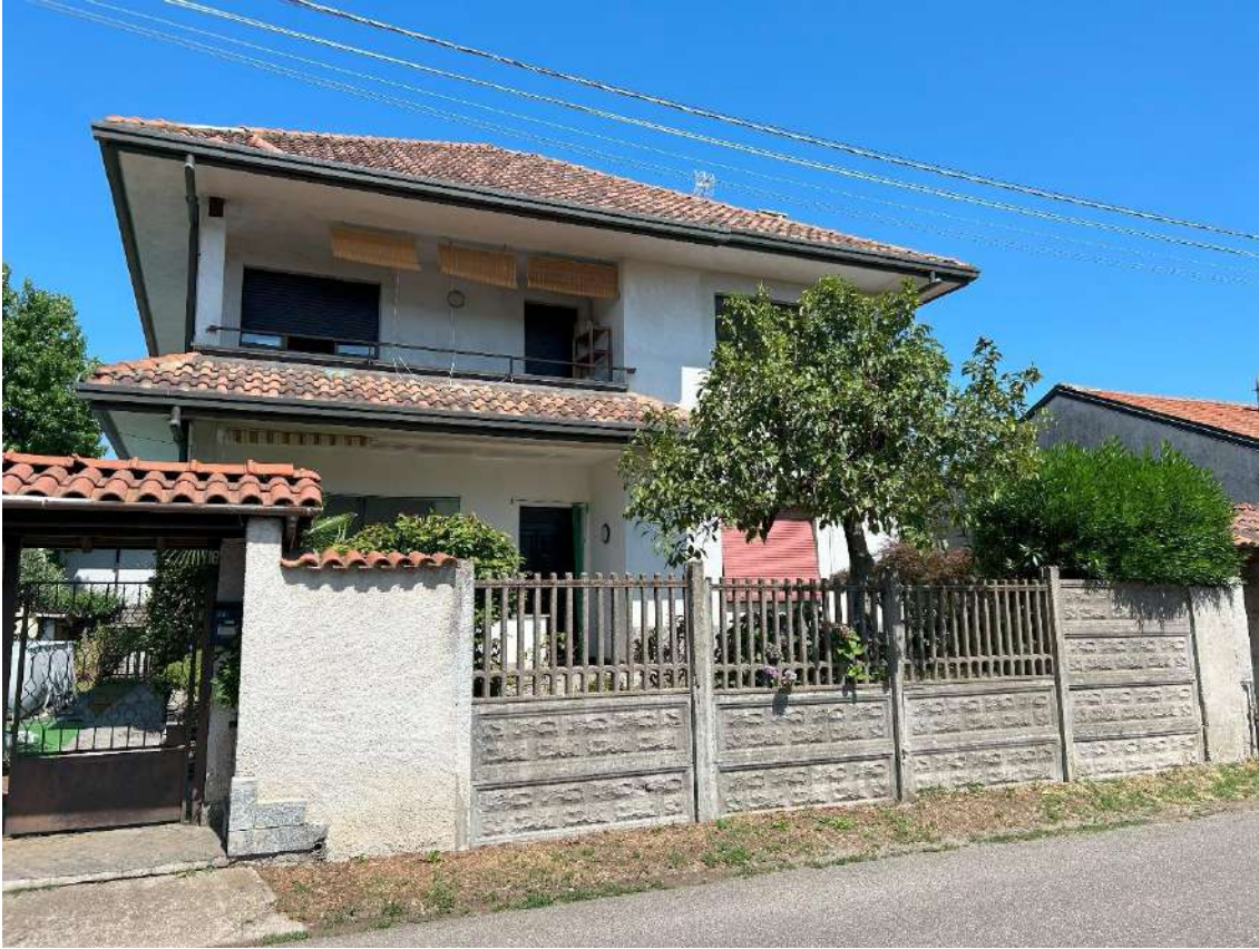
01 – Esterno fabbricato su Via Goito