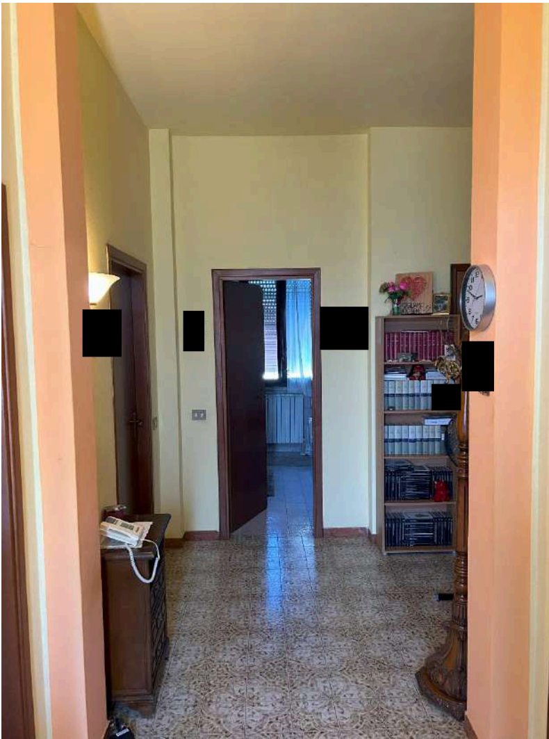
03 – Disimpegno ingresso