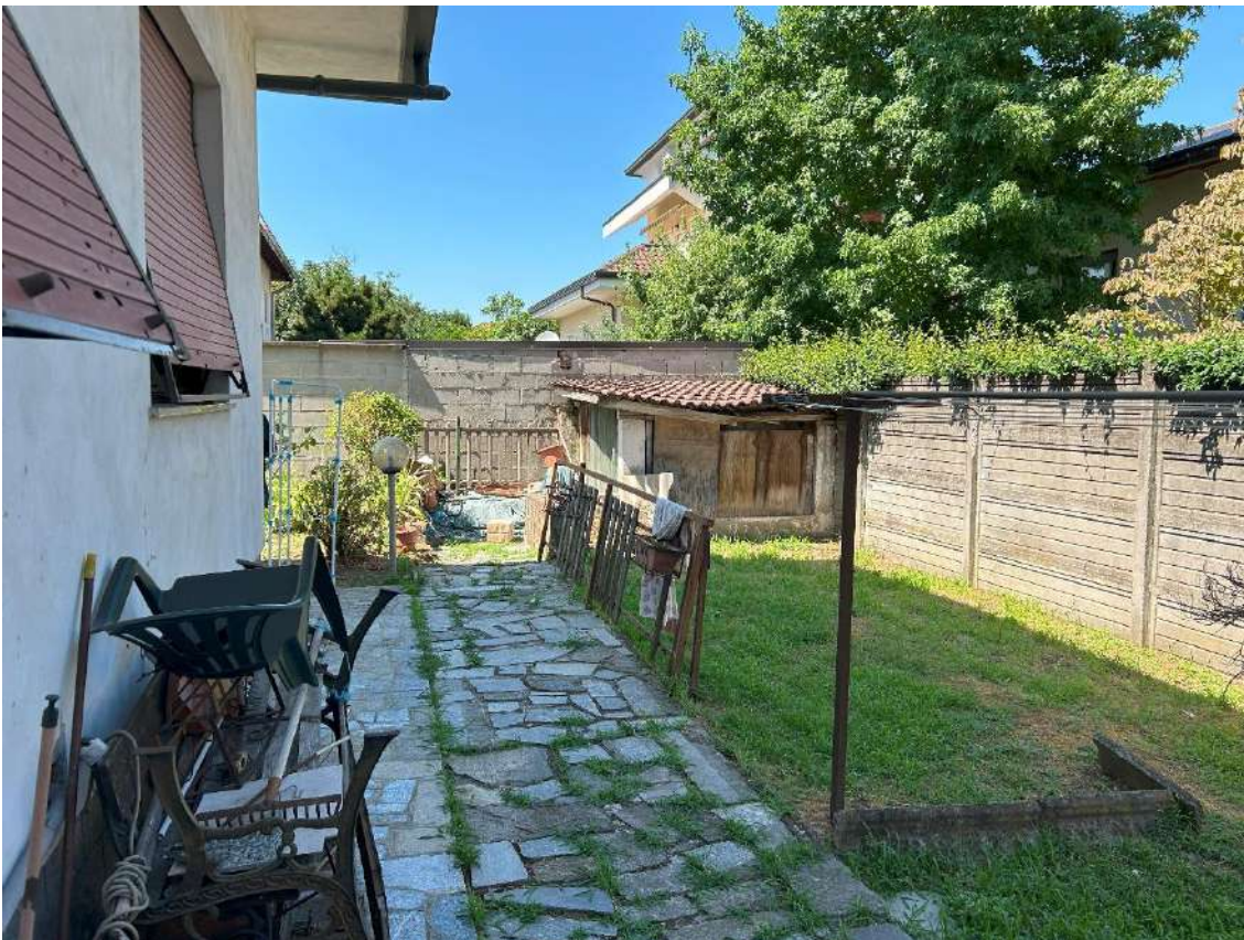
11 – Secondo fabbricato accessorio retrostante