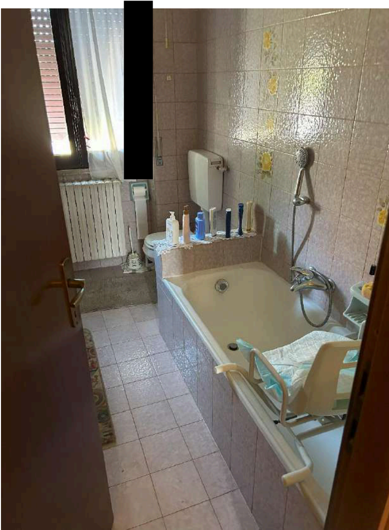
05 – Bagno