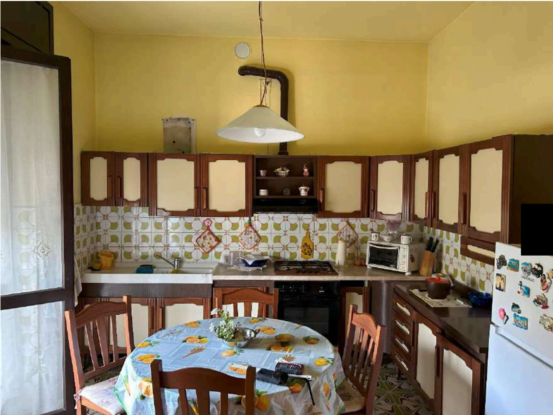
02 – Cucina