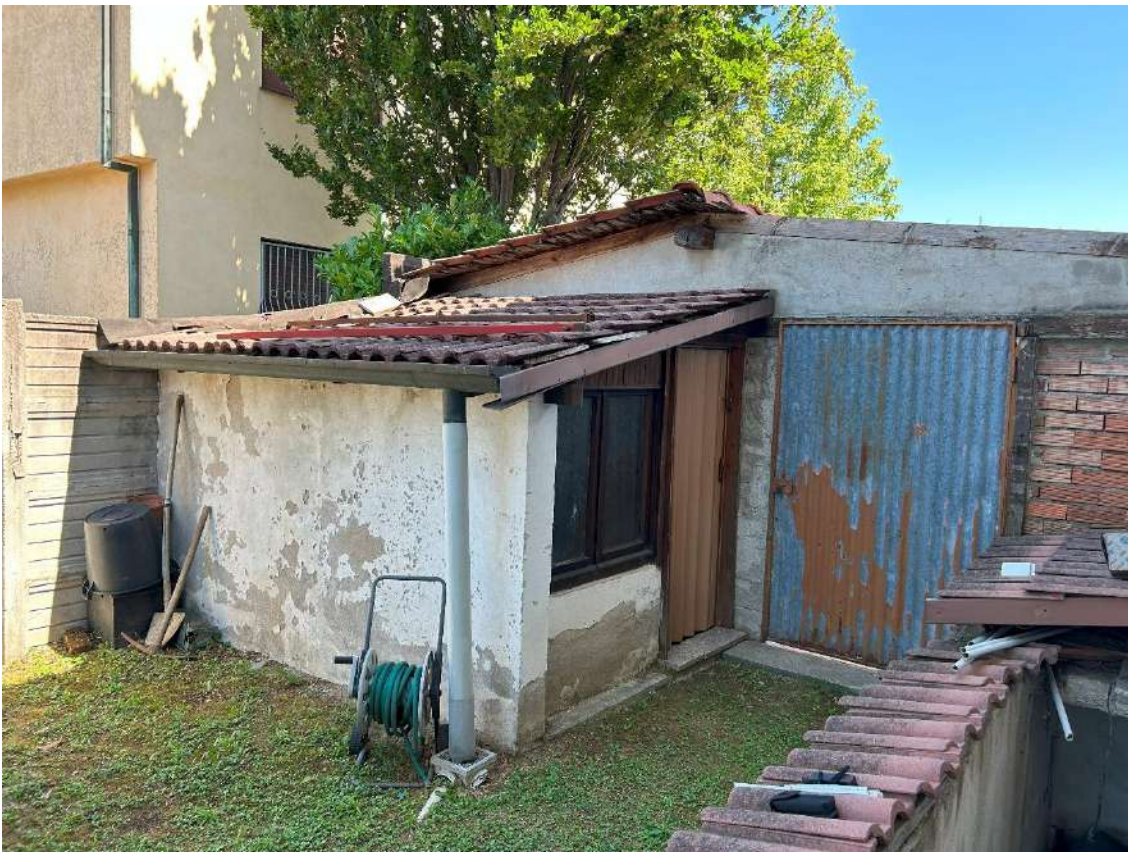
09 – Primo corpo accessorio retrostante