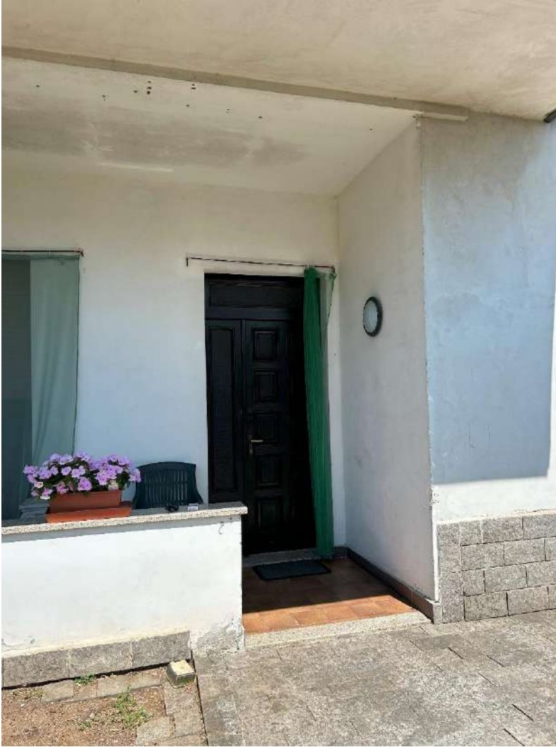
12 – Portico esterno zona ingresso