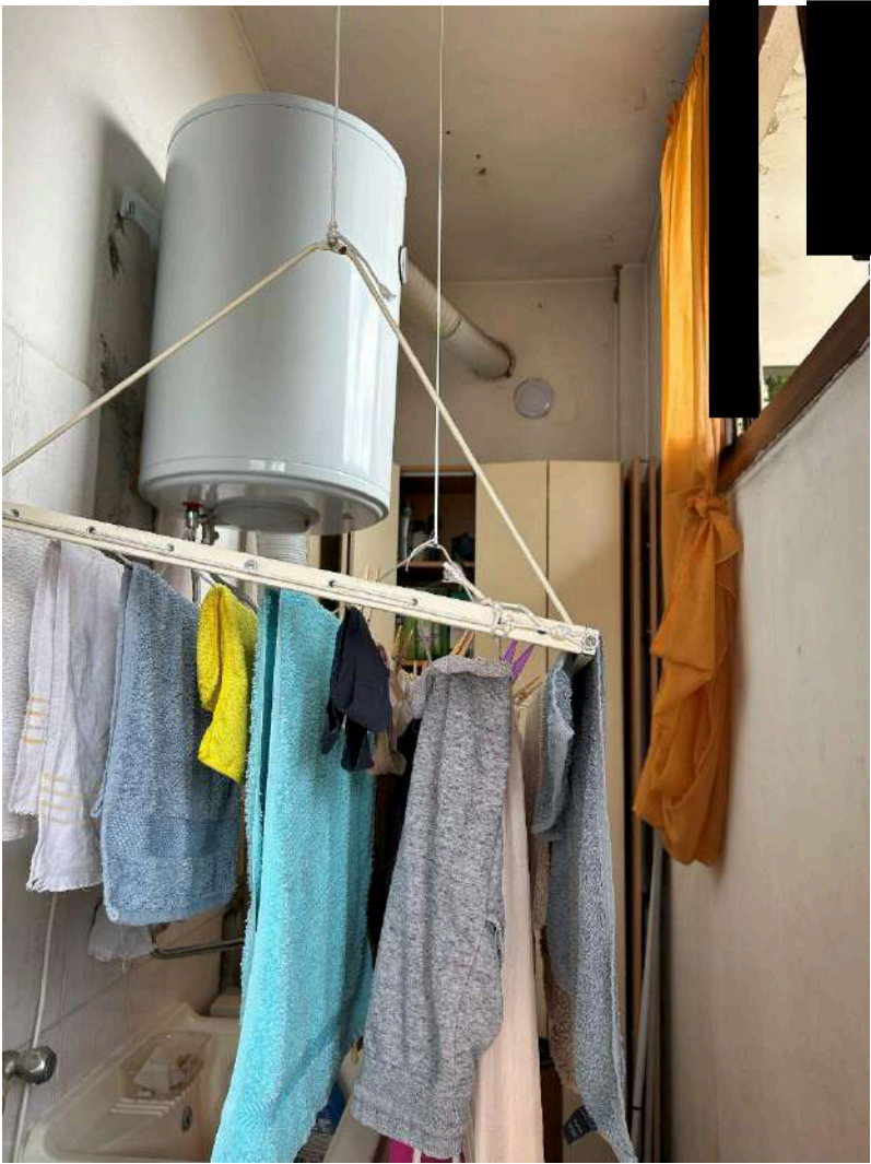
13 – Locale lavanderia esterno