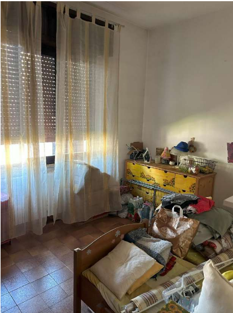
06 – Camera singola