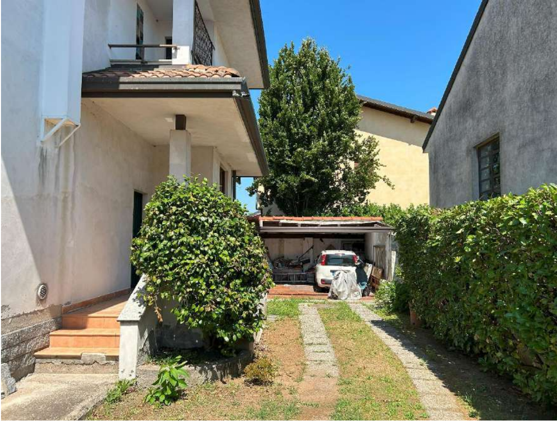
08 – Vista dall'ingresso carraio