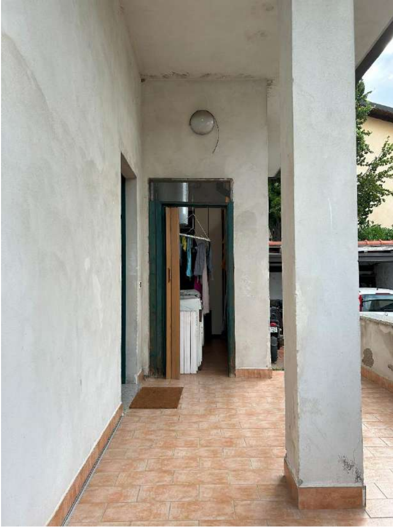
14 – Locale lavanderia esterno