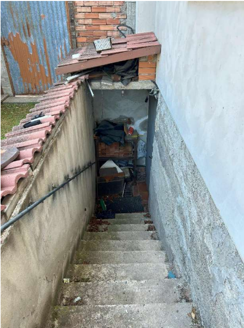
10 – scala che conduce alle zone cantine