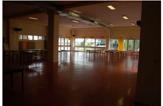
foto n° 81