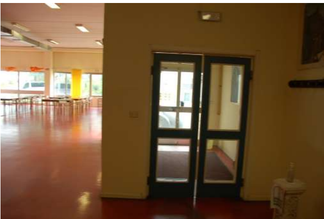
foto n° 82