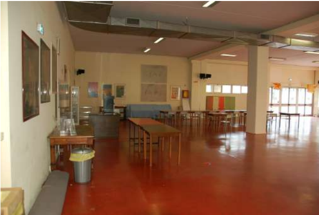
foto n° 80