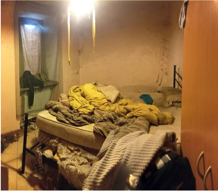
riprese interne dell'unità immobiliare oggetto di E.I.