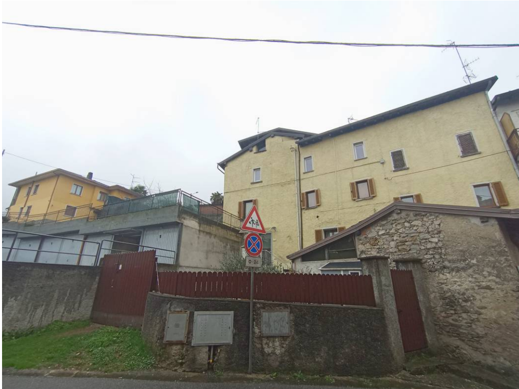
Riprese esterne dell'edificio ove è ubicata l'unità immobiliare oggetto di E.I. a piano primo e del lastrico solare