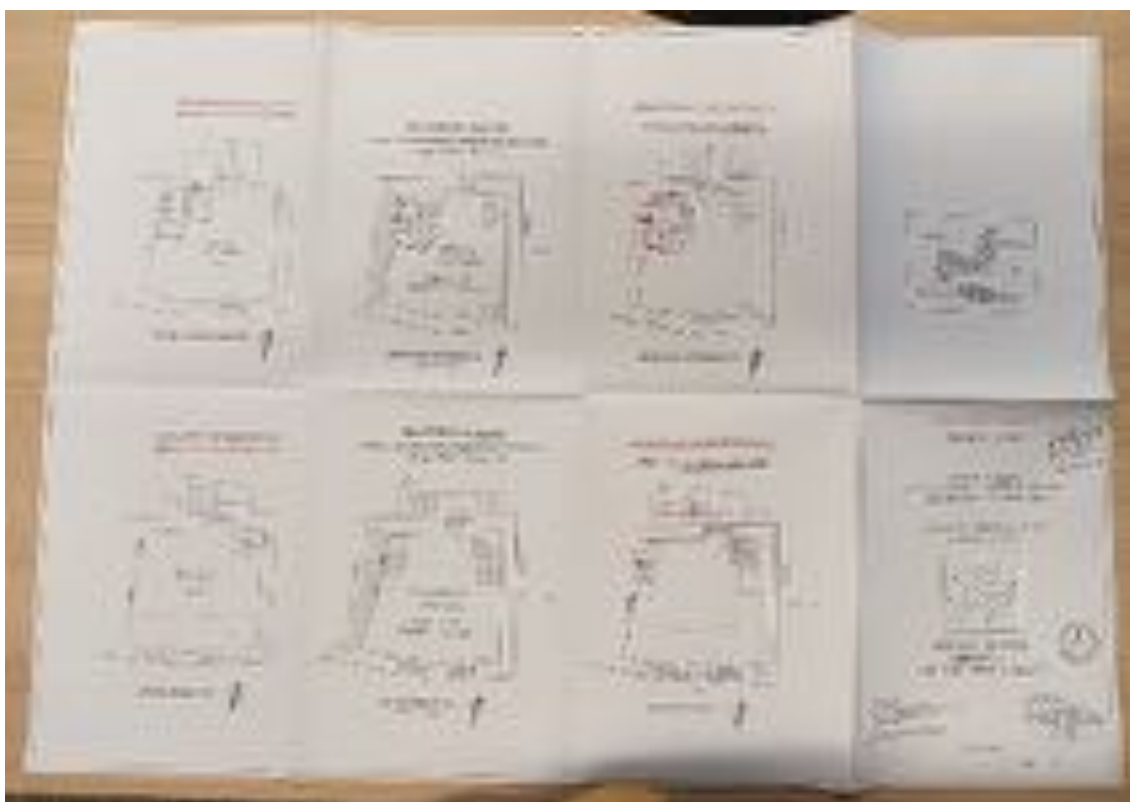
Planimetria di rilievo dello stato di fatto (All. 1.14)

Planimetria di rilievo dello stato reale dei luoghi: Lo stato stato reale dei luoghi corrisponde agli elaborati grafici allegati alla Concessione Edilizia in sanatoria come da planimetria allegata che comprende la situazioni di progetto, di variante in sanatoria e sovrapposta. (All. 1.14)