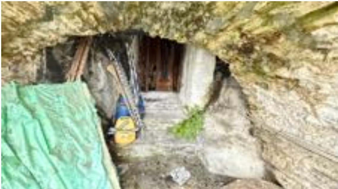
PERTINENZA - CORTE ESTERNA