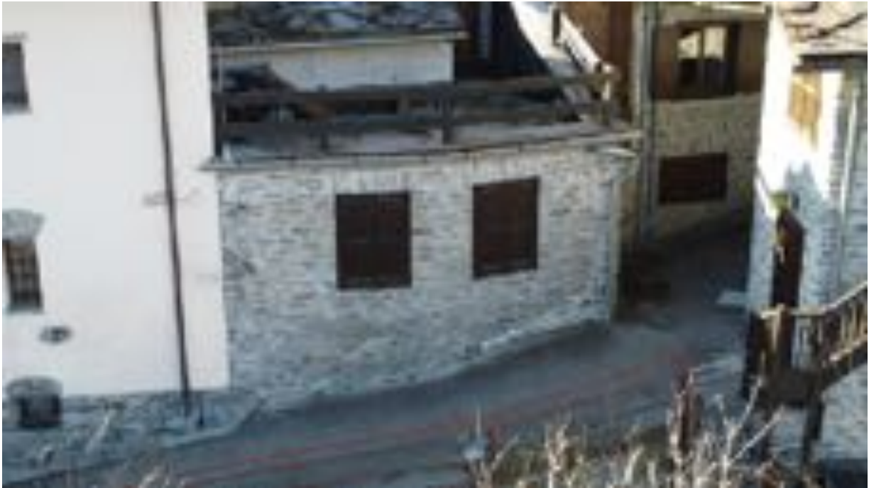
ANGOLO NORD EST