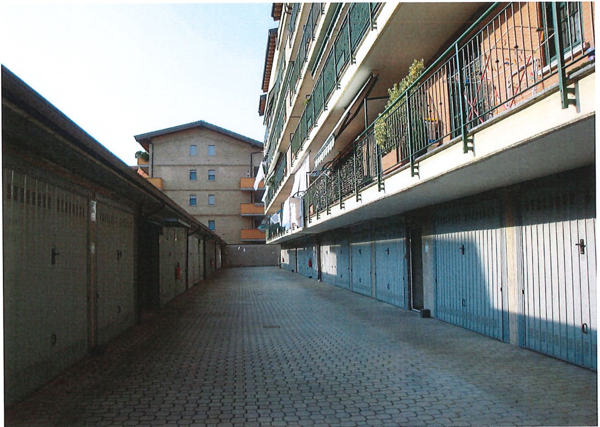
R.G.E. 8/2025 G. E. Dott.ssa F. Mammone Cesano Boscone, Via San Carlo 7, piano T-S1, Foglio 6 mapp 616, sub 3 Prospetti esterni: il fronte sul cortile interno