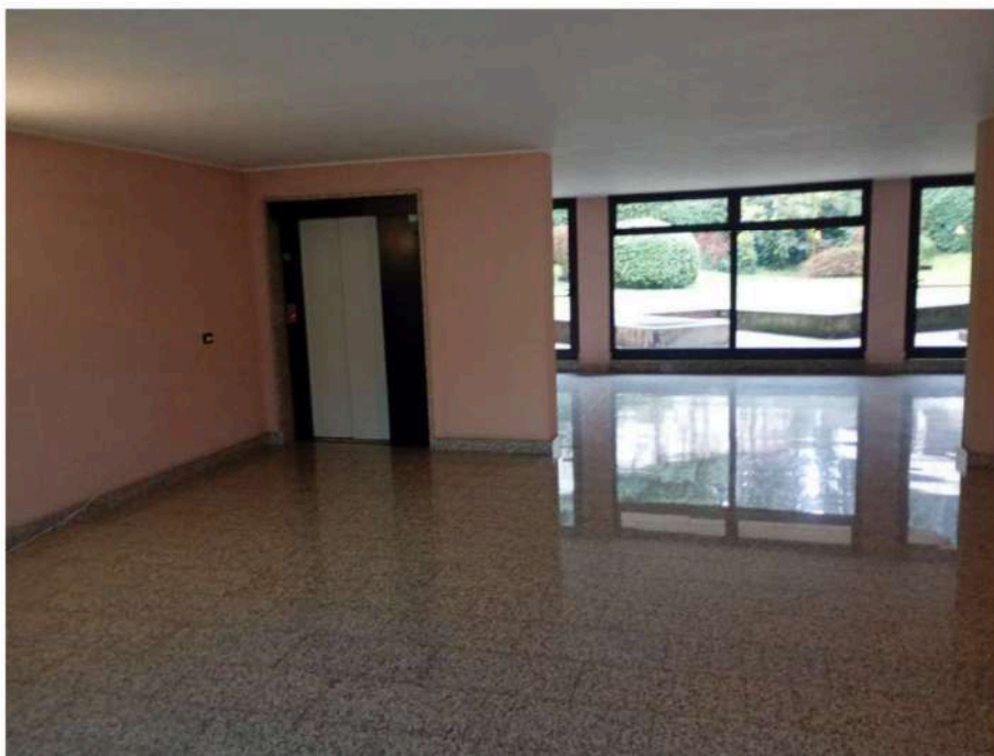
5) Particolare dell'atrio di ingresso,