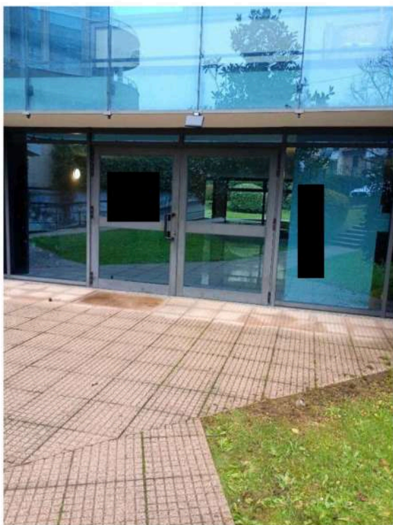
4) Particolare dell'ingresso,