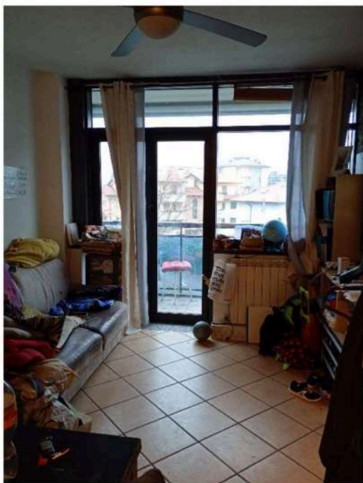
9) Soggiorno/Angolo Cottura ,