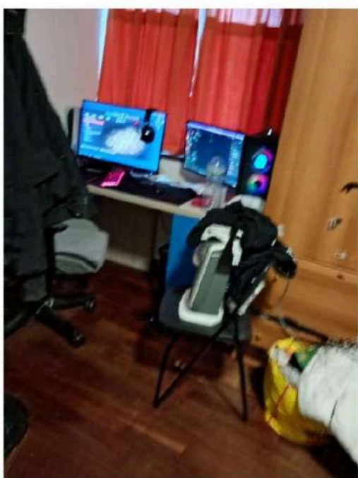
12) Camera da letto,