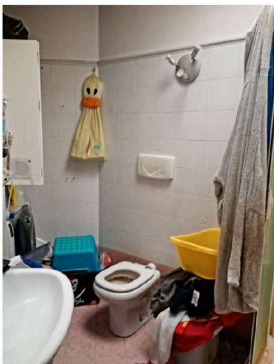
14) Bagno ,