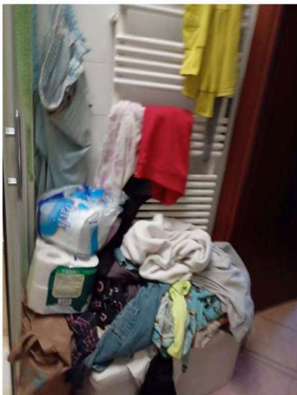
15) Bagno ,