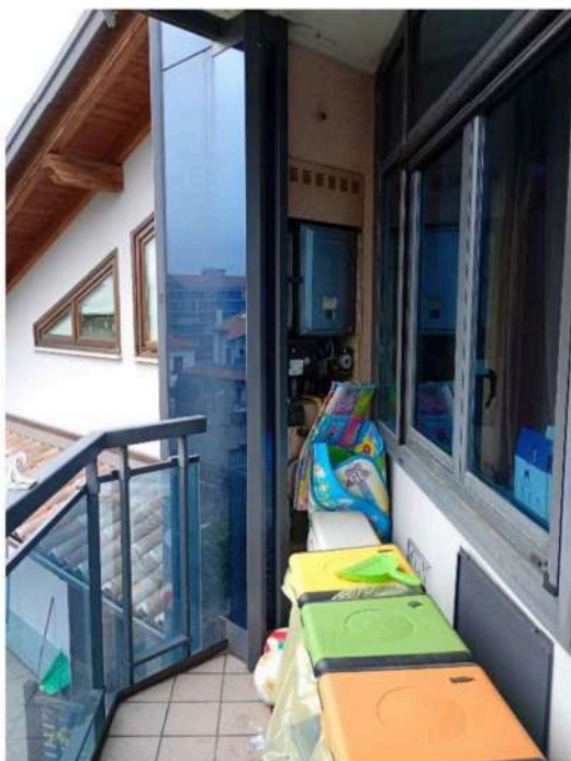
10) Terrazzo sulla zona giorno ,