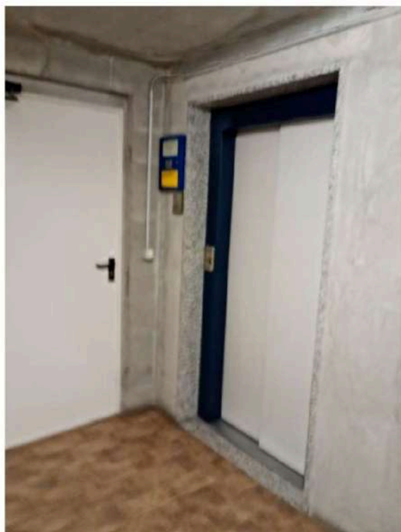
16) Accesso al piano interrato/cantina;