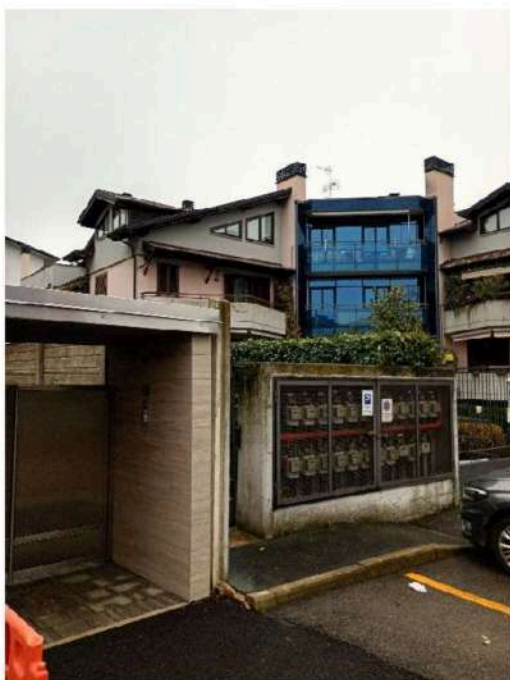
3) Vista del fabbricato con particolare dei contatori,