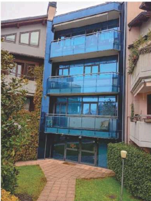
2) Particolare della facciata centrale sui balconi,