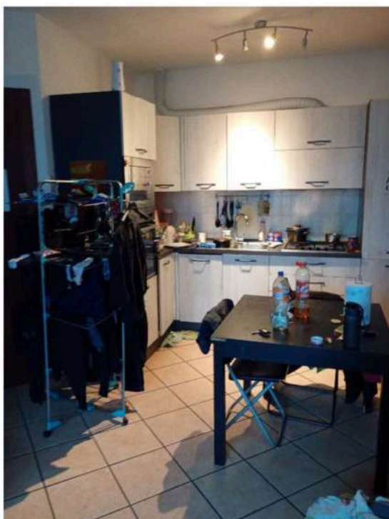
8) Soggiorno/angolo cottura ,