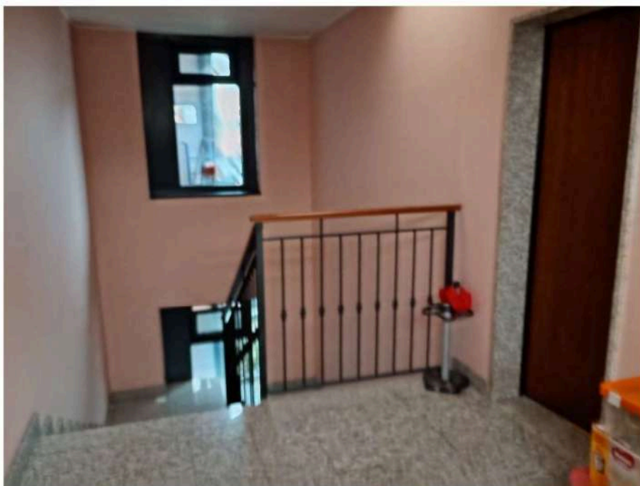
6) Arrivo della scala comune al pianerottolo di distribuzione,