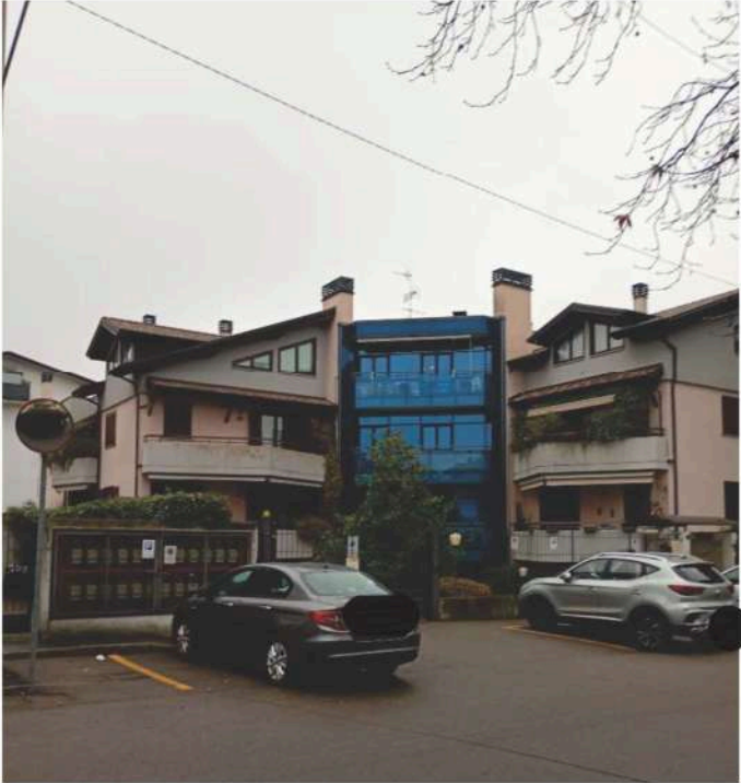
1) Veduta frontale del fabbricato,