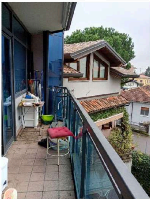
11) Terrazzo sulla zona giorno ,