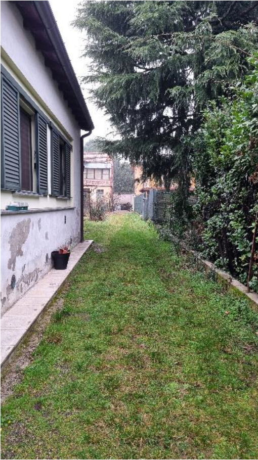
CAMMINAMENTO CHE CONDUCE ALL'IMMOBILE