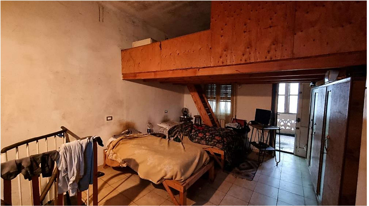
CAMERA E SOPPALCO