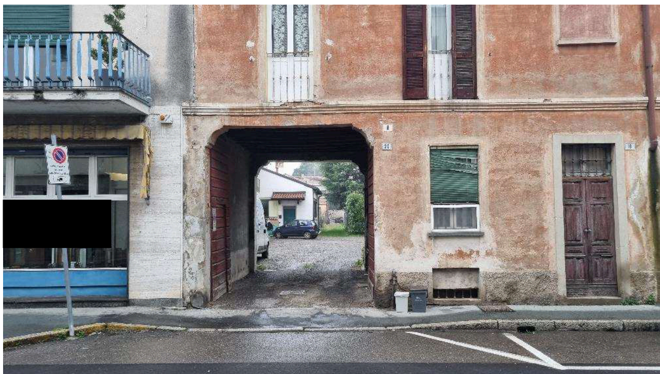
INGRESSO PEDONALE E CARRAIO COMUNE SU VIA MATTEOTTI