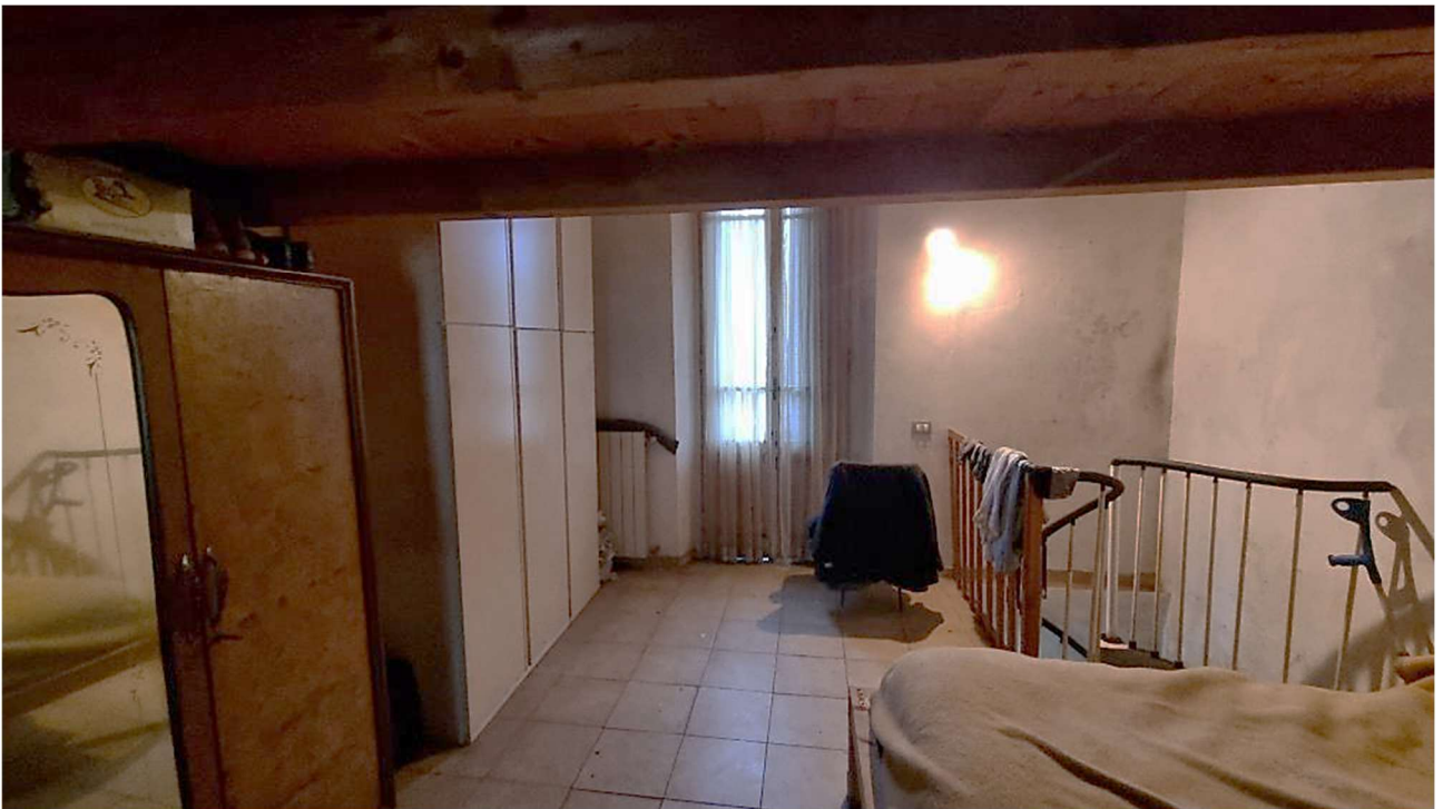
CAMERA E SOPPALCO