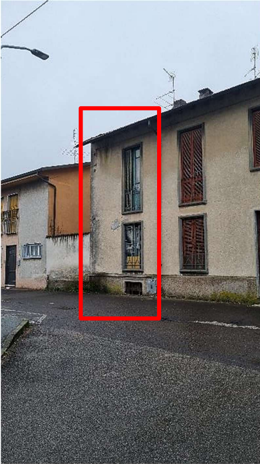
PROSPETTO POSTERIORE SU VIA MAZZINI – PORZIONE EDIFICIO