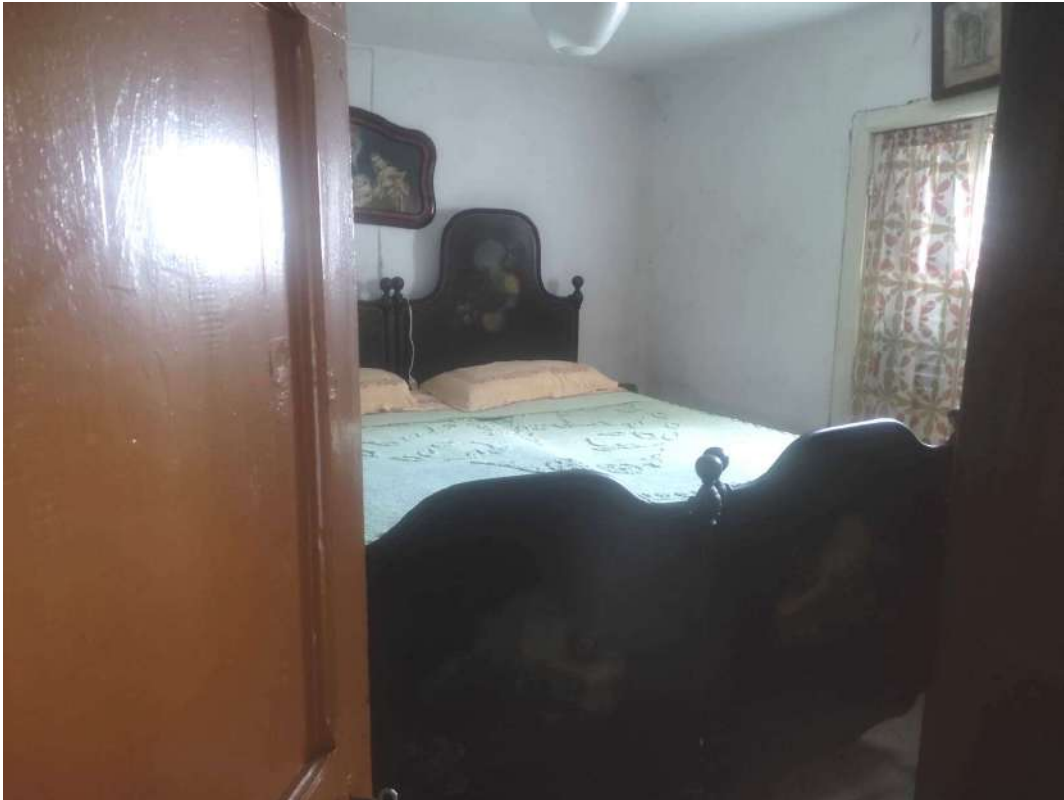
Camera 3 – piano primo