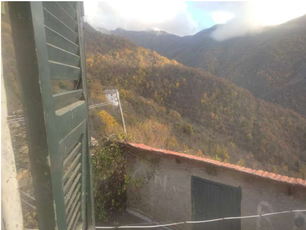
Vista a Levante