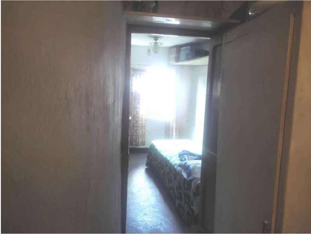
Camera passante – piano primo