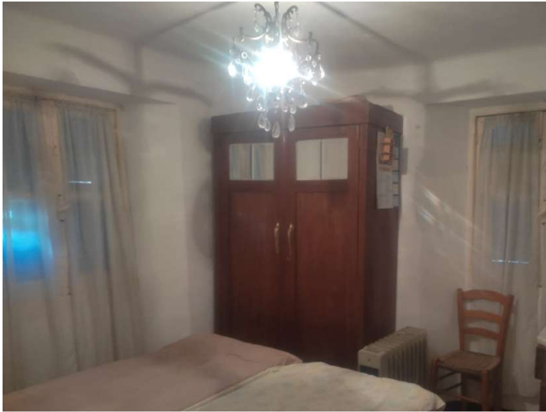
Camera 1 – piano primo