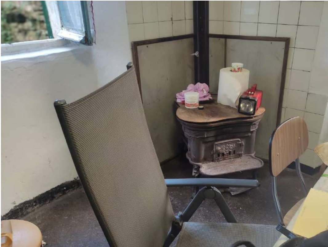
Stufa a legna in cucina – piano terra