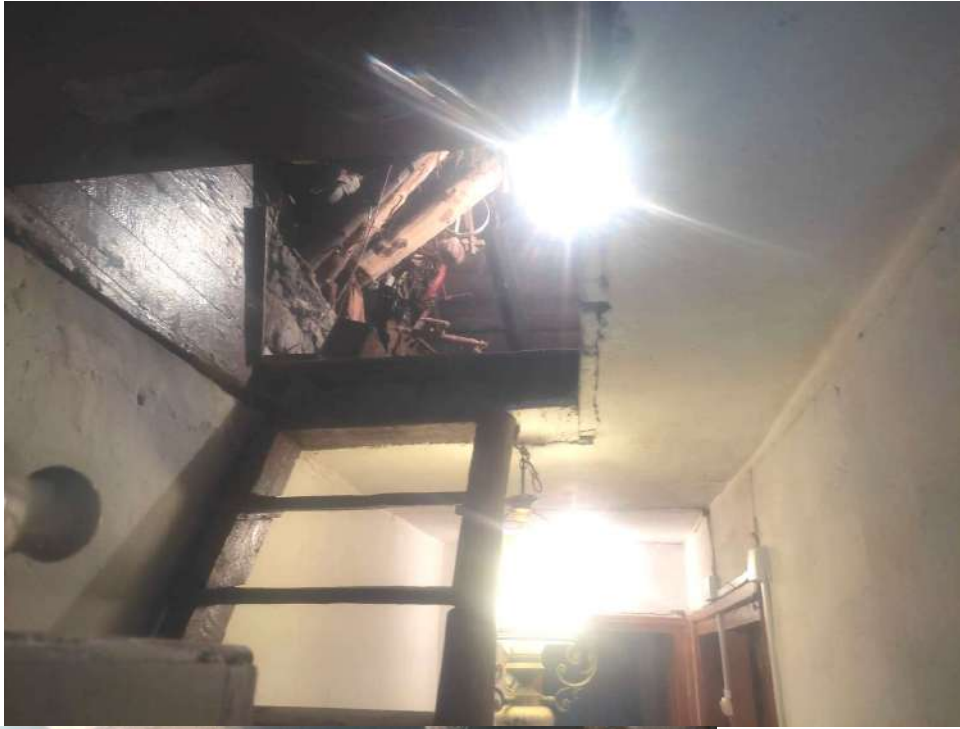
Scala accesso al sottotetto