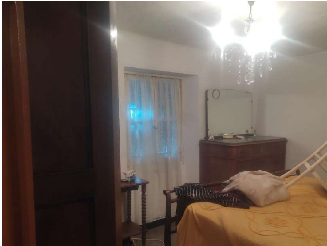
Camera 2 – piano primo