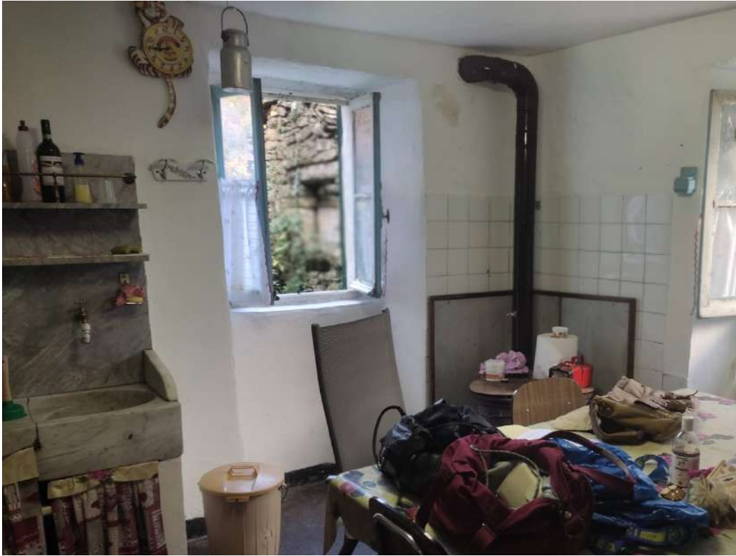
Cucina – piano terra