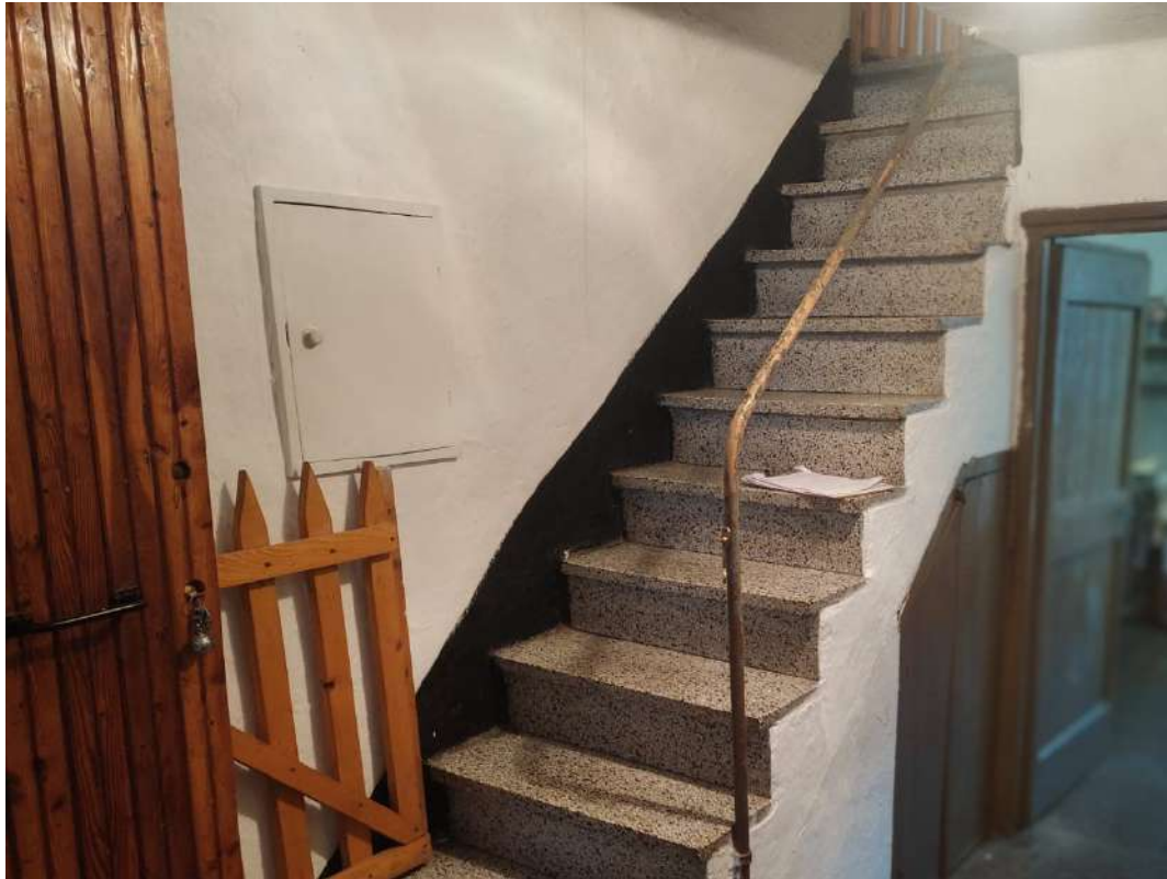
Ingresso- piano terra