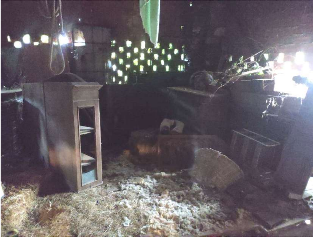
Fienile – piano primo sottostrada