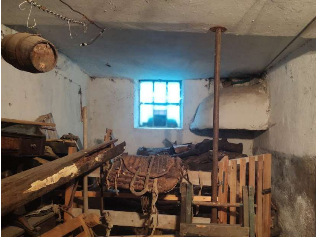
Cantina 1 – piano primo sottostrada