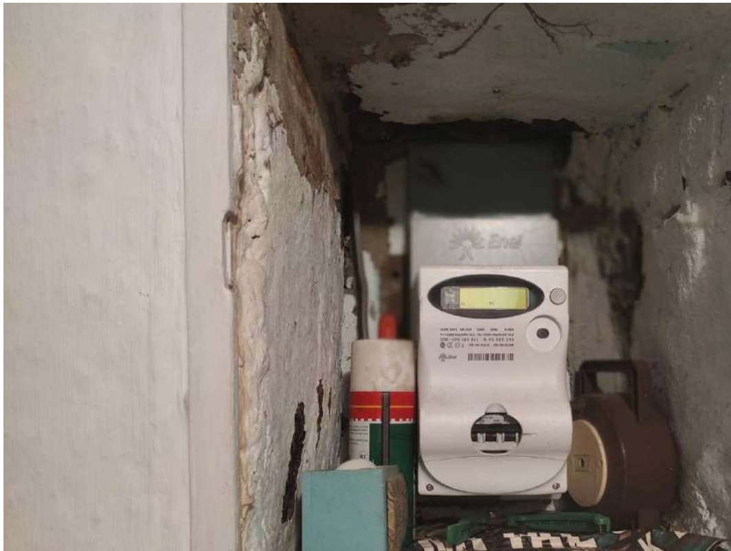
Contatore luce in ingresso – piano terra