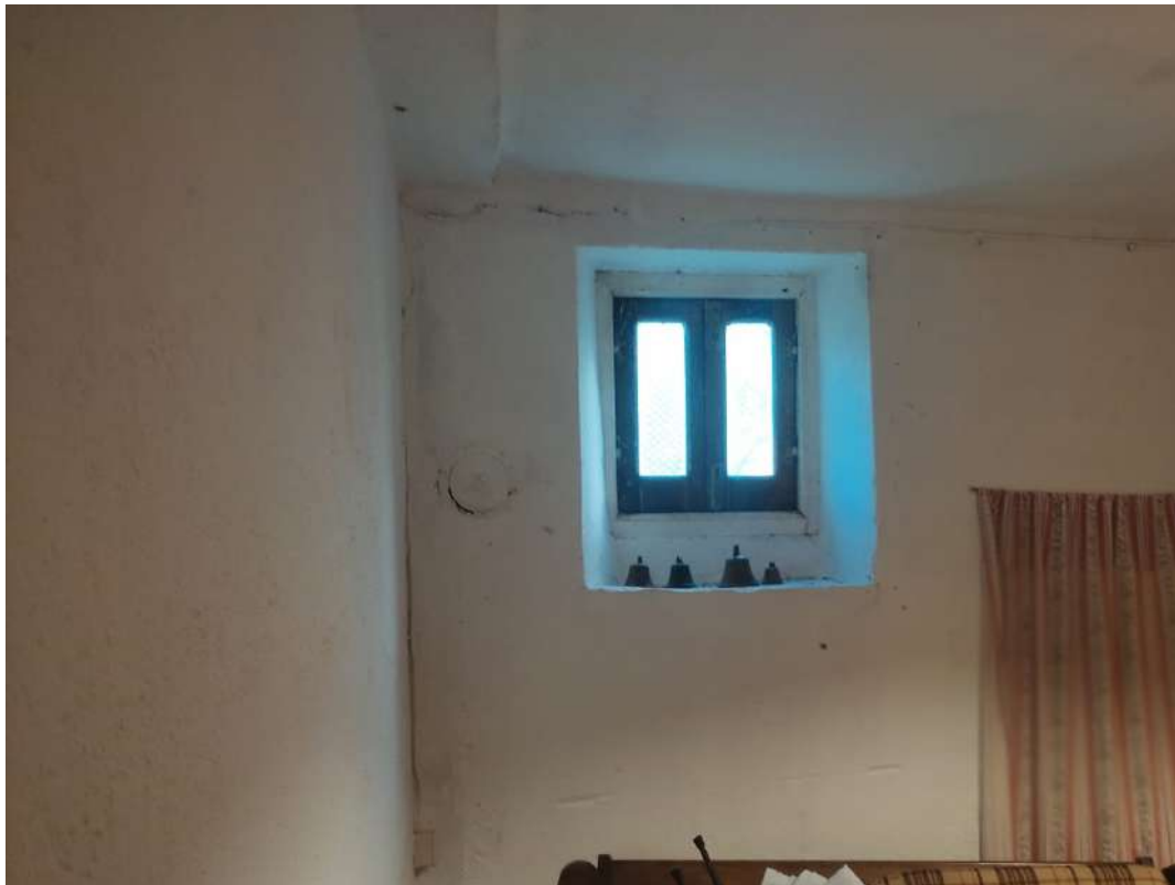
Soggiorno – piano terra