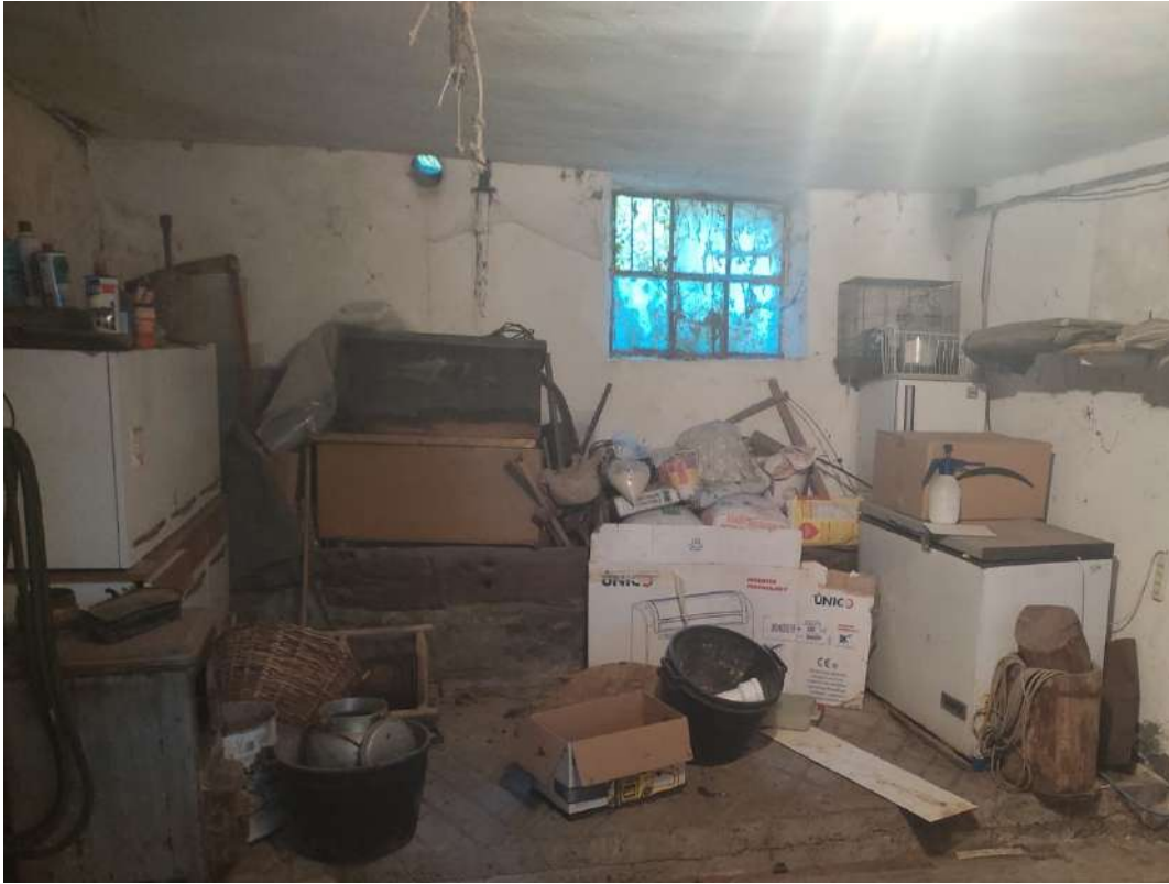
Cantina 1 – piano primo sottostrada