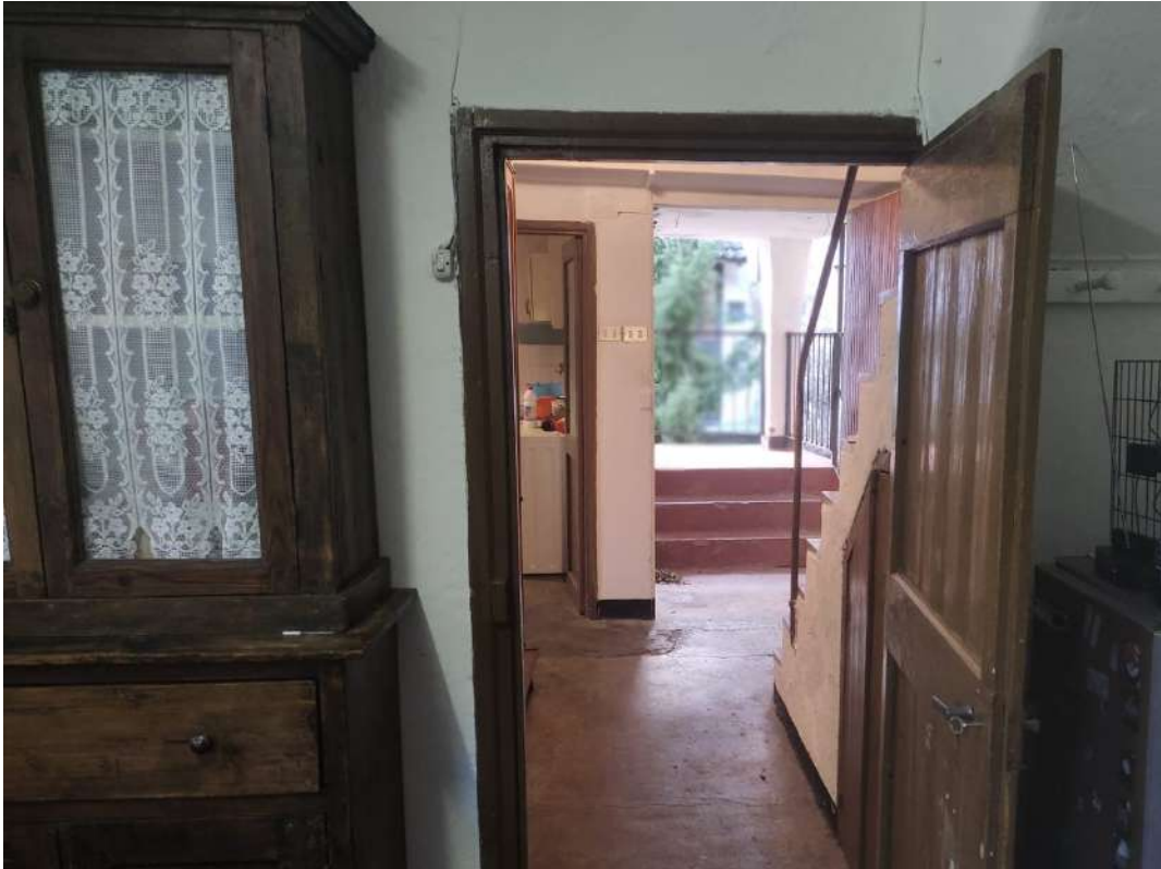
Cucina ed ingresso – piano terra