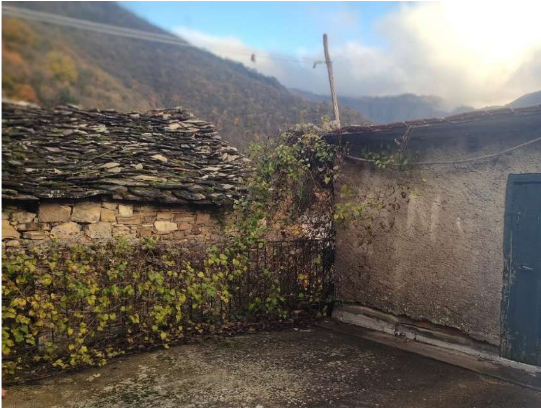
Terrazzo – piano terra