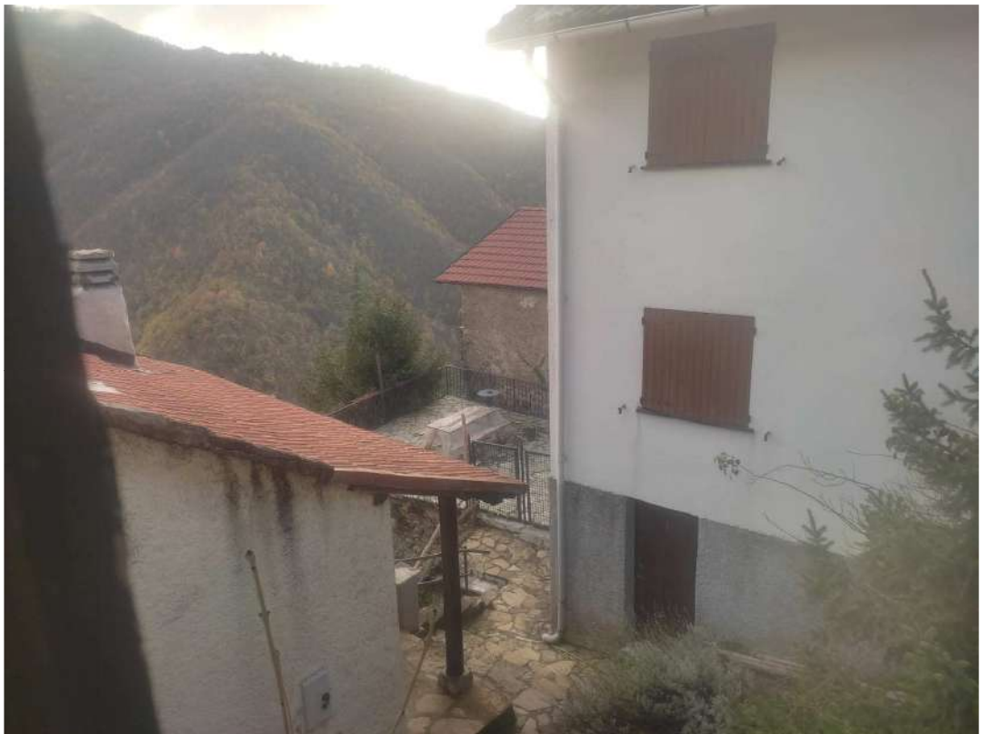
Vista a Ponente