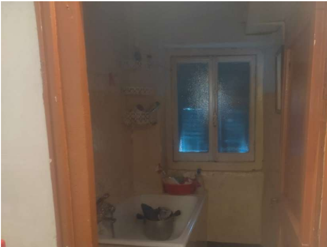
Bagno – piano primo