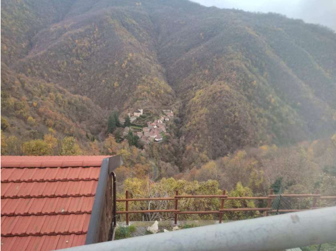
Vista a Sud