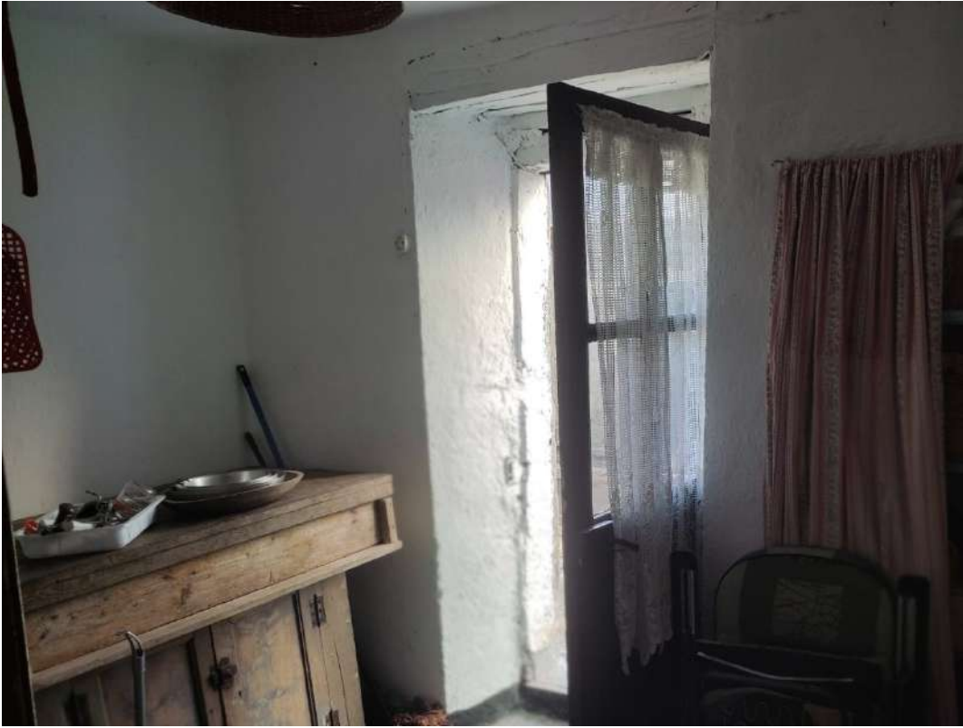
Camera – piano terra