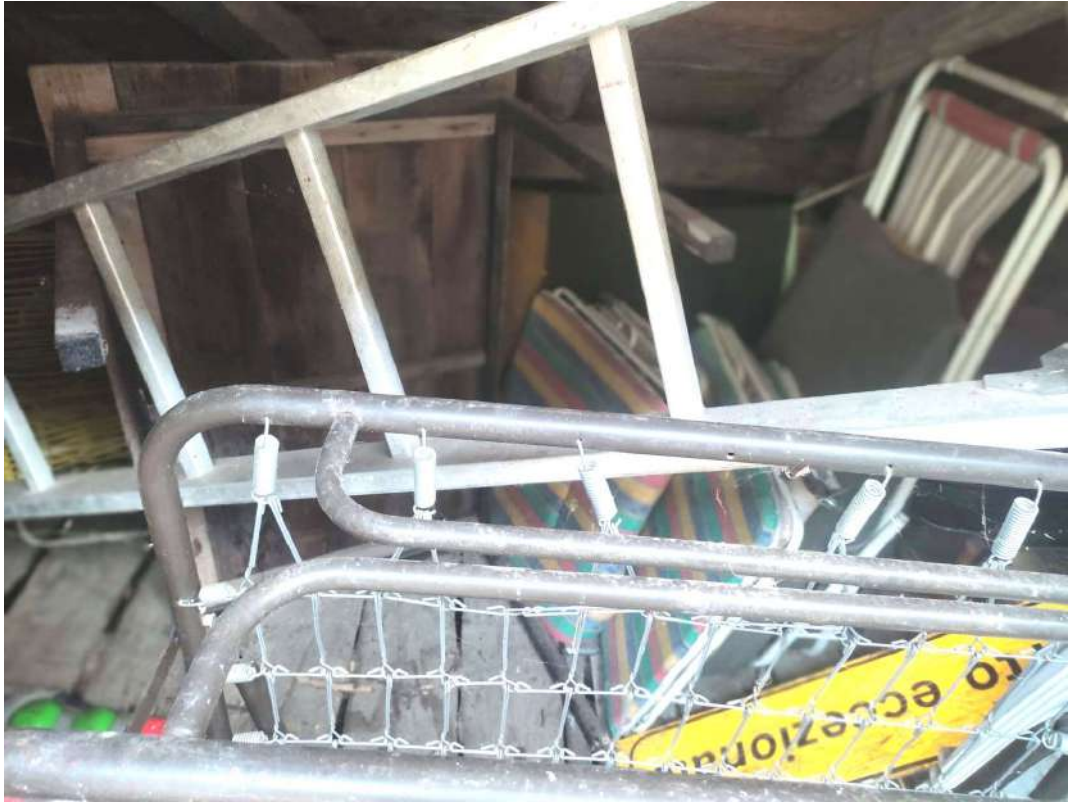
Fienile – piano terra