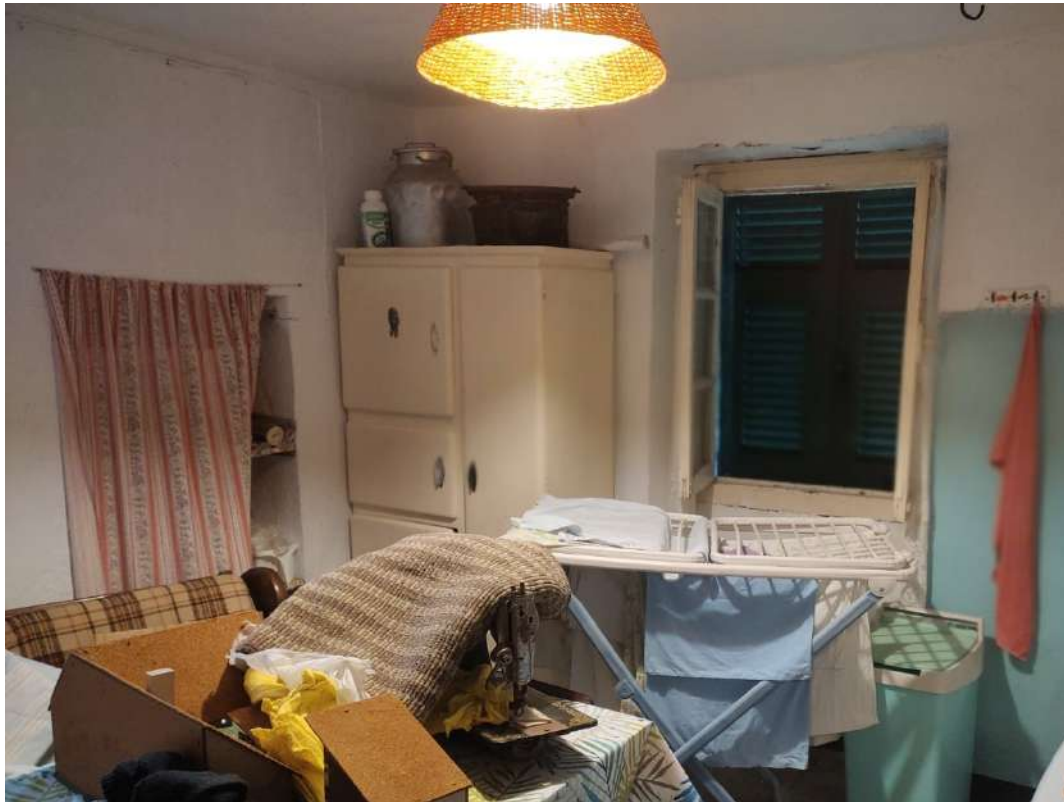
Soggiorno – piano terra