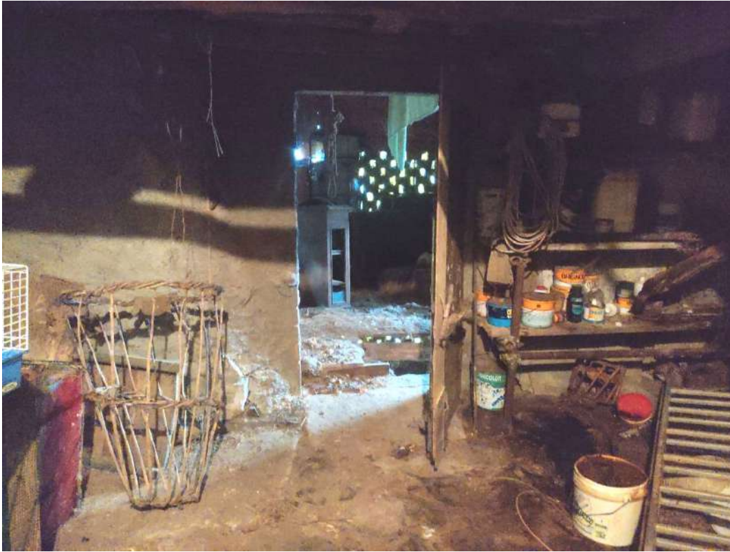
Cantina 2 – piano 1SS