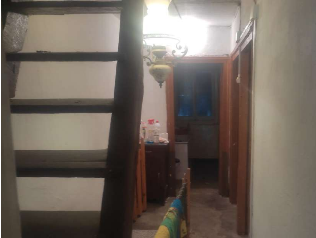
Corridoio – piano primo