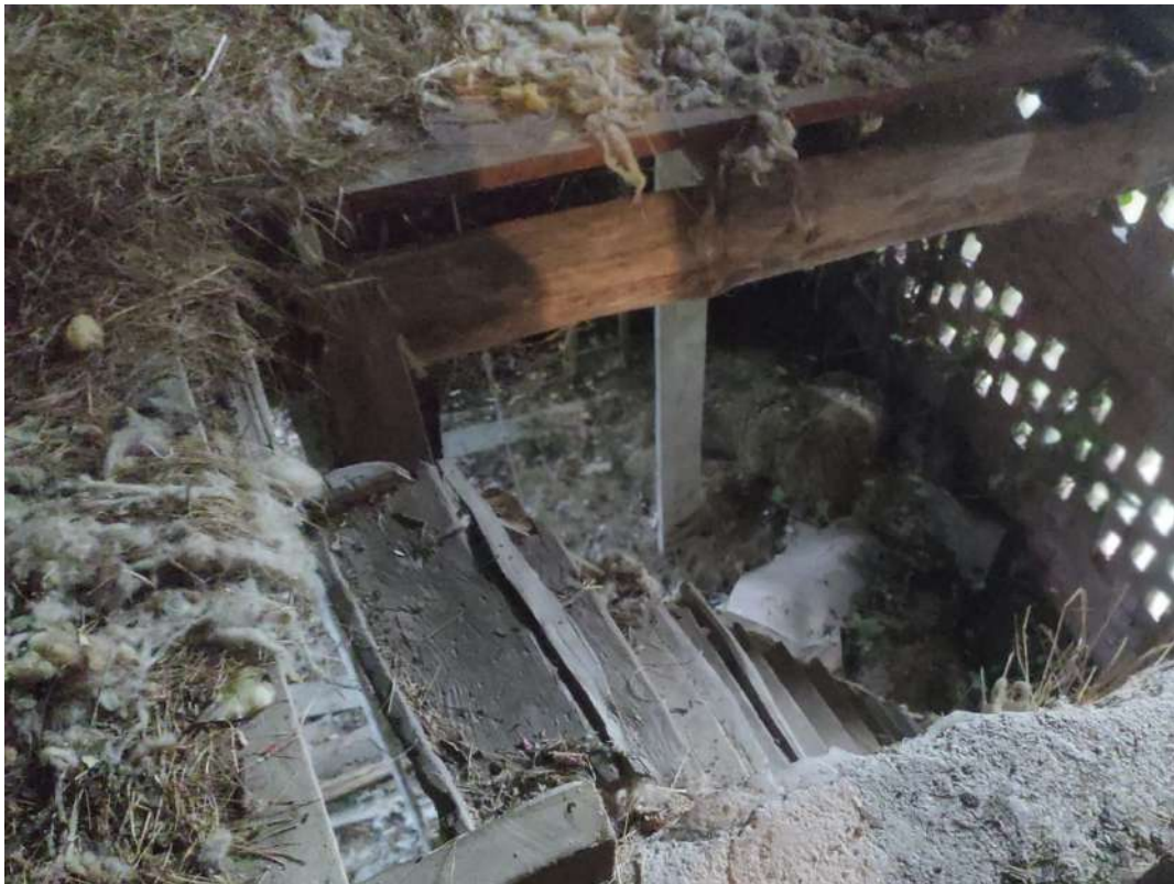
Fienile – piano primo sottostrada – scala di collegamento con la cantina al piano secondo sottostrada