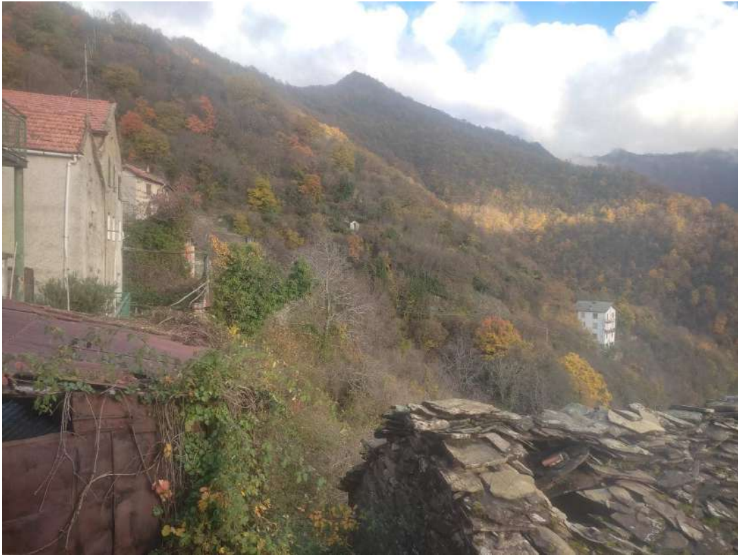
Vista a Levante