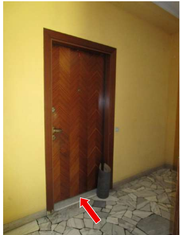
Foto 5/6 – Parti comuni al piano terra (rialzato) e indicazioni della porta d'ingresso all'appartamento