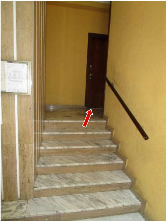
Foto 3/4 – Ingresso comune, dal cortile interno, al fabbricato identificato al civico 7