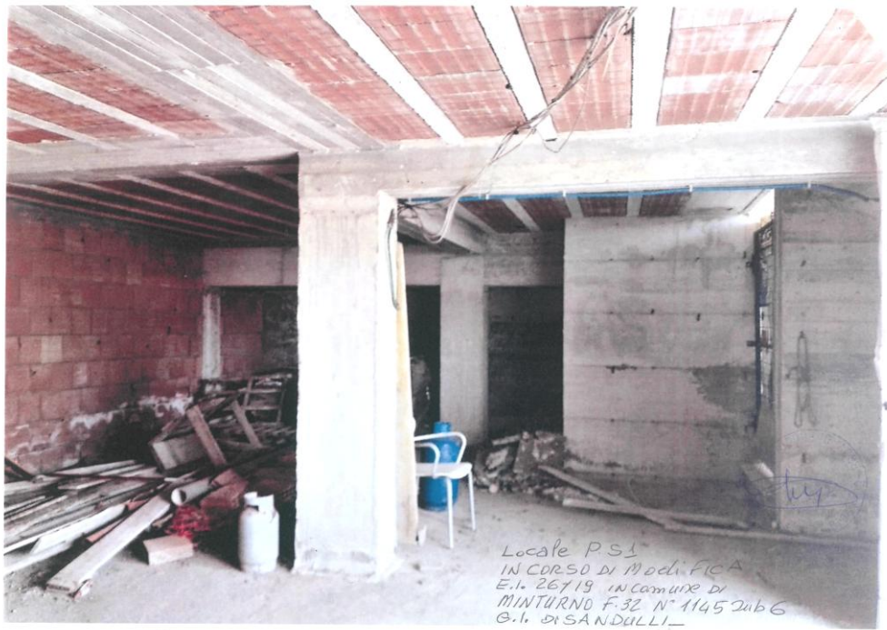
Interno Area S1