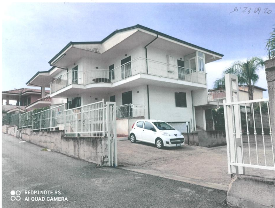
Panoramica Palazzina: veduta nord/est da Ingresso