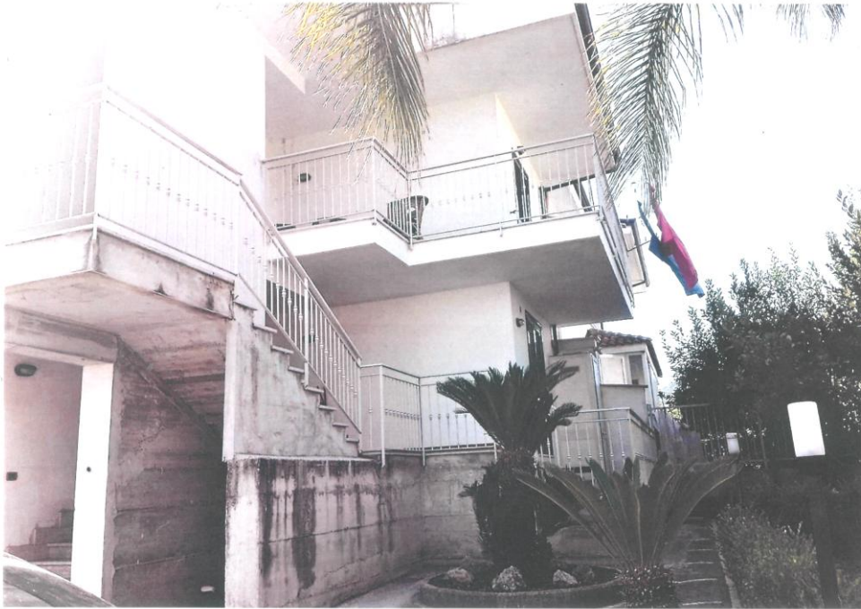
Veduta Lato nord: Area ingresso lato comune