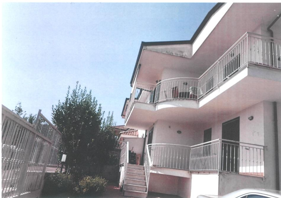
Lato Sud/est Foto n.2