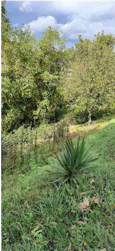
Scarpata destinata a verde