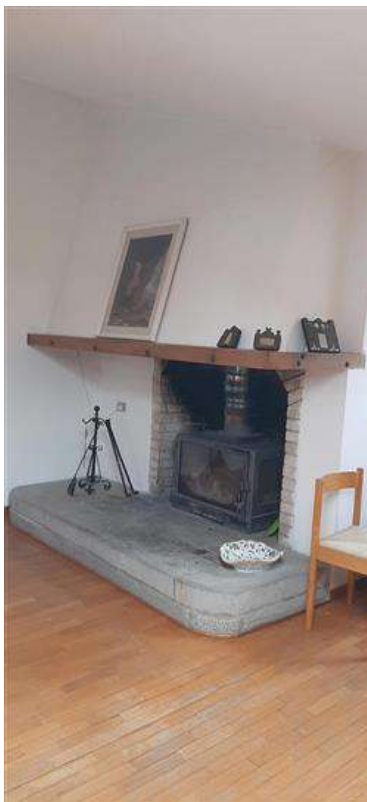
camino piano sottotetto