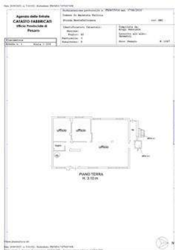
PLN-Foglio 42-mappale 3-subalterno 9