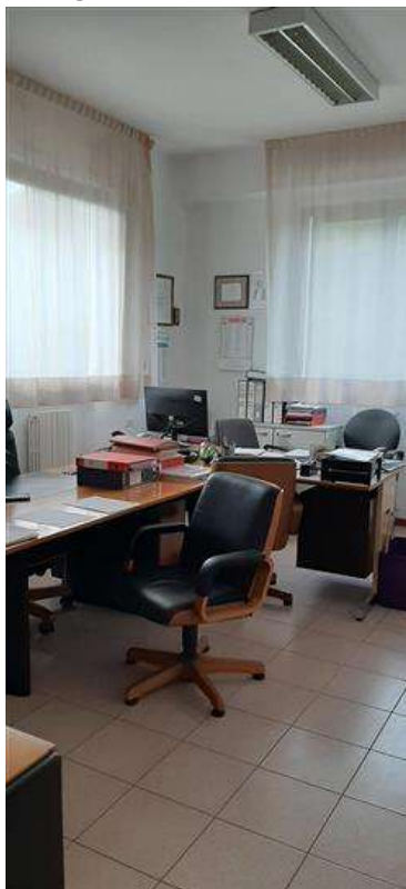
Particolare di un ufficio

L'intero edificio sviluppa 4 piani, 3 piani fuori terra, 1 piano interrato. Immobile ristrutturato nel 1985.