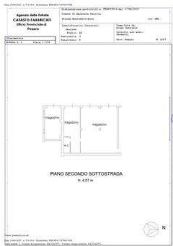
PLN-Foglio42-Mappale 3- subalterno5