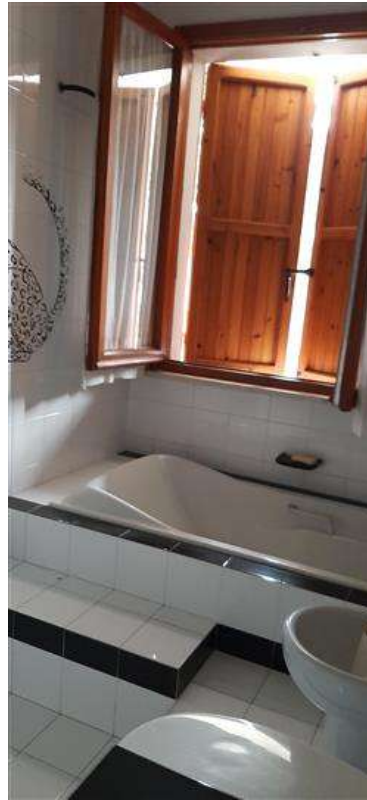
un bagno dell'alloggio al P.1