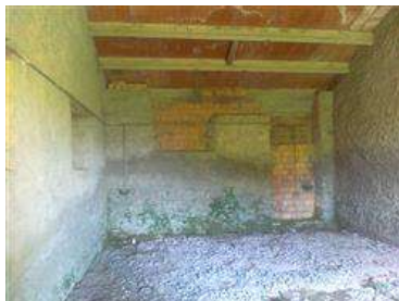
Capanno distinto al Catasto Fabbricati al foglio 33 mappale 646- vista interna