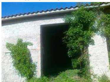
Capanno distinto al Catasto Fabbricati al foglio 33 mappale 646- vista esterna

L'intero edificio sviluppa 1 piani, 1 piani fuori terra, .