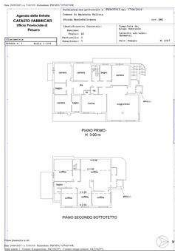
PLN-catastale foglio 42-mappale3 subalterno 7