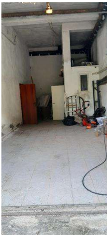
Particolare interno su parete esterna wc

L'intero edificio sviluppa 5 piani, 3 piani fuori terra, 2 piano interrato. Immobile ristrutturato nel 1985.