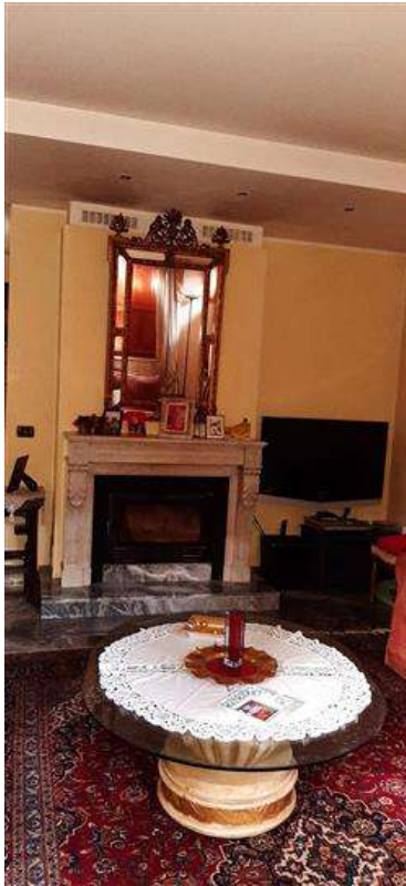
Camino dell'alloggio al P.1