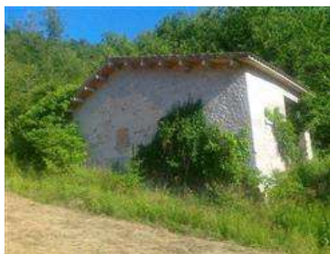
Capanno distinto al Catasto Fabbricati al foglio 33 mappale 646- vista esterna