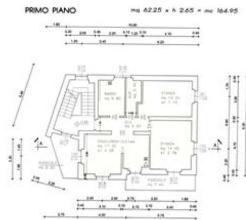
pianta sanatoria 82/2012 - primo piano

Con concessione edilizia n. 86/2012 dd 09/08/2012 si prevedeva la realizzazione di un cappotto termico perimetrale solo per il piano terra (pm 1); sul posto si ravvisa realizzato un cappotto termico perimetrale sino al primo piano (pm2). I manufatti (serragli/barccamenti) presenti sul cortile sono previsti in demolizione.