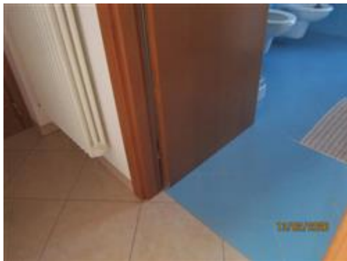
particolare pavimentazione appartamento