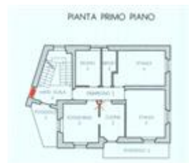
Piano di Casa Materialmente Divisa - estratto primo piano

BENI IN BASELGA DI PINE' VIA DELLO STADIO 1, FRAZIONE MIOLA