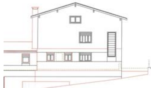
prospetto concessione 86/2012- stato di raffronto