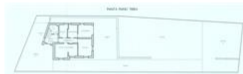
Piano di Casa Materialmente Divisa - estratto piano terra