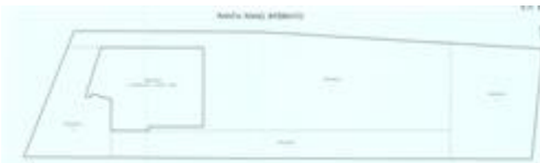
Piano di Casa Materialmente Divisa - estratto piano interrato

Si segnala che per raggiungere il bene si transita su particelle di altra proprietà non gravate da diritto di passo intavolato. Nello specifico la p.ed. 953 p.m.1, p.f. 8069, p.f. 5587/2.