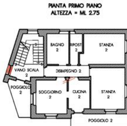
estratto planimetria p.ed. 1125 sub.4, p.m.2