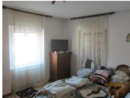
interno appartamento a primo piano - stanza