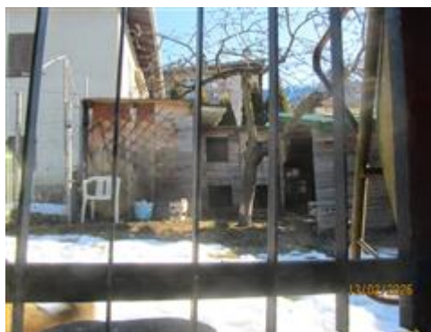
serragli/baraccamenti previsti in demolizione