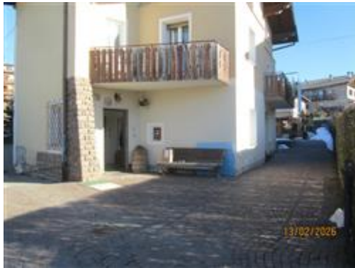
andito comune esterno