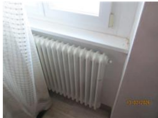
particolare serramento e corpo radiante