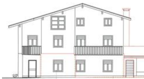
prospetto concessione 86/2012 - stato di raffronto