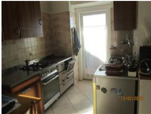
interno appartamento a primo piano

L'intero edificio sviluppa 3 piani, 3 piani fuori terra, 1 piano interrato. Immobile costruito nel 1965.