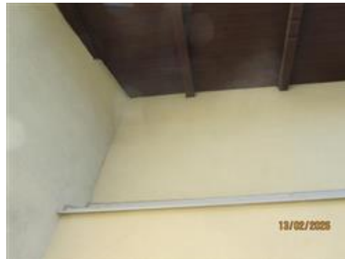
COIBENTAZIONE TERMICA PERIMETRALE SINO AL PIANO ABITATO