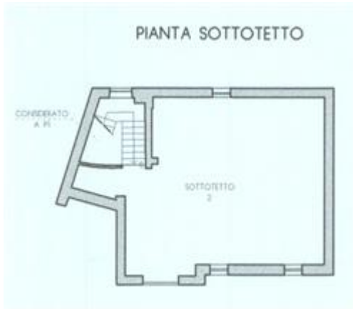
Piano di Casa Materialmente Divisa - estratto piano sotto tetto