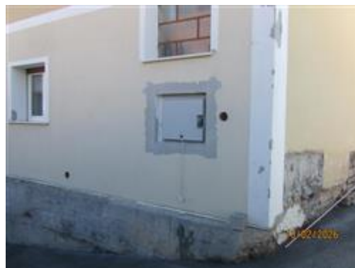
POSIZIONE CONTATORI UTENZA ELETTRICA