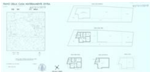
Piano di Casa Materialmente Divisa