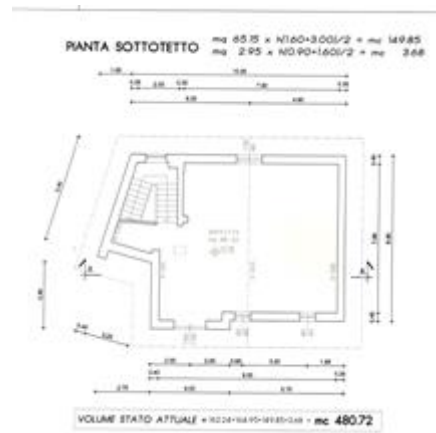
pianta sanatoria 82/2012 - sotto tetto