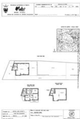
planimetria p.ed. 1125 sub.4, p.m.2