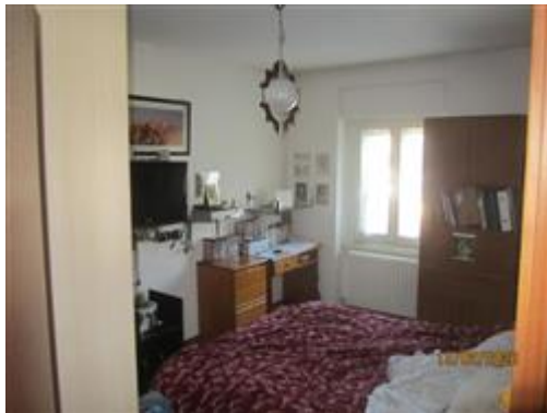
interno appartamento a primo piano - stanza