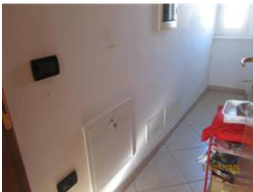
QUADRO DI DISTRIBUZIONE IMPIANTO DI RISCALDAMENTO