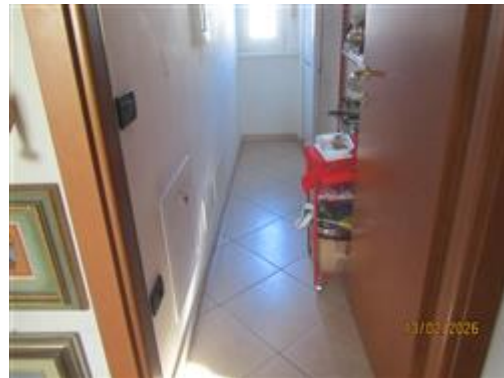
interno appartamento a primo piano - ripostiglio