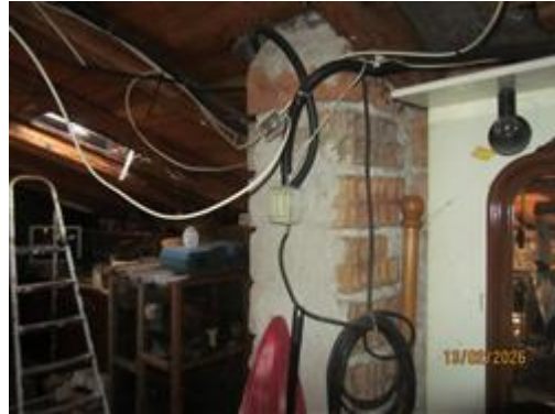
IMPIANTO ELETTRICO NEL SOTTO TETTO