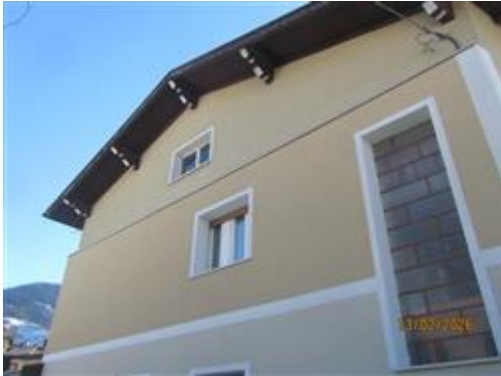
COIBENTAZIONE TERMICA PERIMETRALE SINO AL PIANO ABITATO