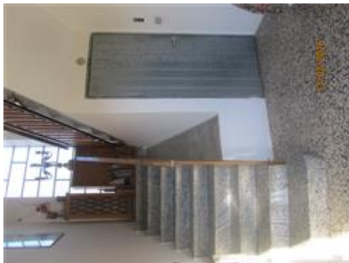
vano scala e atrio interni