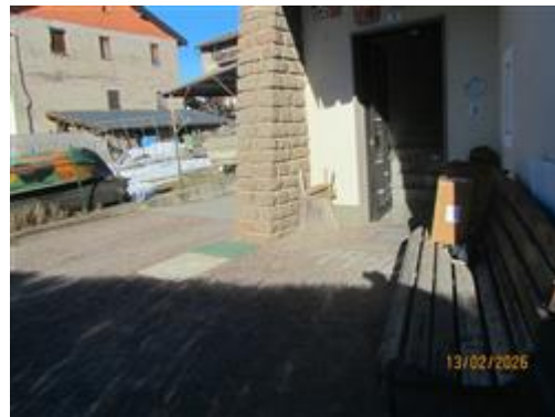
andito comune esterno