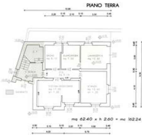
pianta concessione 86/2012 - piano terra