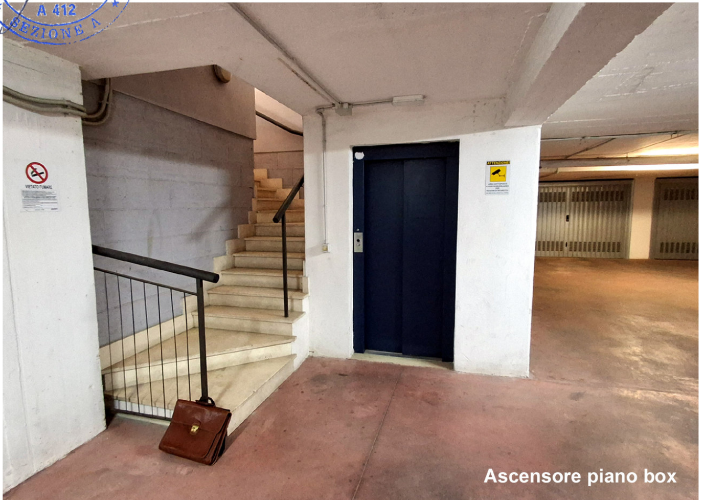
Ascensore piano box

ORDINE INGEGNERI LATINA Luigi DI CECCA INGEGNERE civile ed ambientale industriale dell'informazione A 412 SEZIONE A