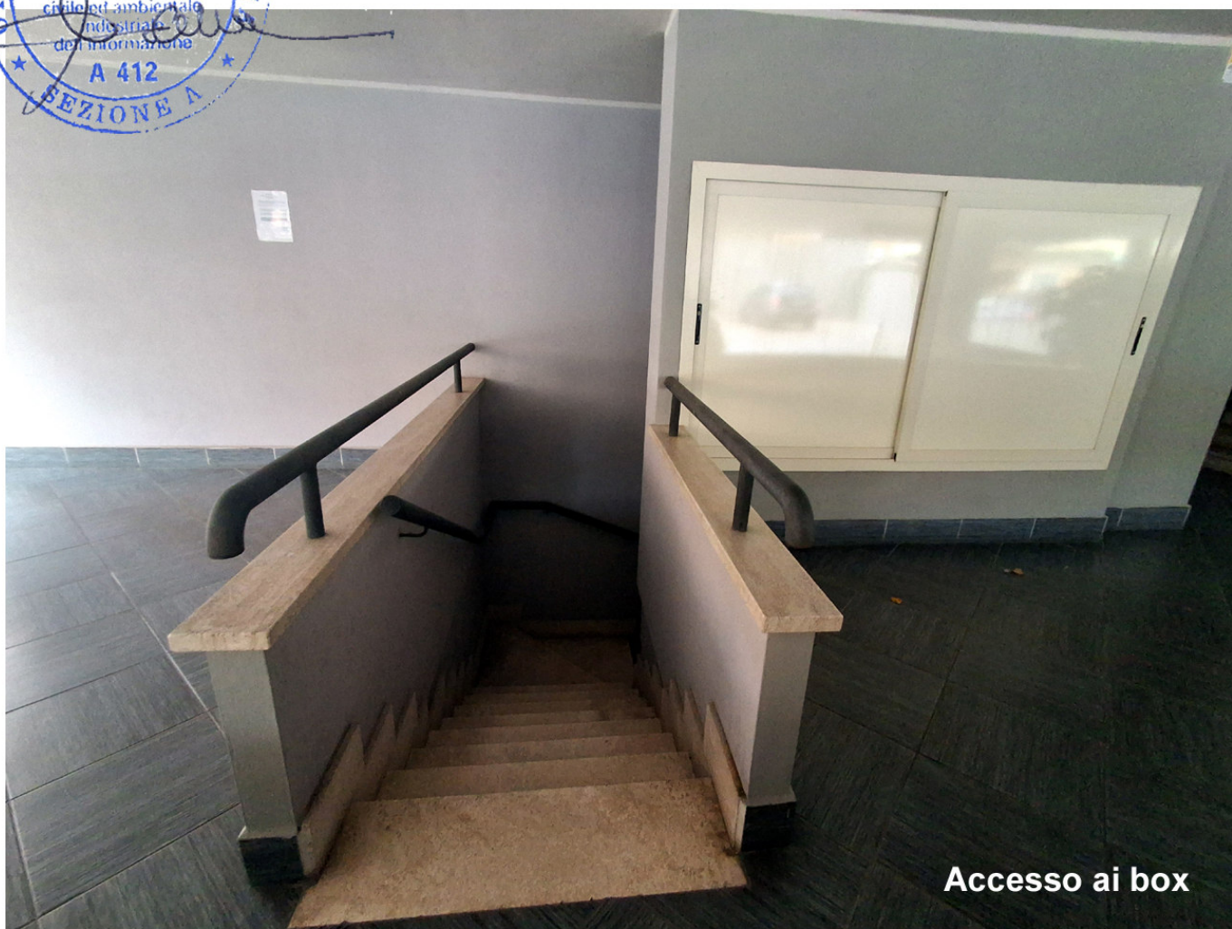
Accesso ai box