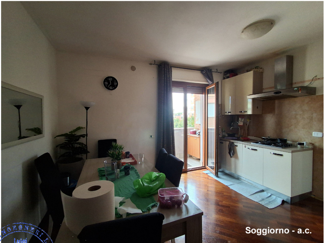
Soggiorno - a.c.