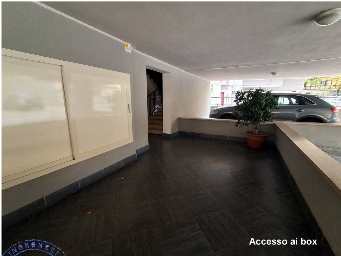
Accesso ai box