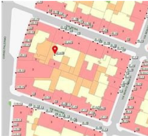
Estratto di mappa - Geoportale