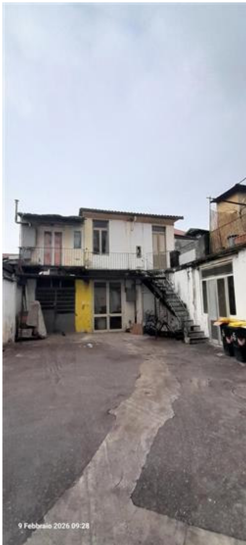
Facciata stabile cortile interno