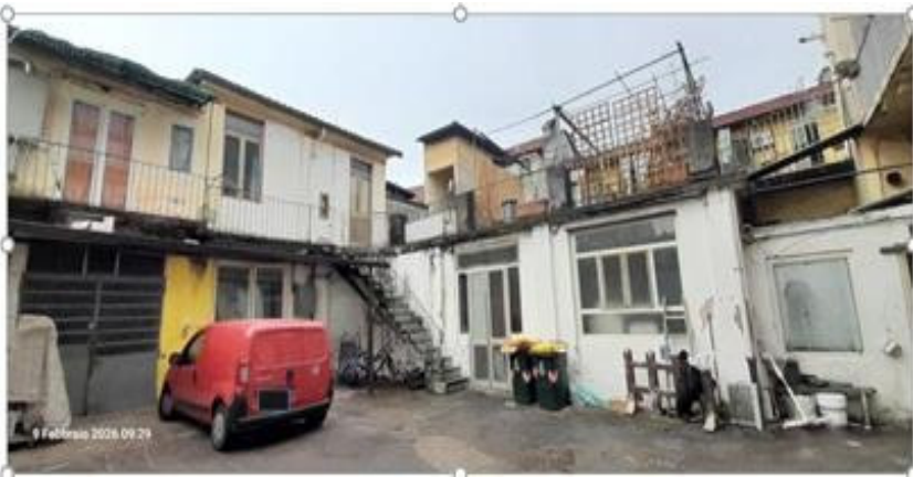
Vista cortile interno Via Sesia 22