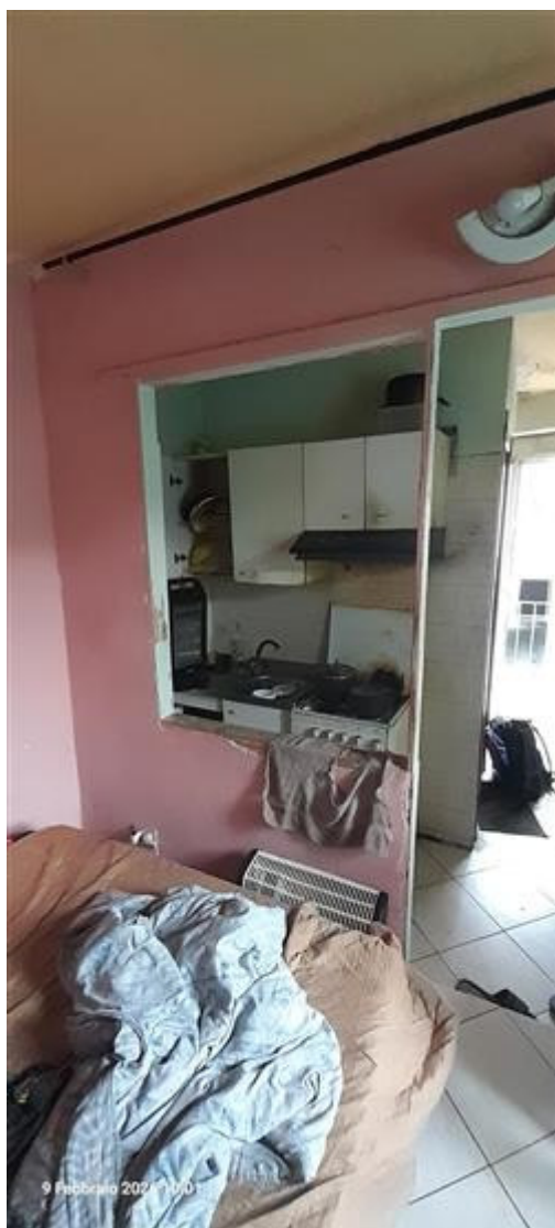
Vista su angolo cottura