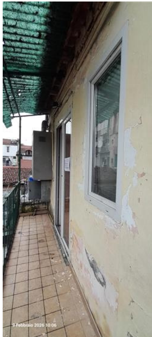
Vista ingresso da ballatoio