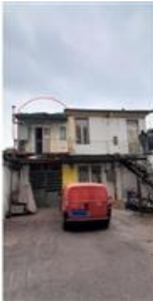
Vista facciata unità immobiliare - cortile interno