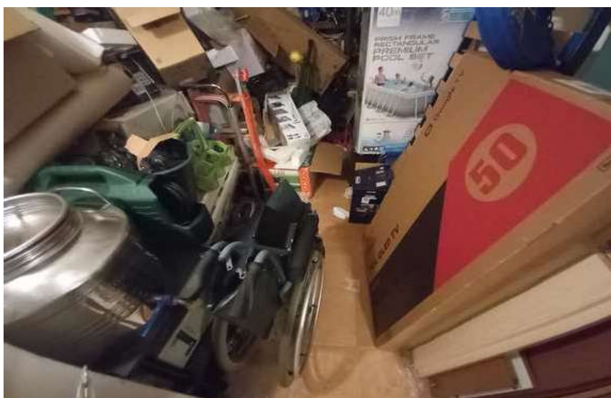
CANTINA SUB 11