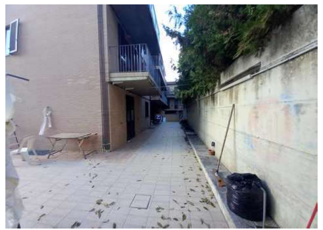
CORTE PRIVATA LATO EST