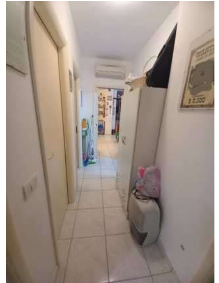
DISIMPEGNO ZONA NOTTE