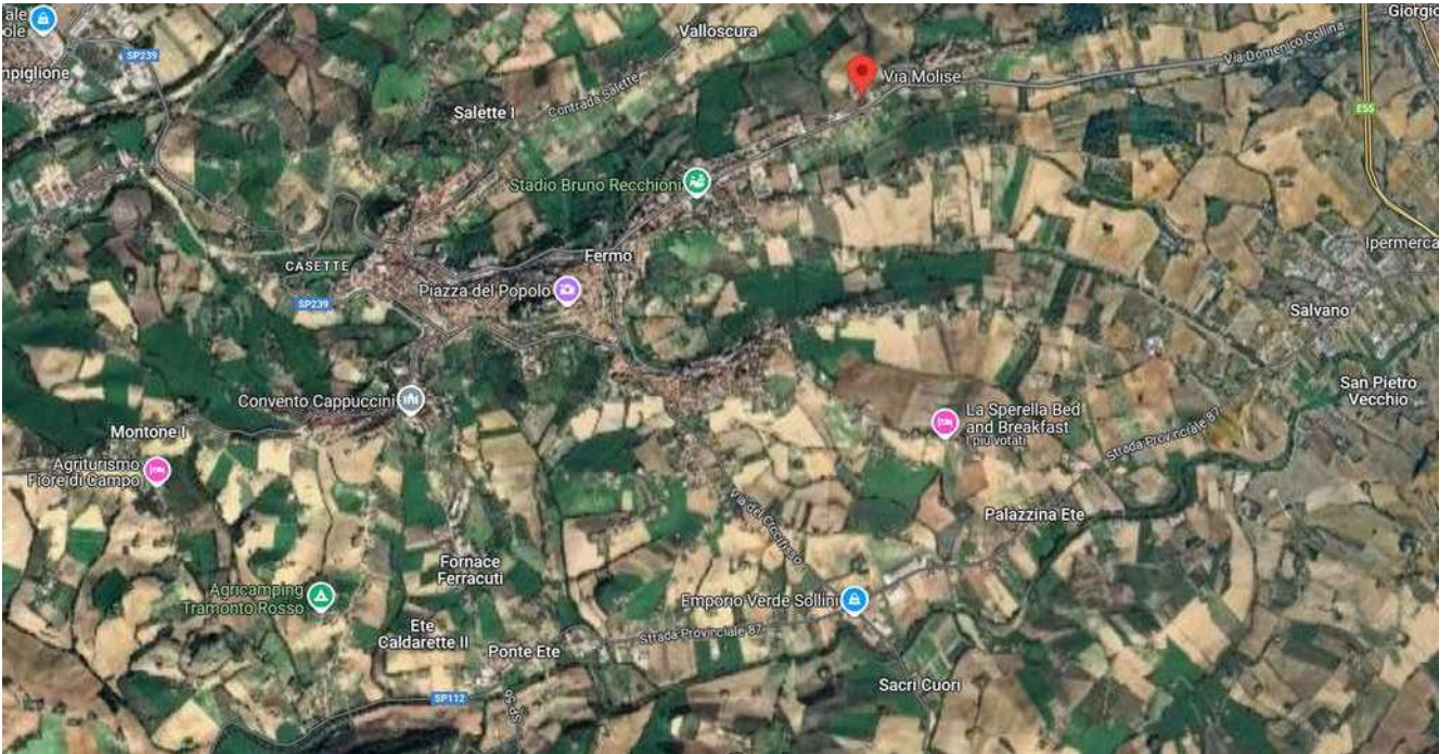
INDIVIDUAZIONE DELL'IMMOBILE – VIA MOLISE, FERMO - C.DA SANTA PETRONILLA