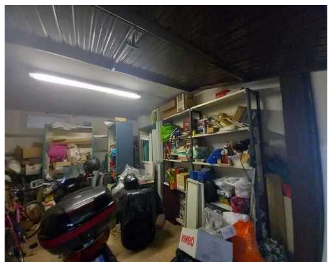
GARAGE SUB 24