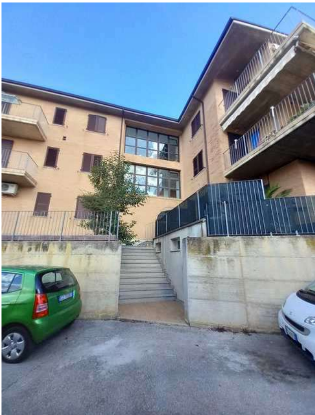
ACCESSO ALLA SCALA CONIMINIALE