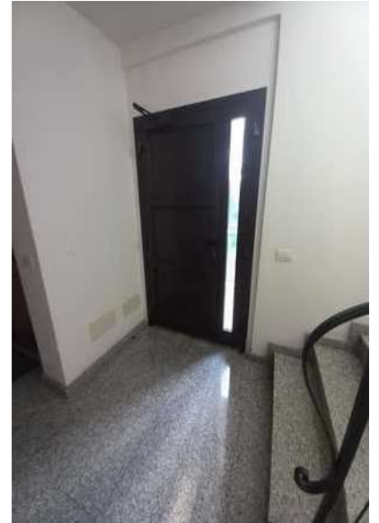
INGRESSO ALLA SCALA CONDOMINIALE E PIANEROTTOLO