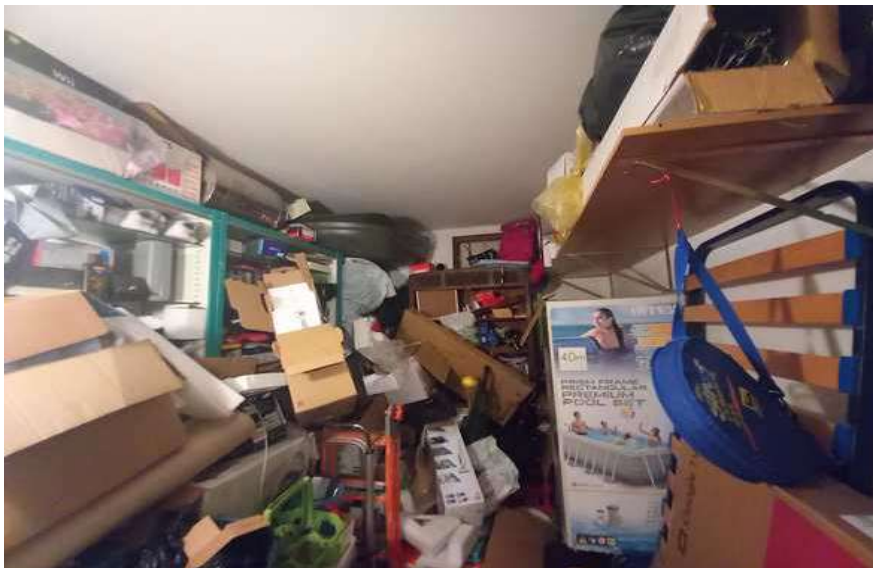
CANTINA SUB 11