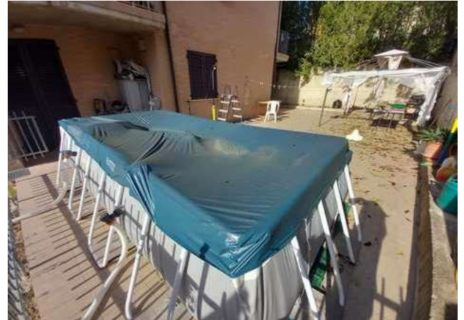
CORTE PRIVATA LATO SUD