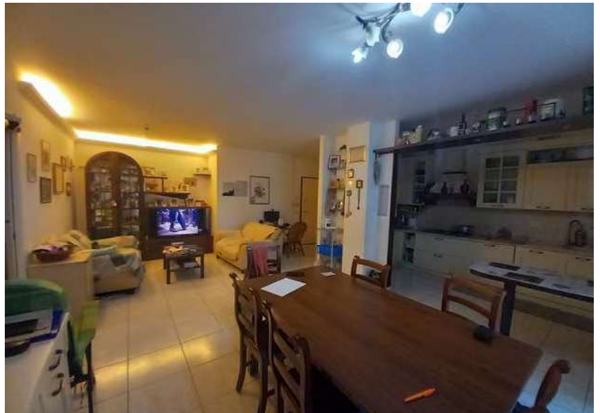
INGRESSO DELL'ABITAZIONE -SUB 11 - ZONA PRANZO/SOGGIORNO