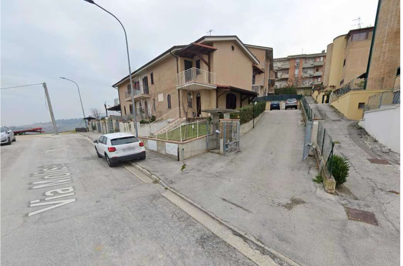
ACCESSO CONDOMINIALE DA VIA MOLISE