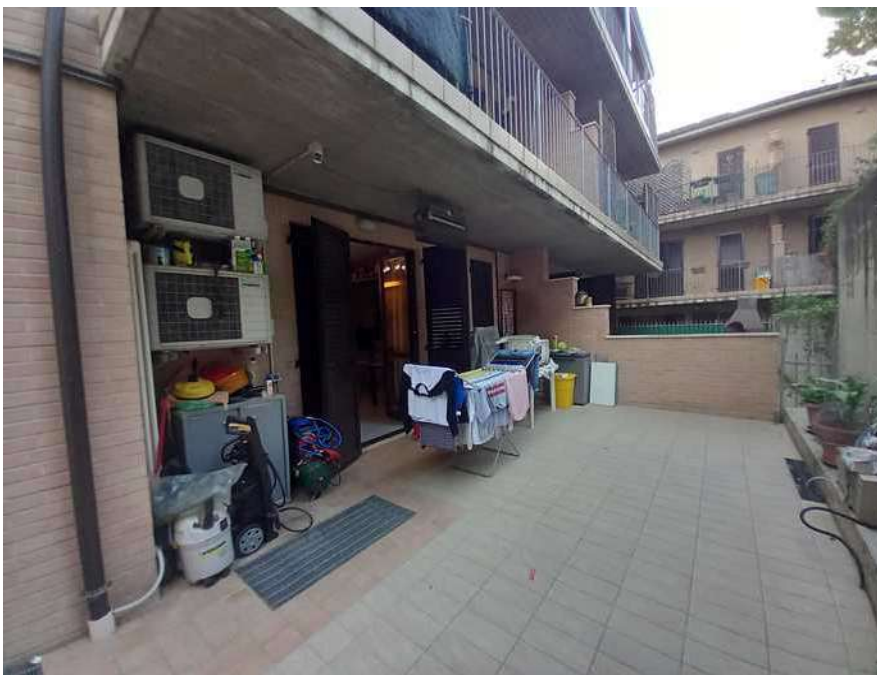
CORTE PRIVATA LATO EST