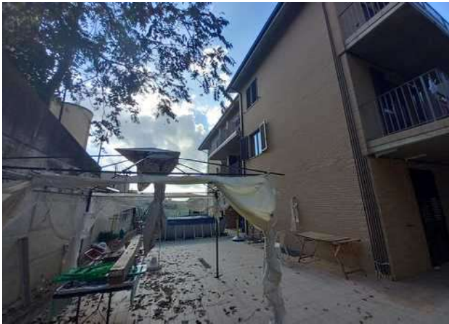
CORTE PRIVATA LATO SUD