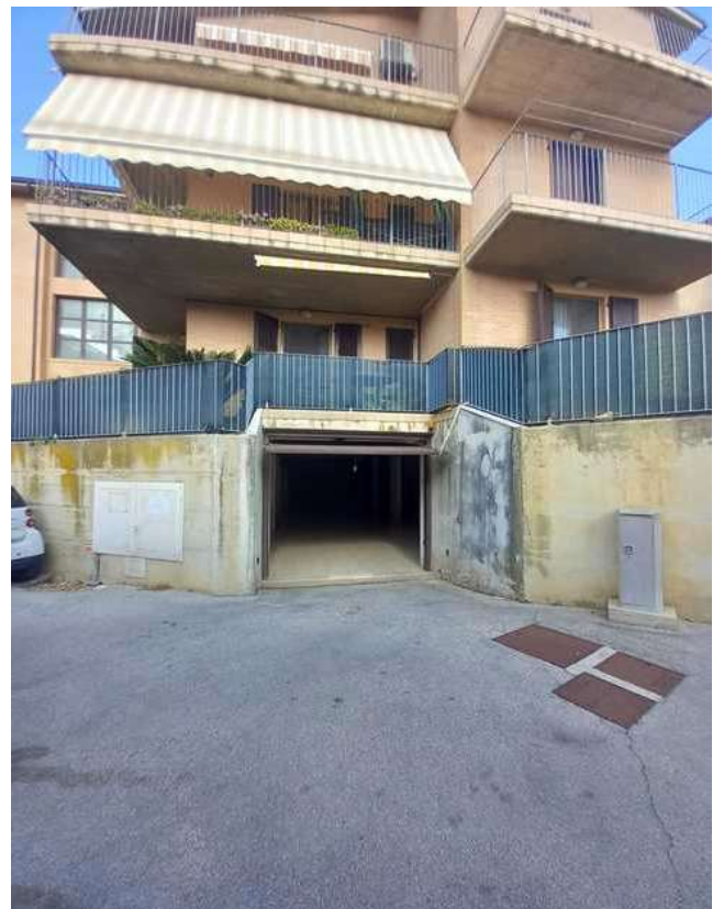
ACCESSO AL PIANO GARAGE