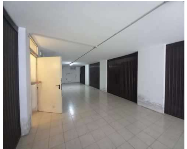
RAMPA DI ACCESSO AI GARAGE