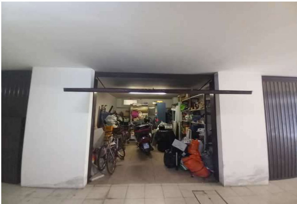
GARAGE SUB 24