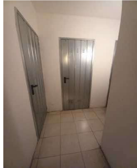
SPAZIO CONDIMINIALE - ACCESSO ALLE CANTINE