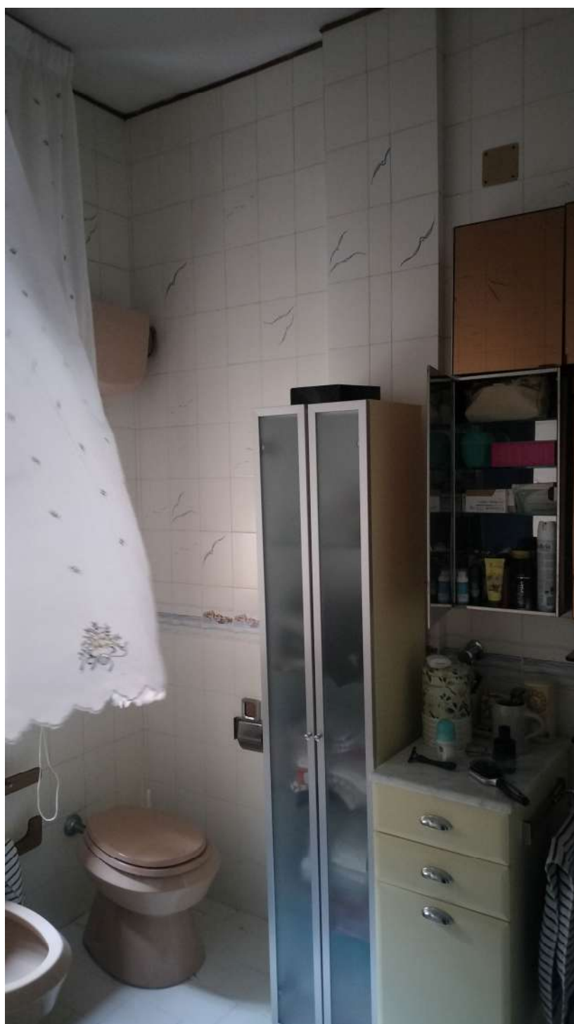
Foto n.13 LOTTO 2 Servizio igienico