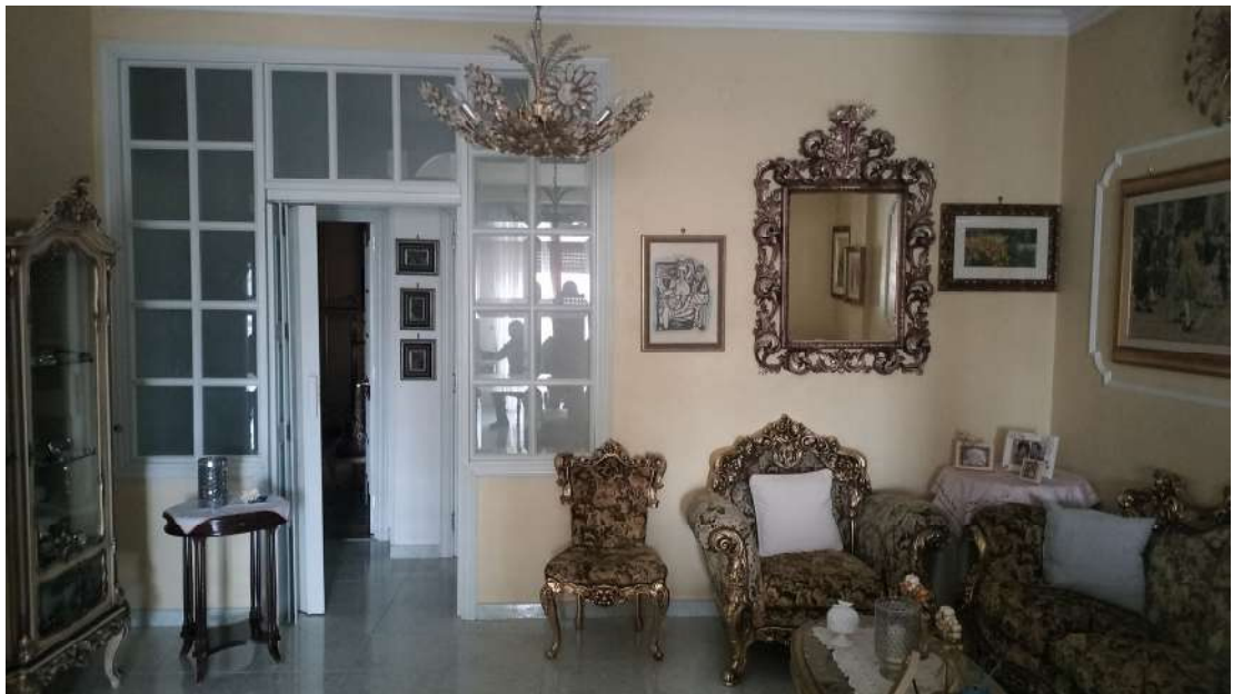
Foto n.10 LOTTO 2 soggiorno