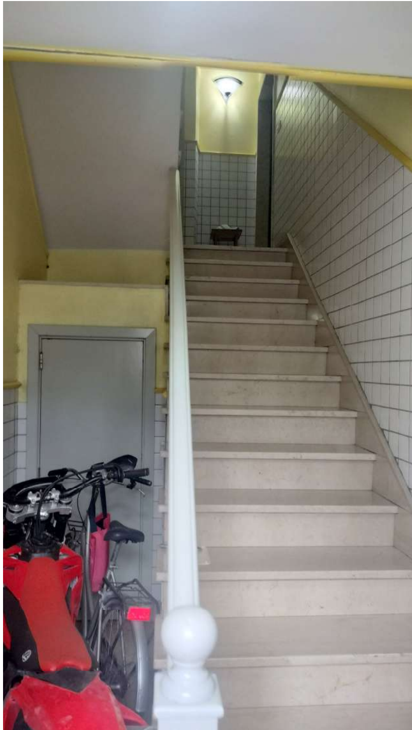
Foto n.2 Vano scala