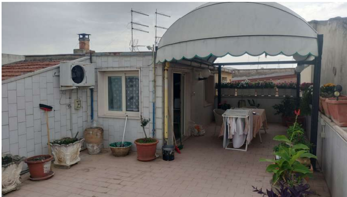
Foto n.17 Volume e terrazzo terzo piano