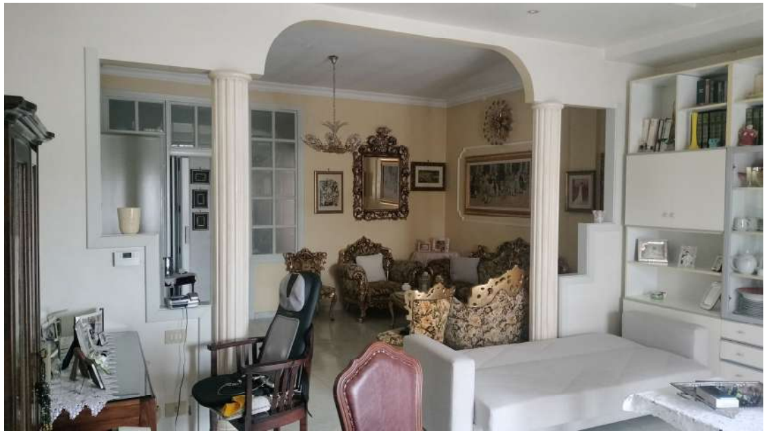
Foto n.8 LOTTO 2 soggiorno - pranzo