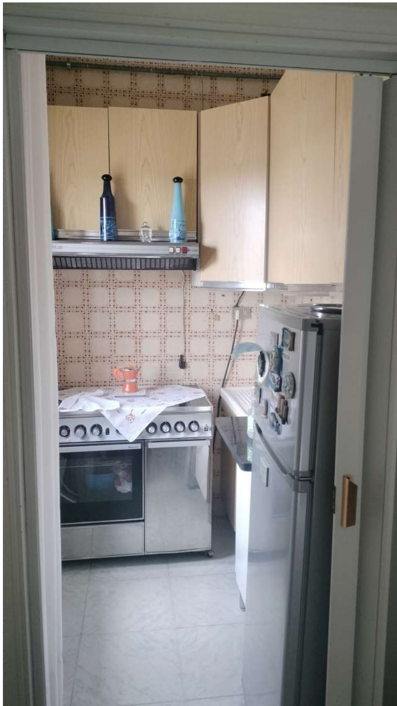
Foto n.11 LOTTO 2 Tinello