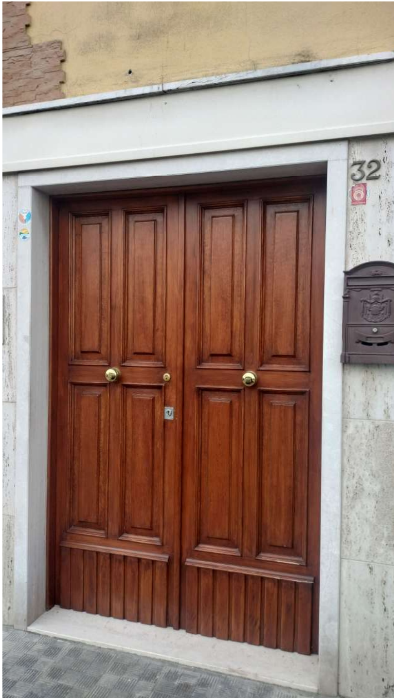
Foto n.1 Ingresso su strada pubblica