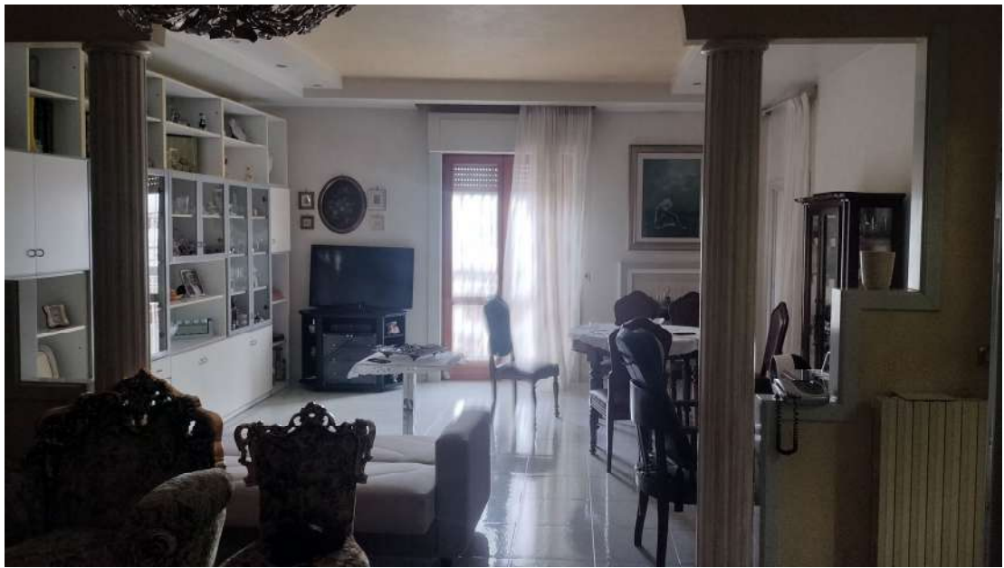
Foto n.9 LOTTO 2 ingresso - pranzo