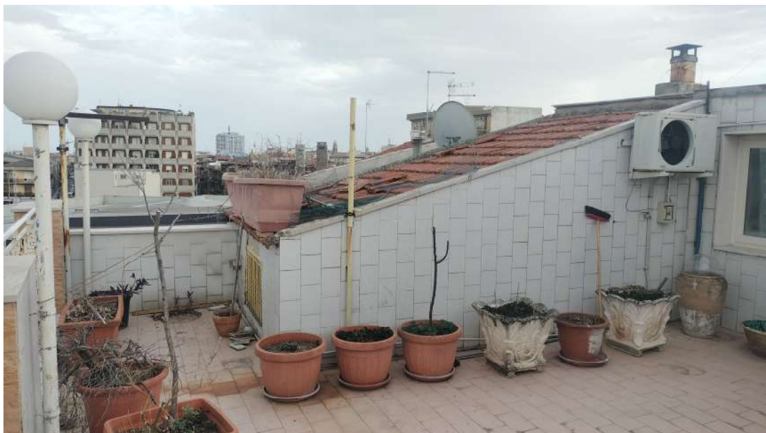
Foto n.18 Volume e terrazzo terzo piano