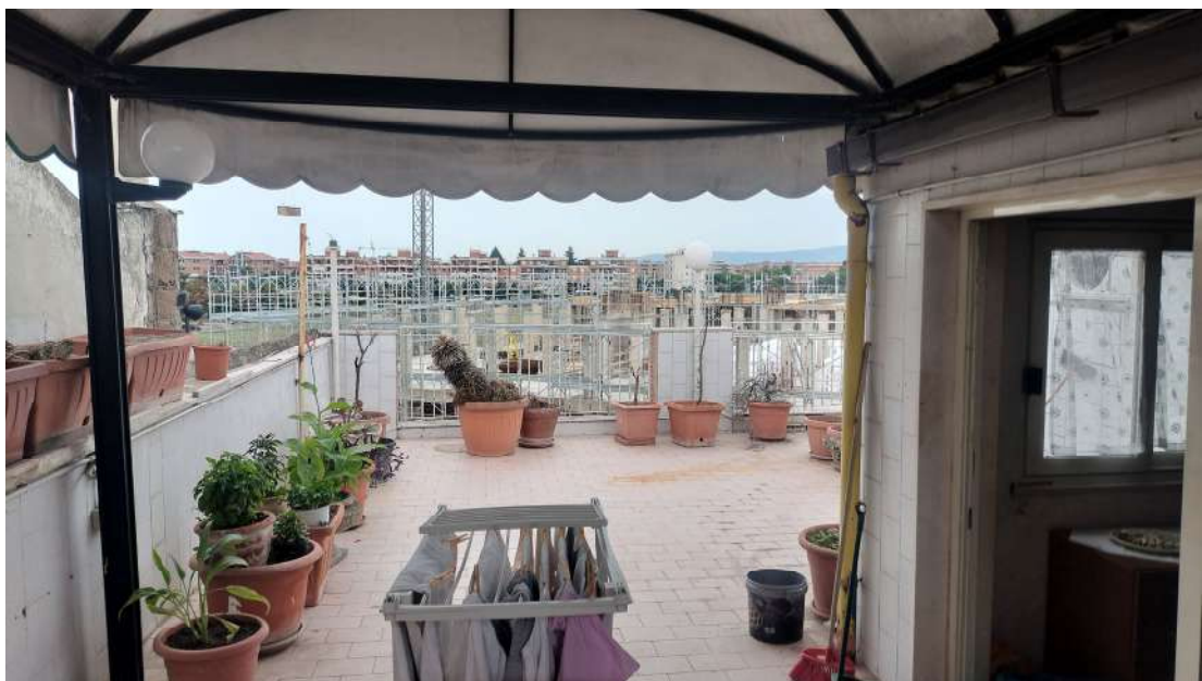
Foto n.19 Terrazzo terzo piano