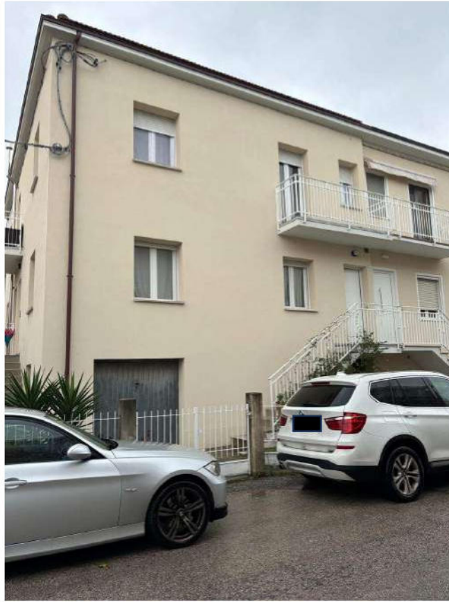
FOTO 1- PROSPETTO INGRESSO SUB.3 VIA STOPPANI