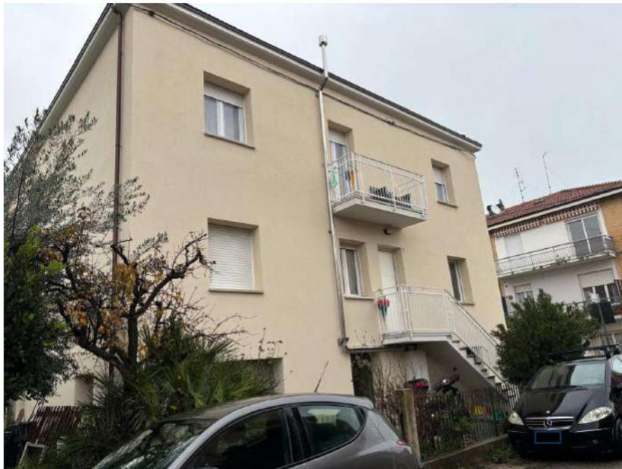
FOTO 2- PROSPETTO INGRESSO SUB.2 VIA BONFANTE