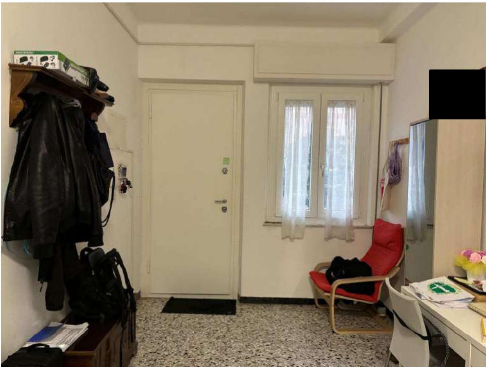
FOTO 6 - INGRESSO - APPARTAMENTO SUB.2 PIANO PRIMO