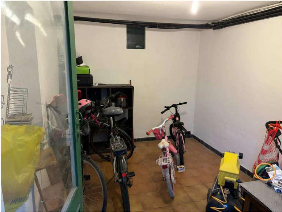
FOTO 5 - LOCALE ACCESSORIO PT