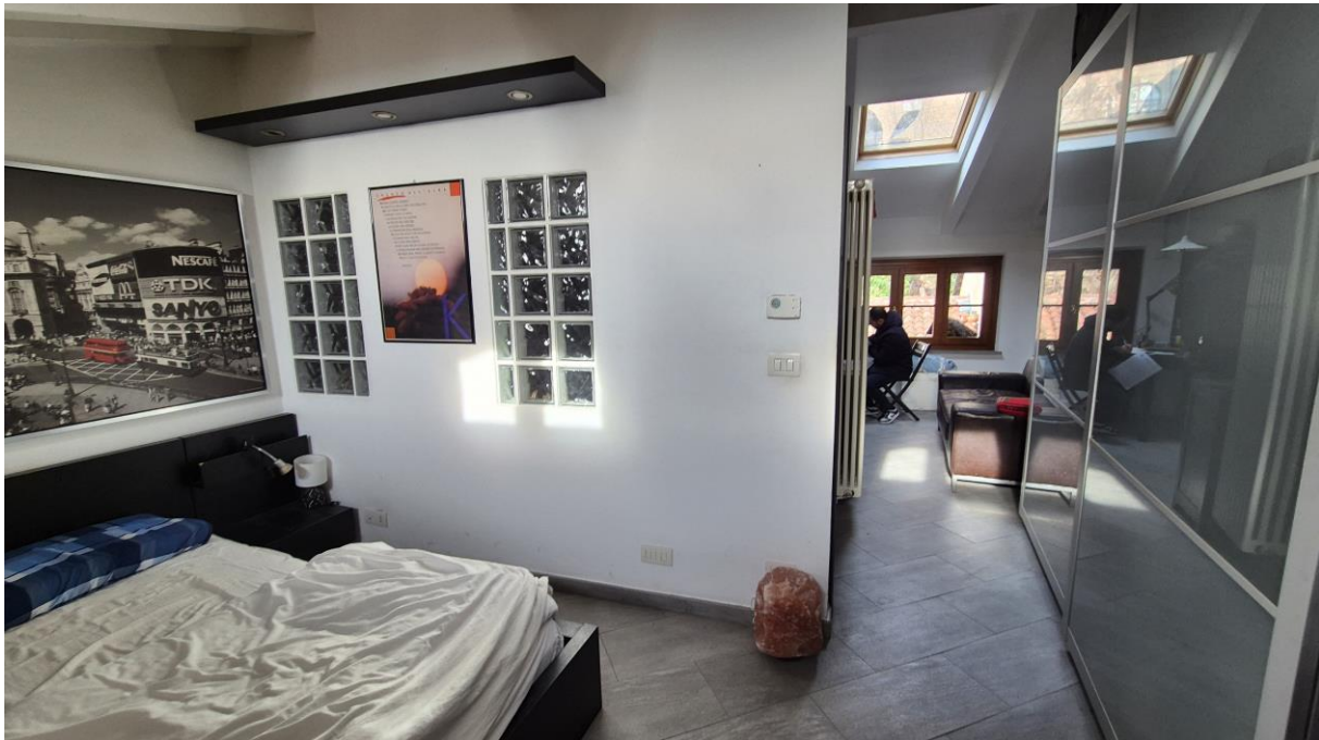
Piano Terzo Sottotetto camera/zona notte

STUDIO TECNICO SORASIO Geom. Alessandro Piazza del Popolo n. 42, 12038 Savigliano (CN) C.F.: SRS LSN 86H19 I470K - P.Iva: 03433490046 Tel: 0172.370883 – Cell: 3348786070 mail: studiosorasio@gmail.com pec: alessandro.sorasio@geopec.it