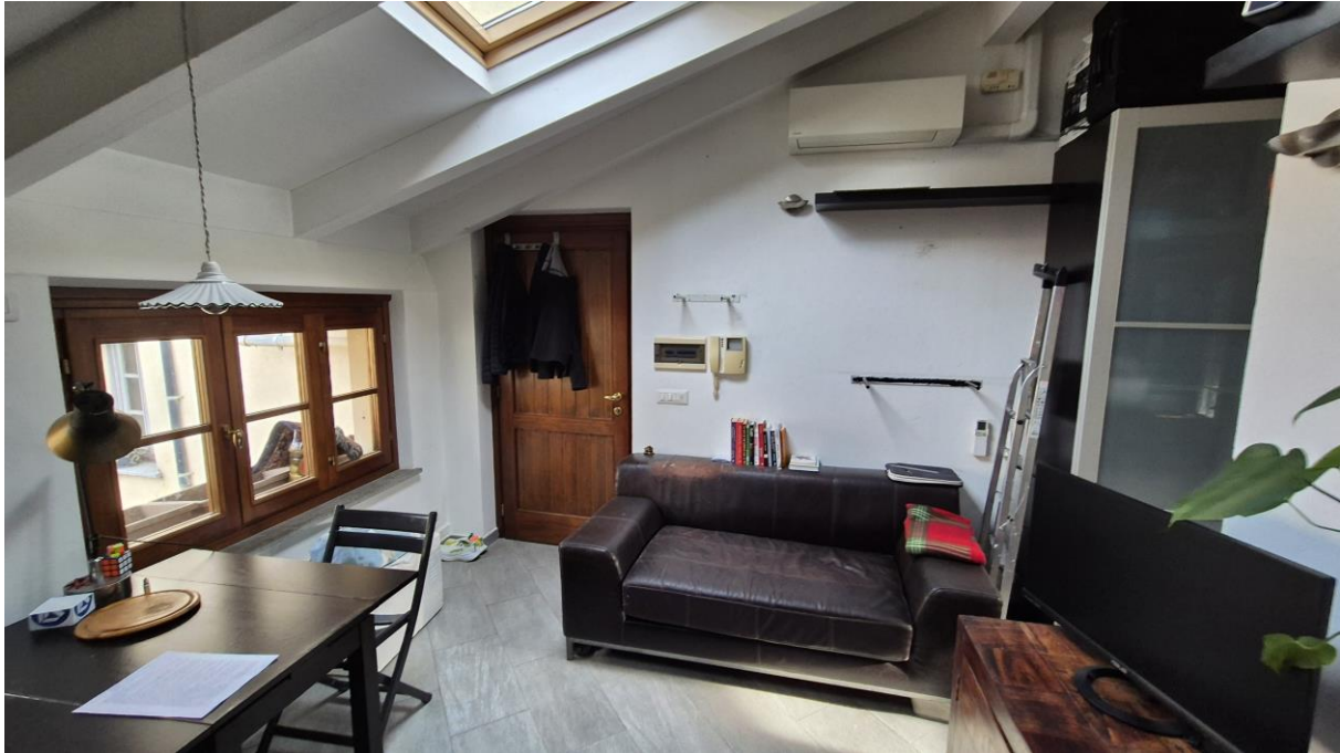
Piano Terzo Sottotetto zona soggiorno/cucina