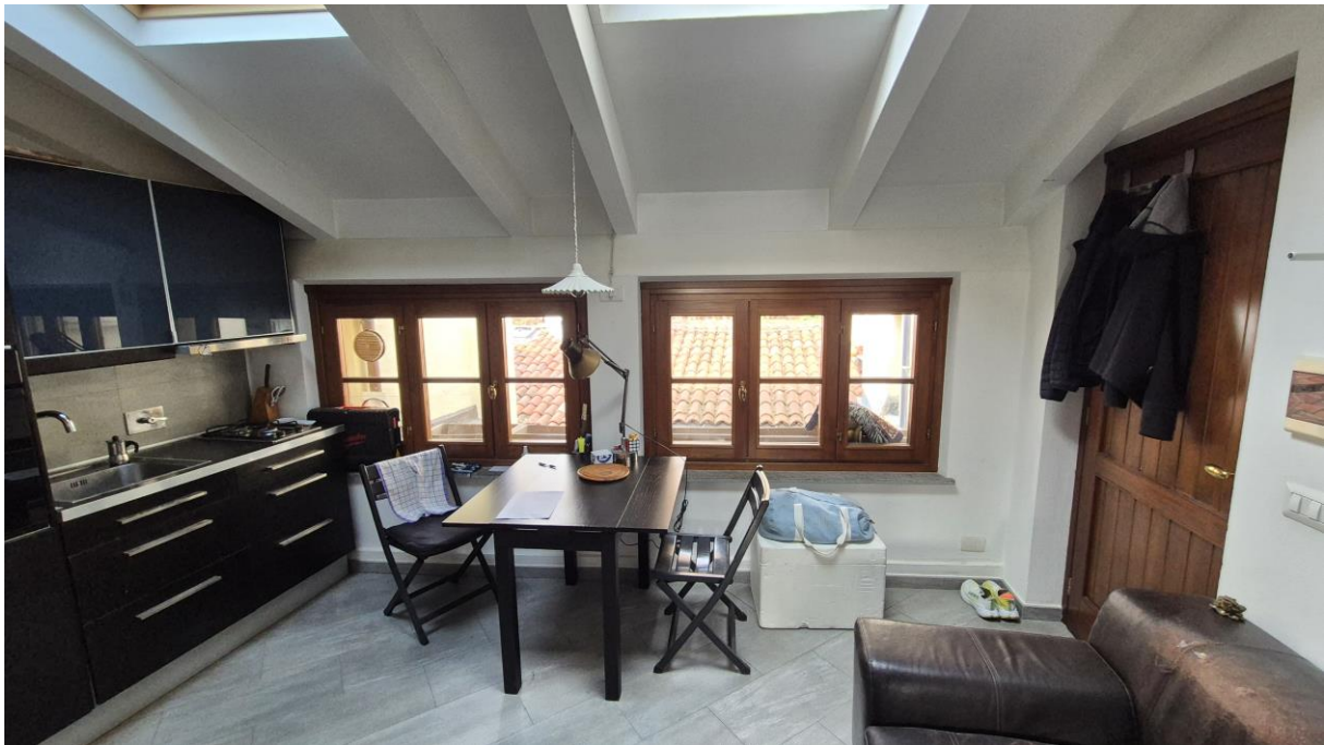
Piano Terzo Sottotetto zona soggiorno/cucina

STUDIO TECNICO SORASIO Geom. Alessandro Piazza del Popolo n. 42, 12038 Savigliano (CN) C.F.: SRS LSN 86H19 I470K - P.Iva: 03433490046 Tel: 0172.370883 – Cell: 3348786070 mail: studiosorasio@gmail.com pec: alessandro.sorasio@geopec.it