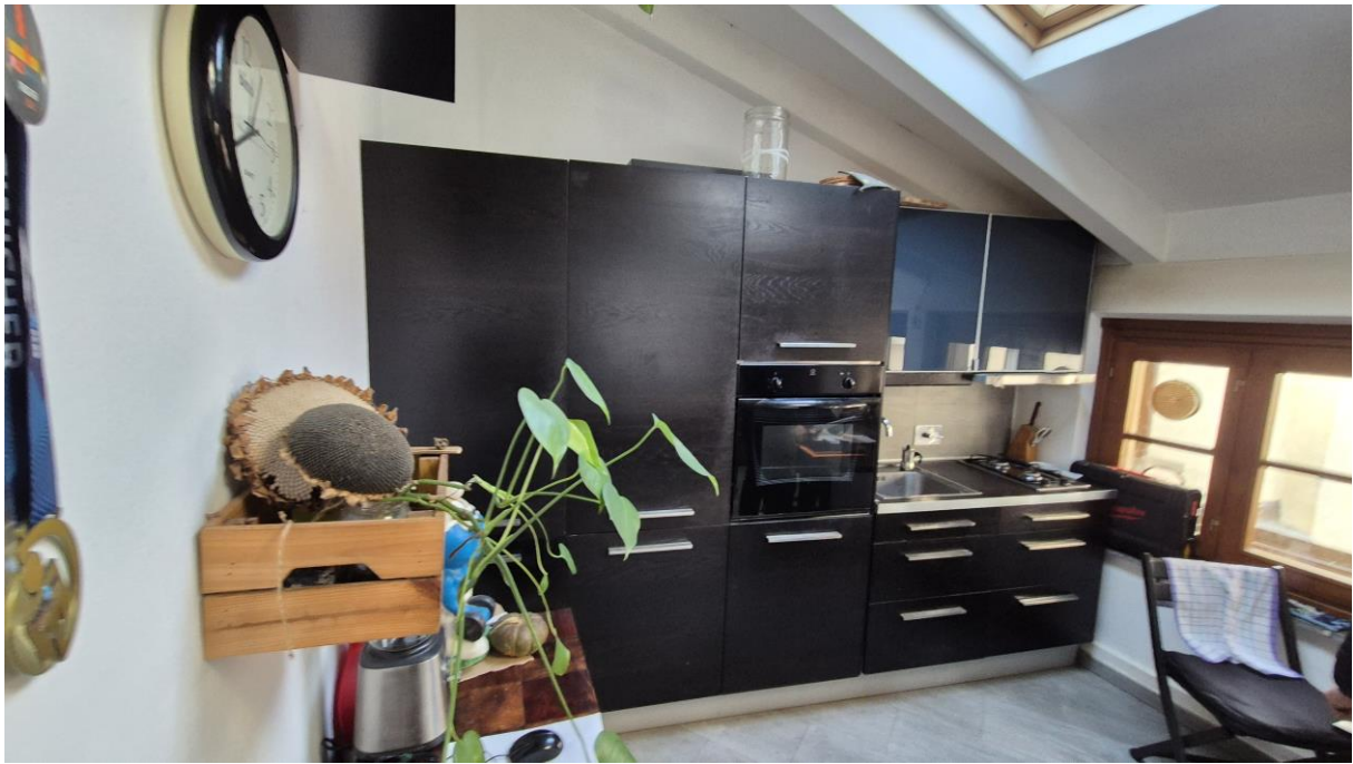
Piano Terzo Sottotetto zona soggiorno/cucina