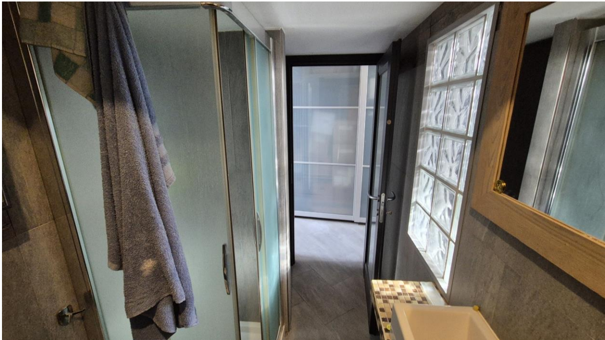
Piano Terzo Sottotetto bagno

STUDIO TECNICO SORASIO Geom. Alessandro Piazza del Popolo n. 42, 12038 Savigliano (CN) C.F.: SRS LSN 86H19 I470K - P.Iva: 03433490046 Tel: 0172.370883 – Cell: 3348786070 mail: studiosorasio@gmail.com pec: alessandro.sorasio@geopec.it