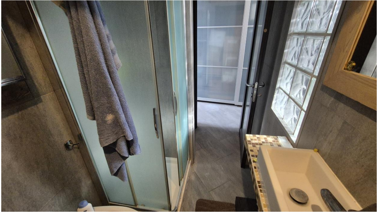
Piano Terzo Sottotetto bagno