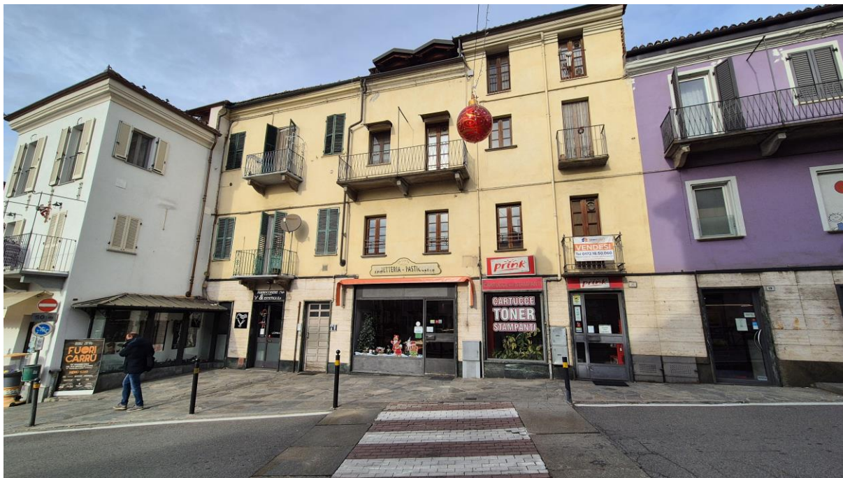
vista esterna del fabbricato condominiale