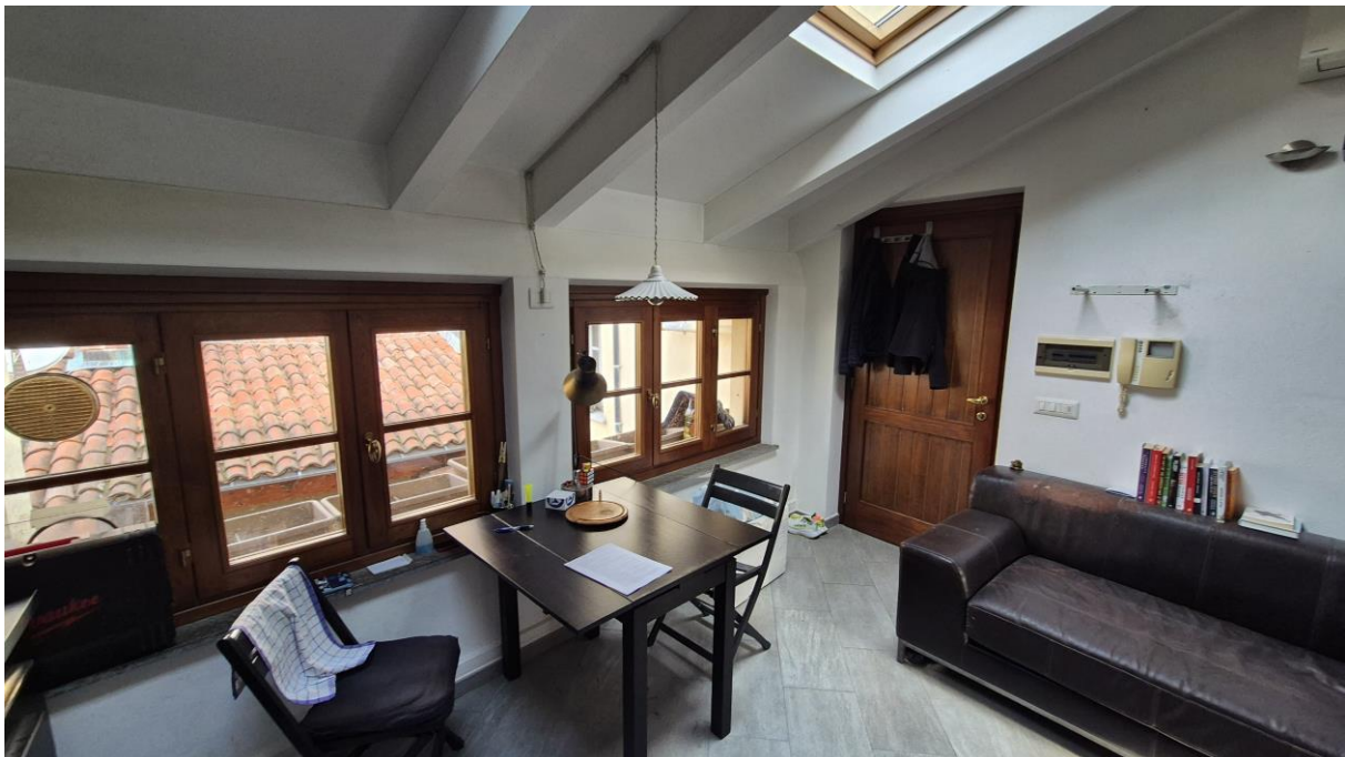
Piano Terzo Sottotetto zona soggiorno/cucina

STUDIO TECNICO SORASIO Geom. Alessandro Piazza del Popolo n. 42, 12038 Savigliano (CN) C.F.: SRS LSN 86H19 I470K - P.Iva: 03433490046 Tel: 0172.370883 – Cell: 3348786070 mail: studiosorasio@gmail.com pec: alessandro.sorasio@geopec.it