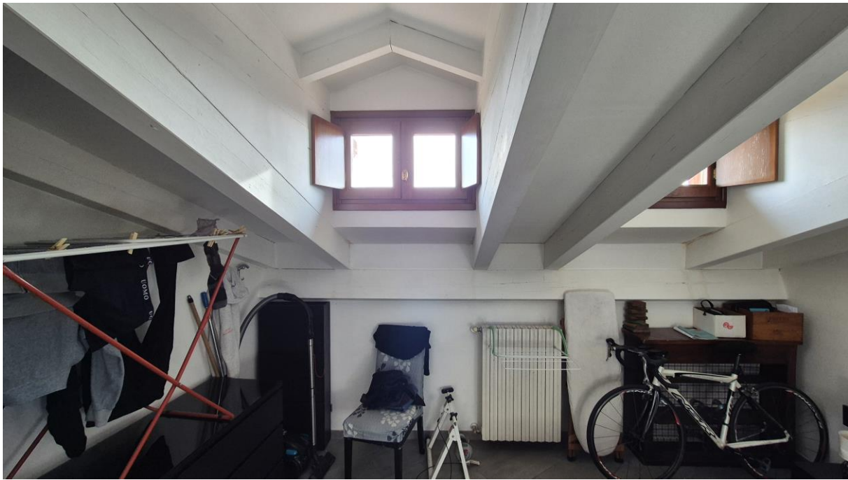
Piano Terzo Sottotetto camera/zona notte