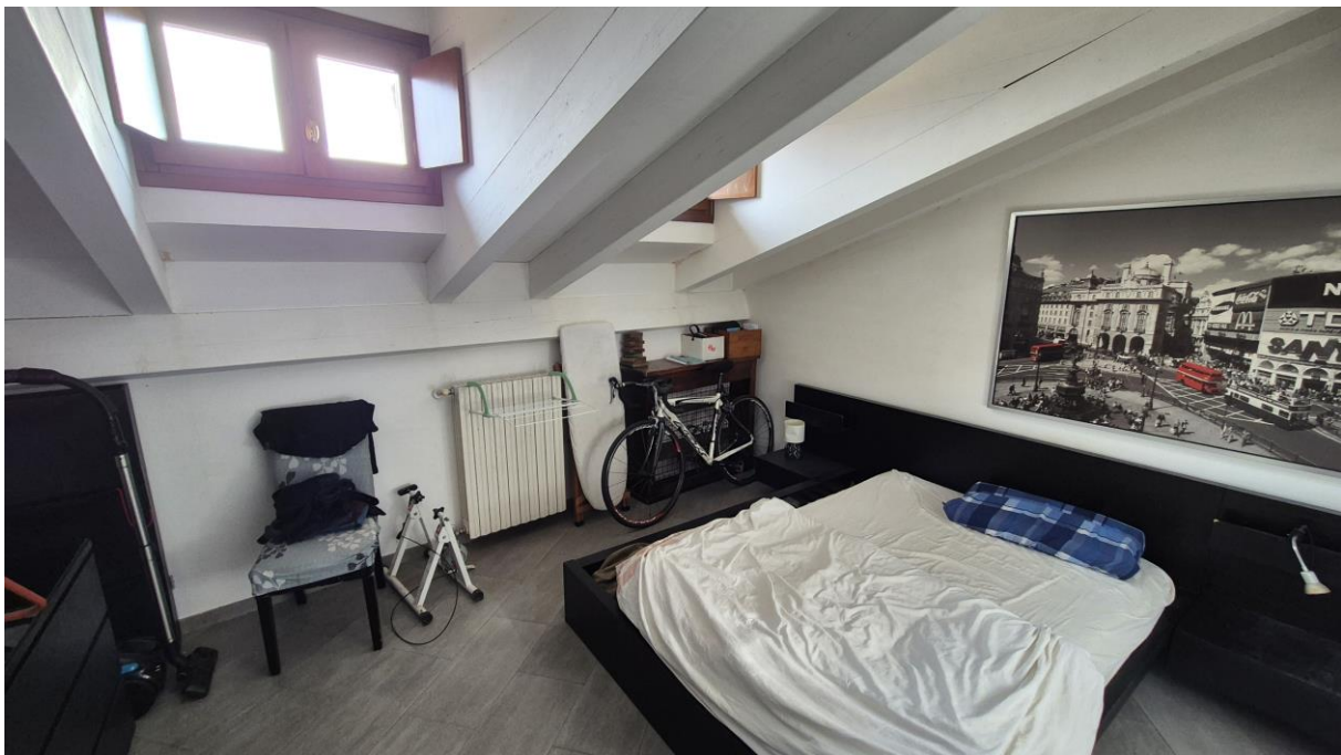
Piano Terzo Sottotetto camera/zona notte

STUDIO TECNICO SORASIO Geom. Alessandro Piazza del Popolo n. 42, 12038 Savigliano (CN) C.F.: SRS LSN 86H19 I470K - P.Iva: 03433490046 Tel: 0172.370883 – Cell: 3348786070 mail: studiosorasio@gmail.com pec: alessandro.sorasio@geopec.it