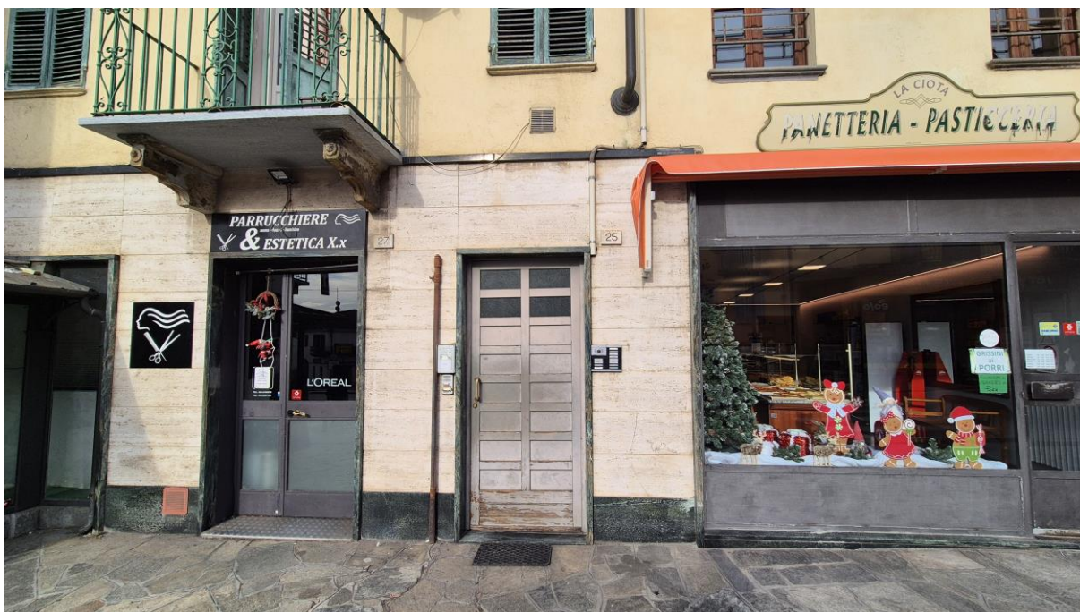
vista esterna del fabbricato con individuazione ingresso comune al civico 25 di via G. Marconi

STUDIO TECNICO SORASIO Geom. Alessandro Piazza del Popolo n. 42, 12038 Savigliano (CN) C.F.: SRS LSN 86H19 I470K - P.Iva: 03433490046 Tel: 0172.370883 – Cell: 3348786070 mail: studiosorasio@gmail.com pec: alessandro.sorasio@geopec.it