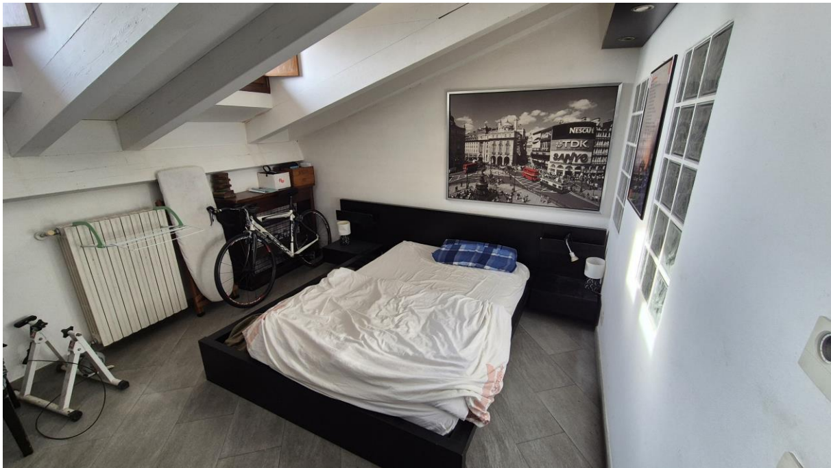
Piano Terzo Sottotetto camera/zona notte