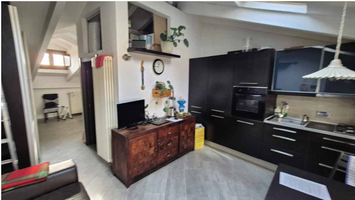
Piano Terzo Sottotetto zona soggiorno/cucina

STUDIO TECNICO SORASIO Geom. Alessandro Piazza del Popolo n. 42, 12038 Savigliano (CN) C.F.: SRS LSN 86H19 I470K - P.Iva: 03433490046 Tel: 0172.370883 – Cell: 3348786070 mail: studiosorasio@gmail.com pec: alessandro.sorasio@geopec.it