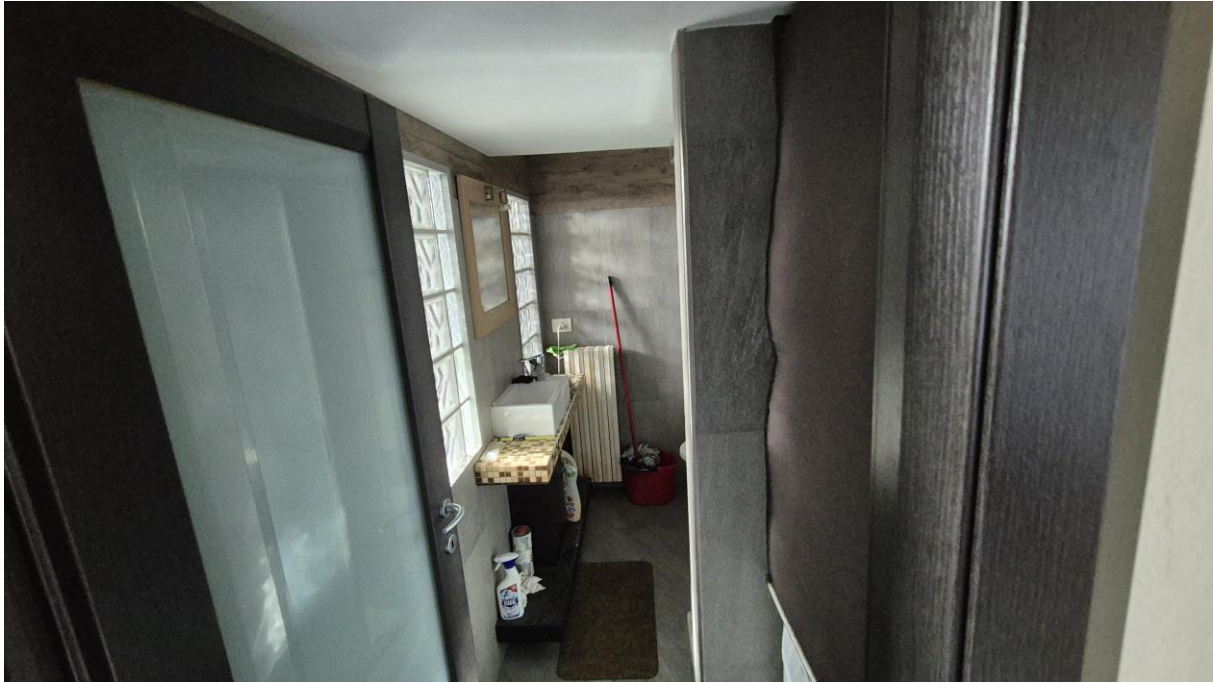
Piano Terzo Sottotetto bagno