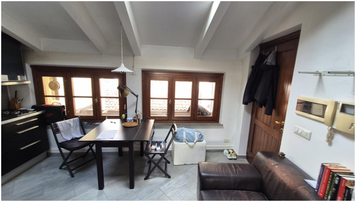
Piano Terzo Sottotetto zona soggiorno/cucina