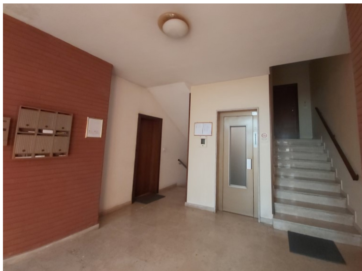
Portoncino d'ingresso all'alloggio.