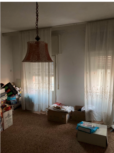
STANZA 1 - P2