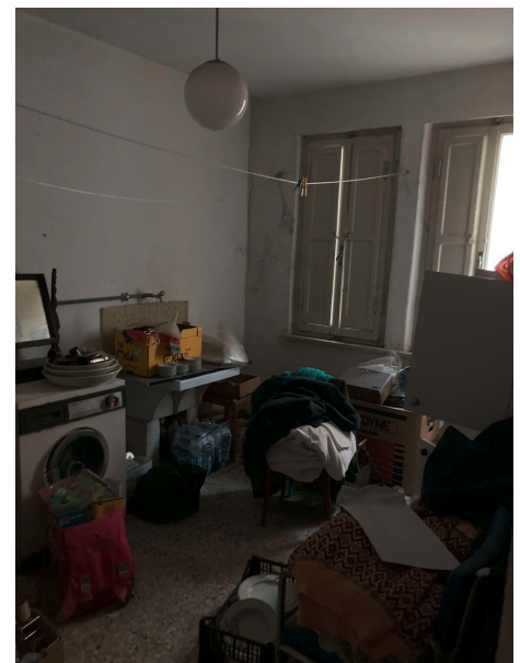
STANZA 2 - P2