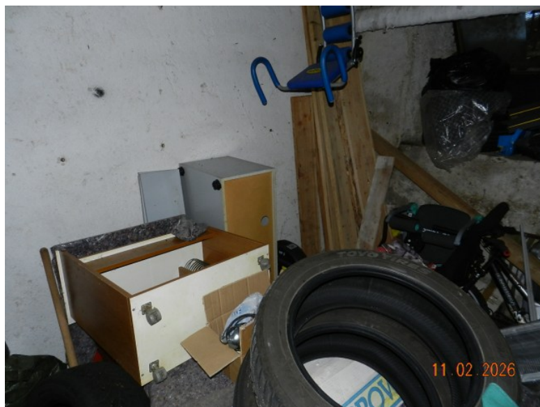
ALTRA VISTA DEL LOCALE INTERRATO