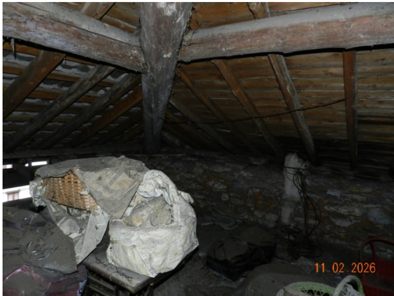
UNA VISTA DEL SOLAIO