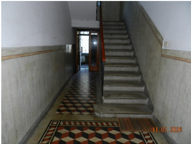
IL VANO SCALE