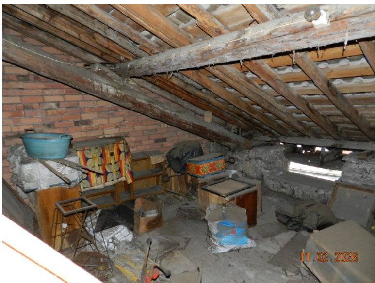
ULTIMA VIISTA SOTTOTETTO

Descrizione: Magazzini e locali di deposito [C2] di cui al corpo CORPO C - DEPOSITO MAPP 2411 SUB 710 VIA MAURO CODUSSI 16