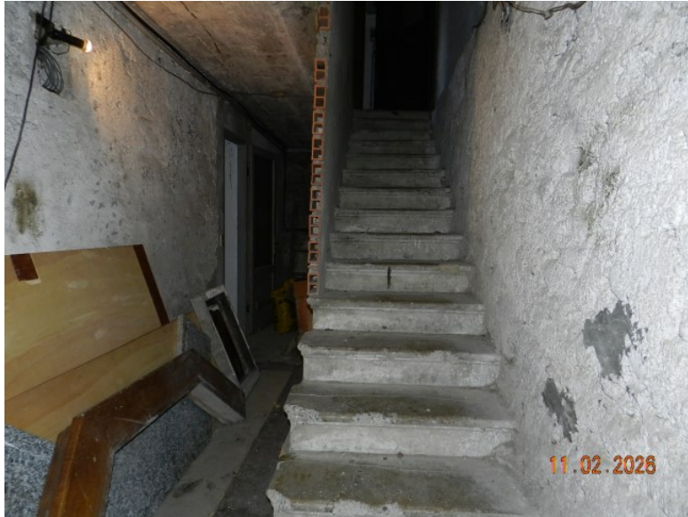
ALTRA VISTA DELLA SCALA