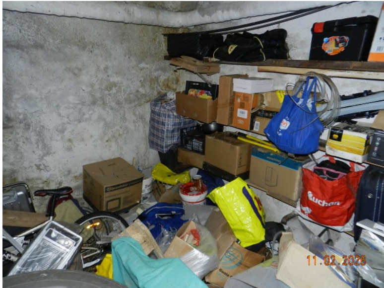
UNA VEDUTA DEL LOCALE