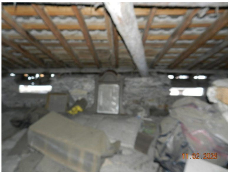
ALTRA VISTA SOLAIO