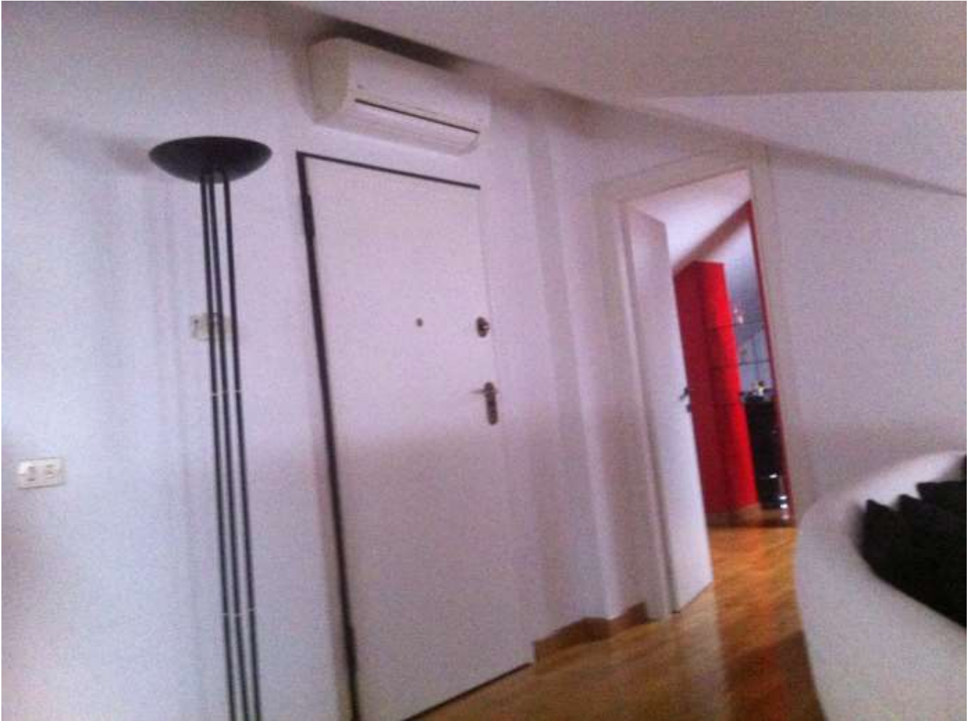
FOTO N. 15 vista interna verso ingresso bagno