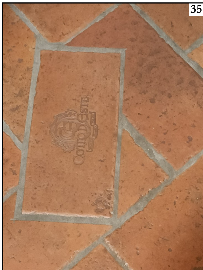
PAVIMENTAZIONE (COTTO D'ESTE)