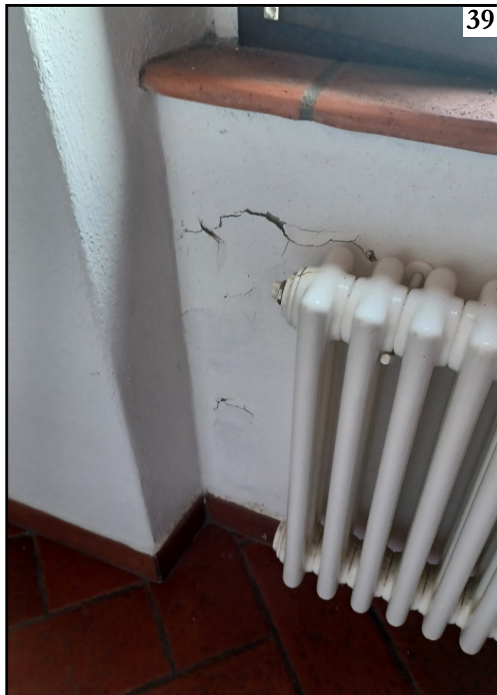
CREPA RADIATORE IN CORRIDOIO