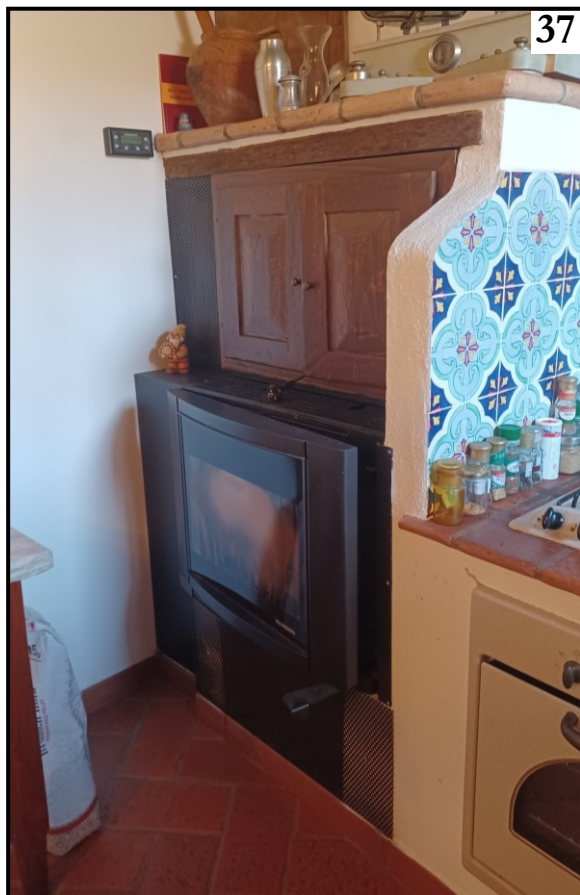
STUFA A PELLETT