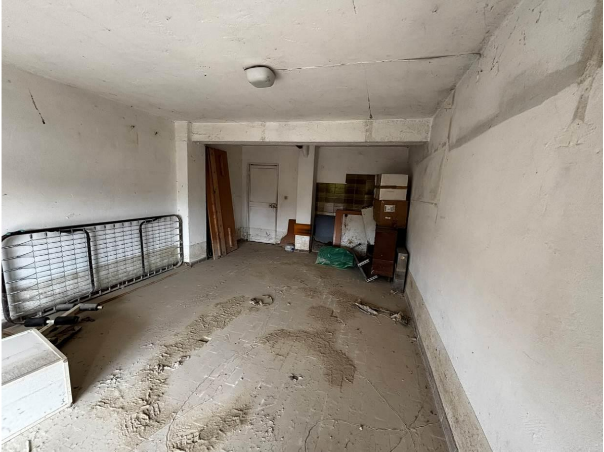
Garage – vista interna