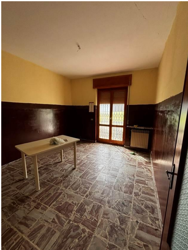
Cucina – Pranzo