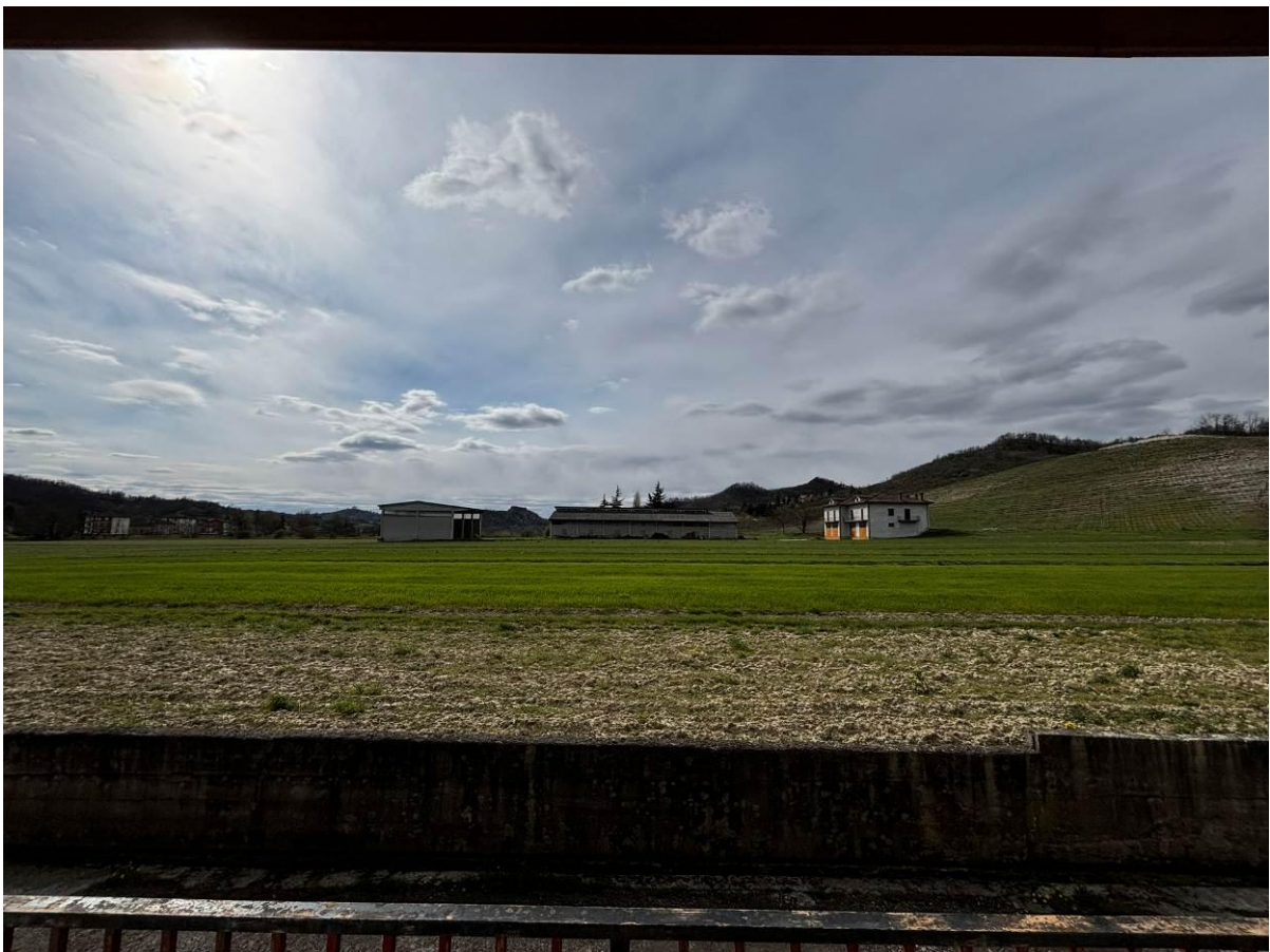
Vista del contest verso Gavi