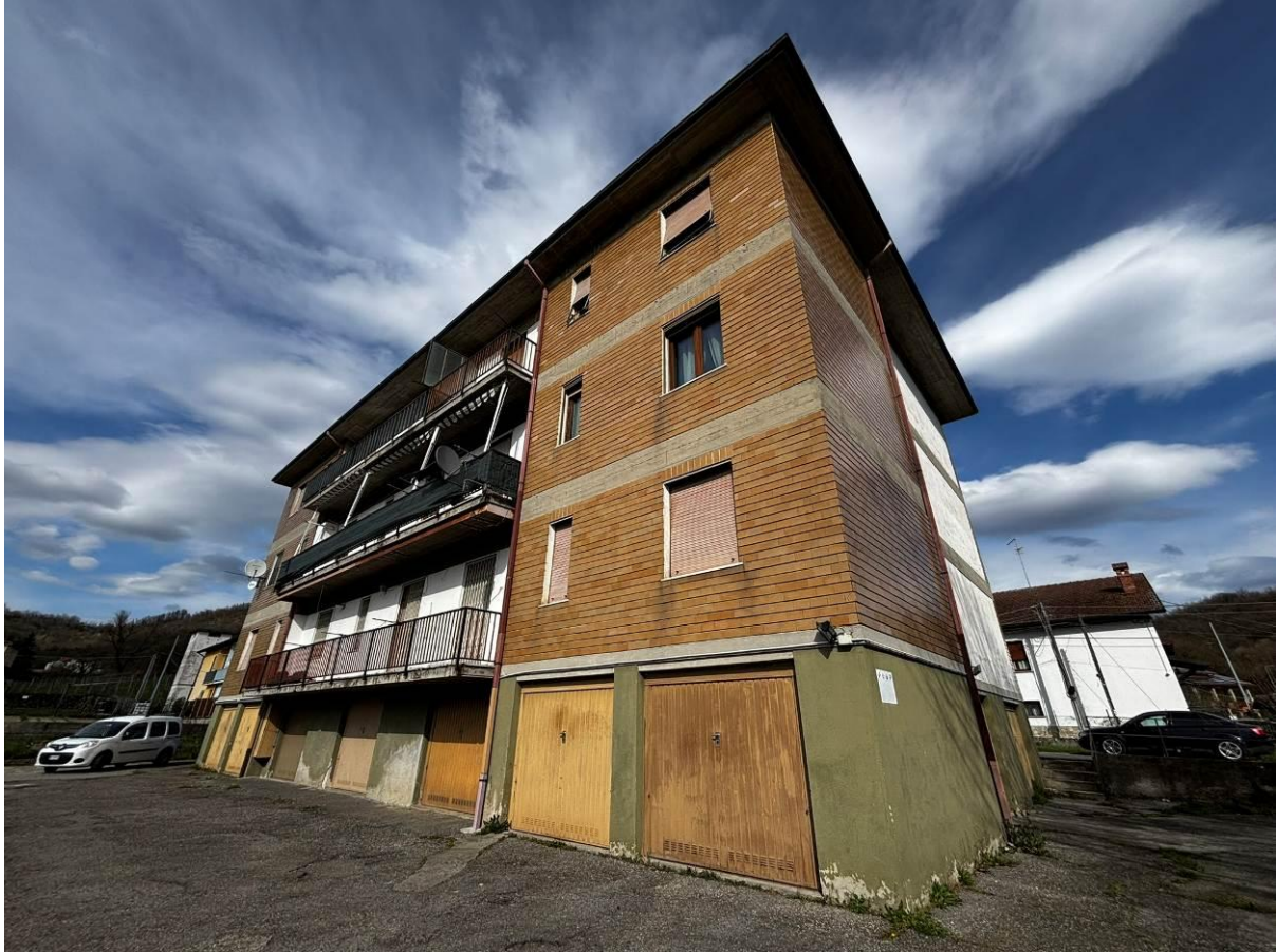
Vista posteriore dell'edificio e del piano garage