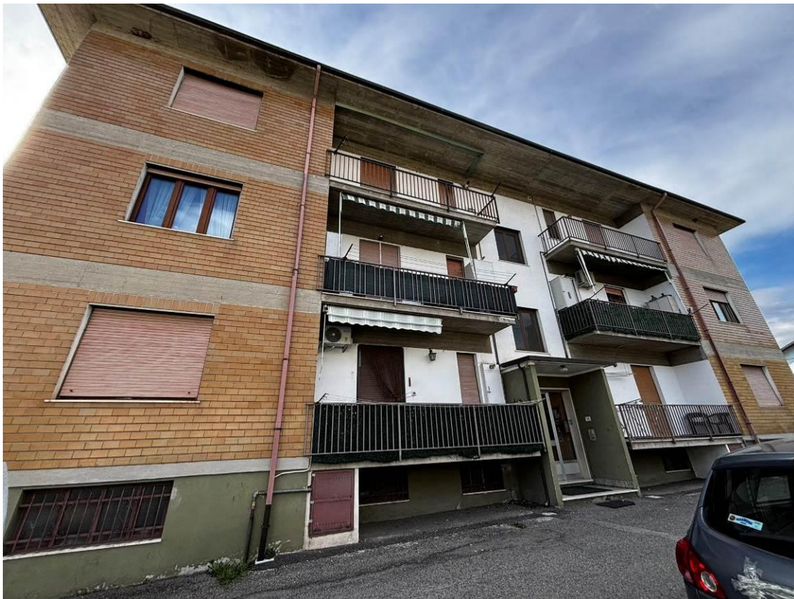
Vista generale dell'immobile dal cortile condominiale