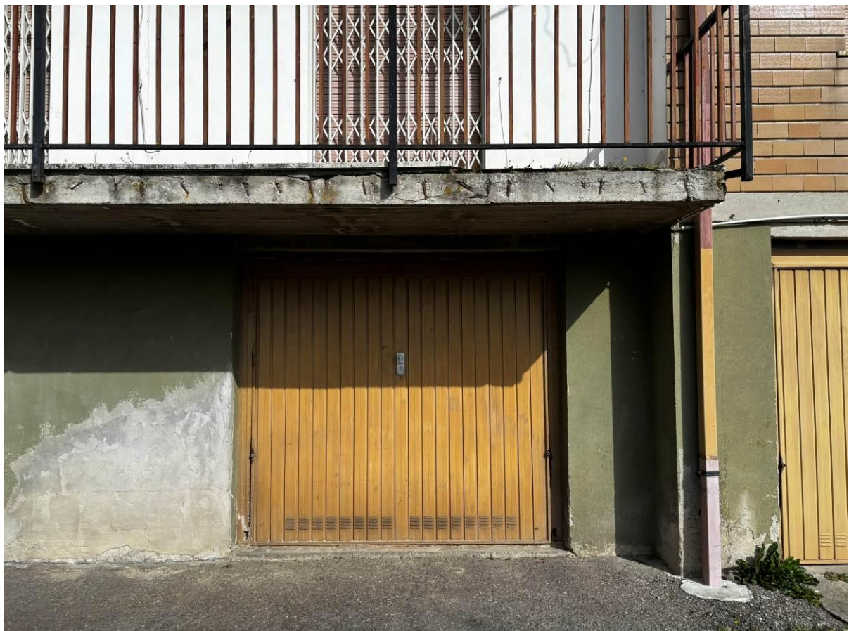
Garage – Piano seminterrato