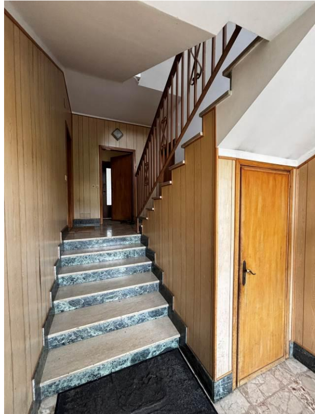
Vista interna del vano scala condominiale