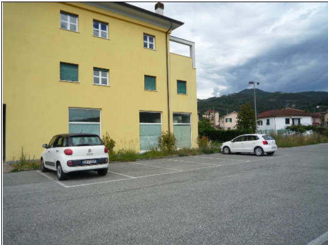
Foto n.1- Vista terreni