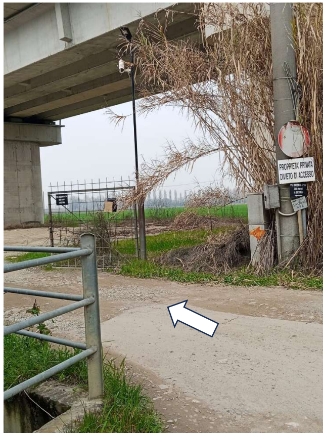
Accesso per raggiungere il fondo