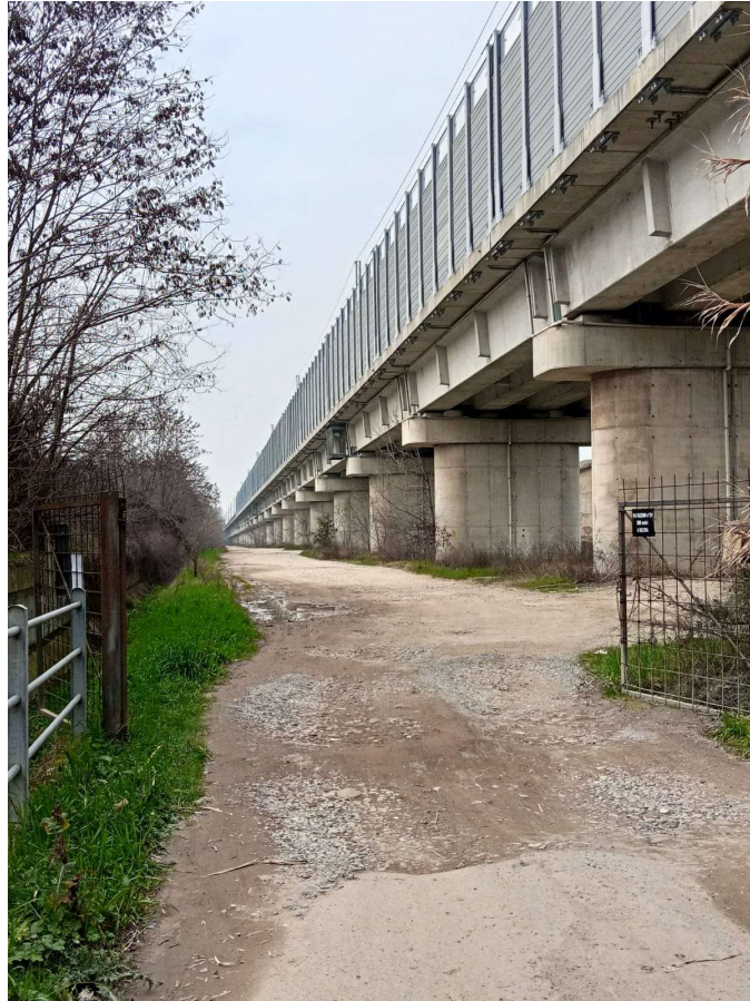
Accesso per raggiungere il fondo