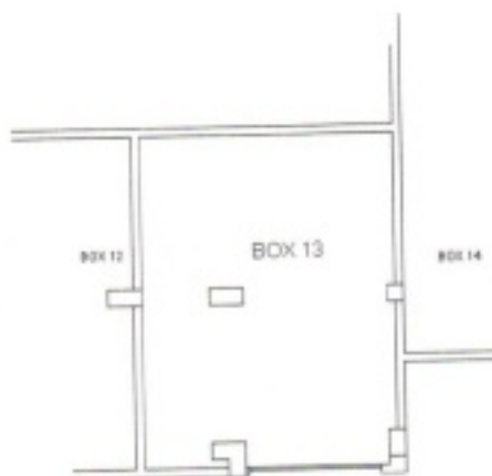
BOX PIANO S1 H=2,55 m