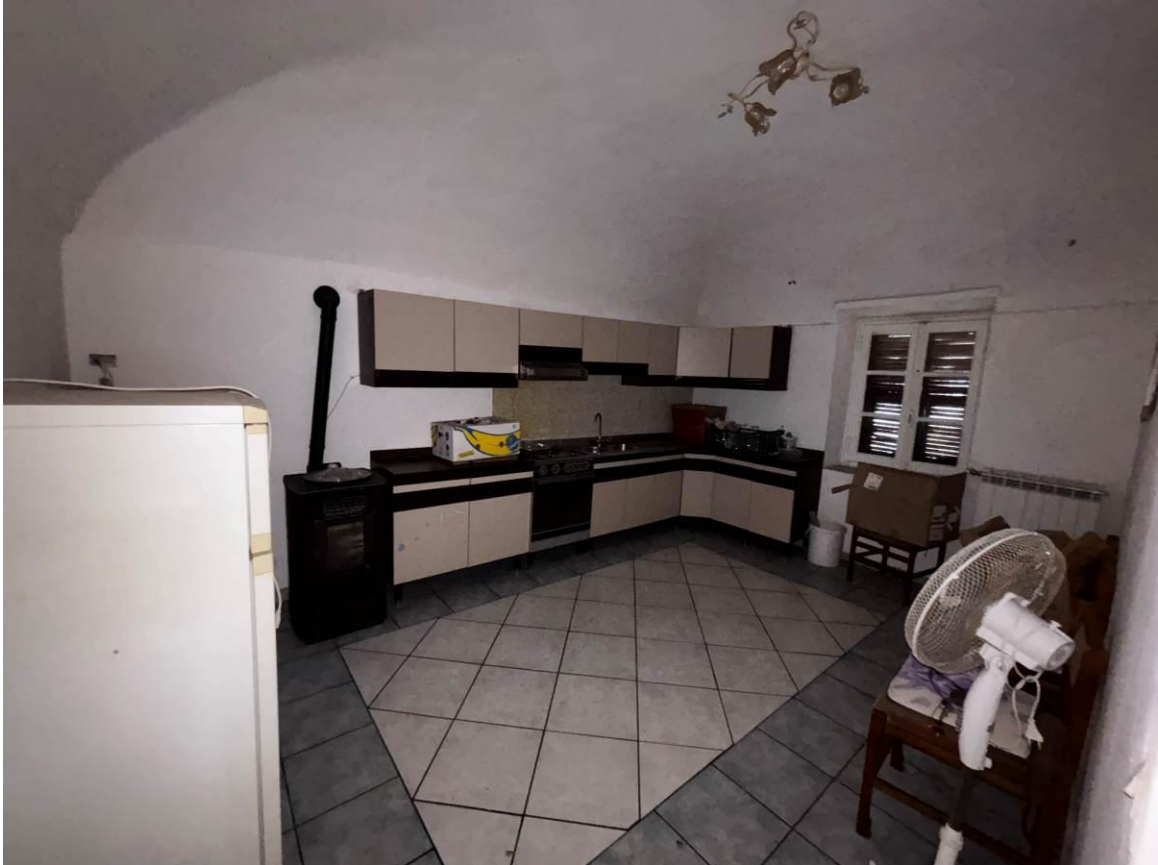
Cucina – Piano primo