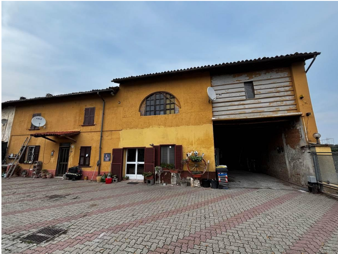
Vista generale dell'immobile dalla corte d'ingresso