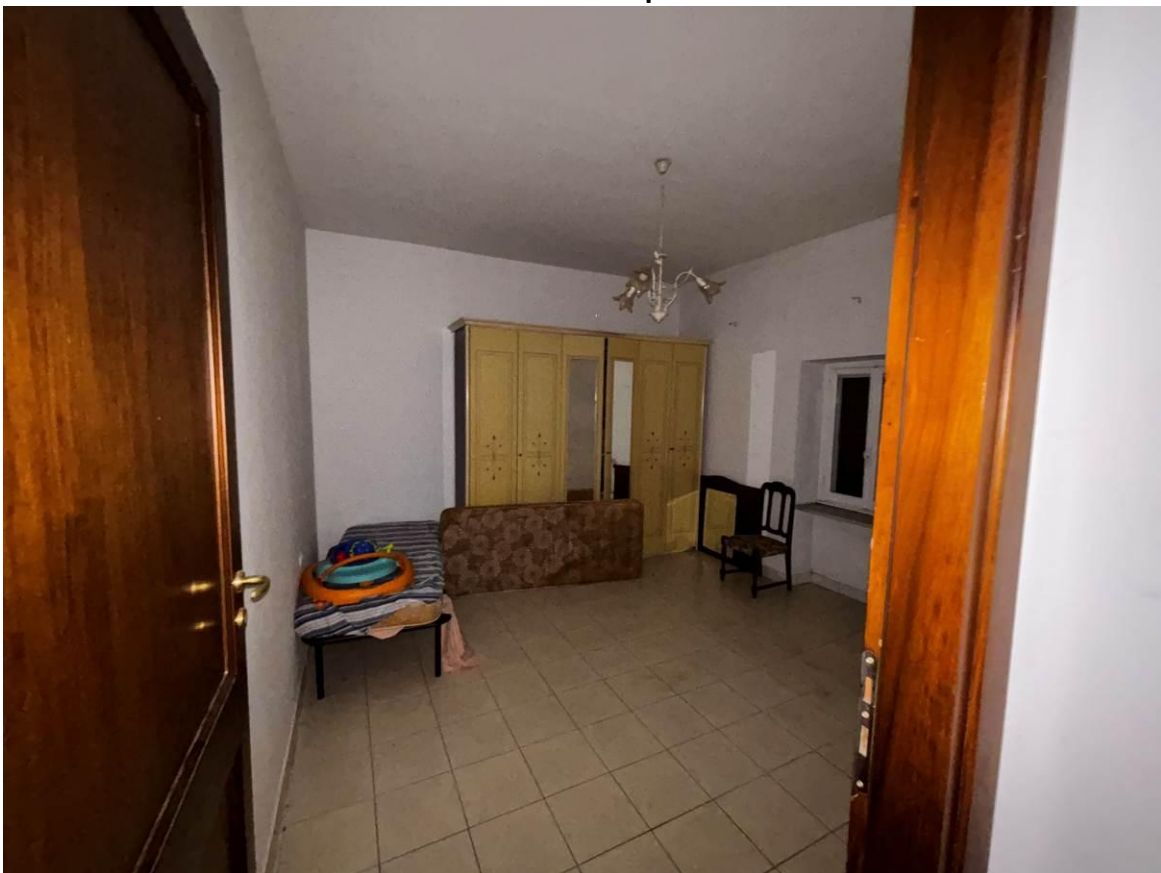
Camera – Piano primo