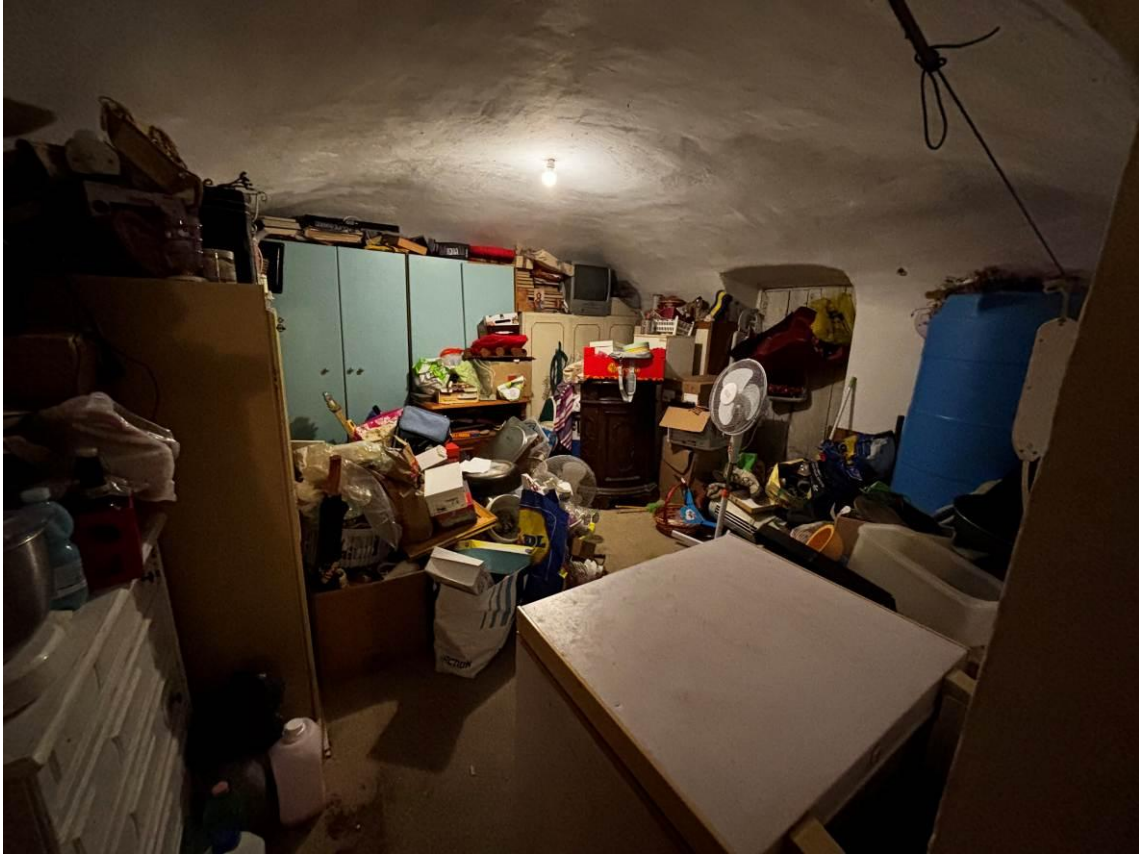
Ripostiglio – Piano terra