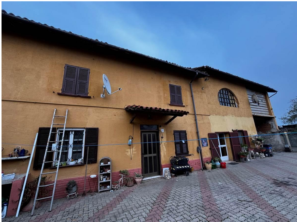
Vista generale dell'immobile dalla corte d'ingresso