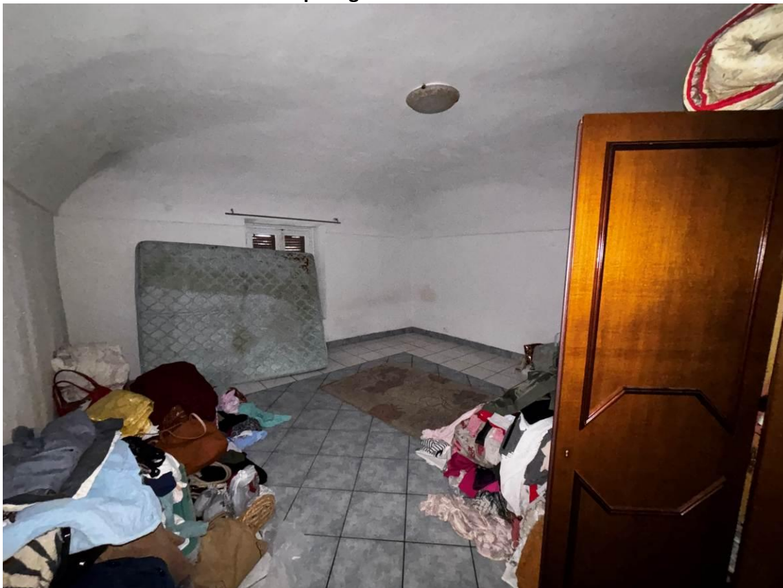
Camera – Piano primo