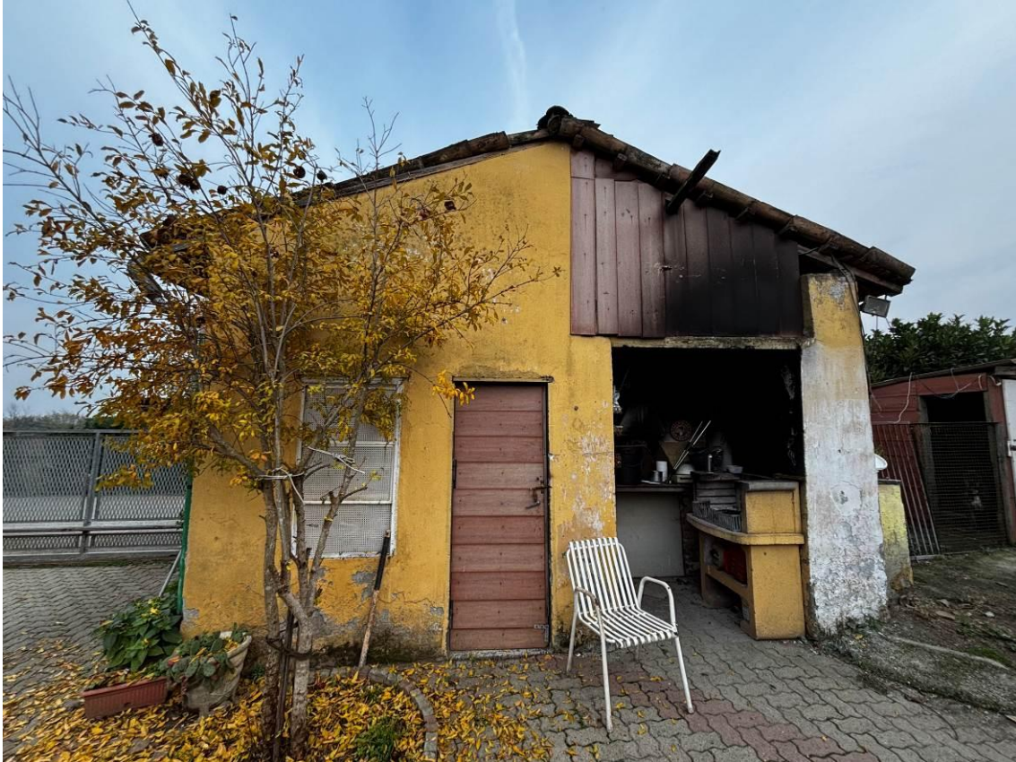
Ripostiglio e forno