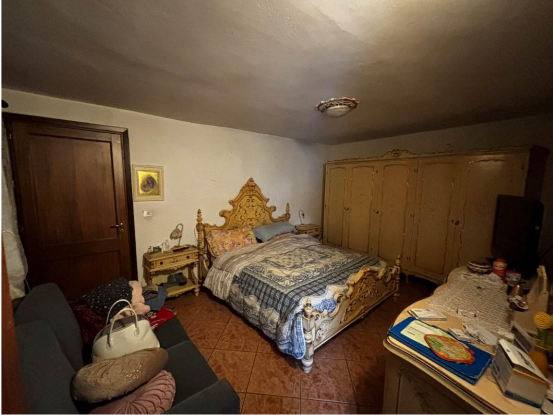
Camera – Piano terra