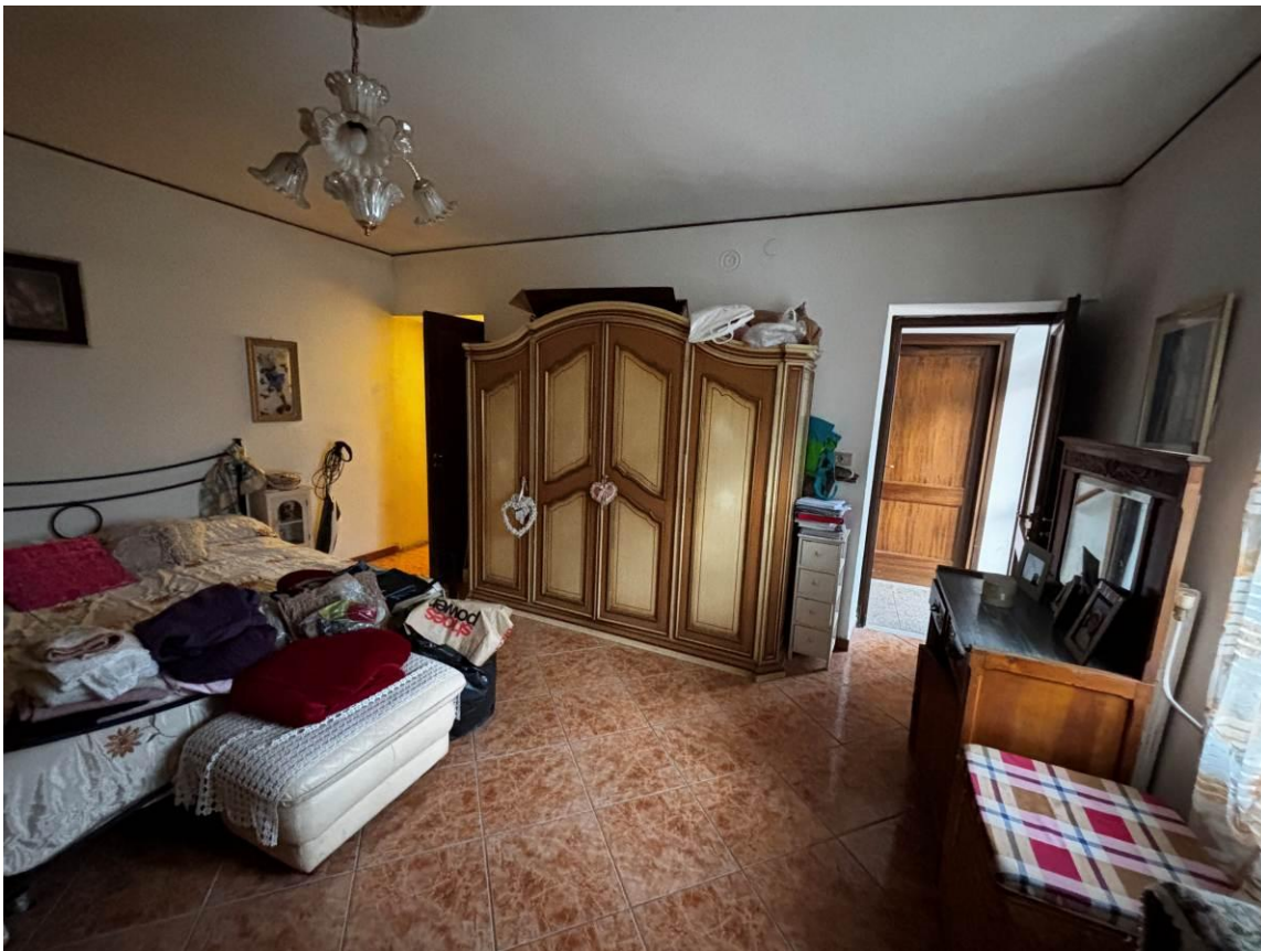
Camera – Piano terra