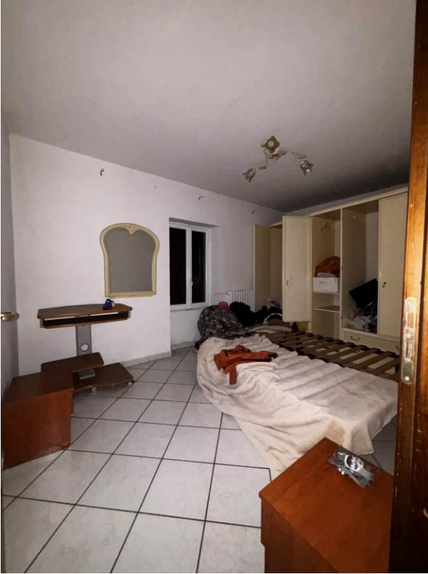
Camera – Piano primo