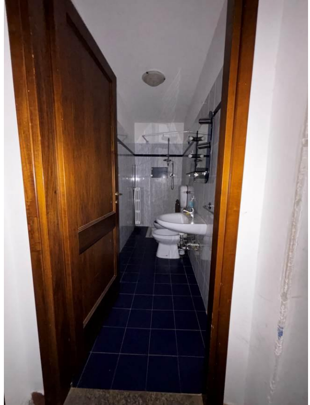
Bagno – Piano primo