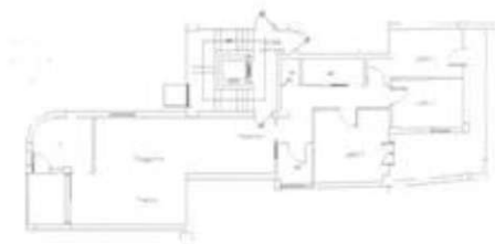
PIANO PRIMO H = 2,70