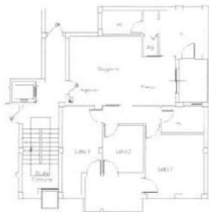
PIANO PRIMO H = 2.70