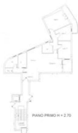
Planimetria catastale attuale