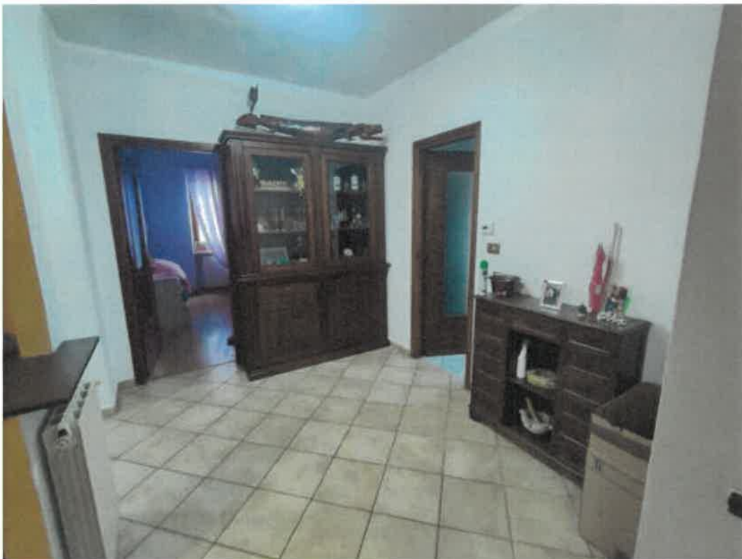
Vista particolare ripostiglio e zona disimpegno in piano primo