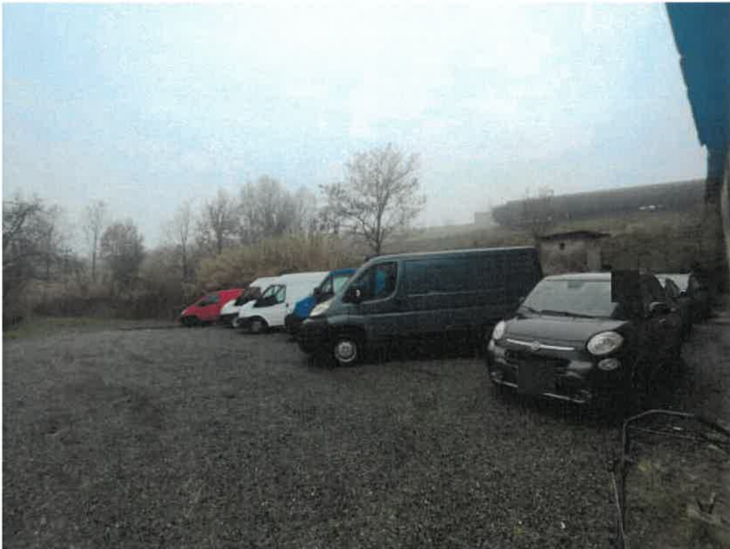
Vista della porzione di sedime posto sul fronte Nord in parte oggetto di esecuzione ed in parte in proprietà di terzi