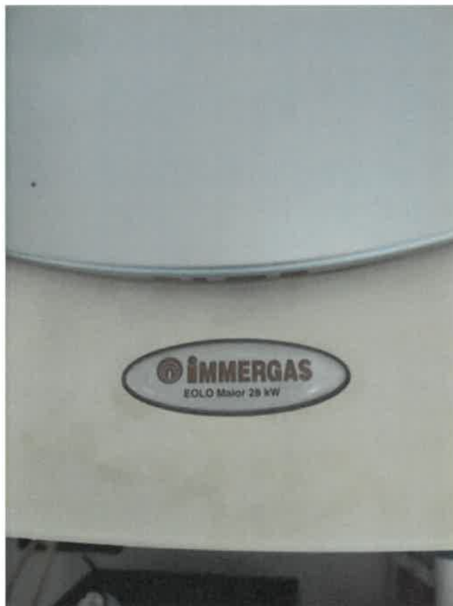
Vista particolare generatore impianto riscaldamento