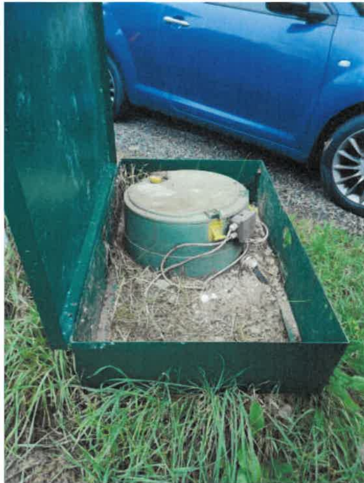
Vista particolare localizzazione impianto bombolone GPL