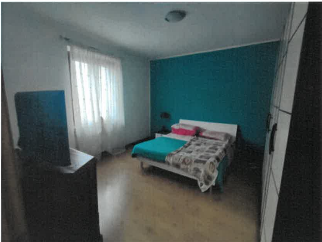
Vista particolare camera letto matrimoniale in piano primo