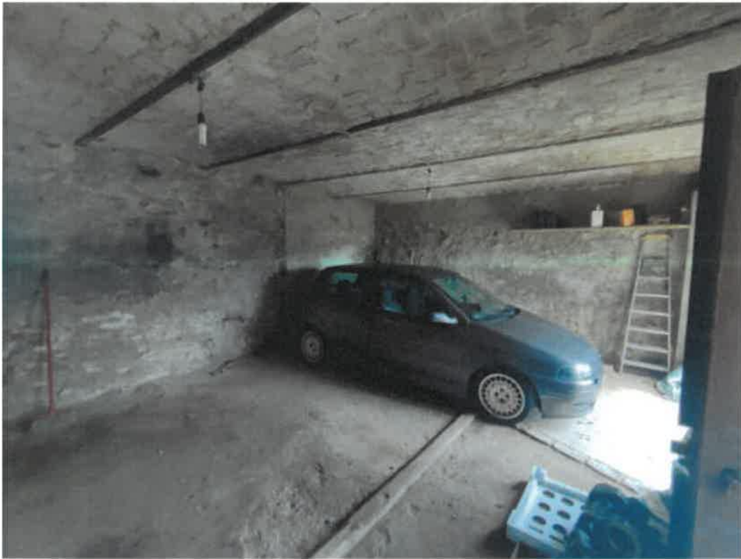
Vista particolare del locale sgombero in piano terra con accesso dal cortile interno