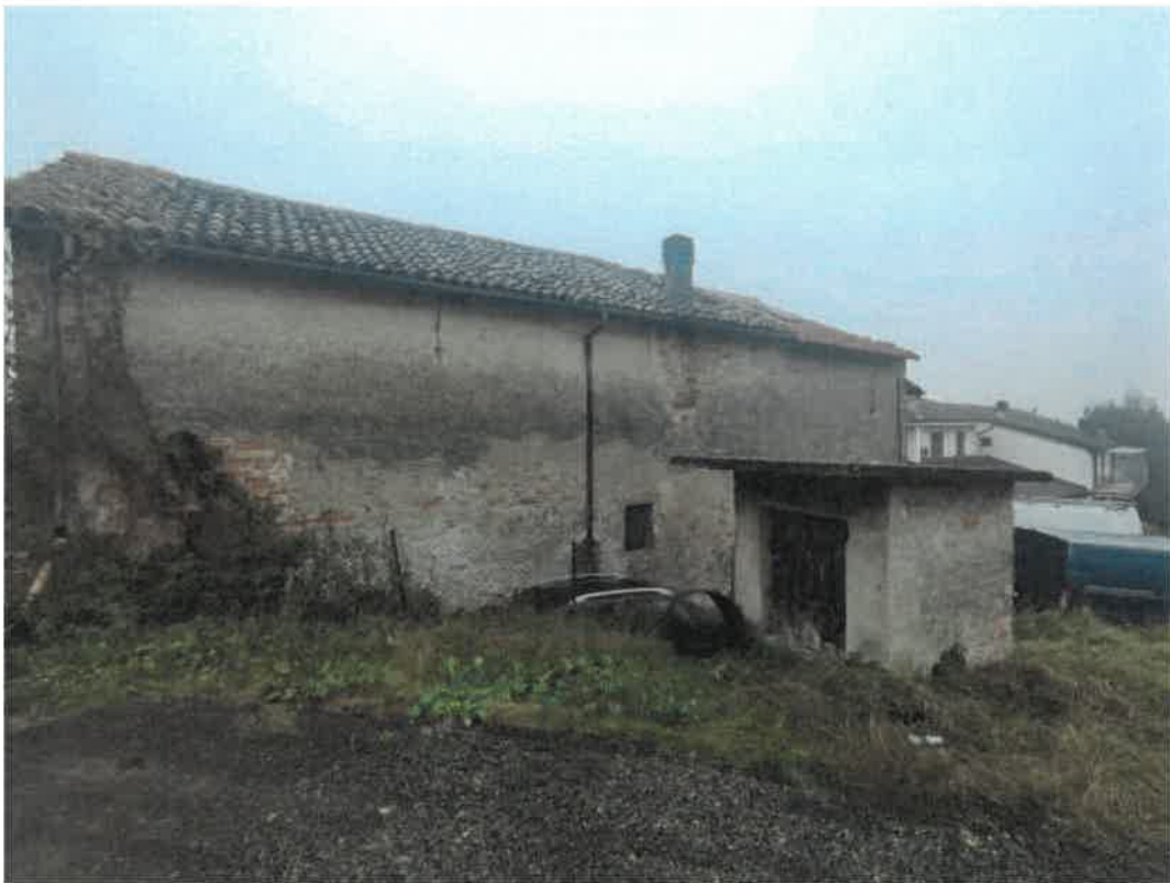
Vista del passaggio a fondo inghiaiato, in diramazione dalla Strada Consorziale " Bricco ", dal quale viene praticato l'accesso al sedime esclusivo pertinenziale posto sul fronte Nord