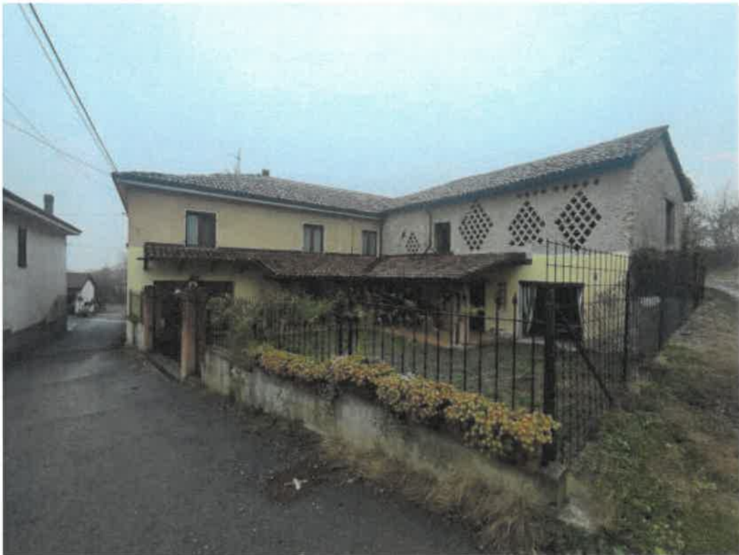
Vista prospetto fronte Sud del fabbricato