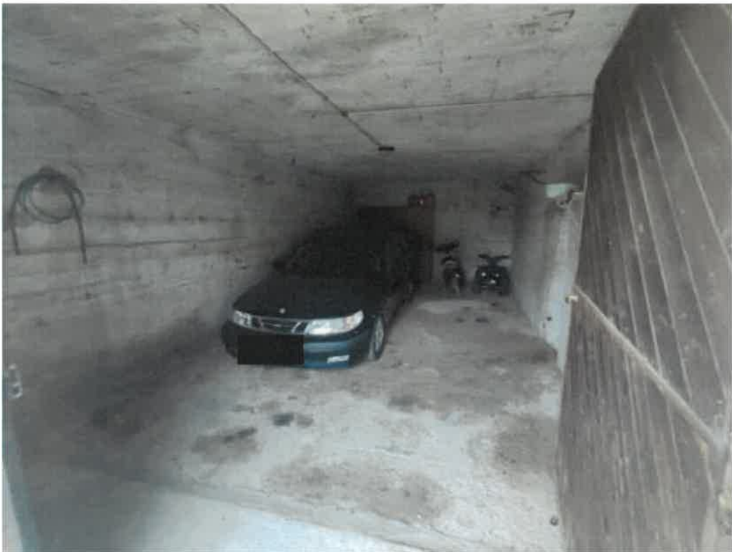
Vista particolare del locale box in piano terra con accesso dal cortile interno