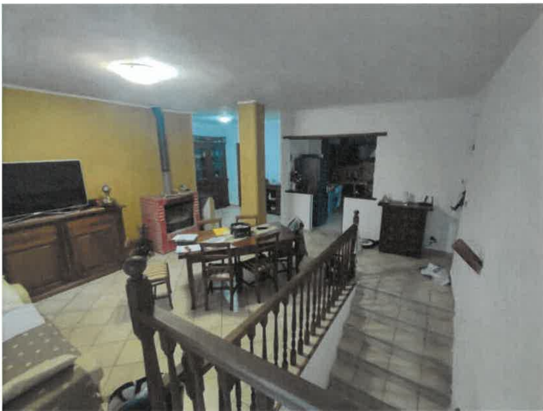
Vista particolare interna locale soggiorno / living in piano primo