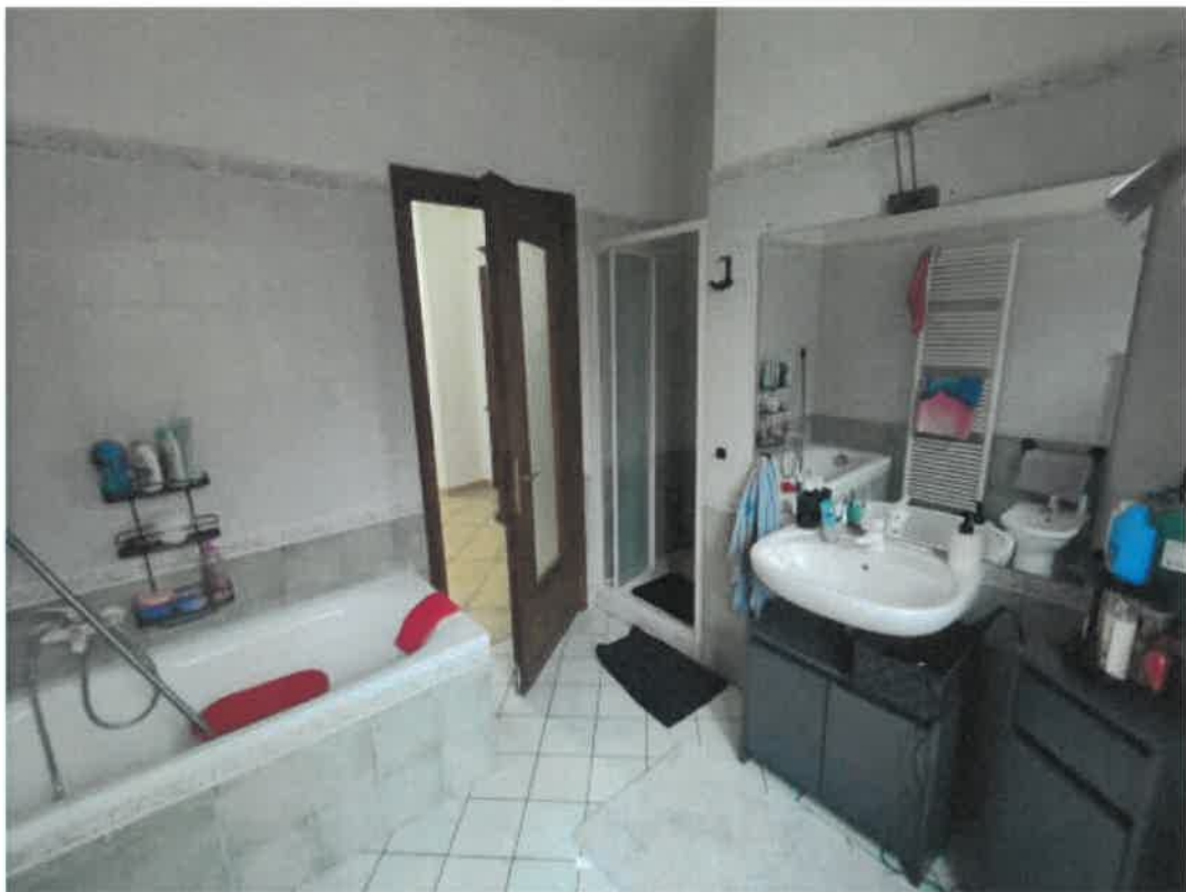
Vista particolare locale bagno in piano primo