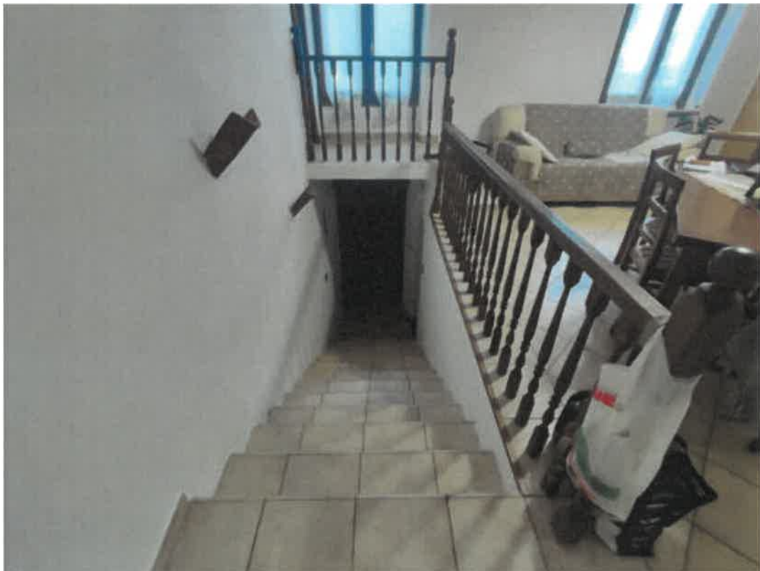
Vista particolare ingresso / vano scala di accesso ai vani di abitazione in piano primo