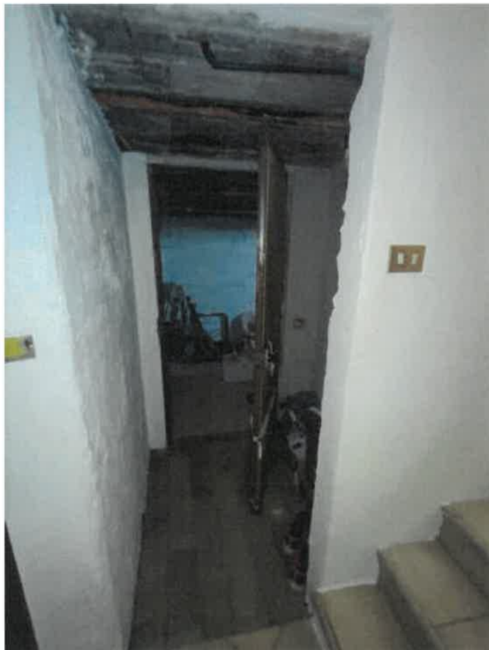
Vista particolare porta di accesso al locale sgombero pertinenziale in piano terra