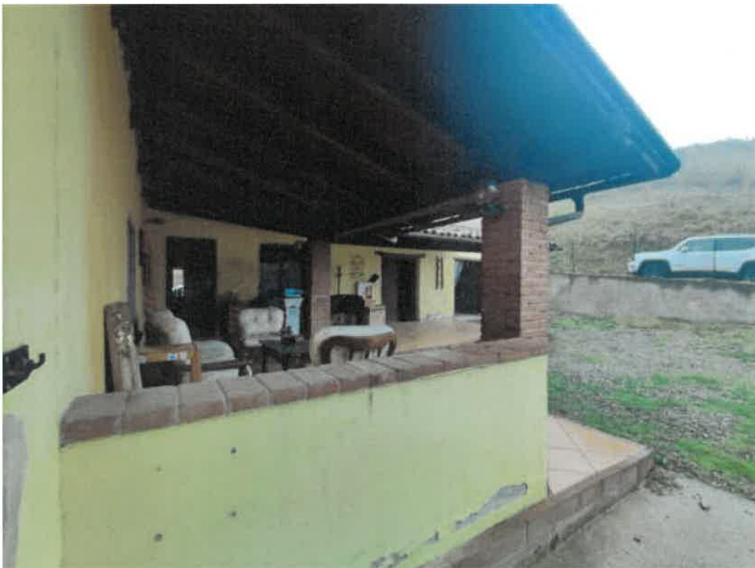
Vista particolare porticato fronte Sud, pertinenziale ai vani di abitazione