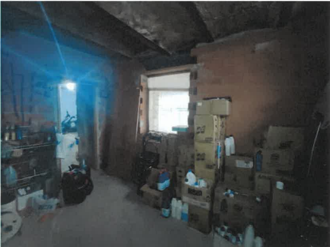
Vista locale sgombero pertinenziale in piano terra