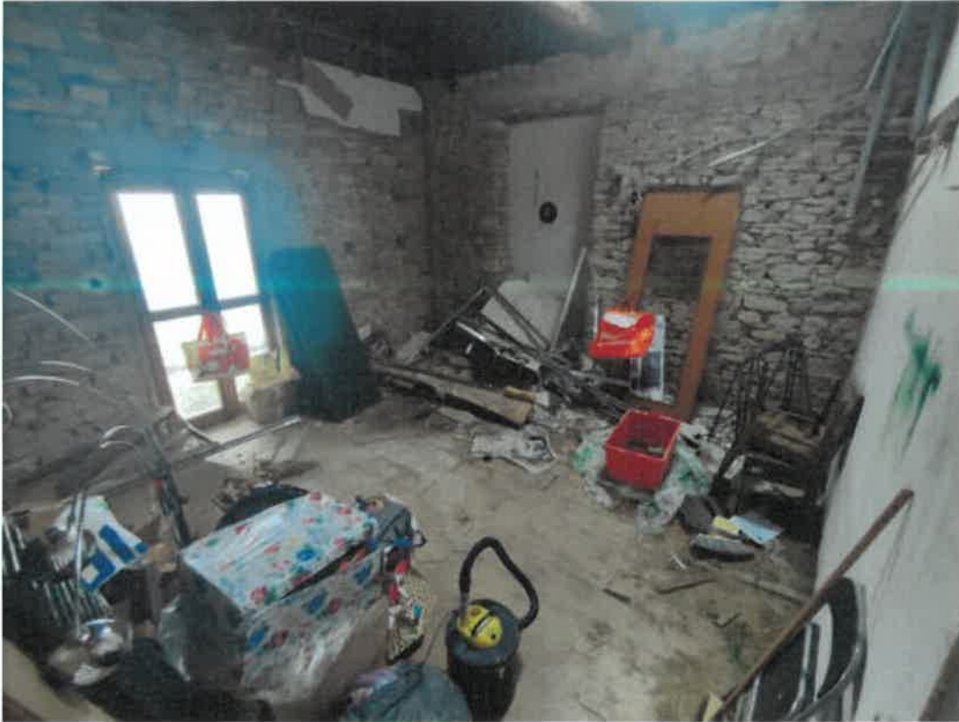
Vista particolare locale ripostiglio al rustico in piano primo