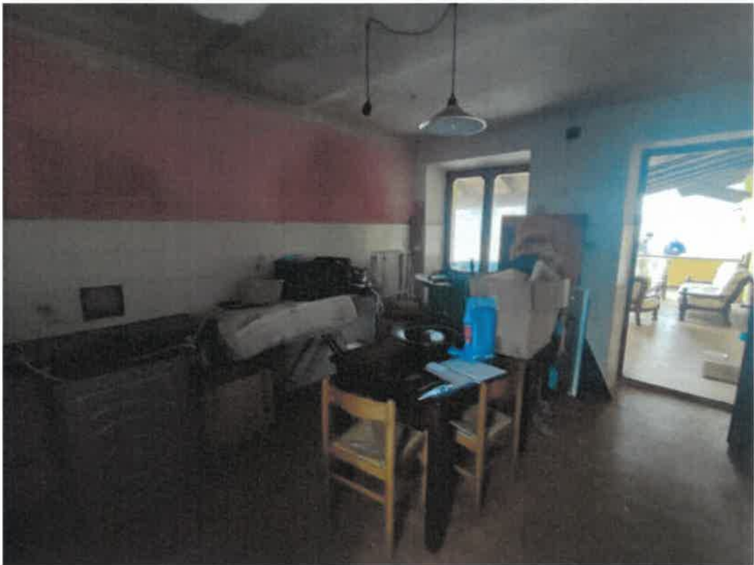
Vista particolare del locale sgombero in piano terra con accesso esterno dal porticato pertinenziale