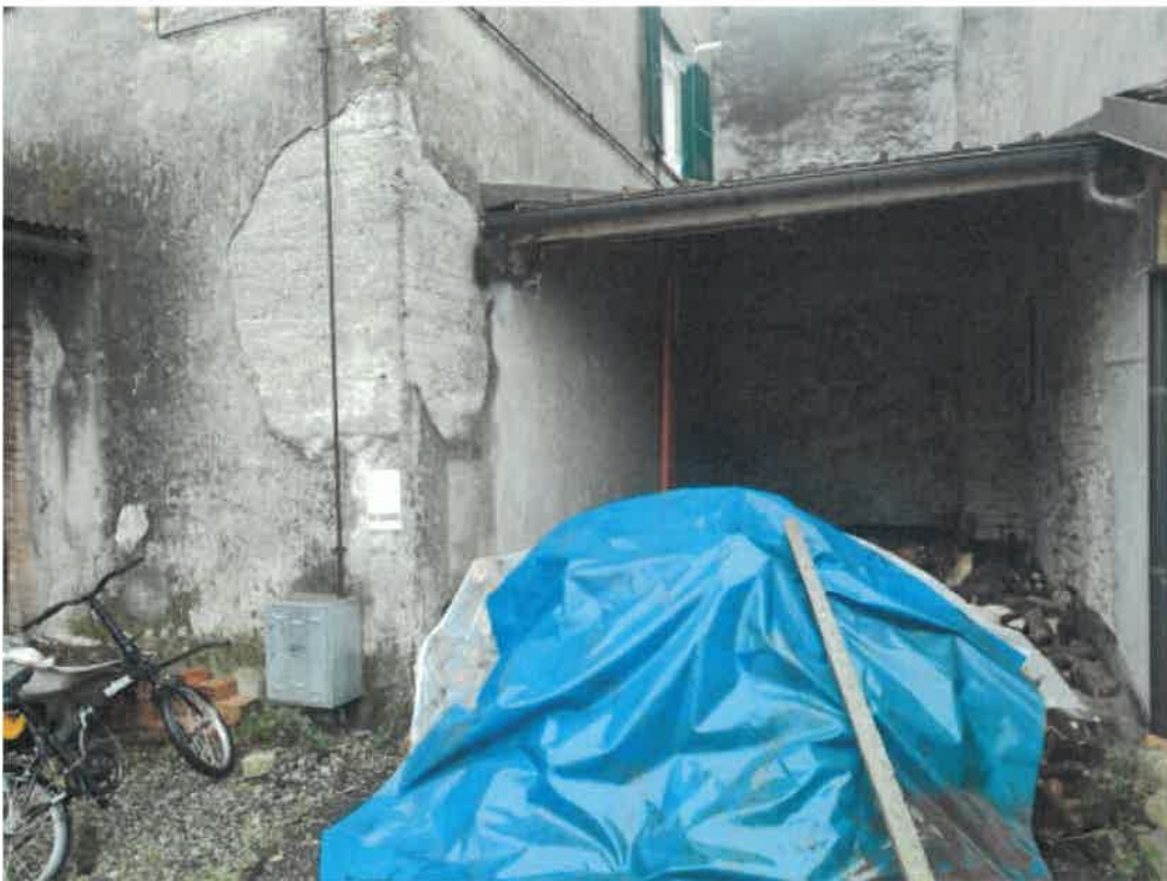
Vista particolare prospetti del fabbricato fronte cortile lato Nord