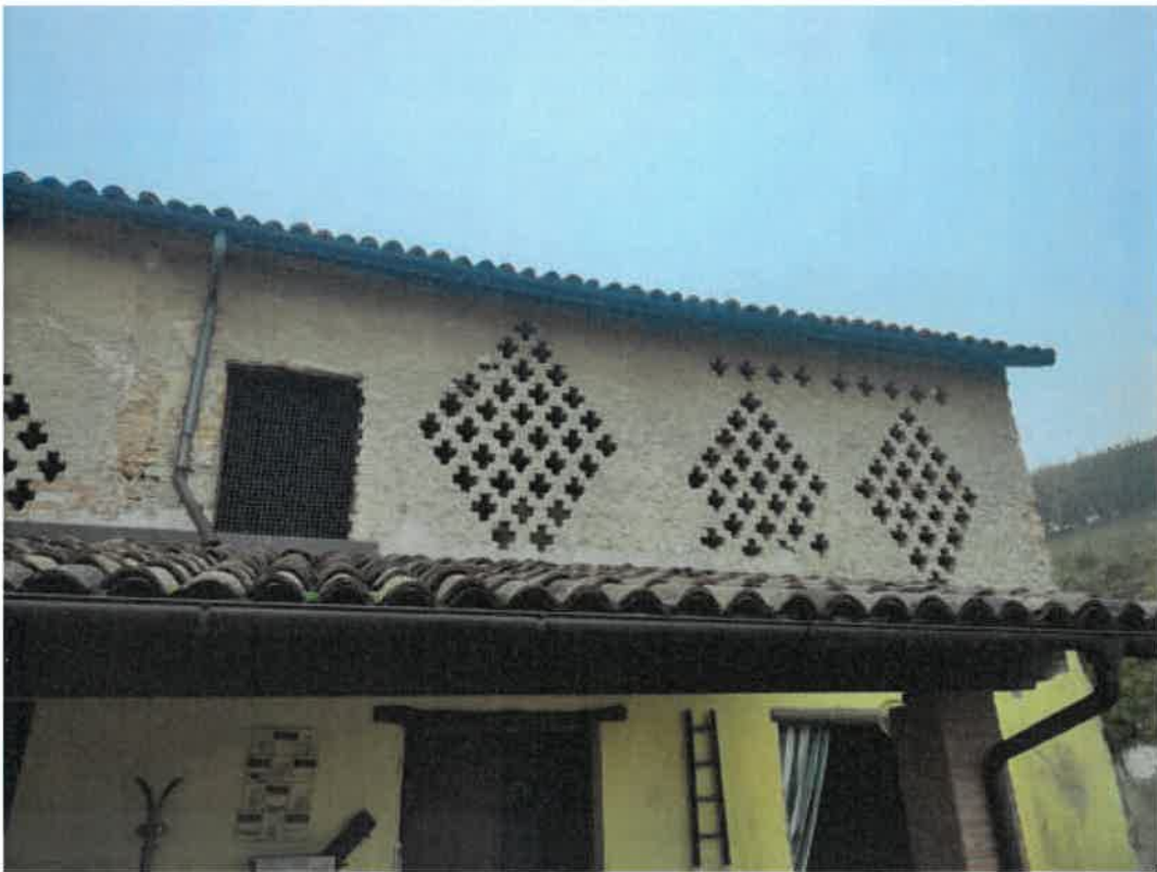
Vista particolare prospetti del fabbricato fronte cortile interno lato Sud