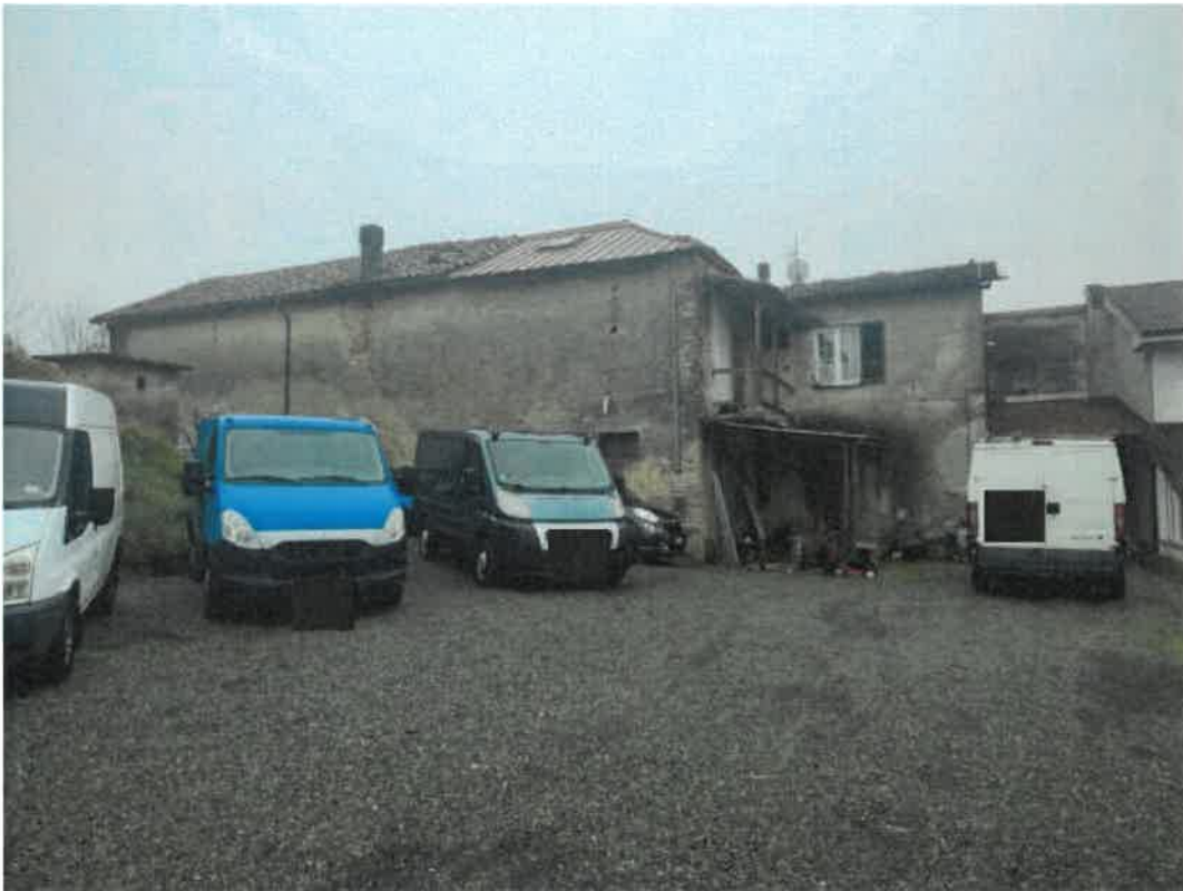
Vista particolare stato conservazione e manutenzione coperture del fabbricato