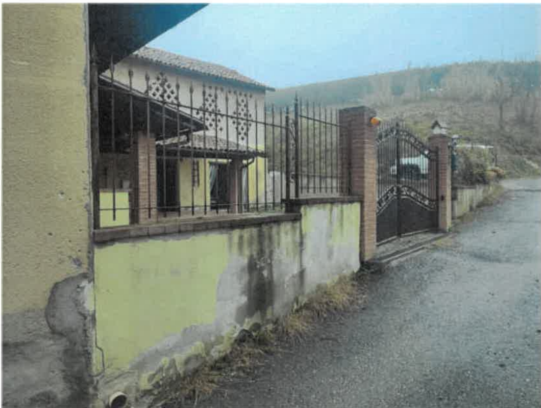
Vista dalla Strada Consorziale " Bricco ", dell'accesso alla proprietà oggetto di esecuzione