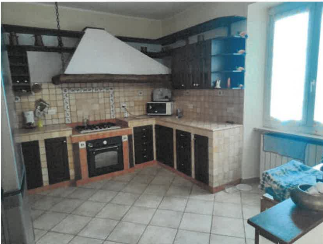
Vista particolare locale cucina in piano primo