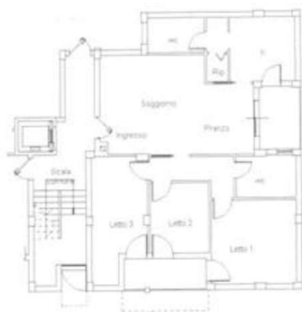
Planimetria catastale attuale