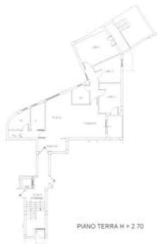
Planimetria catastale attuale sub. 50