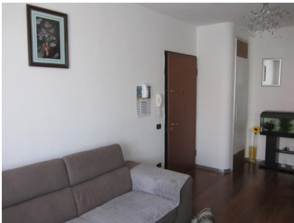
FOTO 1.03_ PIANO PRIMO_soggiorno