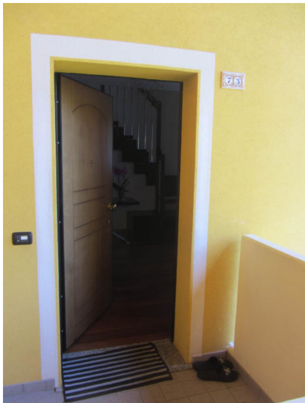
FOTO E.03_ ESTERNO _portone d'ingresso