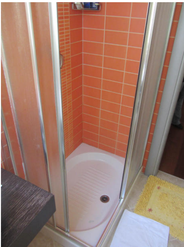
FOTO 2.09_ PIANO SOTTOTETTO_doccia