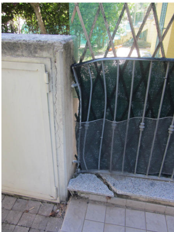
FOTO E.06_ ESTERNO_cedimento terreno scoperto comune