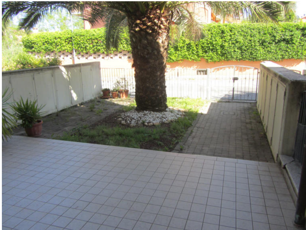
FOTO E.02_ ESTERNO_scoperto comune