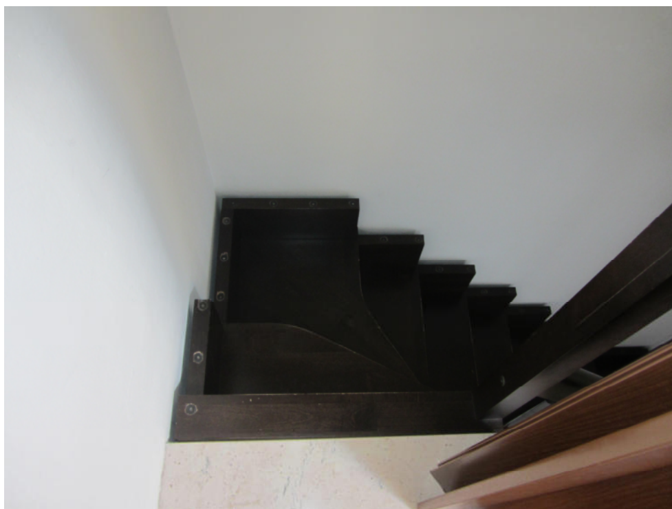
FOTO 2.01_ PIANO SOTTOTETTO_scala