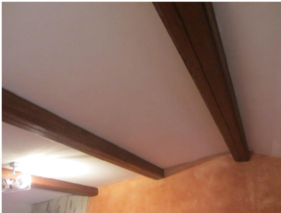
FOTO 2.04_ PIANO SOTTOTETTO