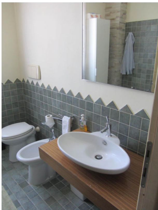
FOTO 1.11_ PIANO PRIMO_bagno