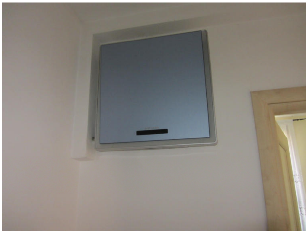
FOTO 1.16_ PIANO PRIMO_condizionatore