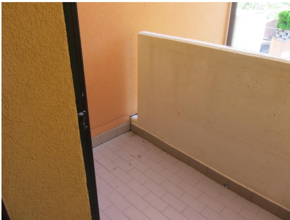
FOTO 1.07_ PIANO PRIMO_balcone 2