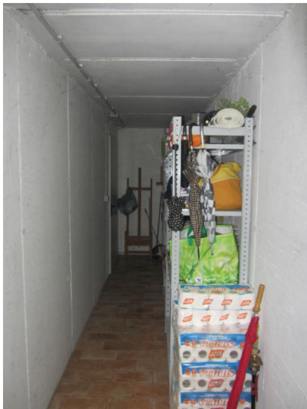
FOTO S.08_ PIANO SEMINTERRATO