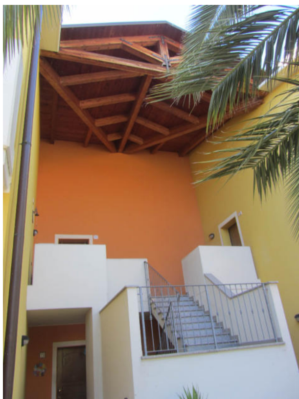
FOTO E.04_ ESTERNO _scala d'accesso comune