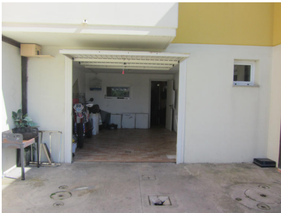
FOTO E.08_ ESTERNO_ ingresso garage