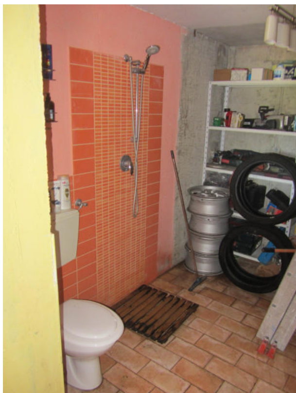
FOTO S.05_ PIANO SEMINTERRATO