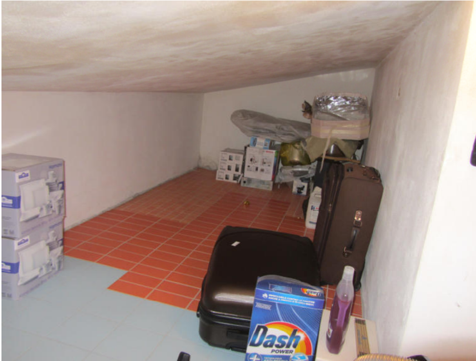
FOTO 2.10_ PIANO SOTTOTETTO