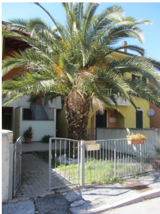
FOTO E.01_ ESTERNO_frente strada