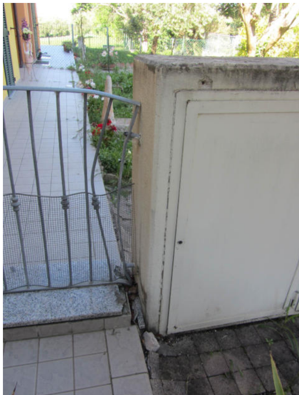
FOTO E.07_ ESTERNO_ cedimento terreno scoperto comune