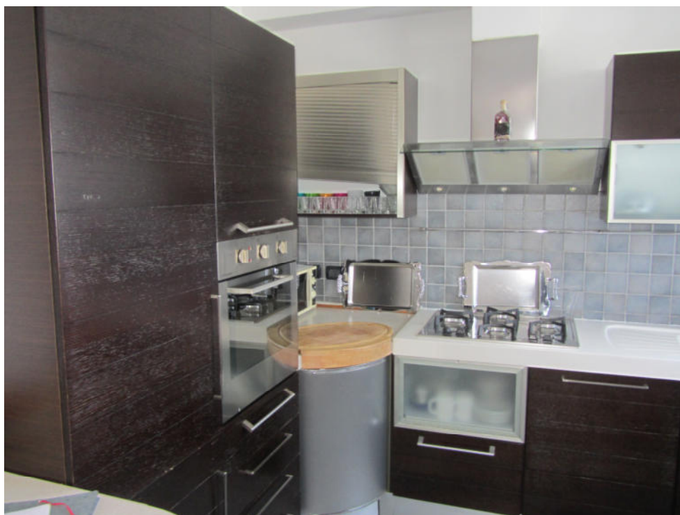
FOTO 1.05_ PIANO PRIMO_cucina