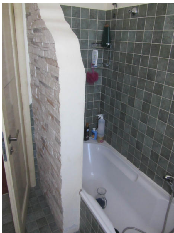
FOTO 1.13_ PIANO PRIMO_vasca