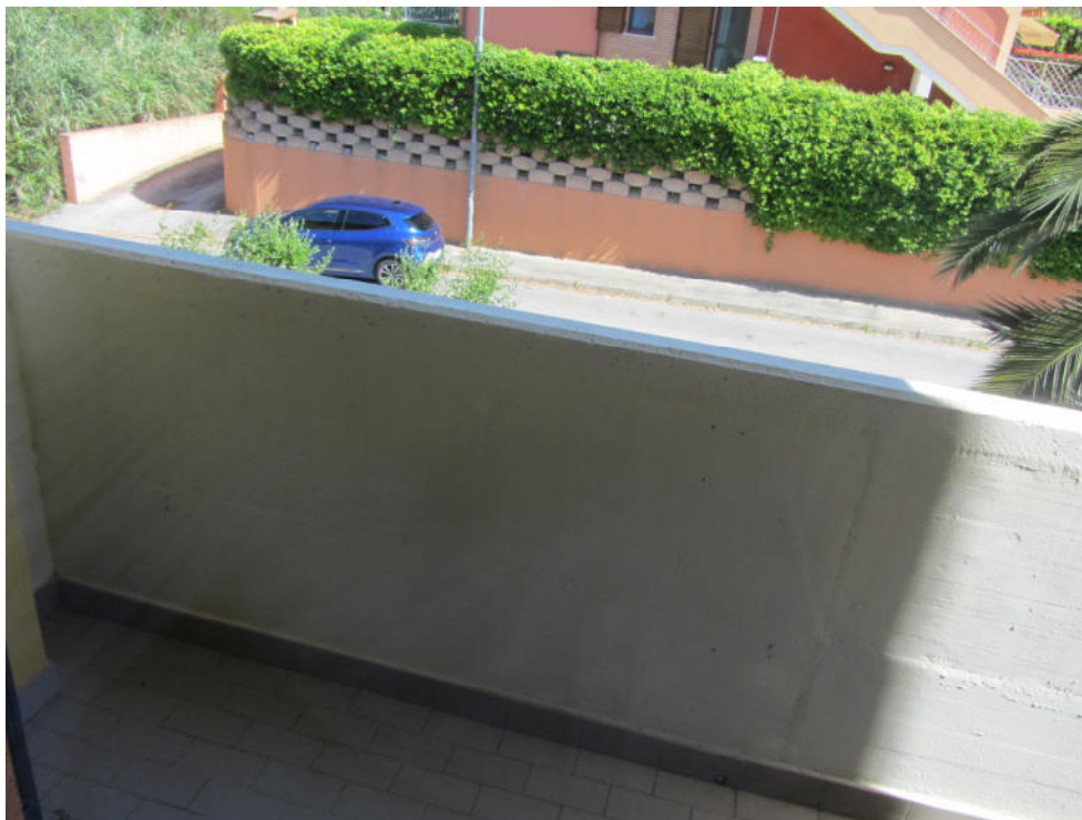
FOTO 1.06_ PIANO PRIMO_balcone 1