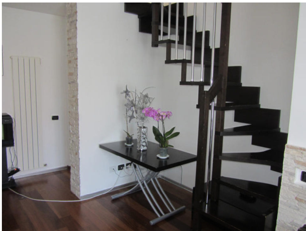
FOTO 1.04_ PIANO PRIMO_scala