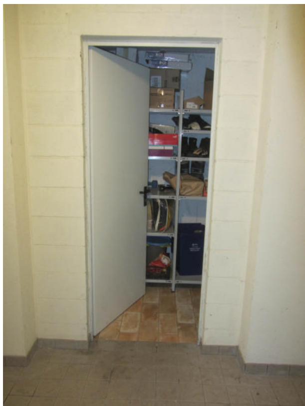
FOTO S.01_ PIANO SEMINTERRATO