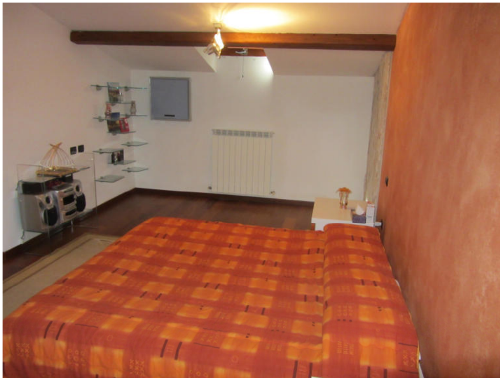
FOTO 2.07_ PIANO SOTTOTETTO