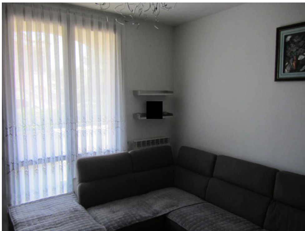
FOTO 1.02_ PIANO PRIMO_soggiorno