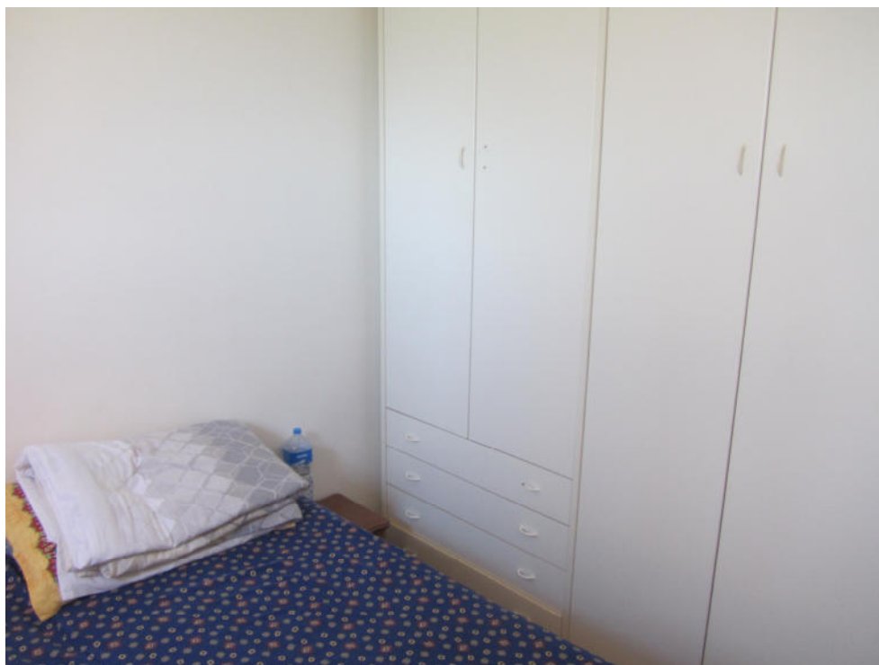
FOTO 1.14_ PIANO PRIMO_camera 2