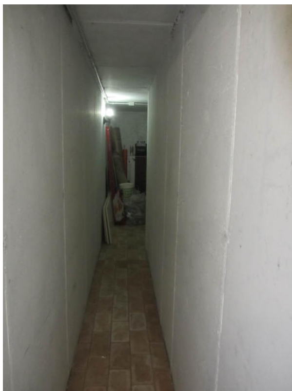
FOTO S.07_ PIANO SEMINTERRATO