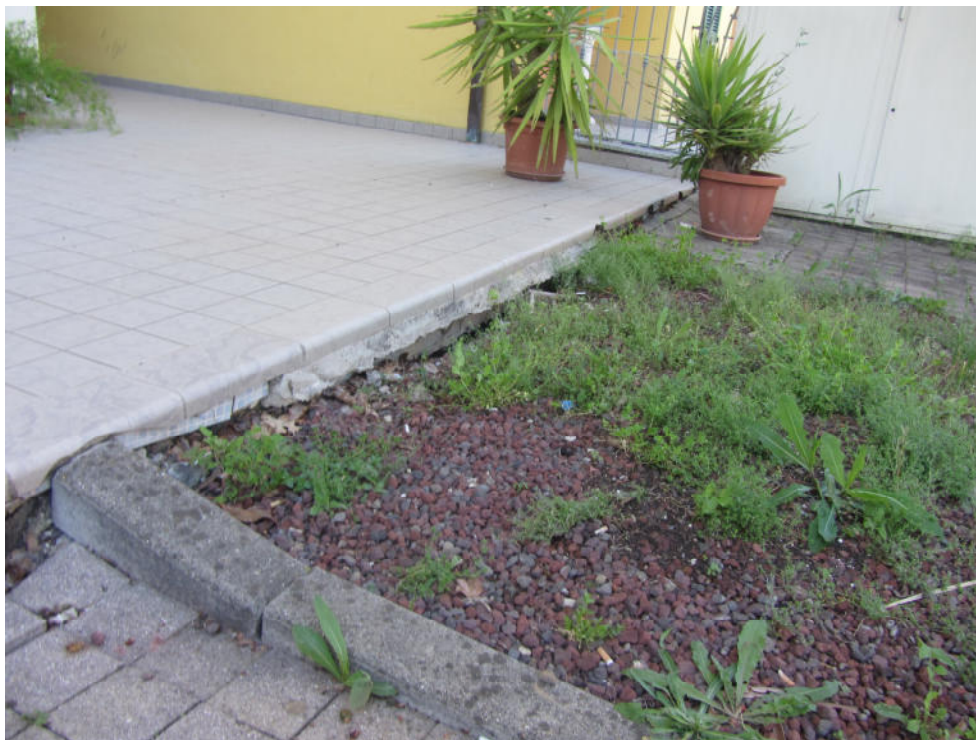
FOTO E.05_ ESTERNO_cedimento terreno scoperto comune