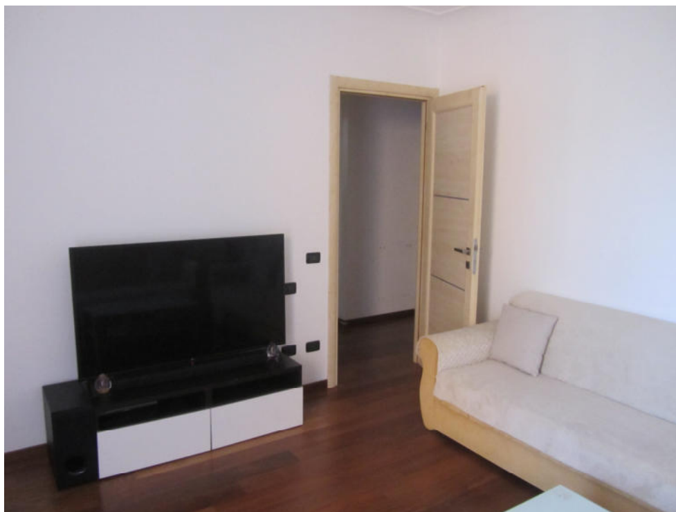
FOTO 1.10_ PIANO PRIMO_camera 1