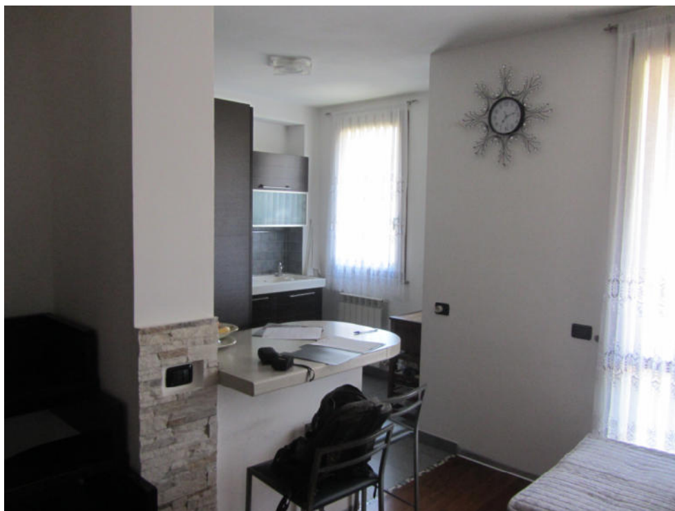
FOTO 1.01_ PIANO PRIMO_cucina