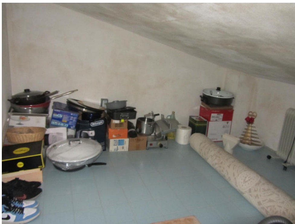
FOTO 2.03_ PIANO SOTTOTETTO