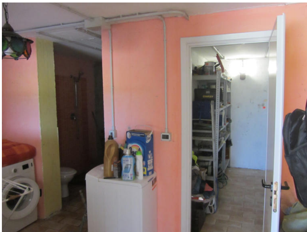
FOTO S.04_ PIANO SEMINTERRATO