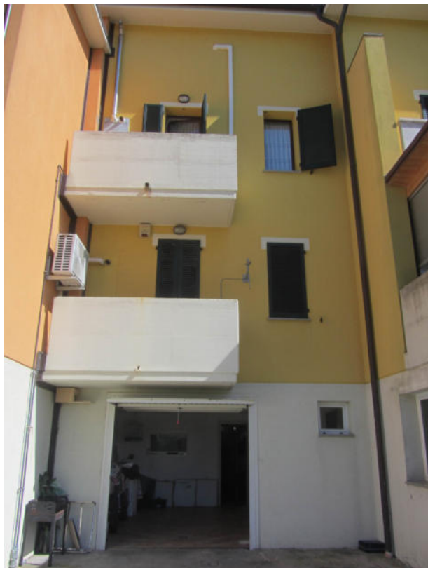
FOTO E.07_ ESTERNO_ prospetto retro