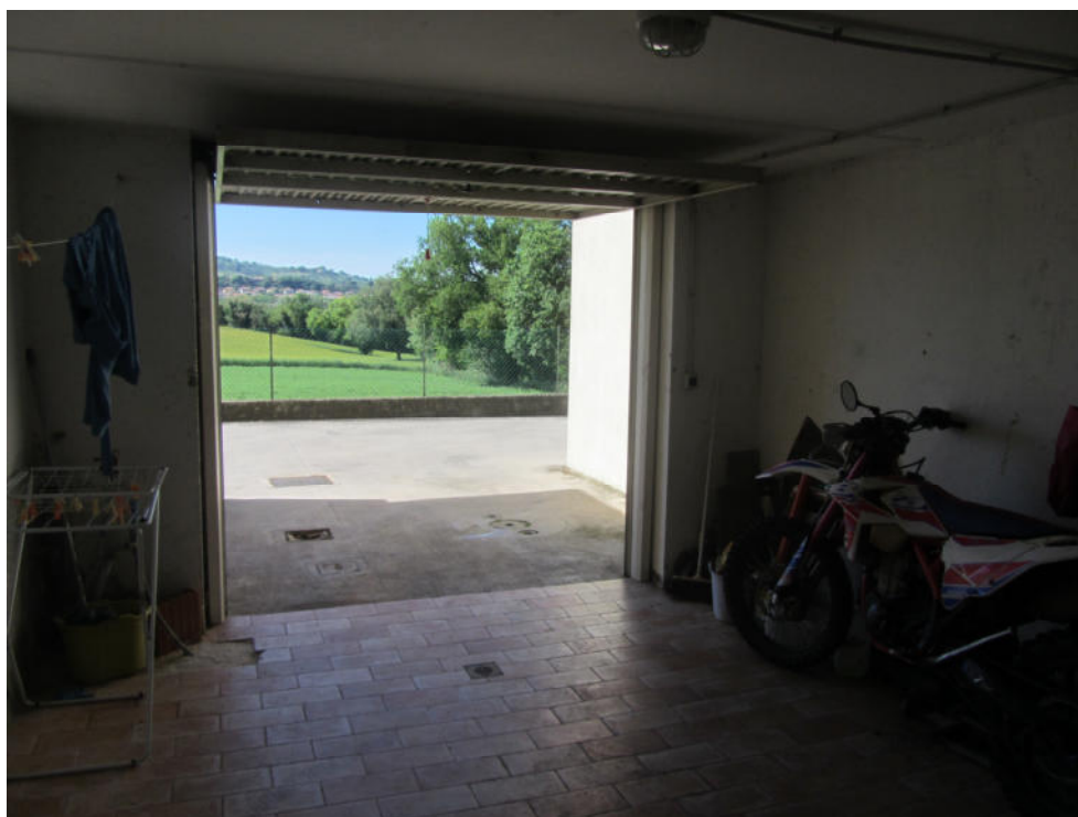
FOTO S.03_ PIANO SEMINTERRATO_garage