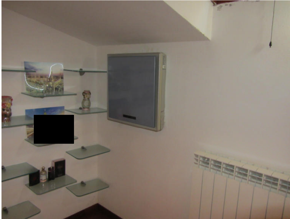
FOTO 2.06_ PIANO SOTTOTETTO_condizionatore