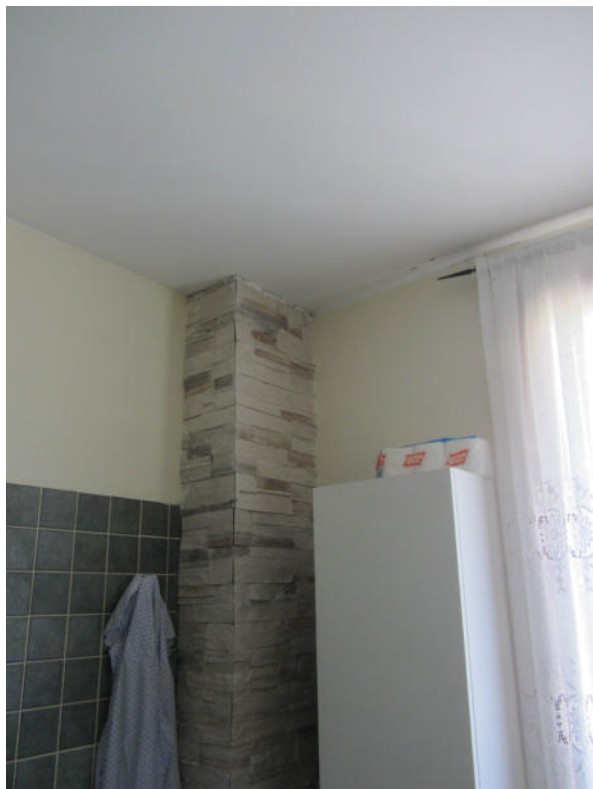
FOTO 1.12_ PIANO PRIMO_bagno