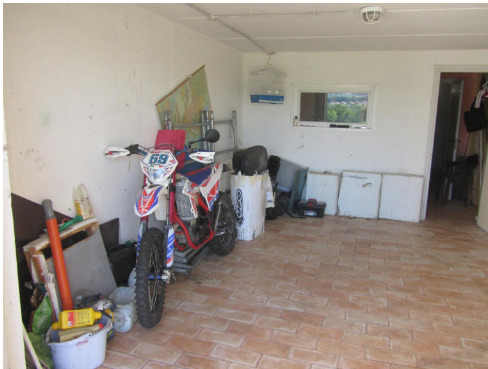
FOTO S.02_ PIANO SEMINTERRATO_garage