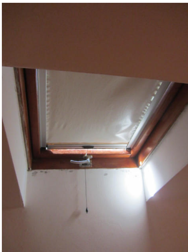
FOTO 2.05_ PIANO SOTTOTETTO_lucernario