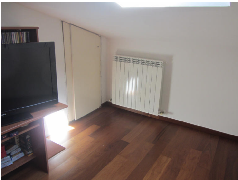
FOTO 2.02_ PIANO SOTTOTETTO