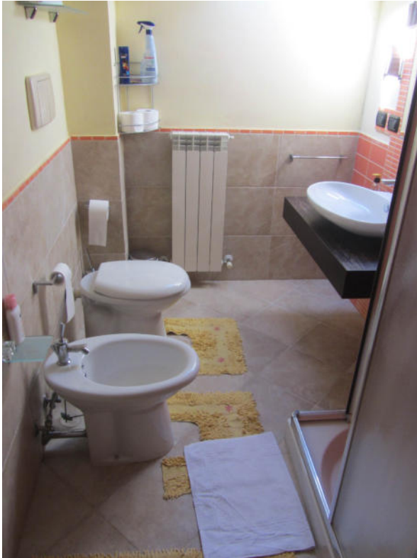
FOTO 2.08_ PIANO SOTTOTETTO_bagno