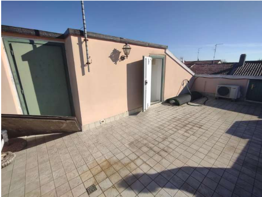
Terrazzo in falda