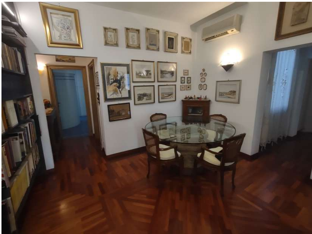
Disimpegno/sala da pranzo