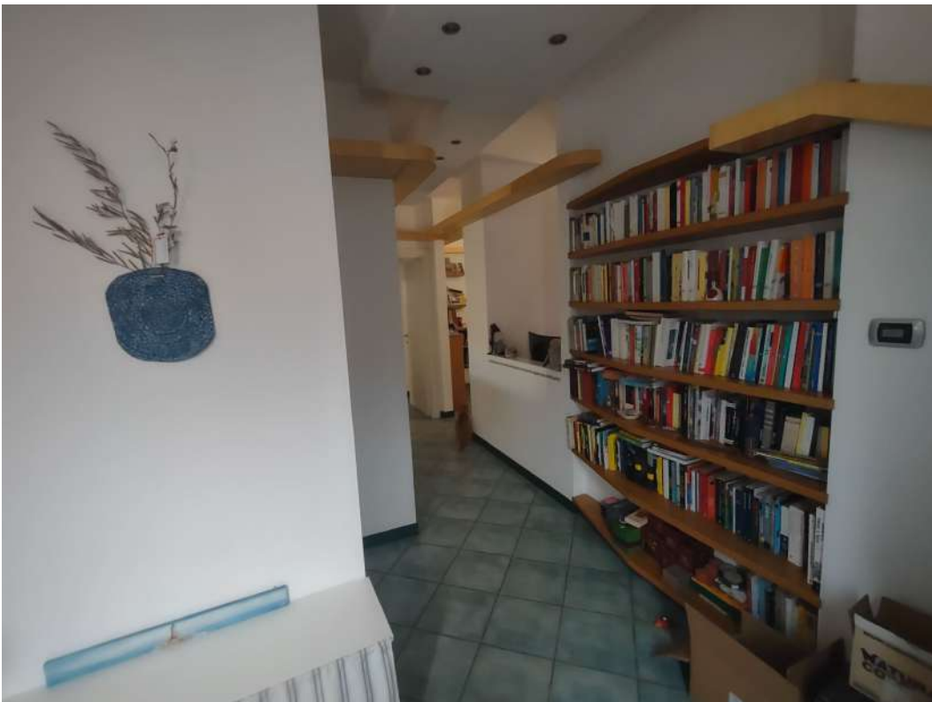
Ingresso e disimpegno