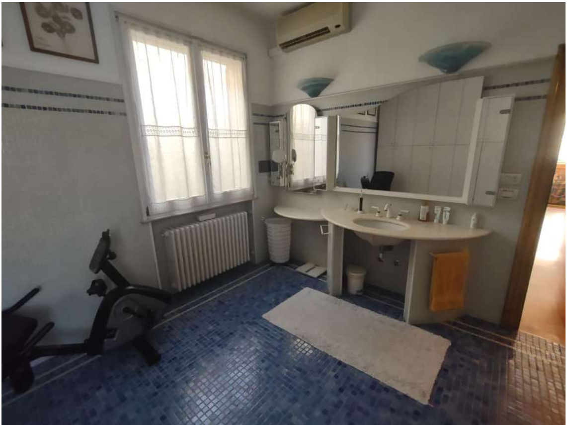
Bagno 1 con area fitness