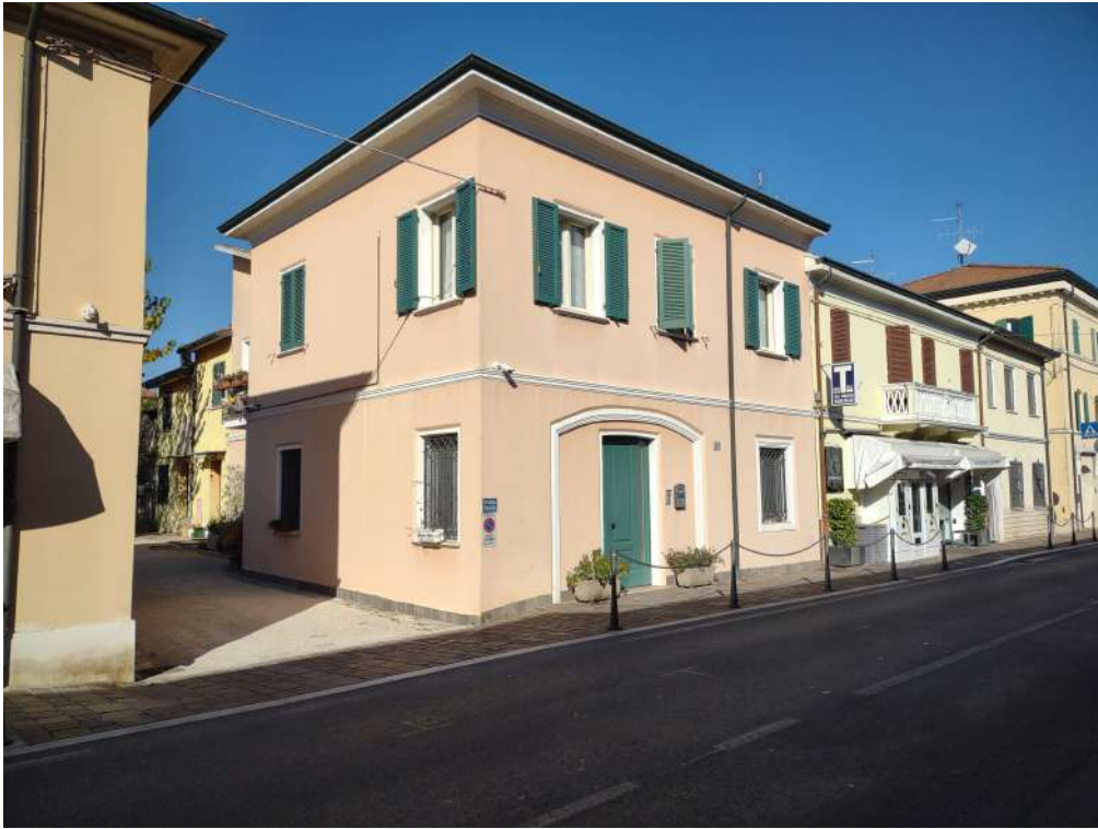
Prospetti SE e SO + ingresso n.53