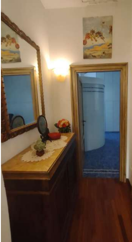
Disimpegno e box-doccia Bagno 1