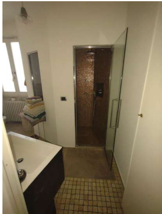
Box doccia bagno 1