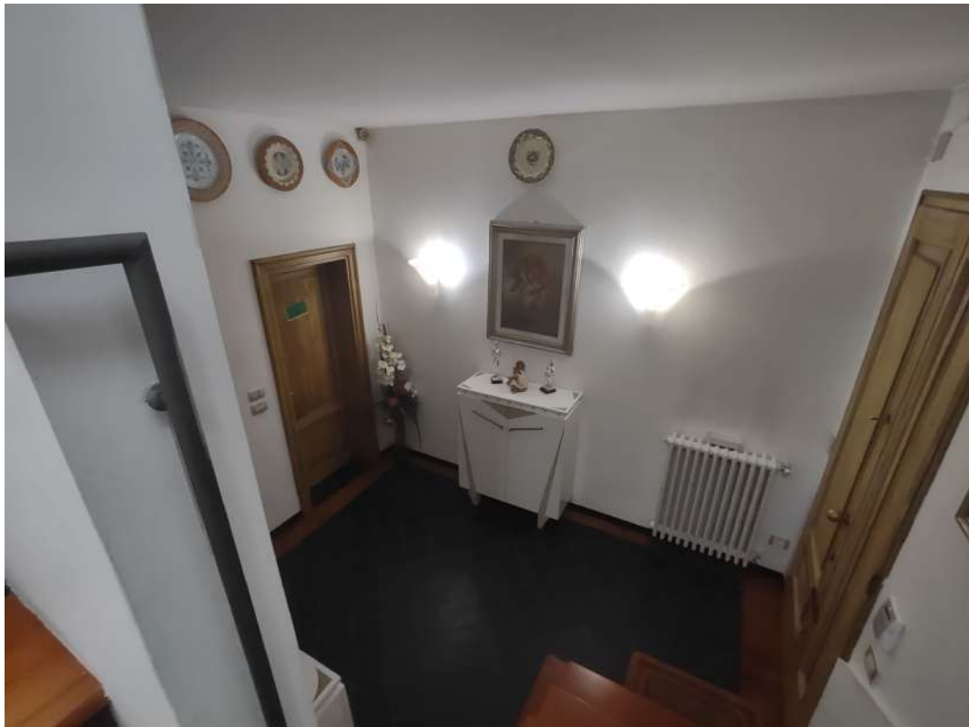
Stanza d'ingresso e comunicazione con appartamento PT