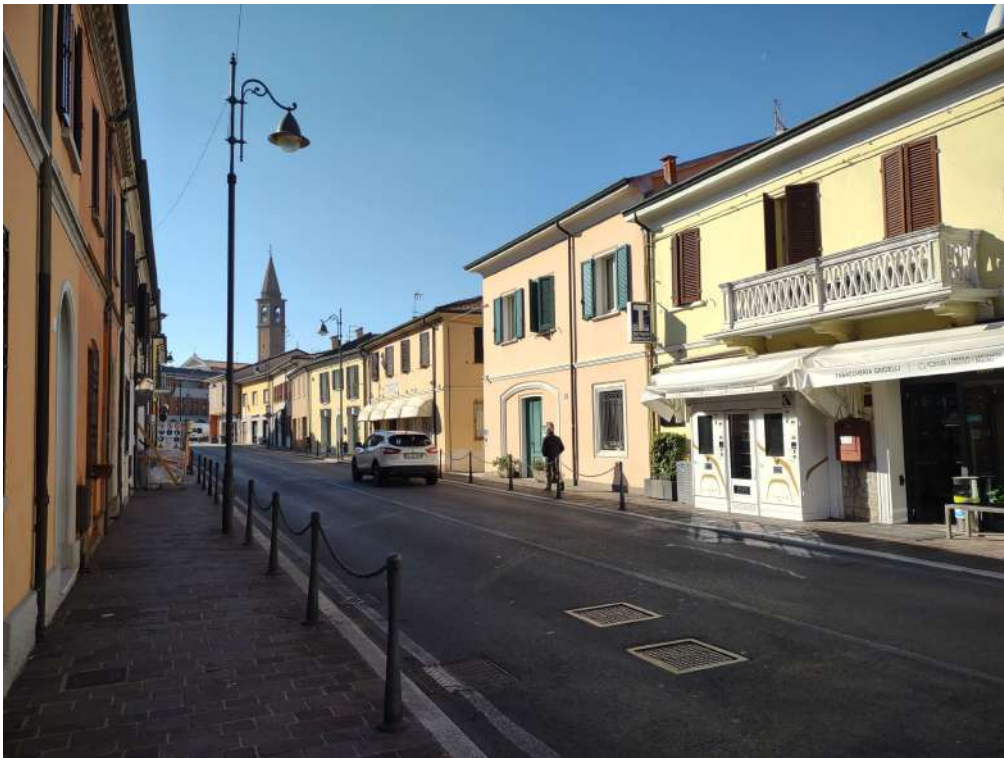
Prospetto SE e via XX settembre