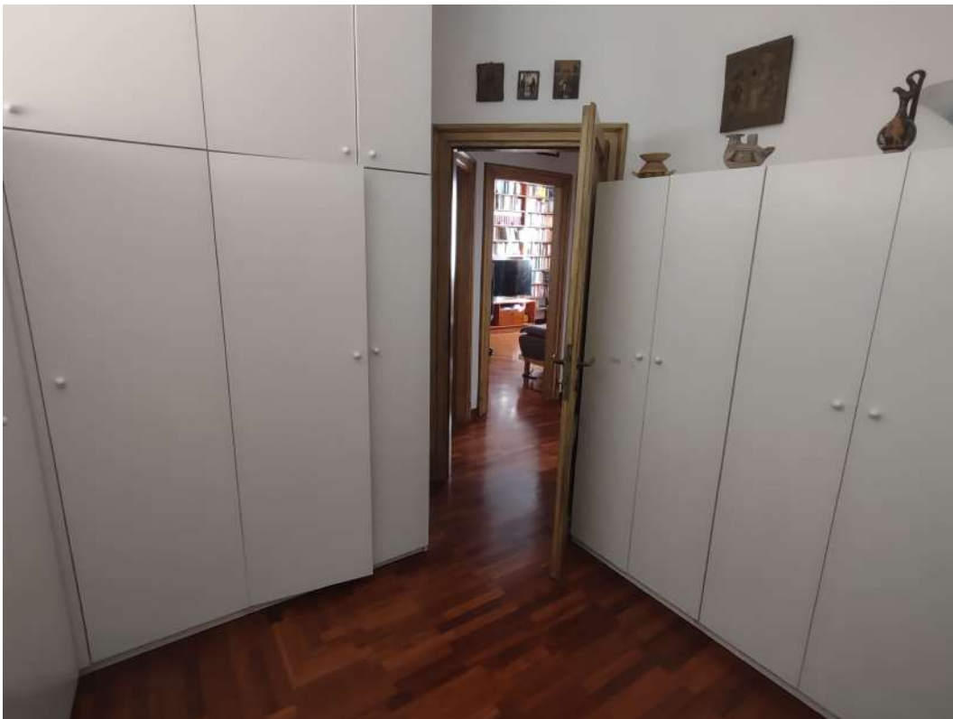
Guardaroba e disimpegno