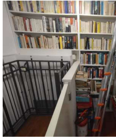
Appartamento piano primo: stanza d'ingresso (P.T) e sollevatore/montacarichi x P. sottotetto