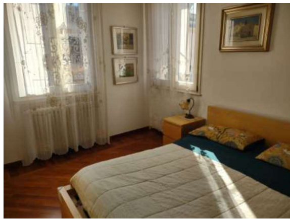
Appartamento piano primo: camere zona notte