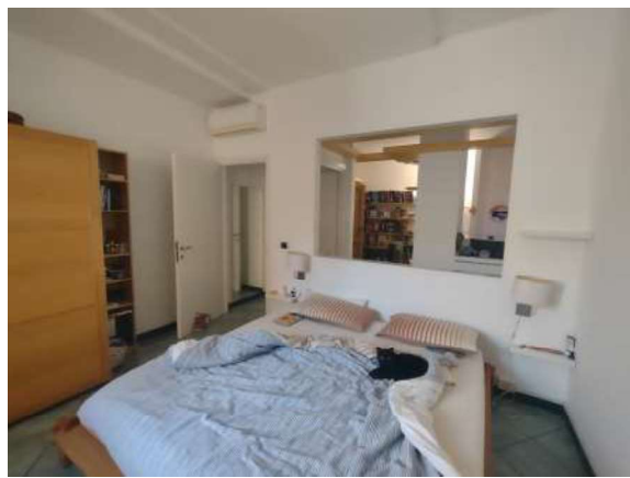
Appartamento piano terra: soggiorno e camera da letto matrimoniale