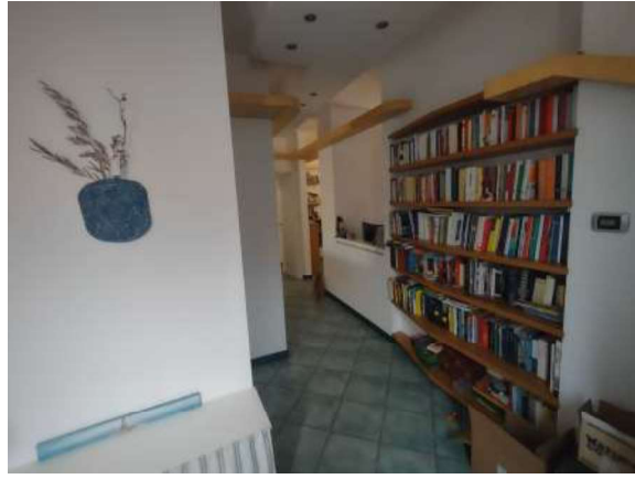
Appartamento piano terra: stanza d'ingresso e corridoio/disimpegno zona notte