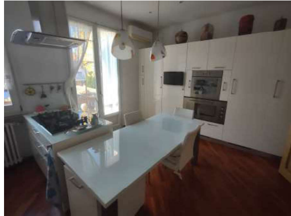
Appartamento piano primo: disimpegno e cucina