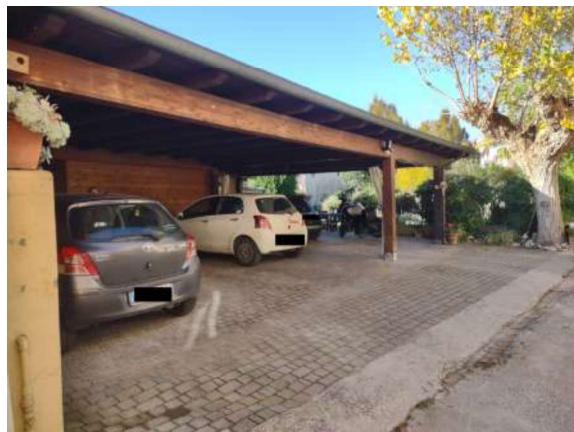
Appartamento piano primo: terrazzo in vasca al P, sottotetto e tettoia comune nella corte