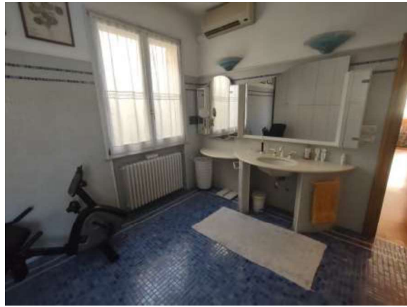
Appartamento piano primo: stanza guardaroba e bagno con area fitness