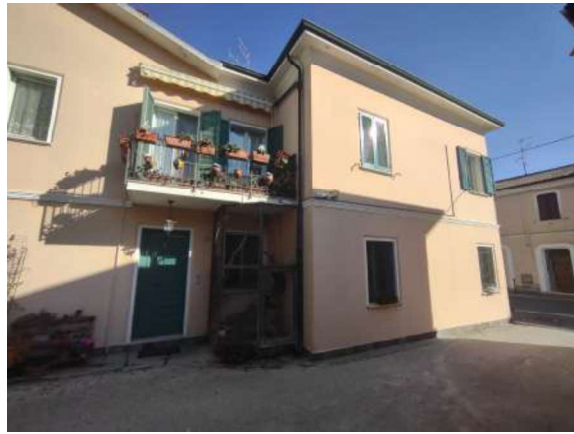
Prospetti su via XX Settembre (ingresso civico 53) e sulla corte comune (ingresso civico 51);