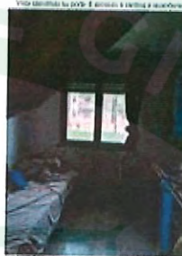
Vista diretta su letto e armadio e sottopiede con rete