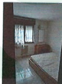
Vista interna di una camera