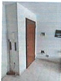
Vista verso il bagno e corridoio di ingresso