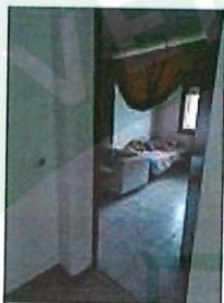
Spazio di letto, armadio e sottopiede con rete