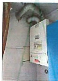
Bath: presenza di porta, da scoperi sanitari