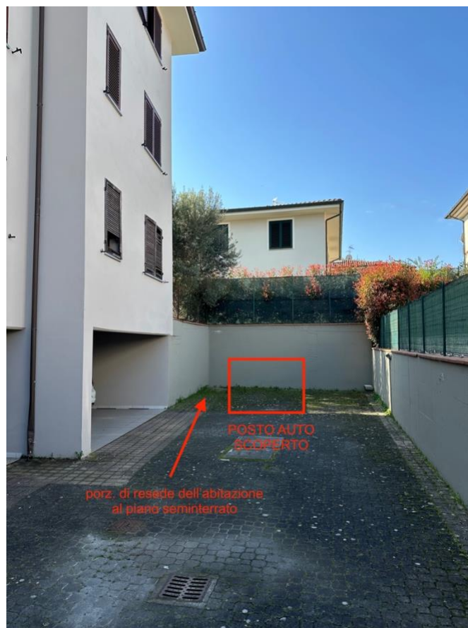
POSTO AUTO SCOPERTO (Sub. 21) – E PORZIONE DI RESEDE ABITAZIONE AL PIANO S1 (sub. 2)