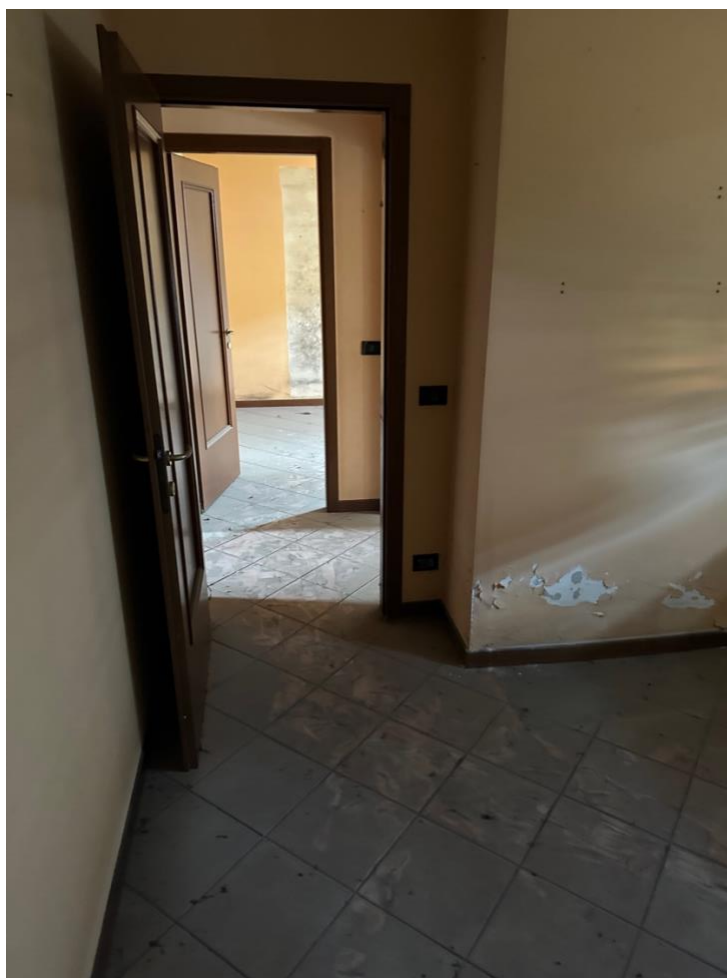
CAMERA 2 e DISIMPEGNO