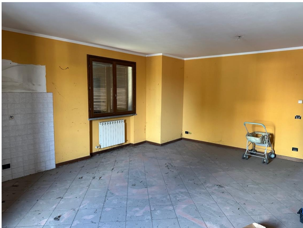
SOGGIORNO - PRANZO - ANGOLO COTTURA