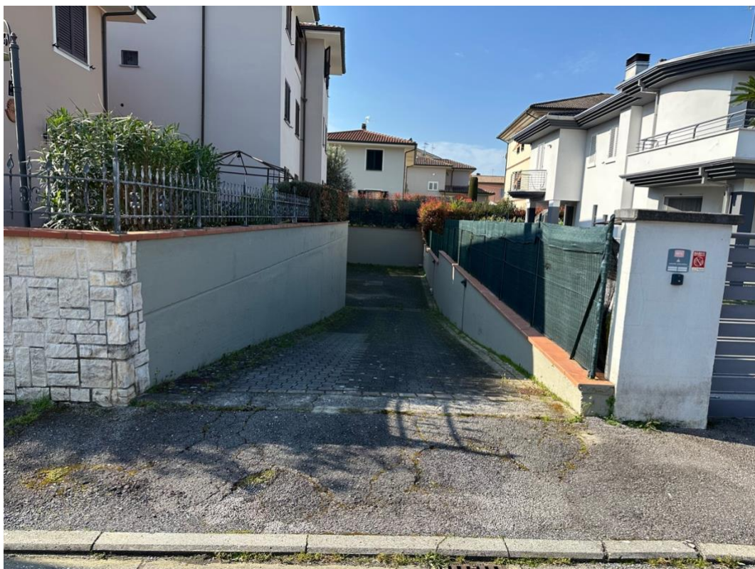
ACCESSO - RAMPA E VIABILITA' DA VIA ROSSINI