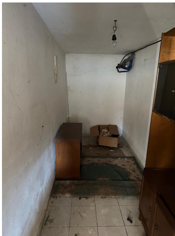
INTERNO CANTINA PIANO SEMINTERRATO