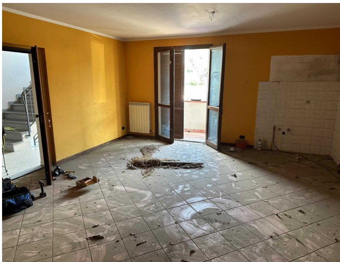
SOGGIORNO - PRANZO - ANGOLO COTTURA