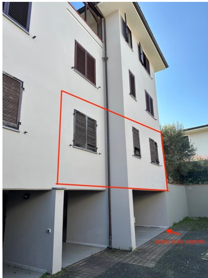
PROSPETTO OVEST (abitazione e posto auto coperto)