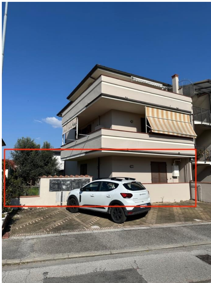
PROSPETTO LATO VIA P.MASCAGNI