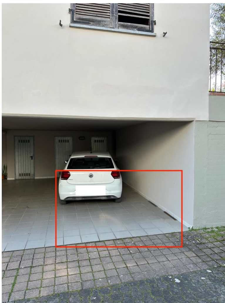
POSTO AUTO COPERTO (Sub. 20) - (indicazione di massima)