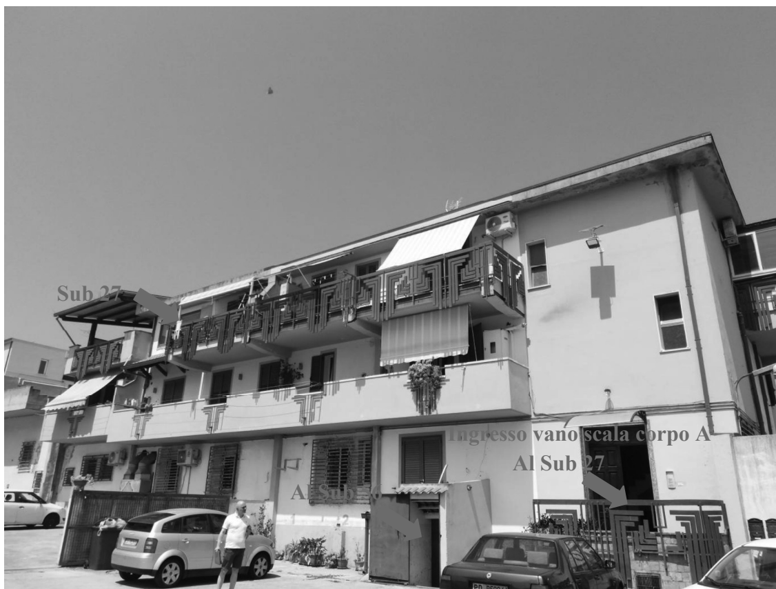
Foto 3_ vista dall'esterno corte privata – ingresso dalla corte privata