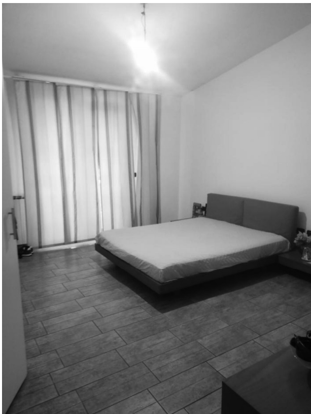
Foto 11_ camera 1.