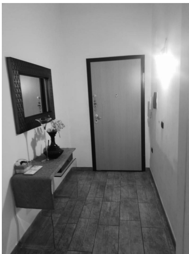
Foto 7 e 8_ scala condominiale e ingresso appartamento ( sub 27) – vista esterna e interna