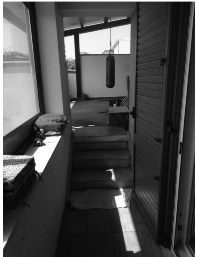
Foto 17 e 18 _ veranda coperta - cucina soggiorno_ (vista accesso alla terrazza coperta)