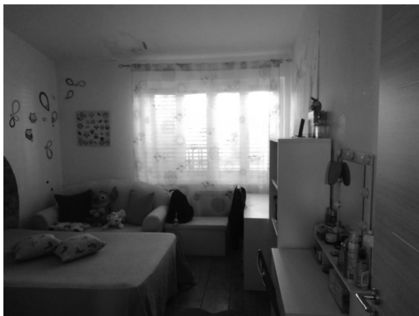
Foto 14_ camera 3