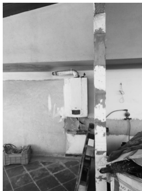
Foto 21 _terrazza_ posizione caldaia