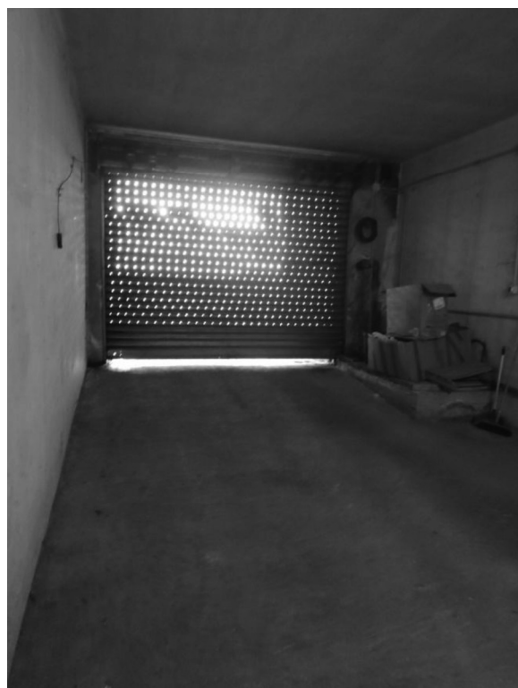
Foto 22 e 23: ingresso ai garages dalla via Nazionale 18 – esterno e interno