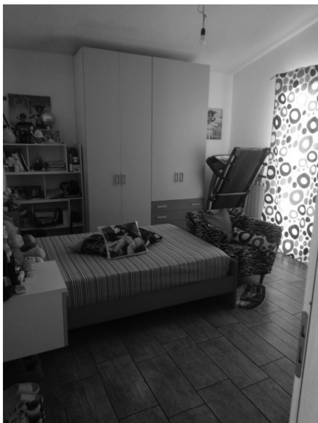
Foto 13_ camera 2