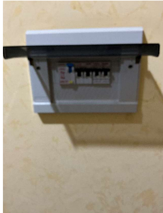
Figura 13 - Quadro elettrico