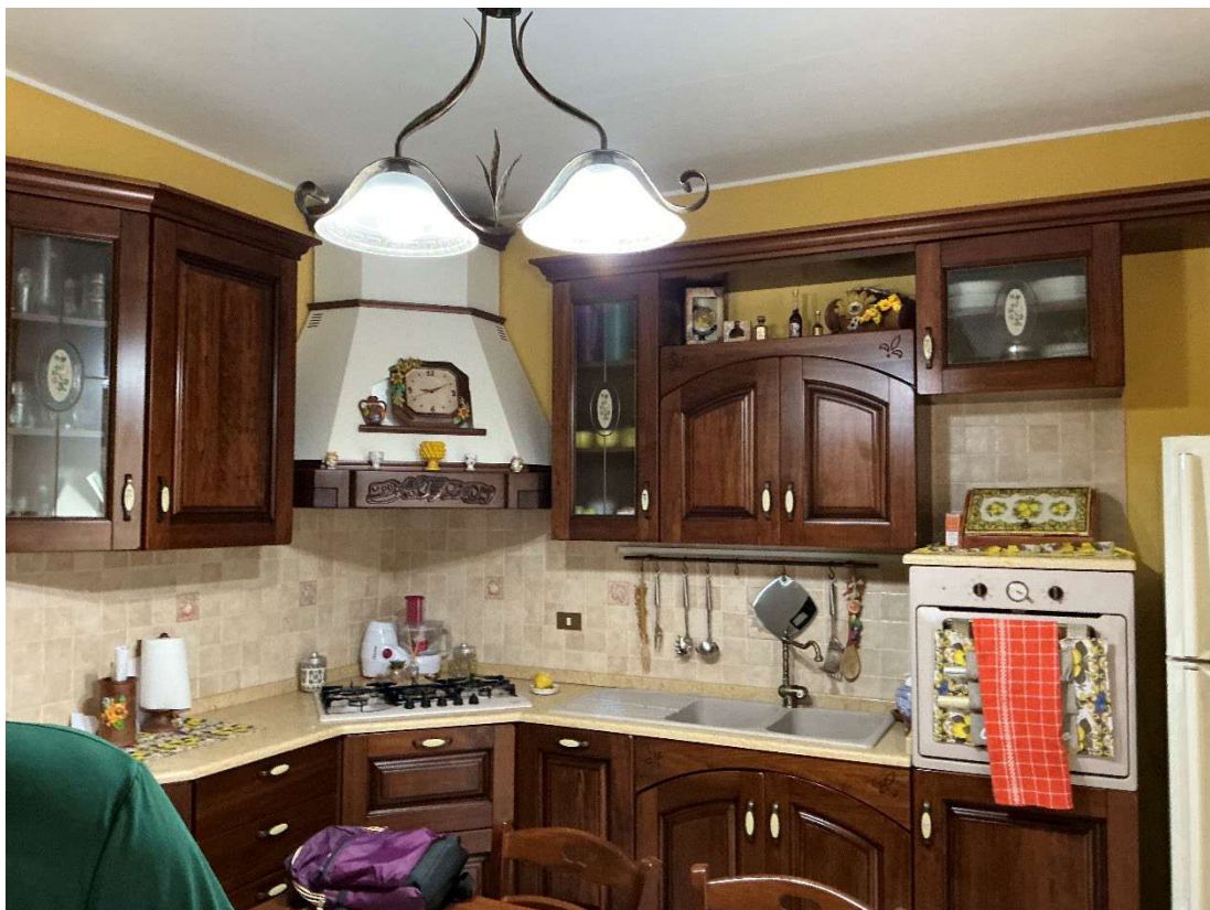
Figura 6 - Cucina