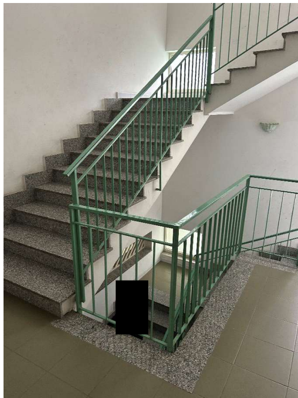
Figura 3 - Vano scala