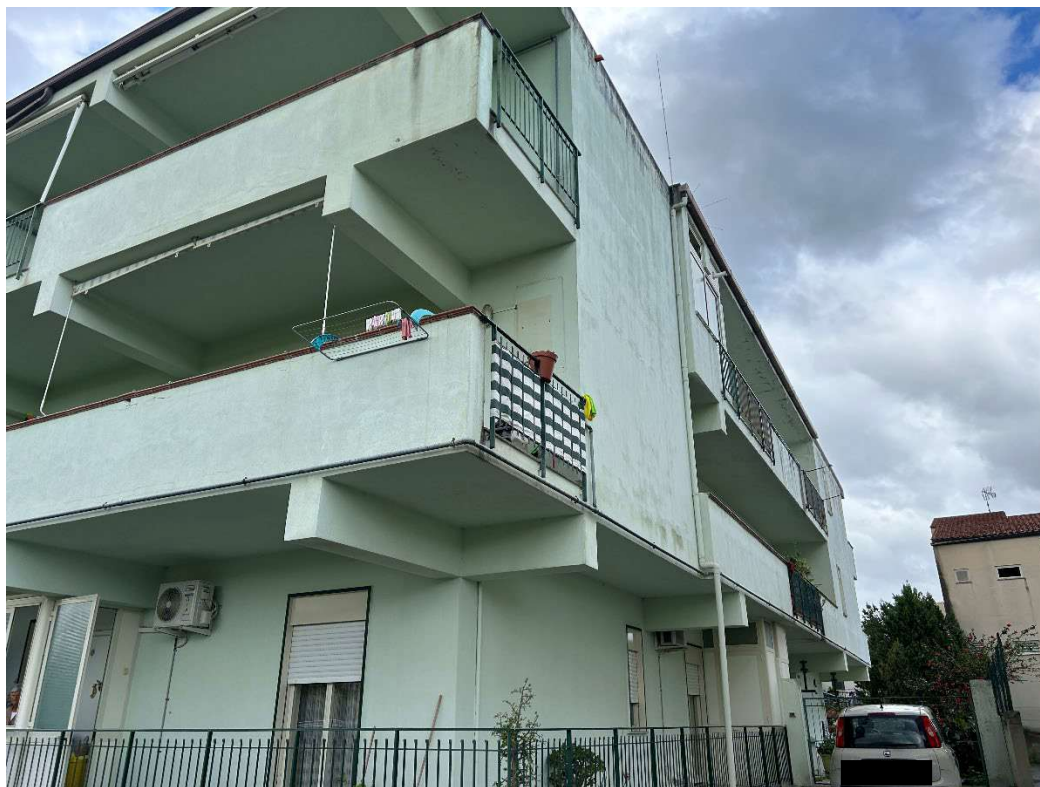
Figura 1 - Prospetto