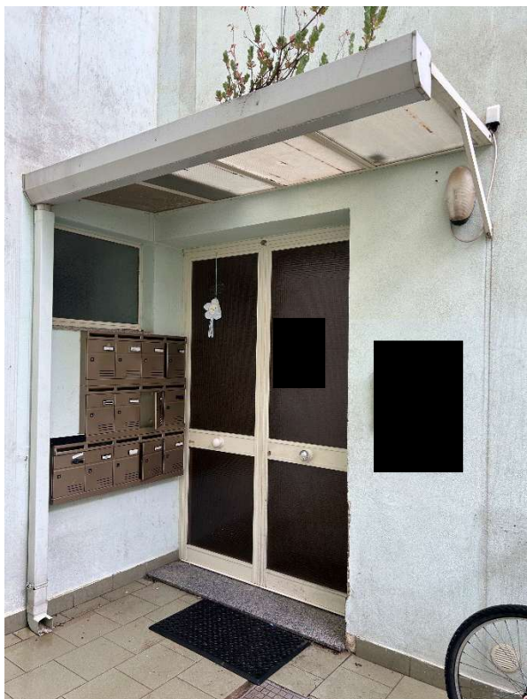
Figura 2 - Ingresso Palazzina B