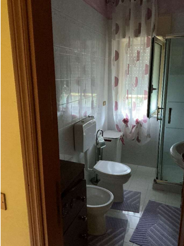
Figura 7 - Bagno n.1