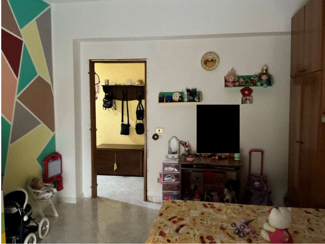
Figura 11 - Stanza n.2