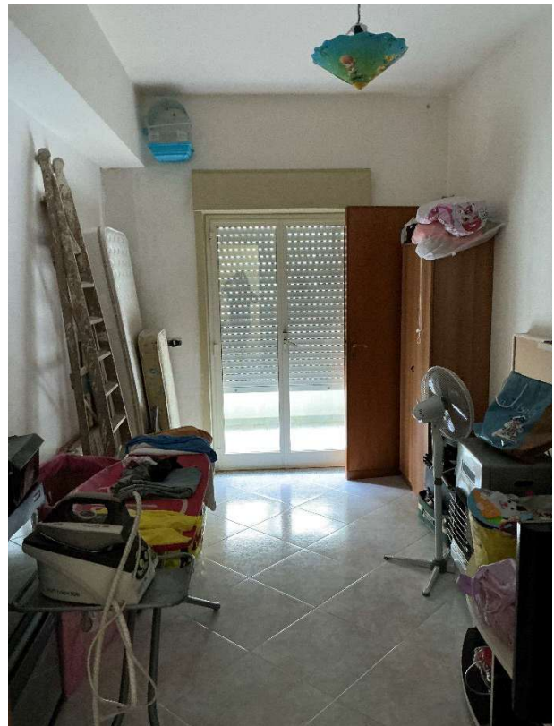
Figura 10 - Stanza n.1