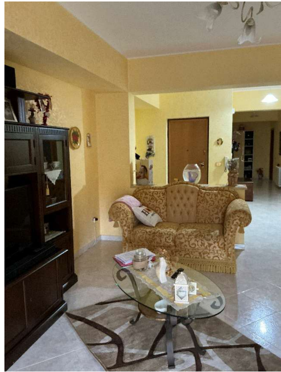
Figura 5 - Soggiorno