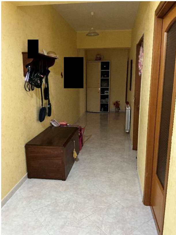
Figura 9 - Corridoio