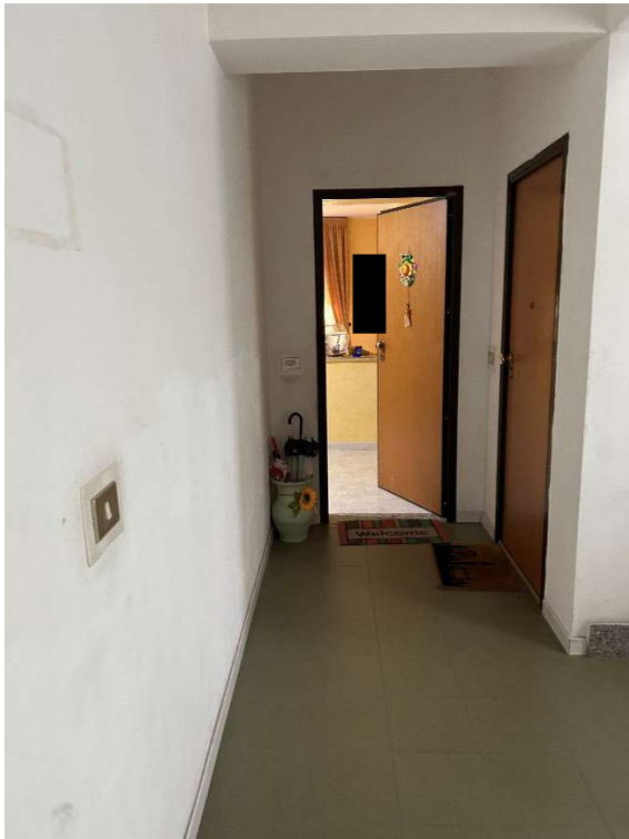
Figura 4 - Ingresso appartamento