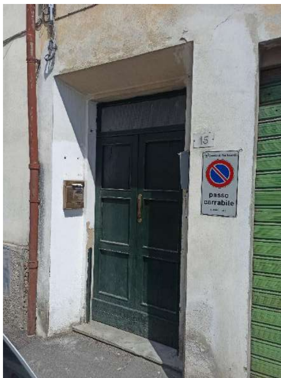
INGRESSO FRONTE STRADA