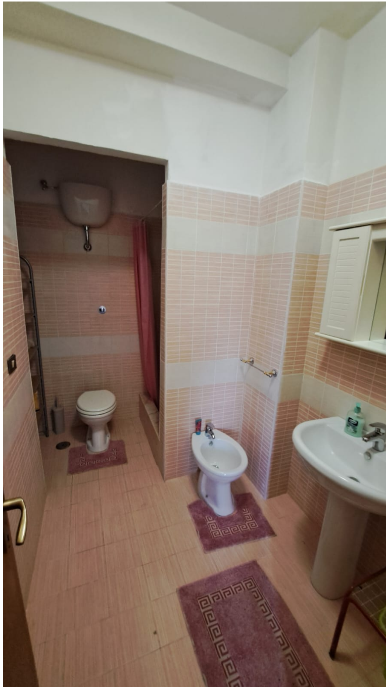
Vedute interne – bagno