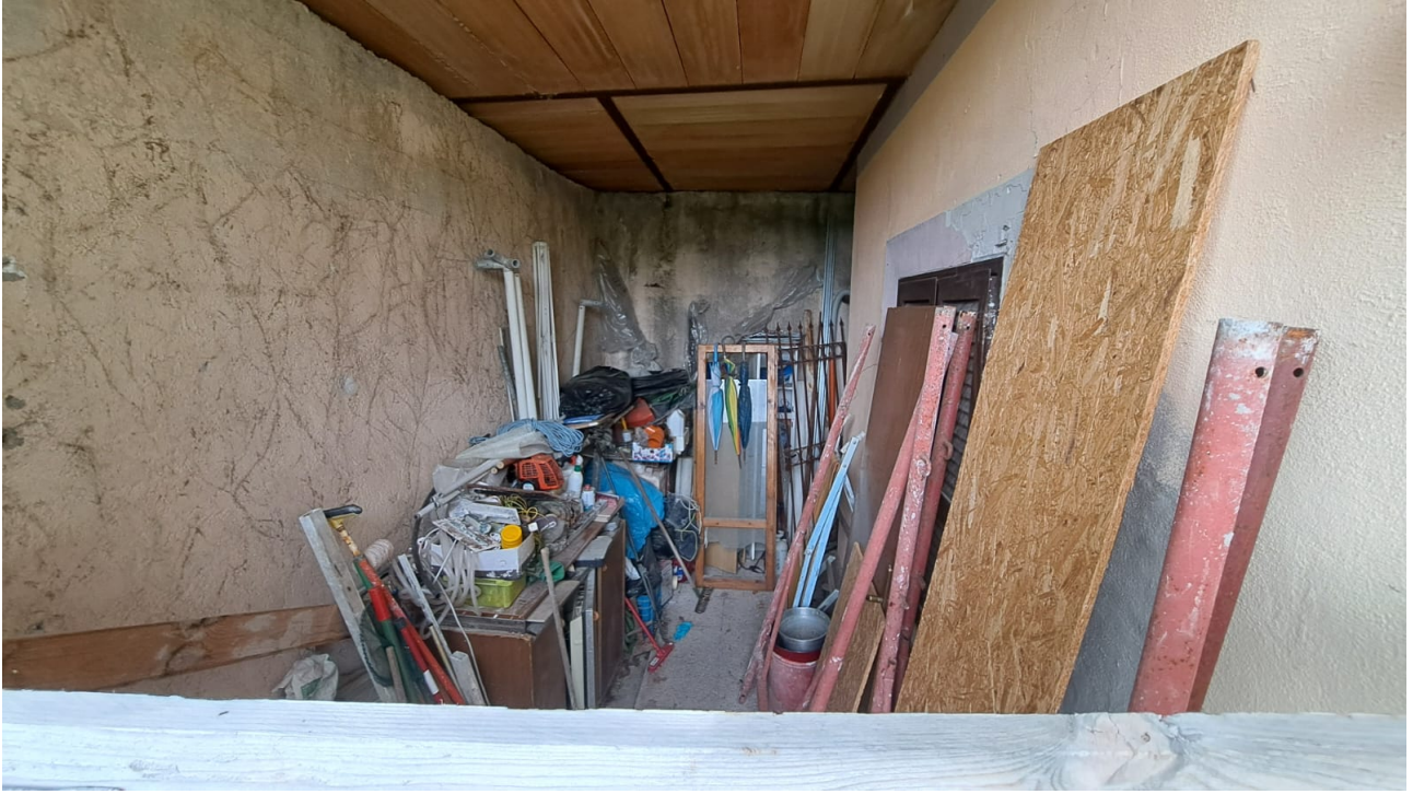
Vedute interne – porzione esterna