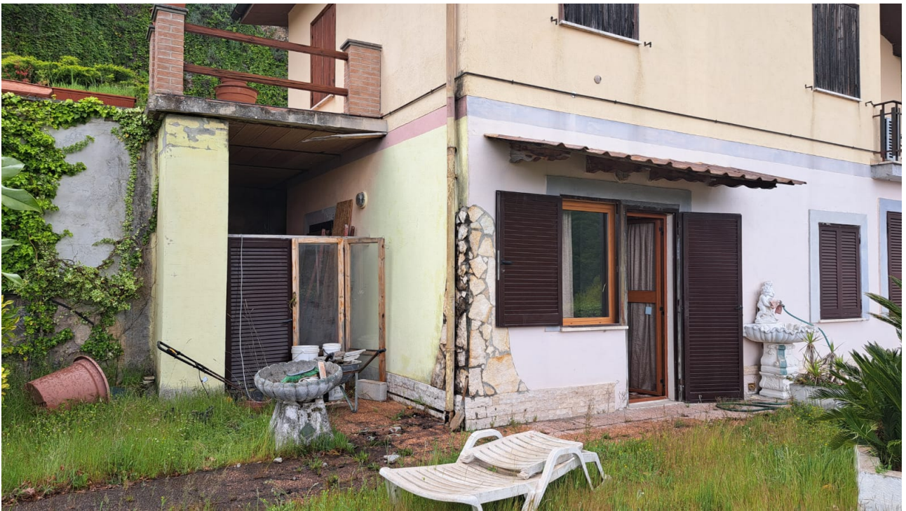
Vedute esterne del fabbricato