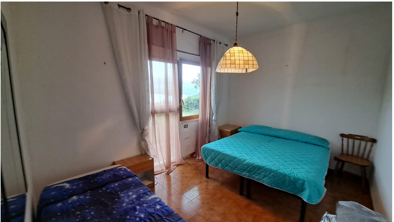
Vedute interne – camera e soggiorno