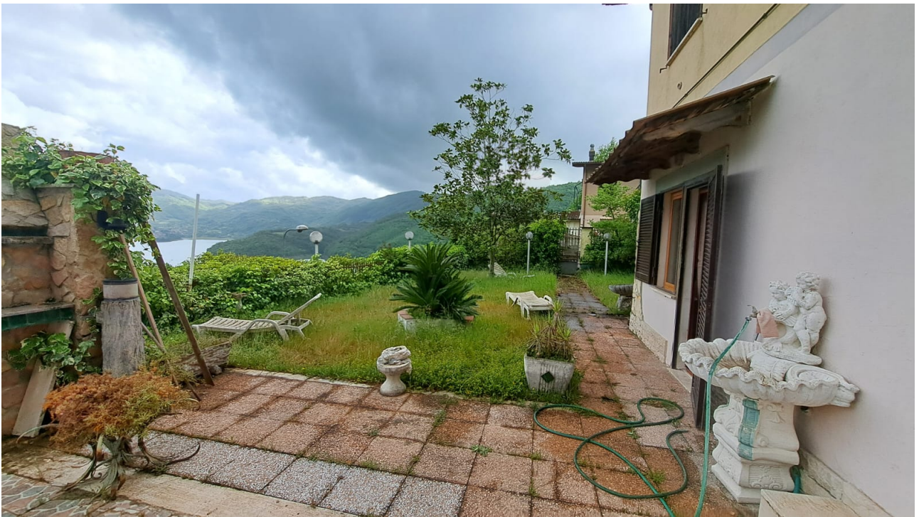
Vedute esterne del fabbricato