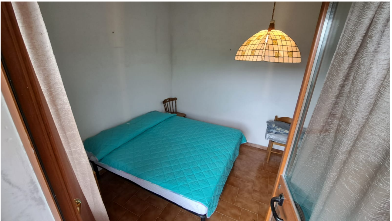
Vedute interne – camera - soggiorno