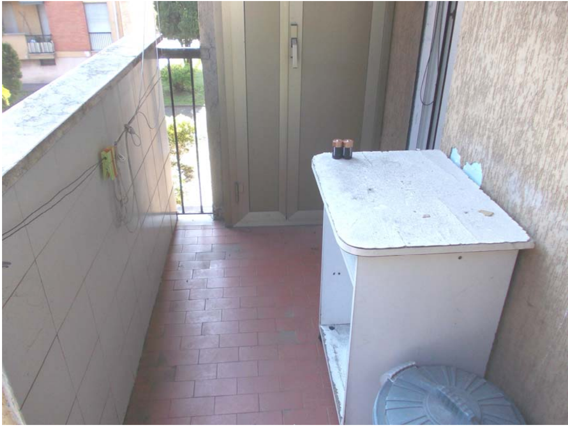
Vista corpo box dall'appartamento

Immobile ubicato in Vittuone (MI) via Madonna del Salvatore N. 6/10 R.G.E. n. 807/2025 del Tribunale di Milano