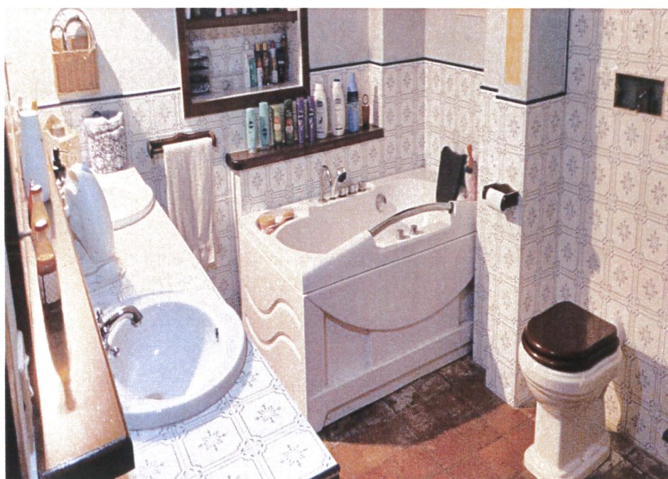
Vista interna bagno