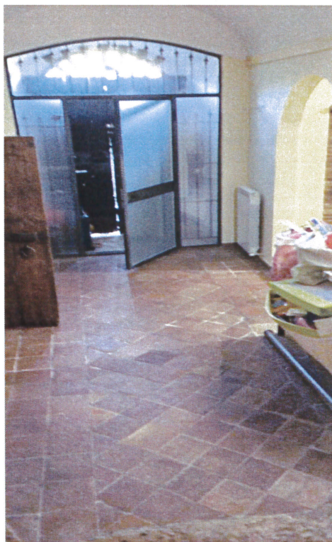
Vista generale ingresso piano terra