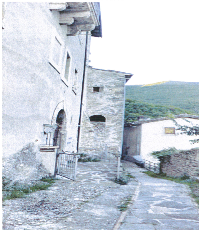
Vista esterna accesso abitazione da sud