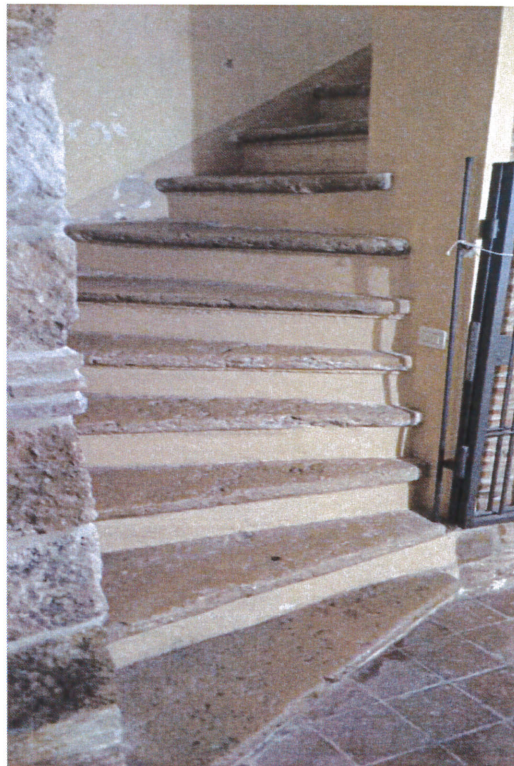
Vista scale interne