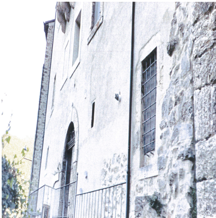
Altra vista esterna