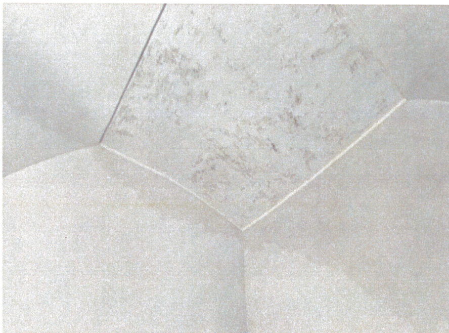
Altra vista macchie di umidità nella camera