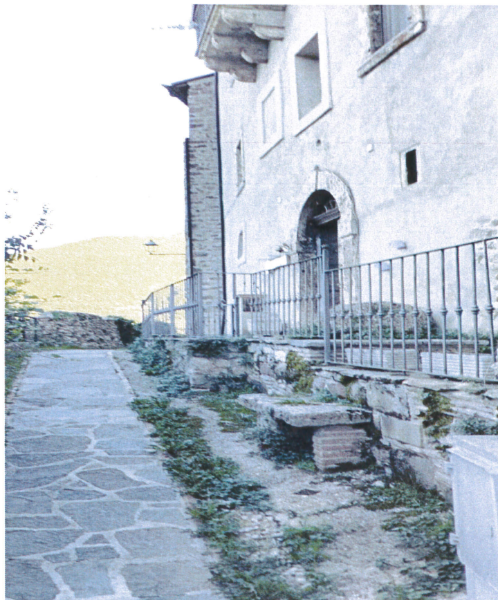
Vista esterna accesso all'abitazione da nord