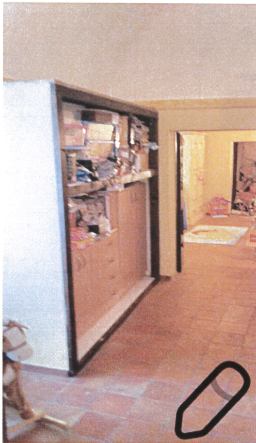
Corridoio piano primo con vista camera