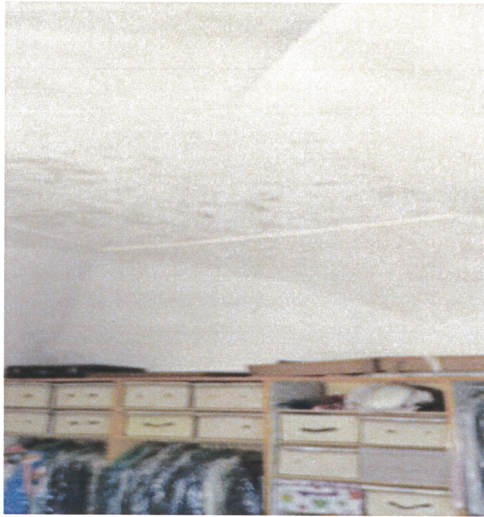
Vista soffitto camera con macchie di umidità