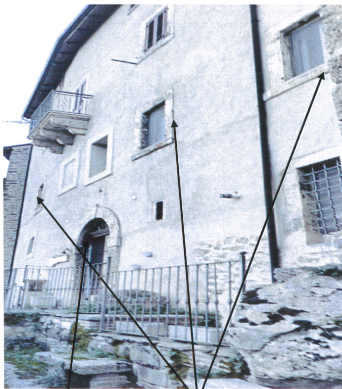
Portone di accesso