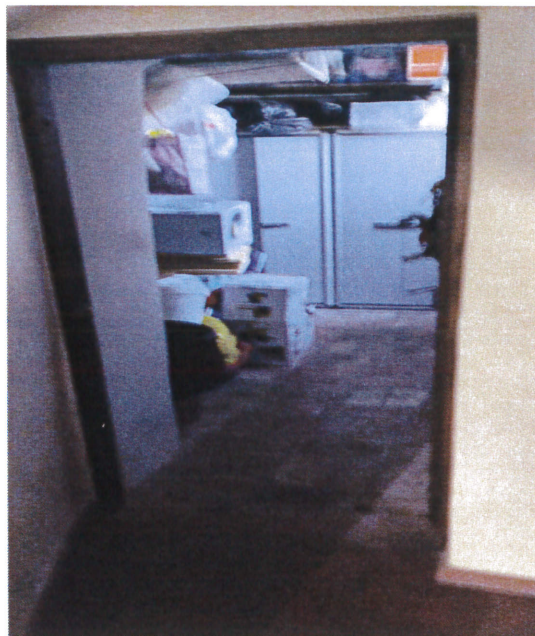
Vista disimpegno e ingresso cantina