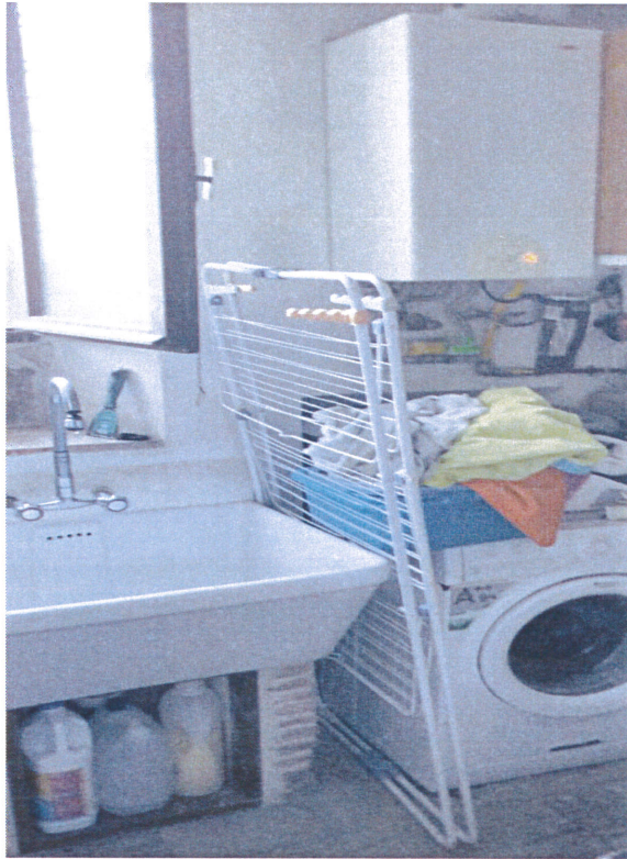
Lavandino e caldaia rinvenute nella cantina