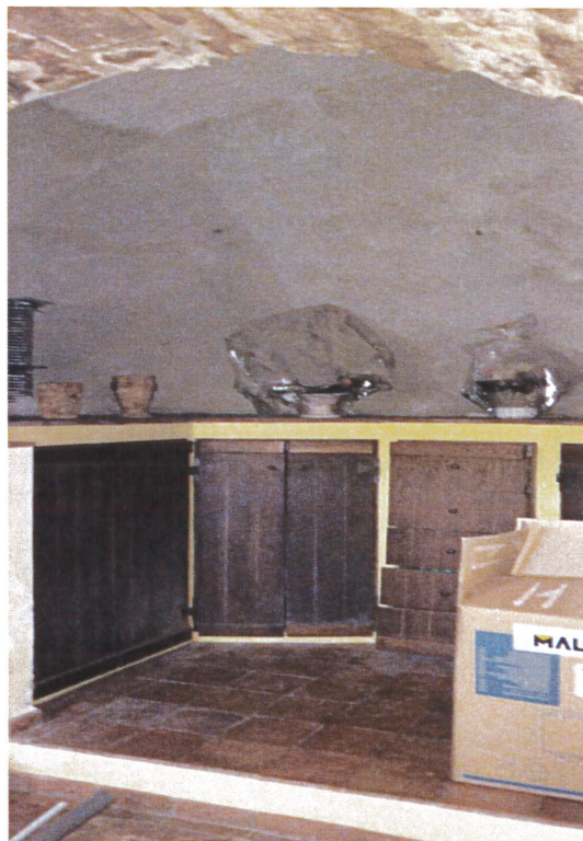
Vista nicchia piano terra