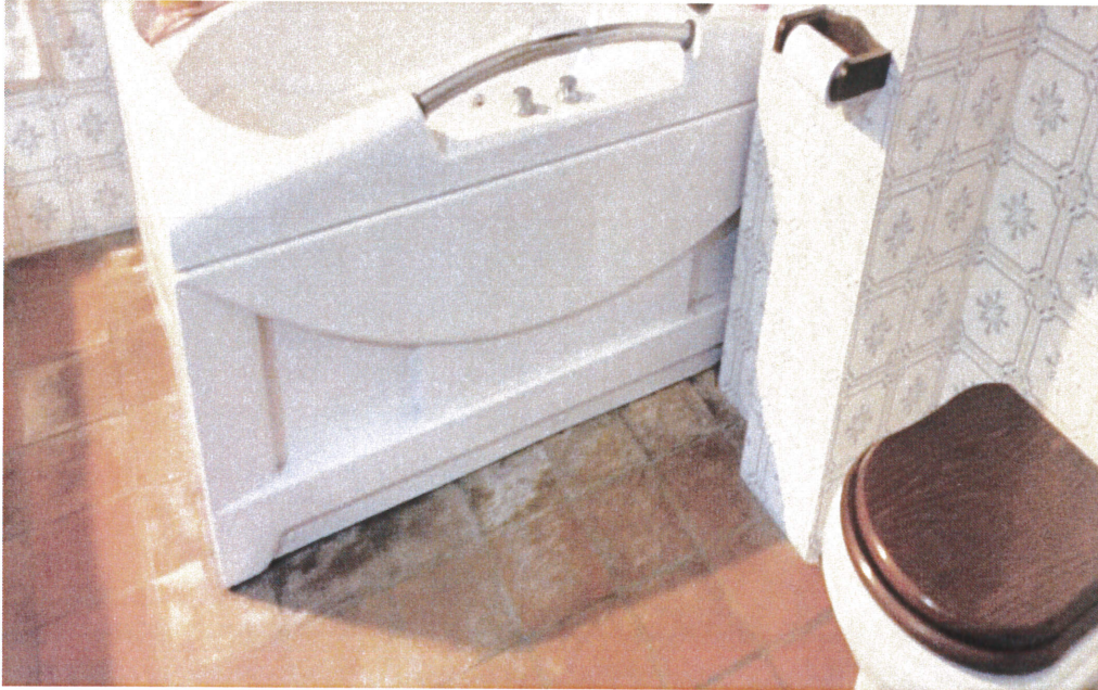
ista interna del bagno con evidenti segni di umidità (colore bianco sul pavimento)