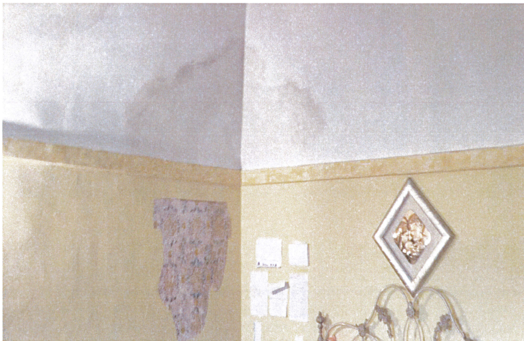
Altre macchie di umidità sul soffitto e sulle pareti della camera