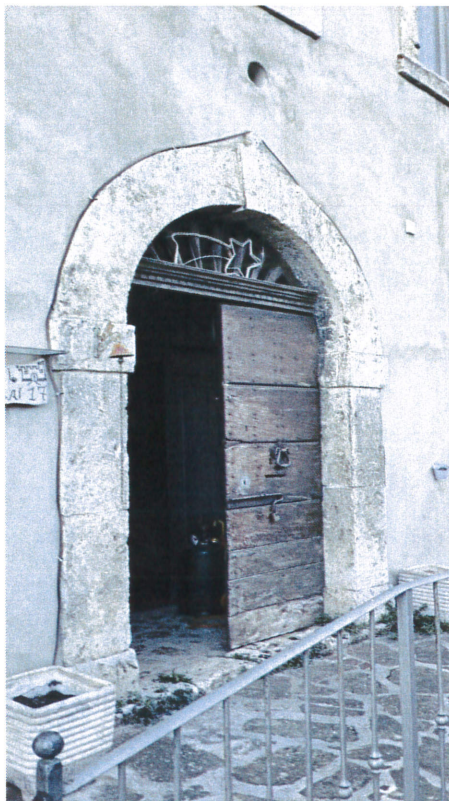
Particolare portone di accesso