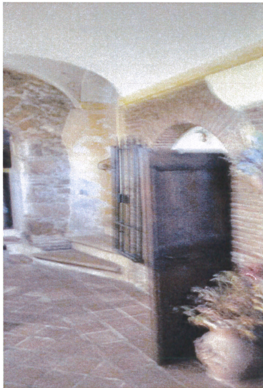
Ingresso e porta di accesso al bagno del piano terra