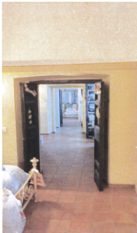
Vista disimpegno/corridoio piano primo