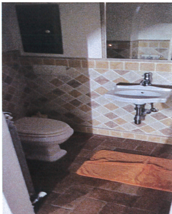
Vista interna bagno piano terra