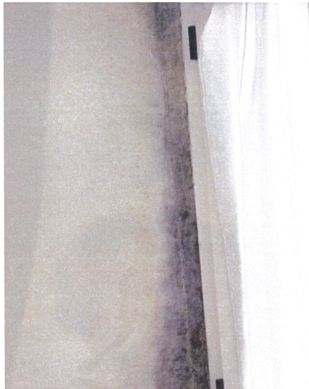
Particolare macchie di condensa agli angoli delle finestre