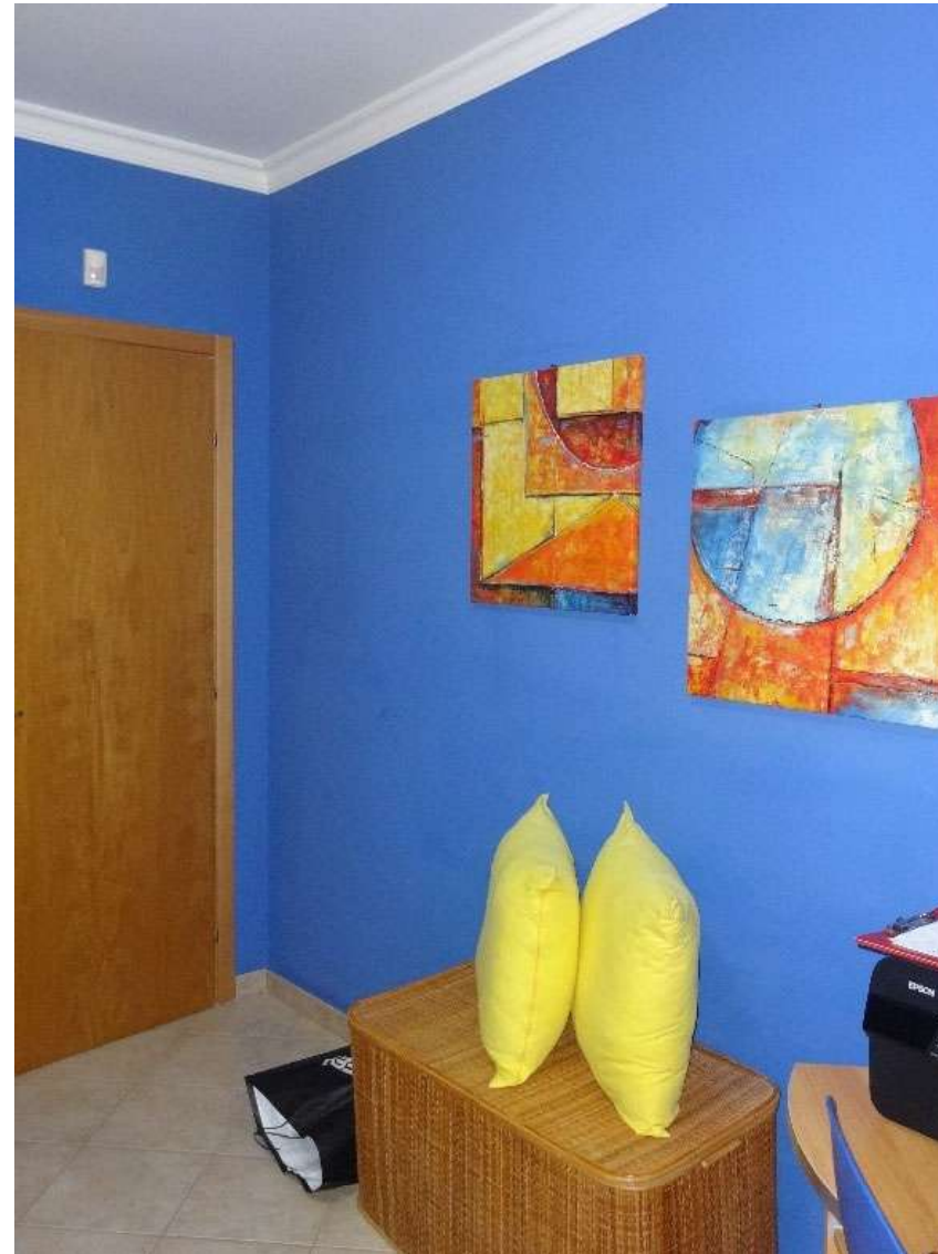
Foto 18-Interni del vano n.1