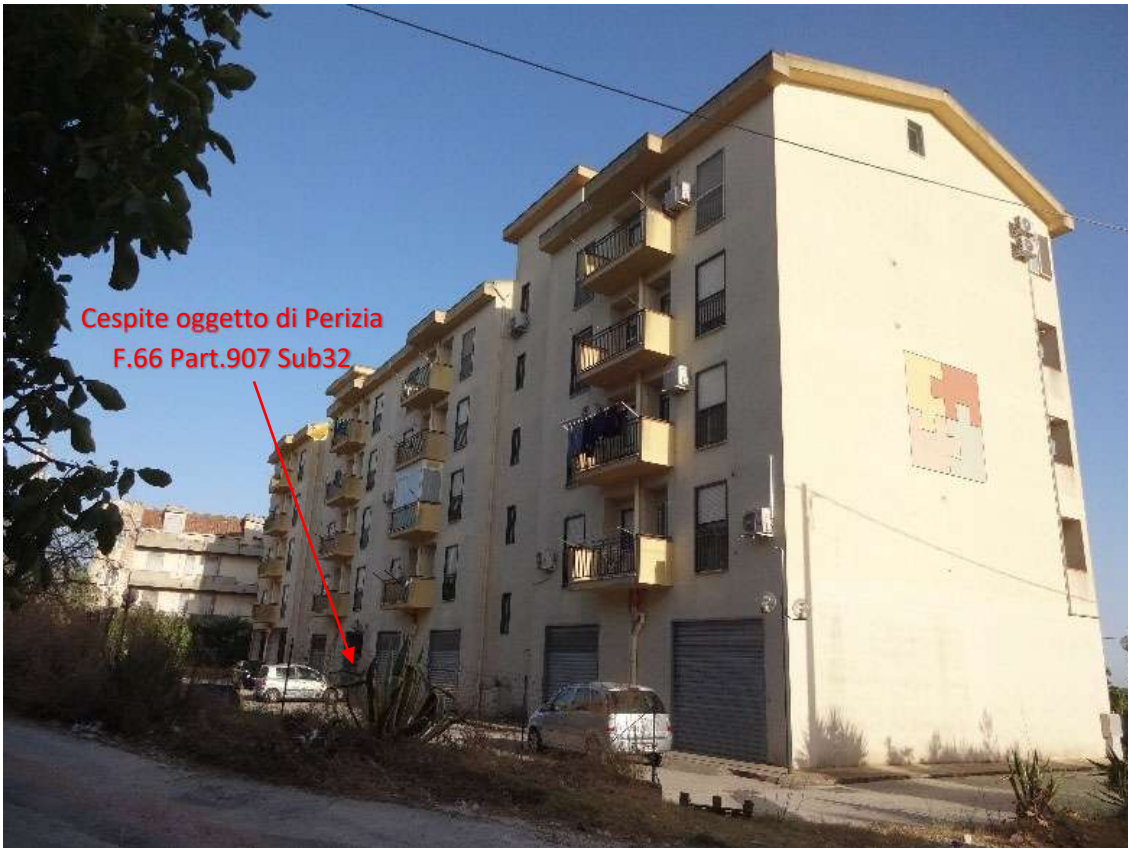
Foto 4 – Prospetto Posteriore (nord) e Prospetto Laterale (ovest)