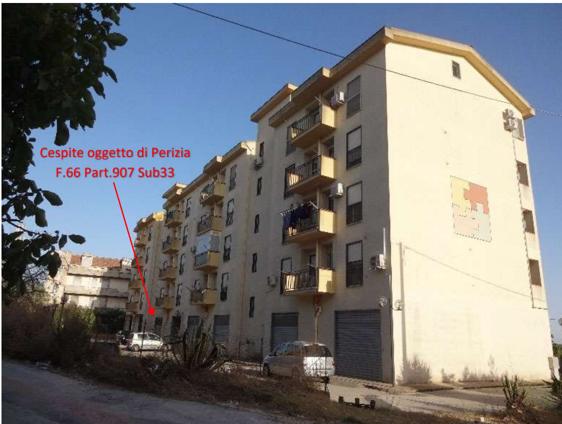
Foto 4 – Prospetto Posteriore (nord) e Prospetto Laterale (ovest)