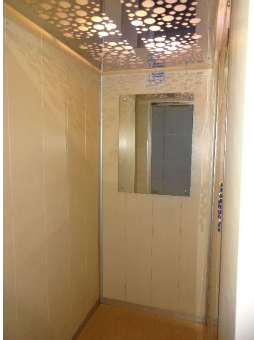
Foto 12-Finiture condominiali