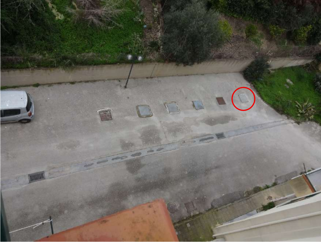
Foto 8-Vasche idriche in corrispondenza del prospetto posteriore (quella cerchiata in rosso è a servizio dell'appartamento costituente il lotto)