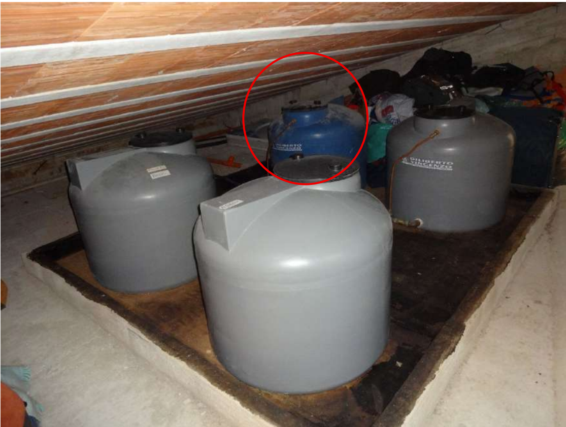
Foto 7-Vasche idriche ubicate nel sottotetto condominiale (quella cerchiata in rosso è a servizio dell'appartamento costituente il lotto)