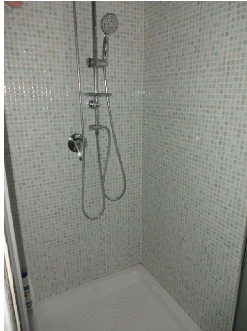
Foto 22-Interni del WC n.2