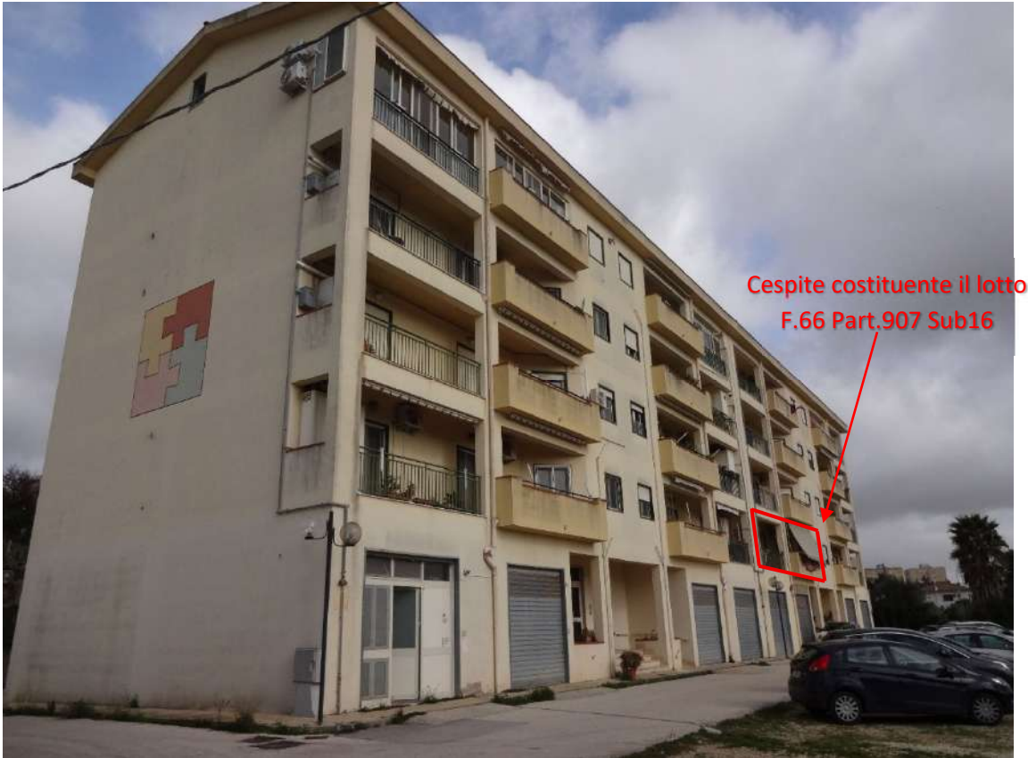
Foto 3-Prospetto principale su via Nilde Iotti