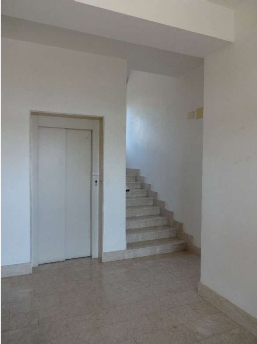
Foto 11-Finiture condominiali