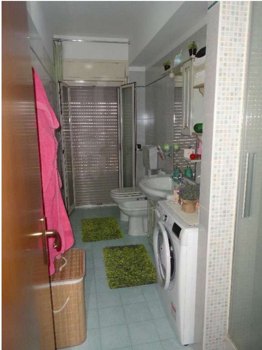
Foto 21-Interni del WC n.2