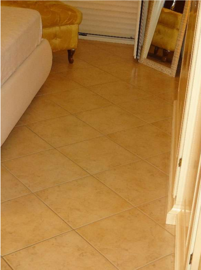
Foto 26-Interni del vano n.2