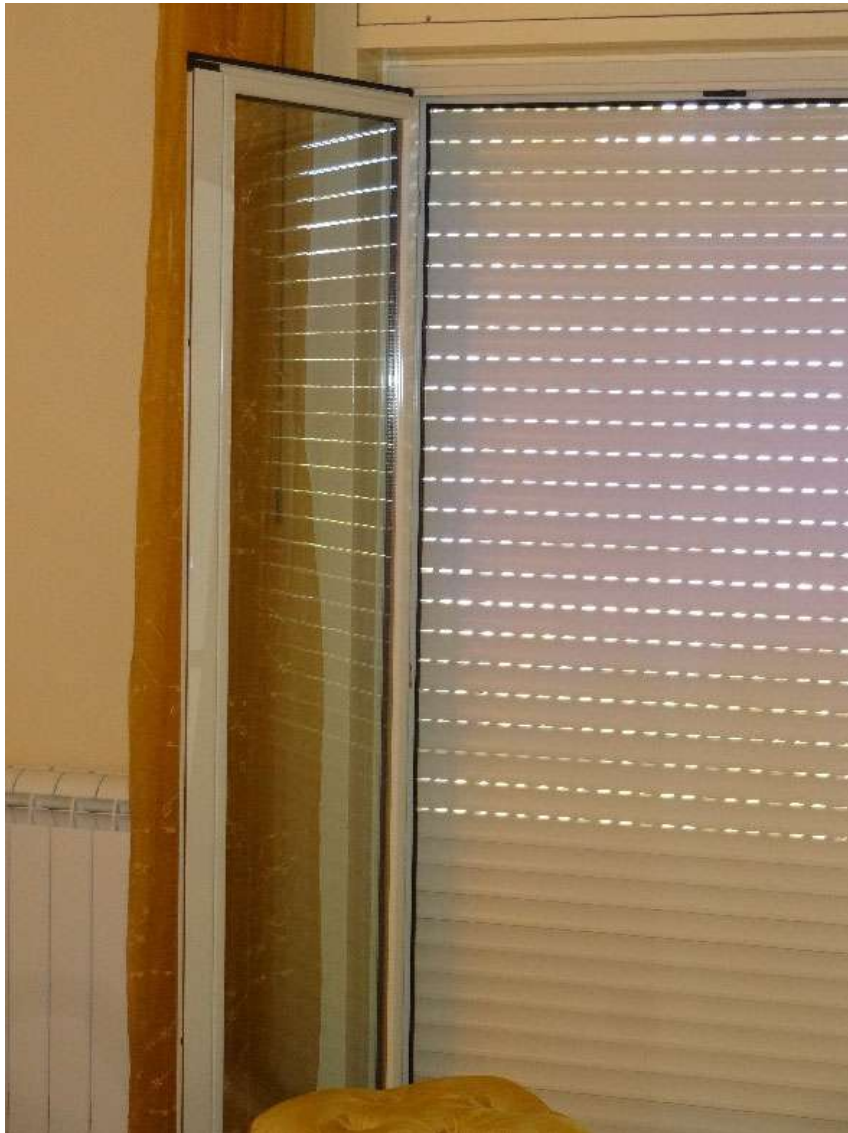
Foto 28-Interni del vano n.2