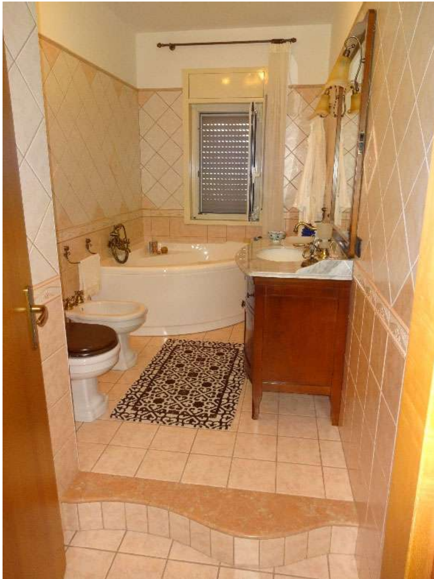
Foto 20-Interni del WC n.1