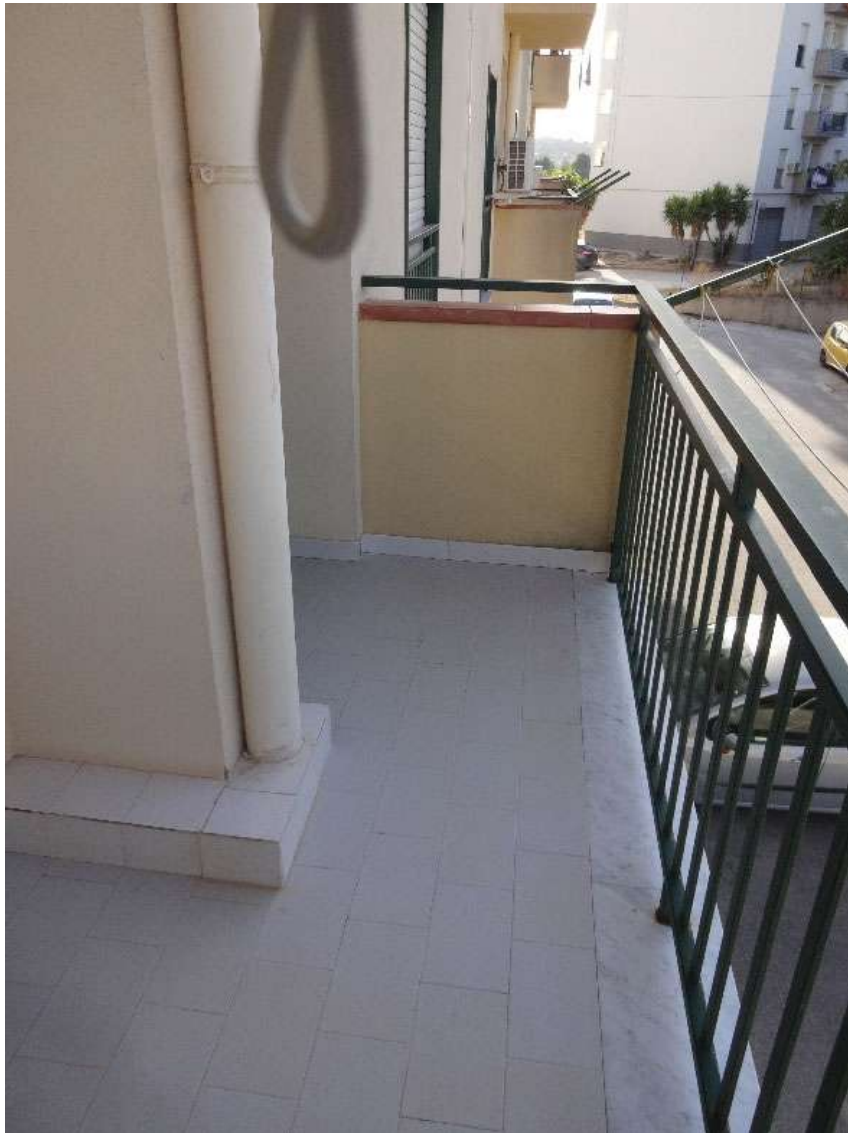
Foto 23-Balcone a servizio del WC n.1 e del WC n.2