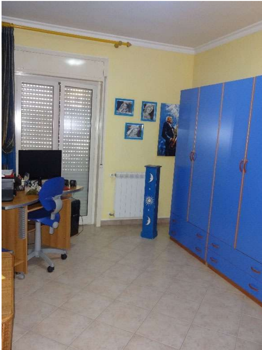
Foto 17-Interni del vano n.1