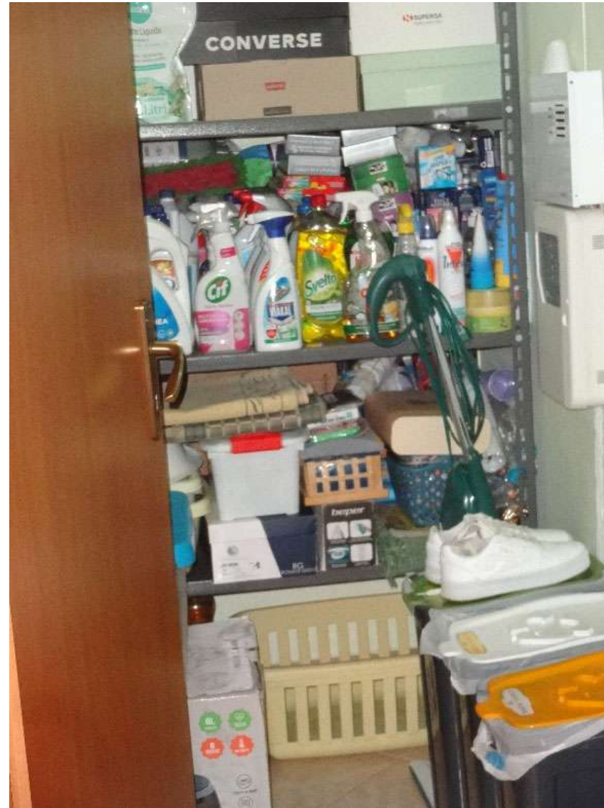
Foto 27-Interni del ripostiglio