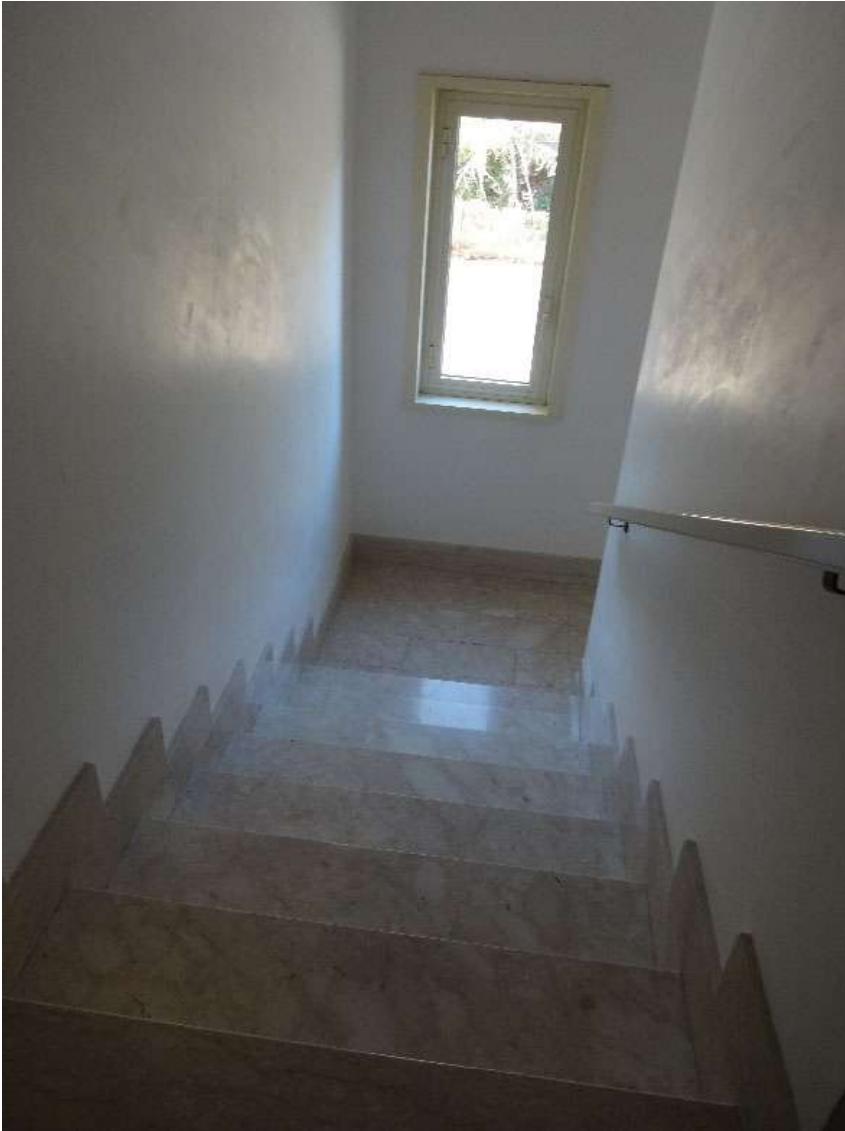
Foto 9-Finiture condominiali