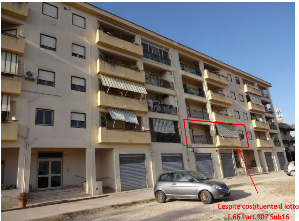
Foto 4-Prospetto principale su via Nilde Iotti