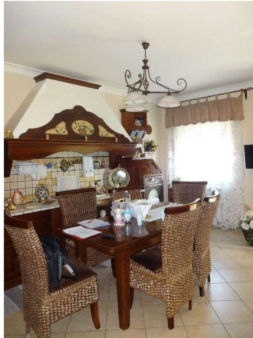
Foto 34-Interni della cucina