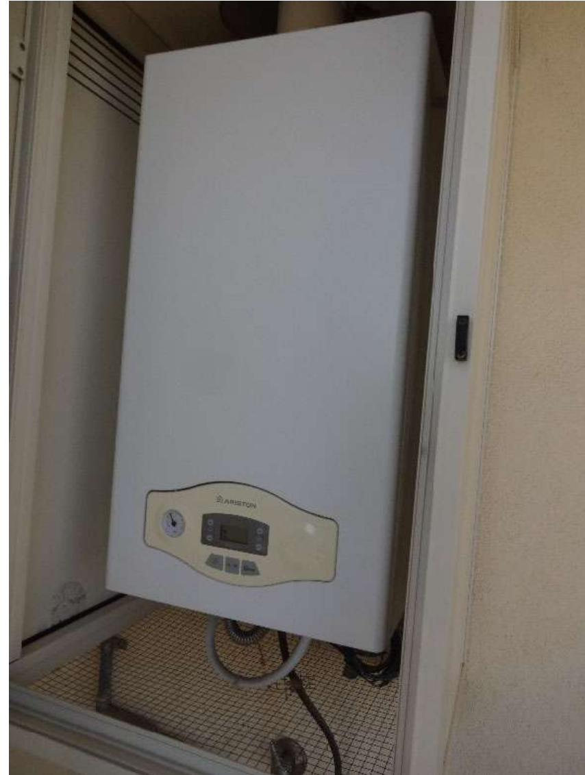
Foto 38-Caldia murale