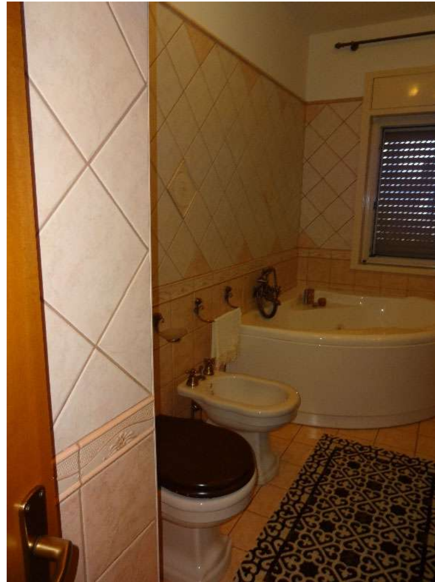
Foto 19-Interni del WC n.1