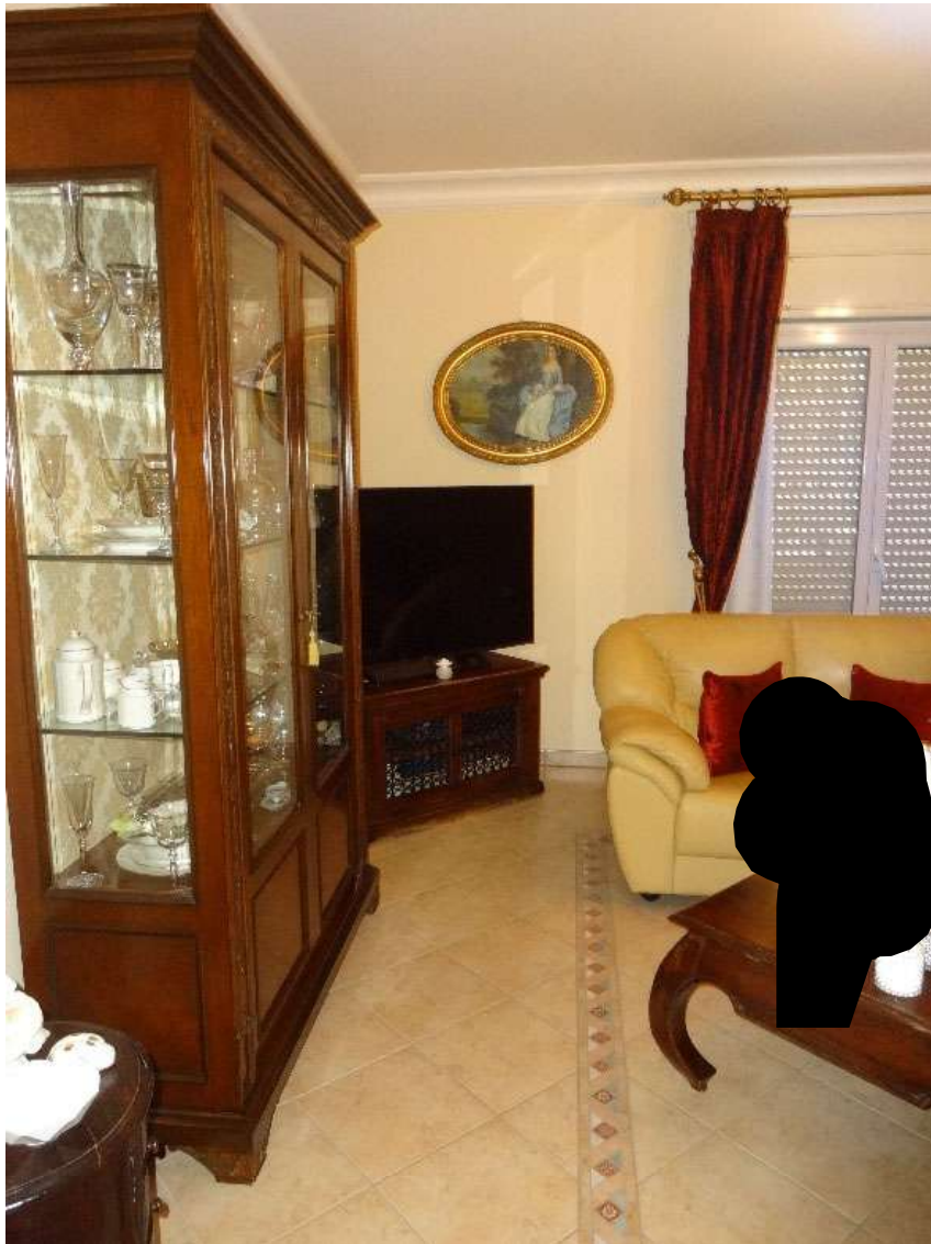
Foto 31-Interni del vano n.4