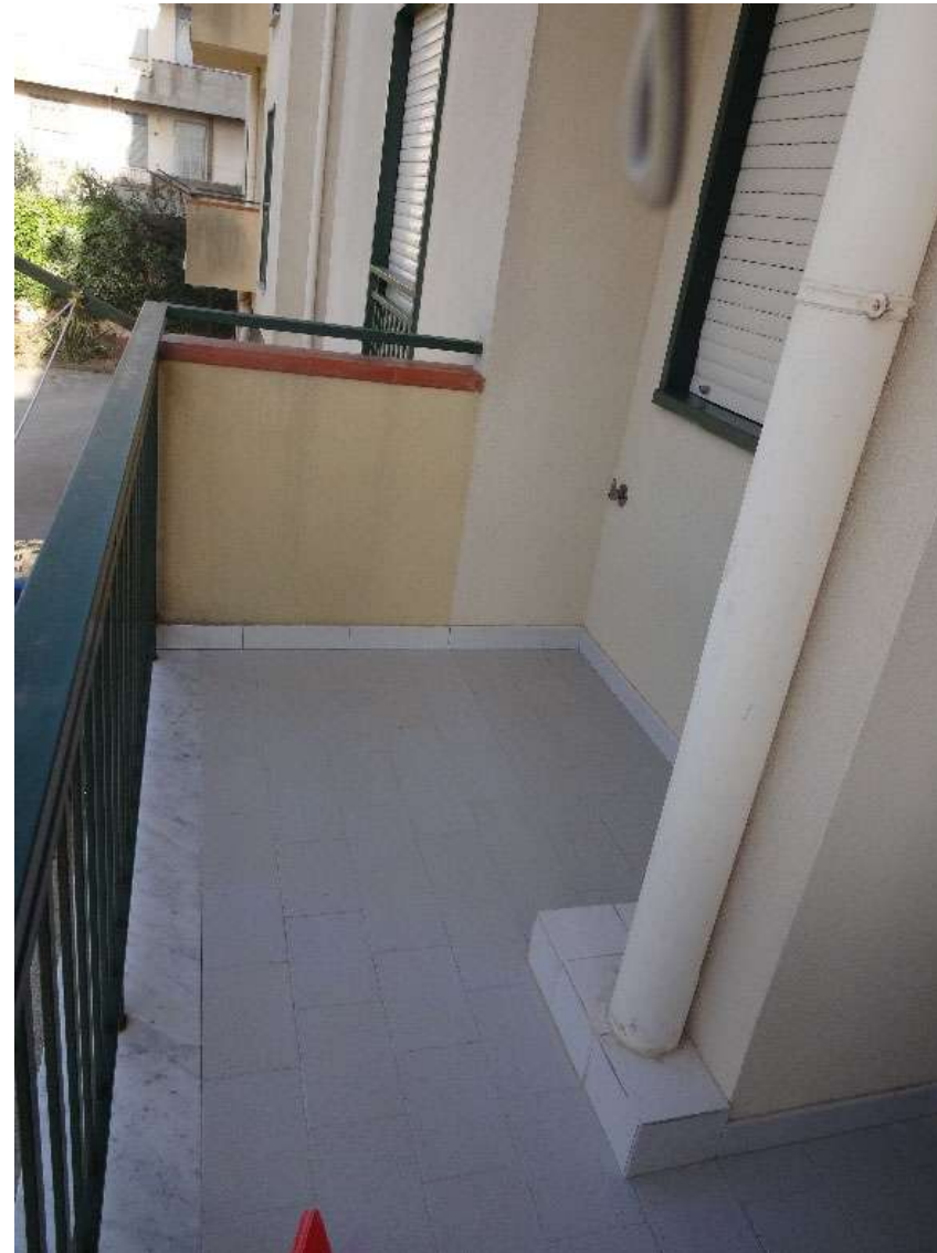
Foto 24-Balcone a servizio del WC n.1 e del WC n.2