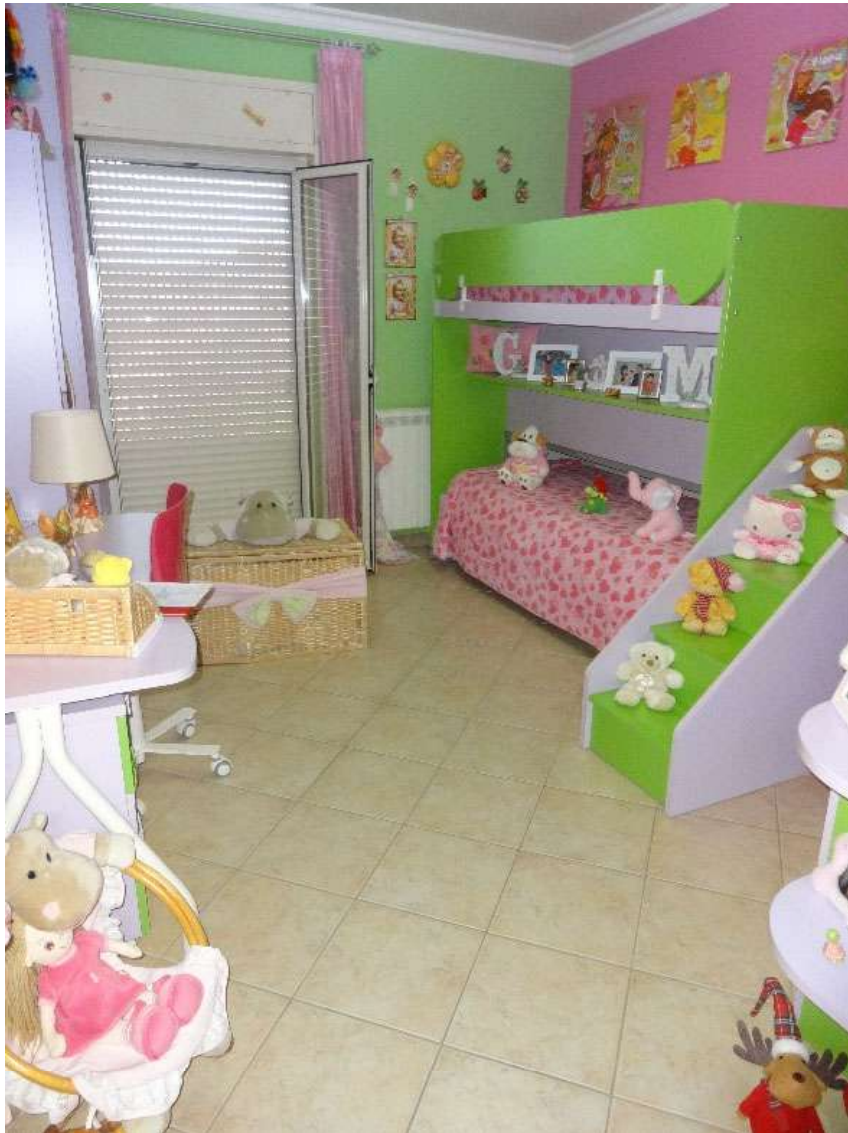
Foto 30-Interni del vano n.3