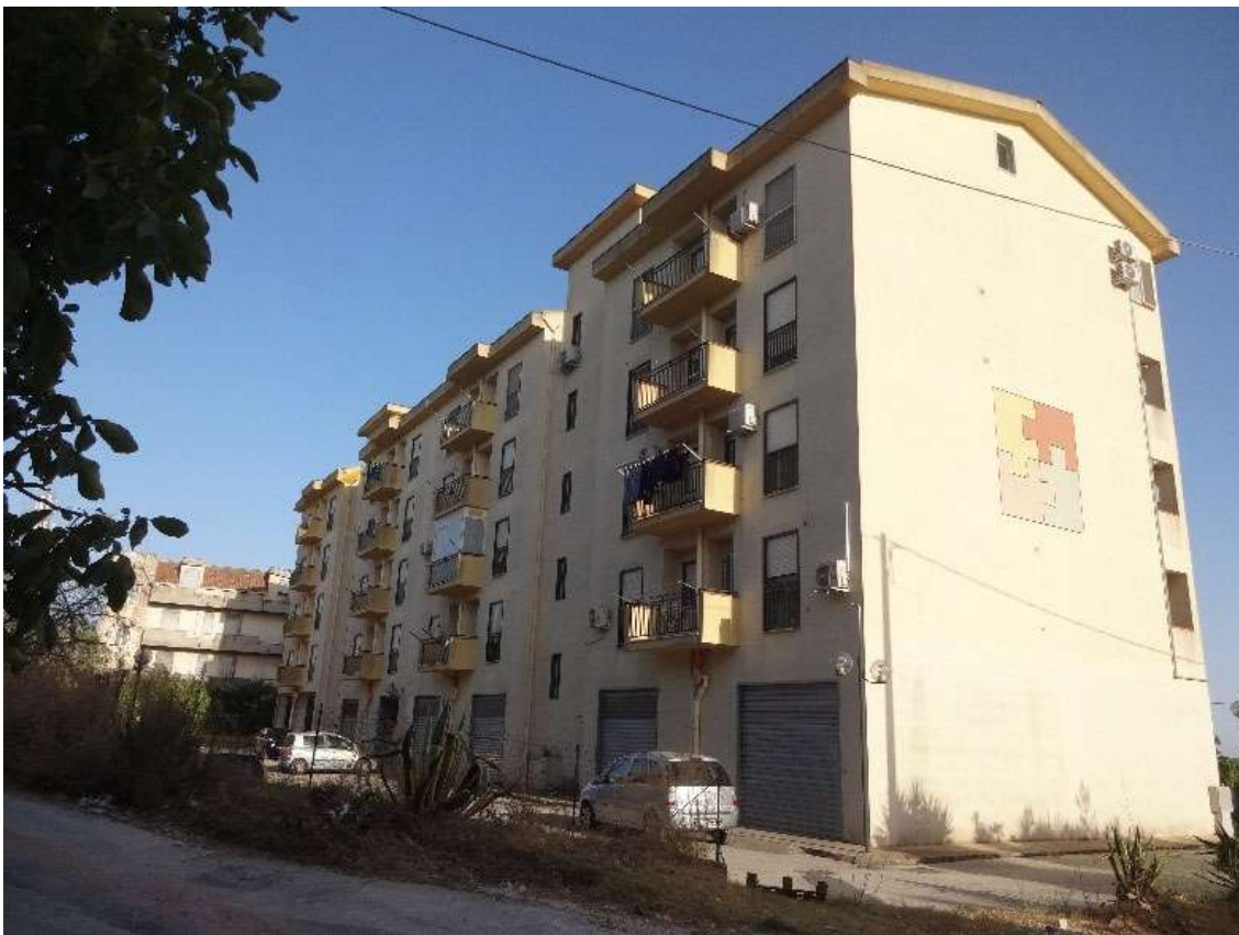
Foto 4 – Prospetto Posteriore (nord) e Prospetto Laterale (ovest)