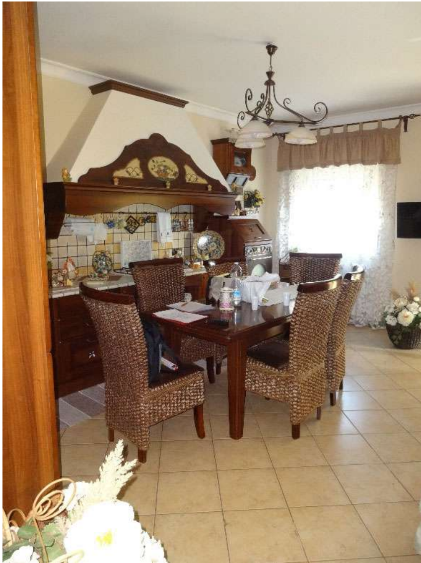
Foto 33-Interni della cucina