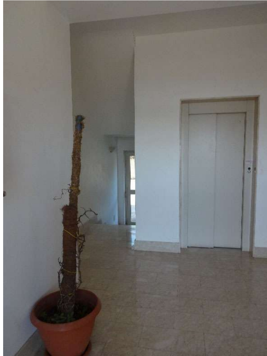
Foto 10-Finiture condominiali