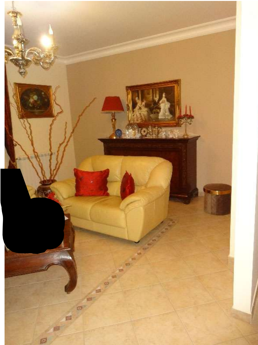
Foto 32-Interni del vano n.4