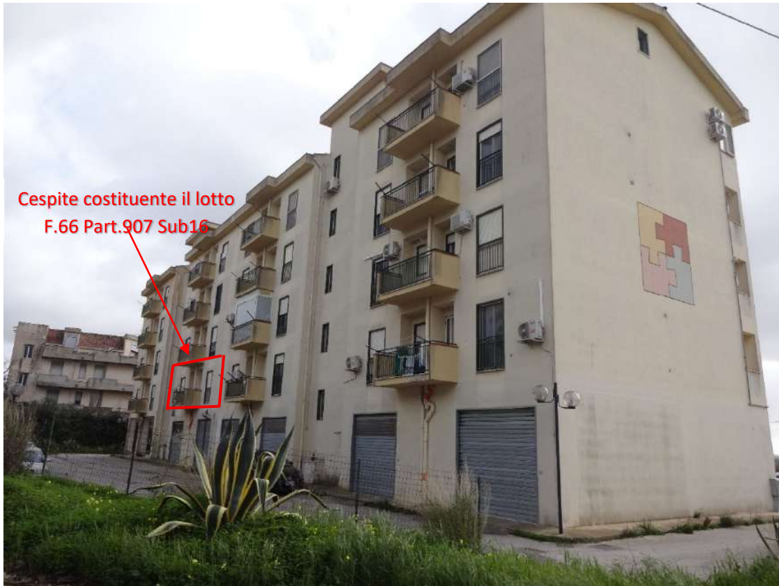
Foto 5-Prospetto Posteriore