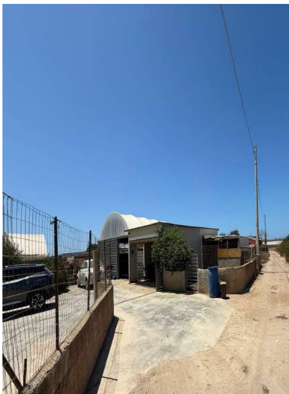
20 – p.lla 423 pertinenza anche alla logistica