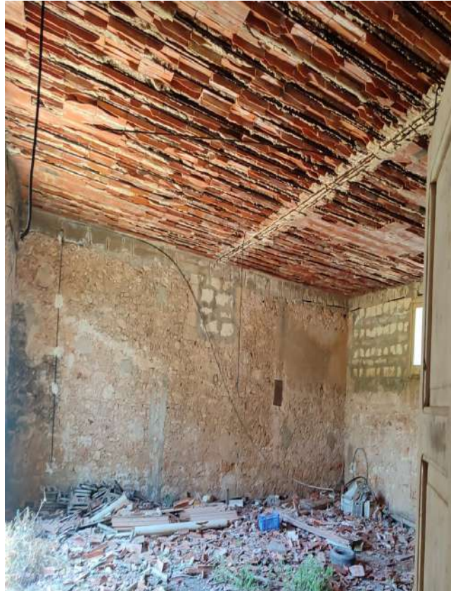
32 - p.la 1412 magazzino fatiscente