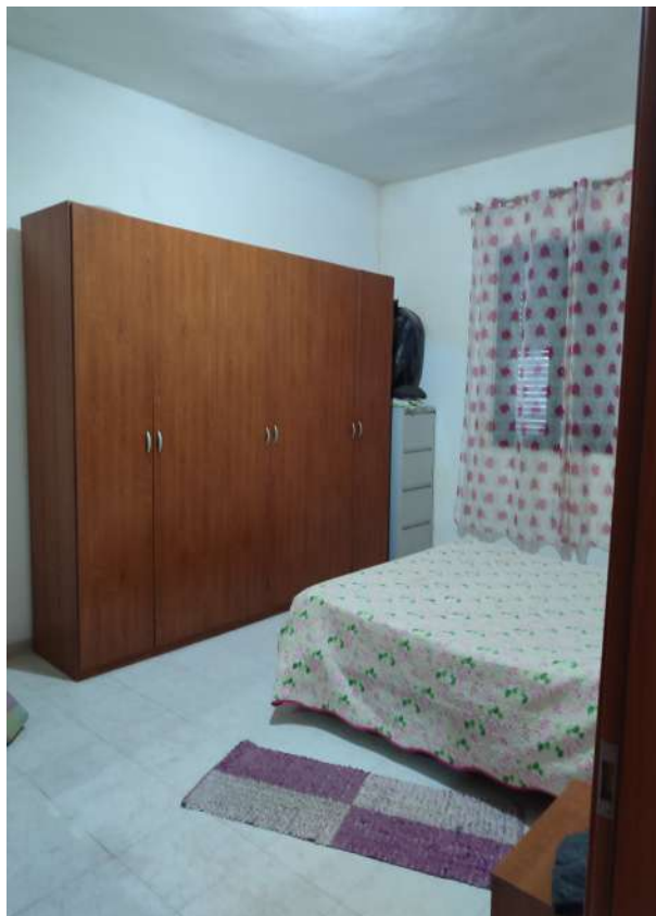
13 – vano di m 2 18,75