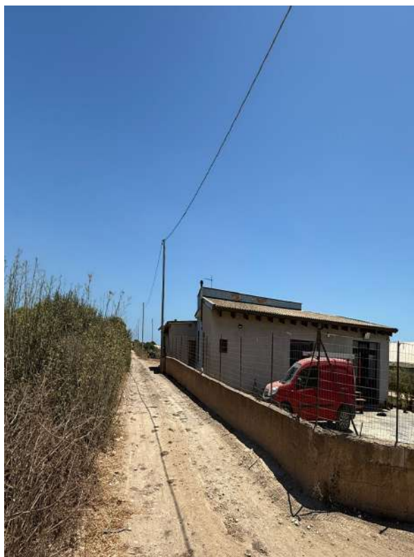
19 – p.lla 423 pertinenza all’abitazione