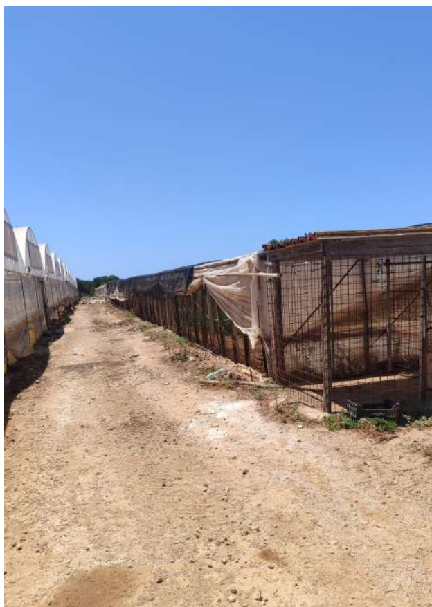
25 – p.lla 422 serre in legno