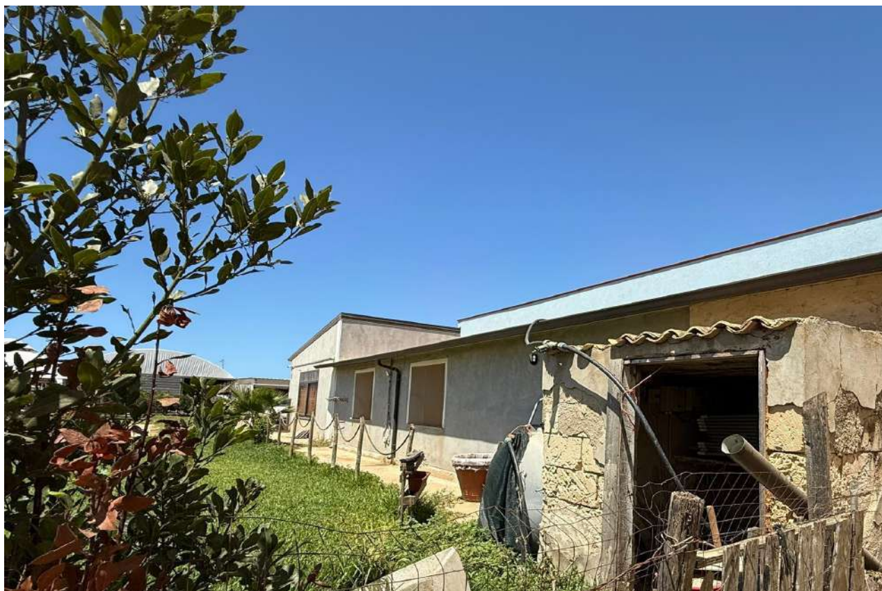
4 - prospetto Sud abitazione rurale – C.da Pipitona