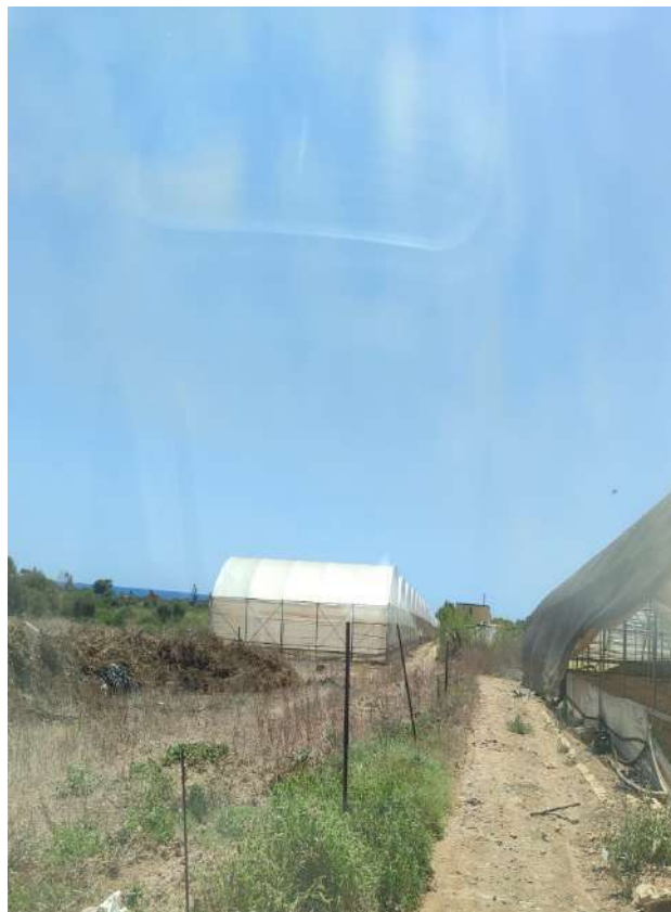
28 - p.lla 1289 a sinistra serre multiple in acciaio