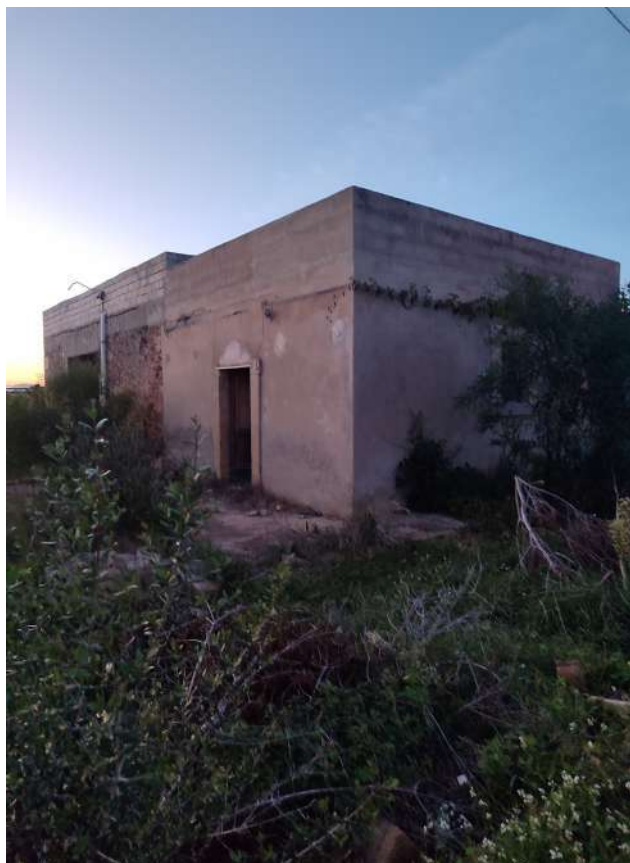
29 - p.lla 1412 magazzino fatiscente