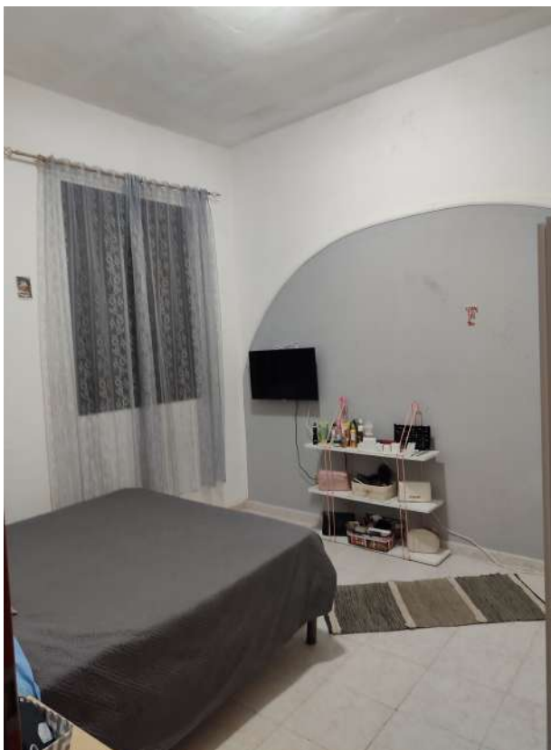
14 – vano di m 2 11,80