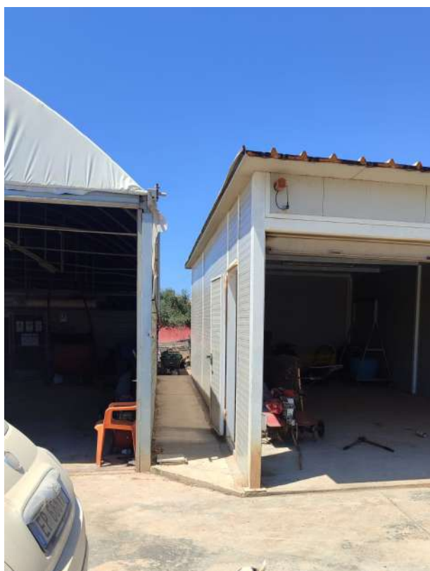
23 – p.lla 422 capannone in metallo prefabbr.