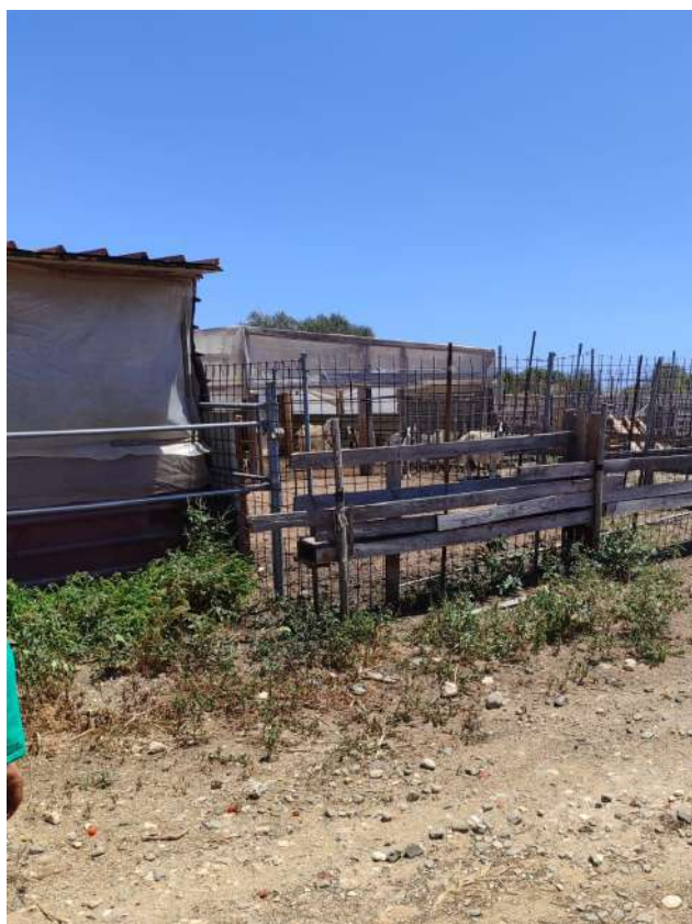
27 – p.lla 67 tettoie e box per capre