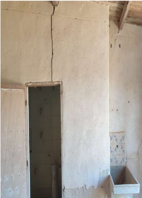
31 - p.la 1412 magazzino fatiscente