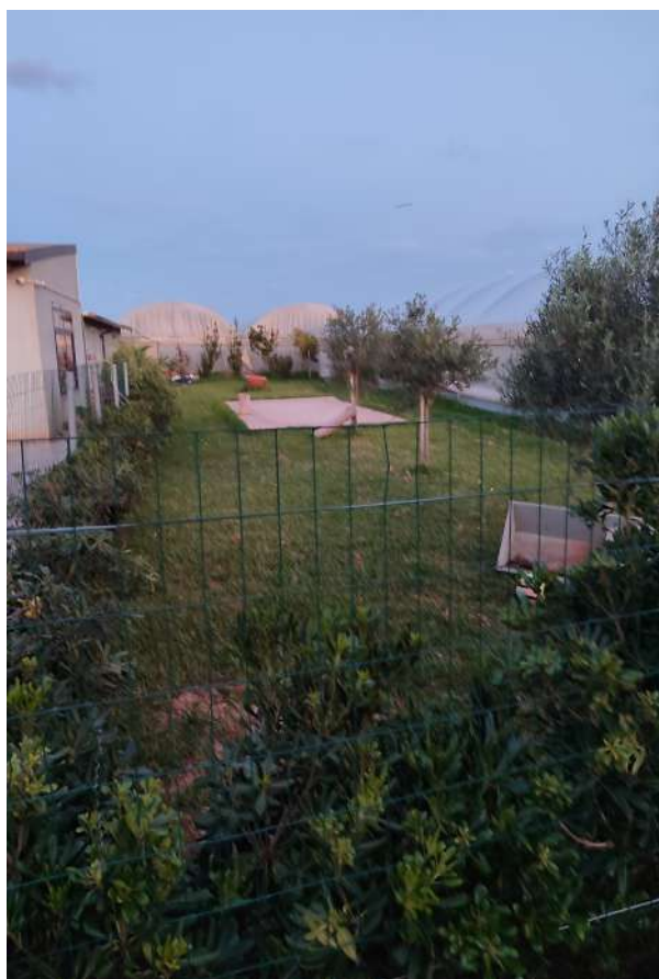
21 – p.lla 423 pertinenza all’abitazione