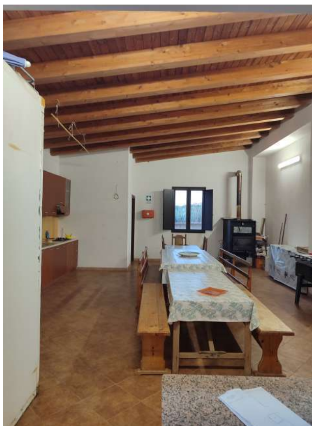
6 – locale ex stalla