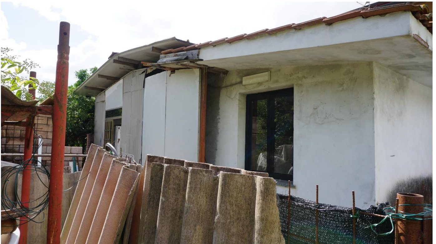
Figura 26 – manufatto esterno da rimuovere