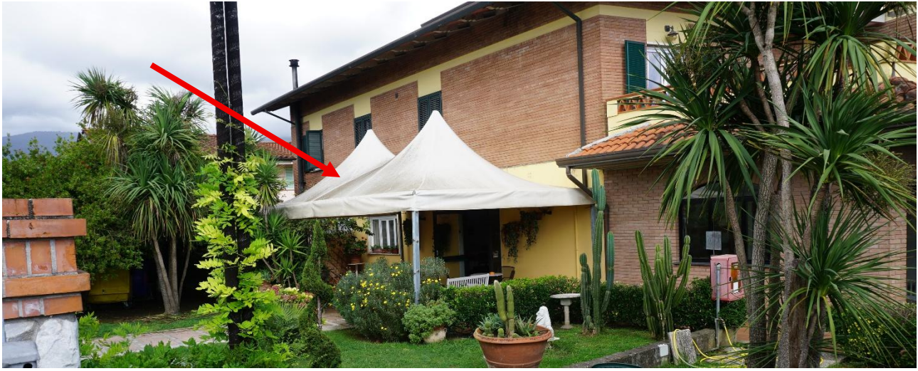
Figura 17 – Tenda da rimuovere