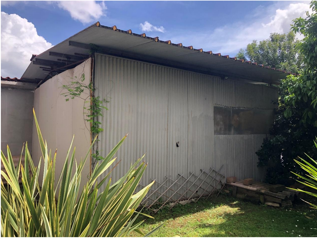
Figura 31 – Manufatto di pertinenza da rimuovere