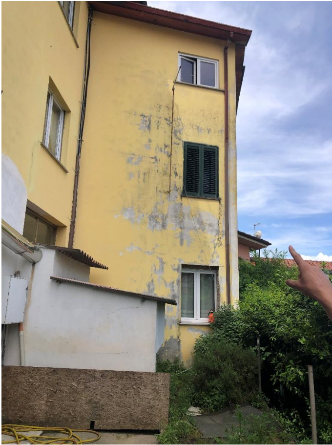
Figura 33 -Forno esterno da rimuovere