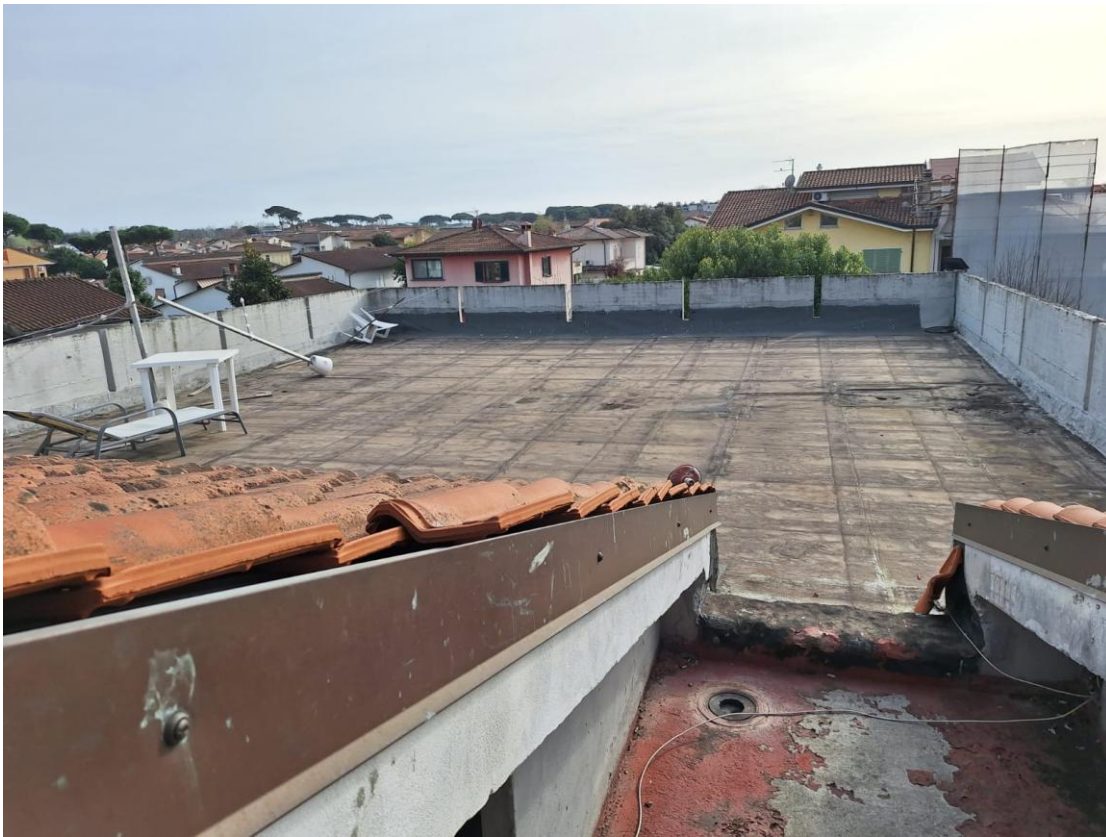
Figura 34 – Copertura piana al piano secondo