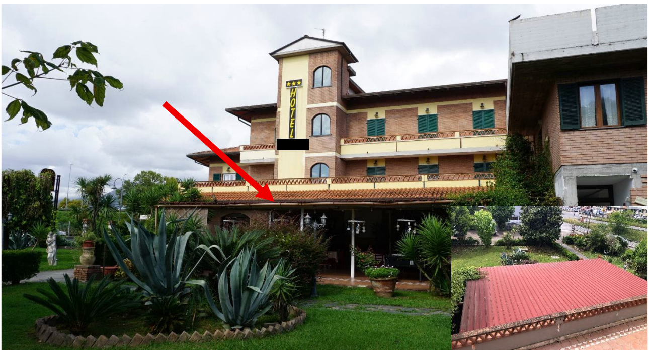
Figura 19 – Tettoia da rimuovere