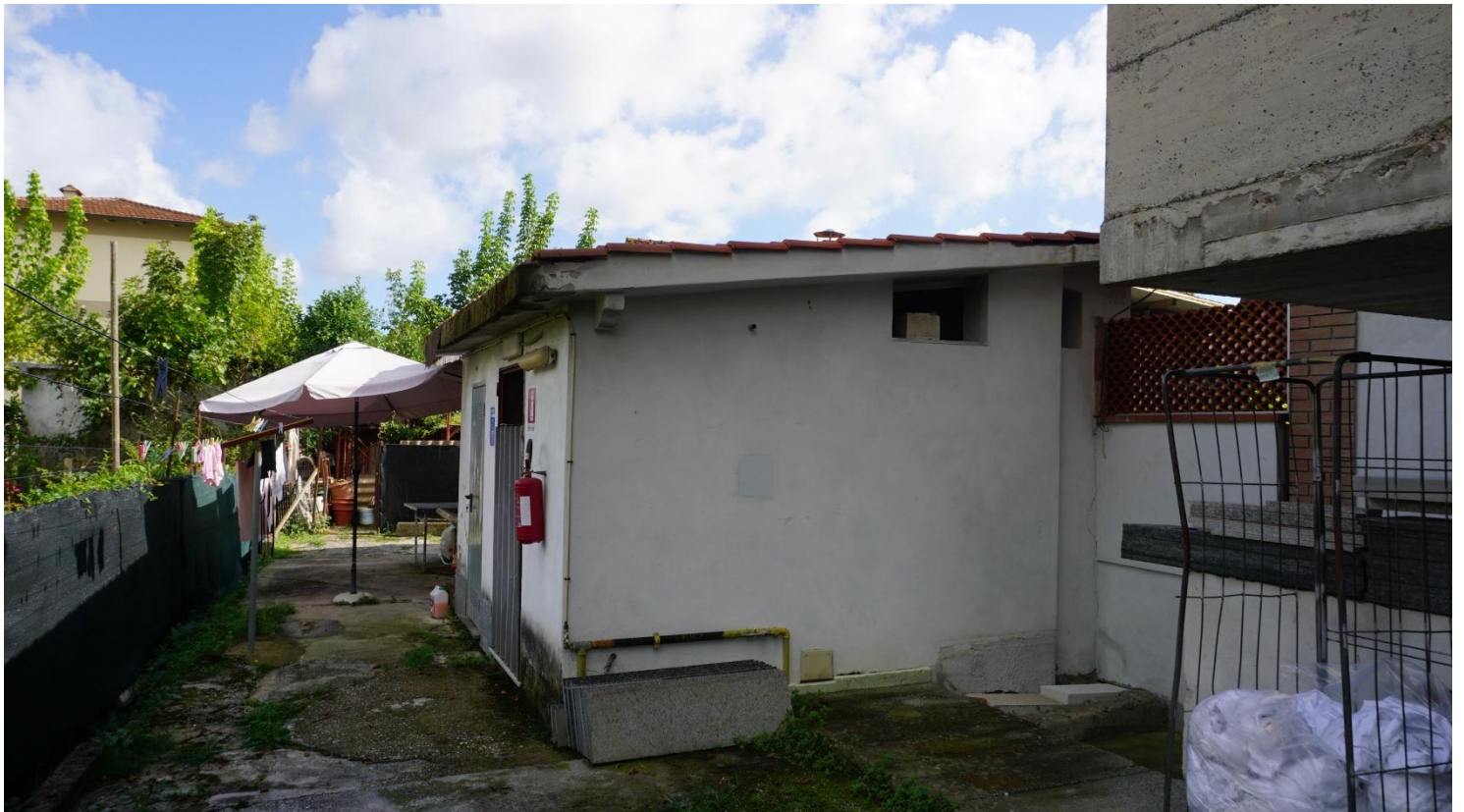
Figura 30 – Locale Caldaia