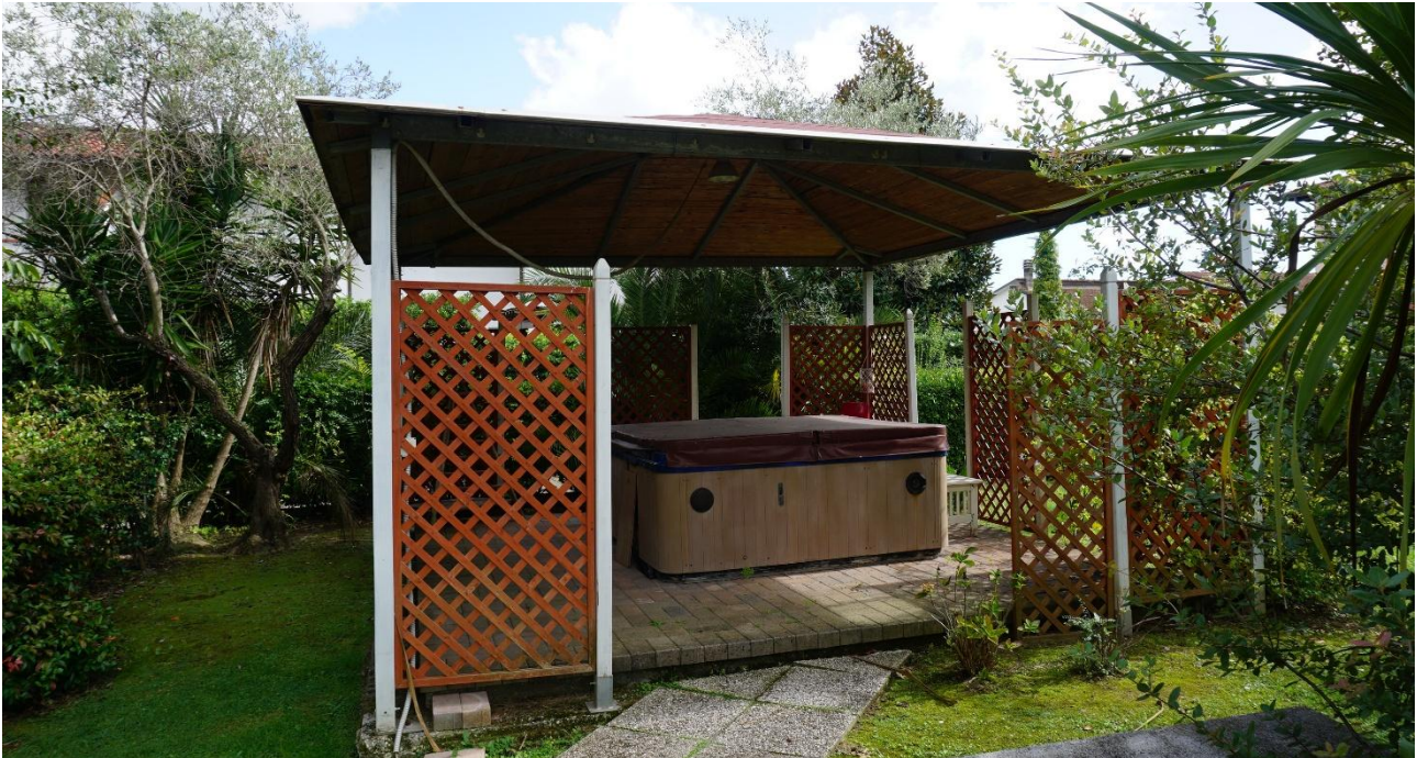
Figura 18 – Gazebo da rimuovere